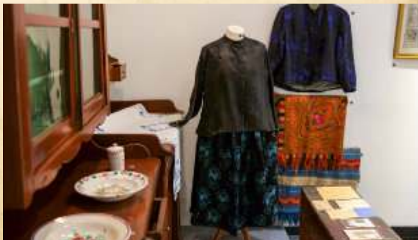
► Fragment wystawy „Zabrzańska Atlantyda. Zaborze Wieś”

Imprezy towarzyszące wystawie: 20 kwietnia: spacer z Zaborza Wsi do kościoła pod wezwaniem św. Jana Chrzciciela w Biskupicach; 3 maja: finisaż wystawy