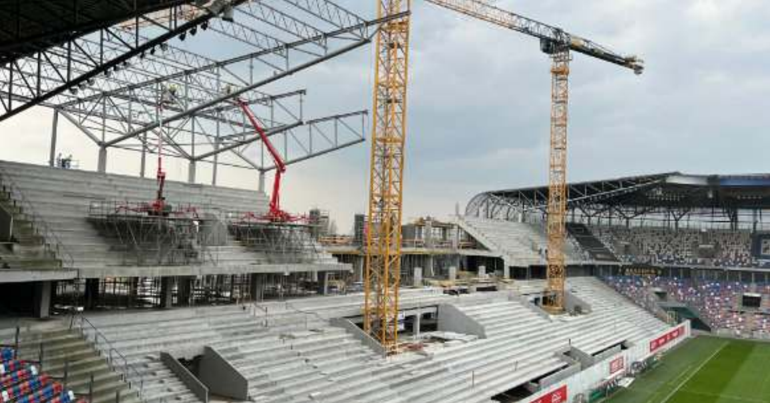
► Na budowie czwartej trybuny Areny Zabrze trwa montaż elementów zadaszenia

CORAZ BLIŻEJ DOKOŃCZENIA BUDOWY ARENY ZABRZE I ZMIAN WŁAŚCICIELSKICH