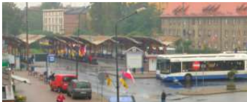
► Przez lata na pasażerów czekały tu tylko zwykłe wiaty

Tymczasem trwają prace przy realizacji kolejnego etapu Kolei Metropolitalnej GZM. W efekcie mieszkańcy Zabrze będą mogli wsiąść do pociągu, który zabierze ich prosto na stację Pyrzowice Lotnisko. Wyłonieni już zostali wykonawcy inwestycji polegającej na utworzeniu dwóch przystanków kolejowych na linii Bytom-Zabrze-Gliwice. Pierwszy z nich, Zabrze Północ, znajdować się będzie przy DK88, w miejscu, gdzie zaplanowano kolejne centrum przesiadkowe. To strategiczne miejsce zlokalizowane w rejonie skrzyżowania ulic Mikulczyckiej i Przystankowej. Dzięki temu podróżni będą mieli łatwy dostęp do połączeń kolejowych oraz komunikacji miejskiej, co z pewnością ułatwi im poruszanie się po regio-