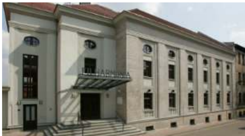
► Siedziba Filharmonii Zabrzańskiej

- Remont kolejnego budynku w Kwartale Sztuki zakończony – uśmiecha się prezydent Zabrze Małgorzata Mańka-Szulik. - To na-