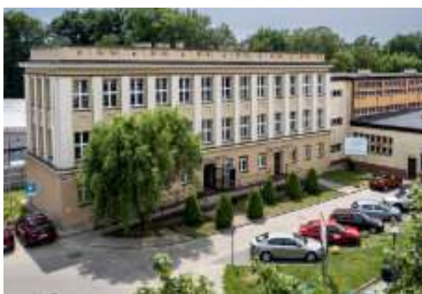
▶ Centrum Kształcenia Praktycznego i Ustawicznego