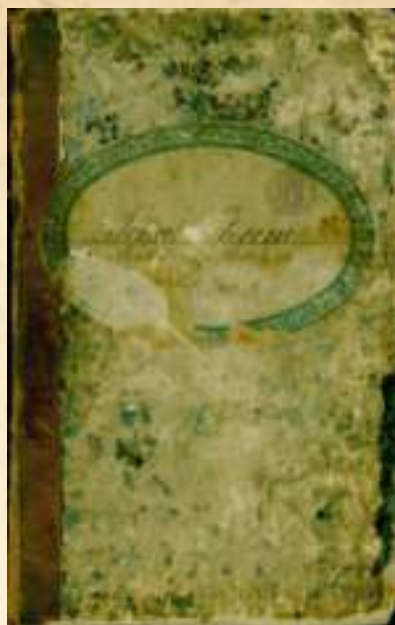
► Kronika powszechnej szkoły katolickiej w Zaborzu Wsi. Obejmuje historię szkoły, od jej powstania w 1862 roku, do czasu połączenia ze szkołą przy obecnej ul. W. Karczewskiego w 1935 roku

wówczas ponad 100 osób, w tym wiele dzieci w wieku szkolnym.