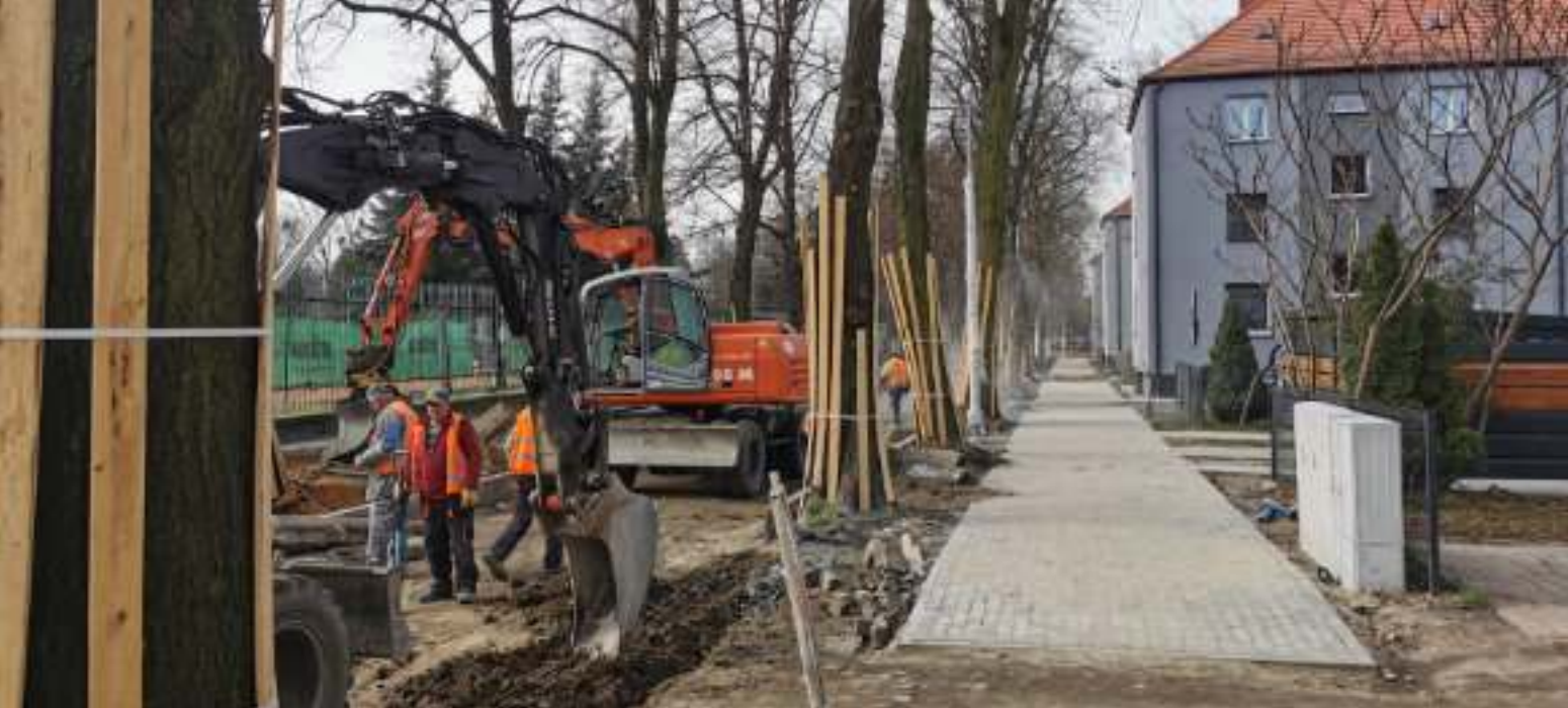
► Remont ul. Chłopskiej prowadzony jest z zachowaniem rosnących wzdłuż drogi drzew