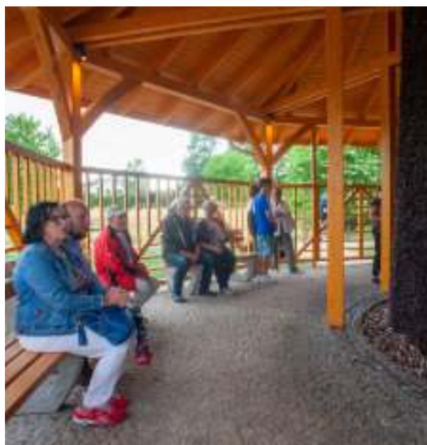
► Jedna z zabrzańskich tężni solankowych