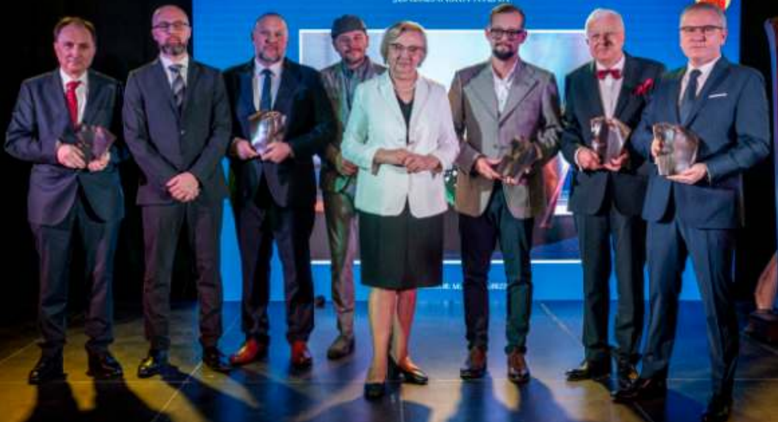
► Tegoroczni laureaci z prezydent Zabrza Małgorzatą Mańką-Szulik.

JUŻ PO RAZ TRZYNAŚTY WRĘCZONE ZOSTAŁY „ZABRZAŃSKIE ATENY”