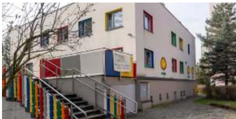
► Przedszkole nr 23

Łącznie na remonty szkół i przedszkoli przeznaczono w ostatnich latach ponad 100 mln zł. W objętych programem termomodernizacji placówkach wymieniane są okna i drzwi, pojawiają się nowe instalacje centralnego ogrzewania, docieplane są ściany zewnętrzne i stropy. Dzięki wykonanym pracom koszty utrzymania budynków spadają średnio o jedną trzecią, a szkoły i przedszkola zyskują na estetyce. Równie ważny jest efekt ekologiczny w postaci wyraźnego zmniejszenia ilości emitowanych do atmosfery zanieczyszczeń. GOR