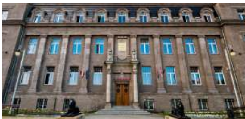
► Ratusz przy ul. Religi