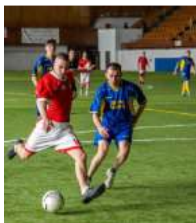
► Turniej piłkarski dedykowany pamięci prof. Mariana Zembali

Na przestrzeni lat prof. Marina Zembala był m.in. krajowym konsultantem w dziedzinie kardiochirurgii, ministrem zdrowia, prezydentem Europejskiego Towarzystwa Kardio-