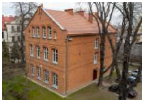
▶ Przedszkole nr 7