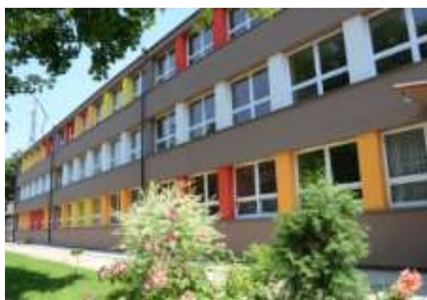
▶ Szkoła Podstawowa nr 43