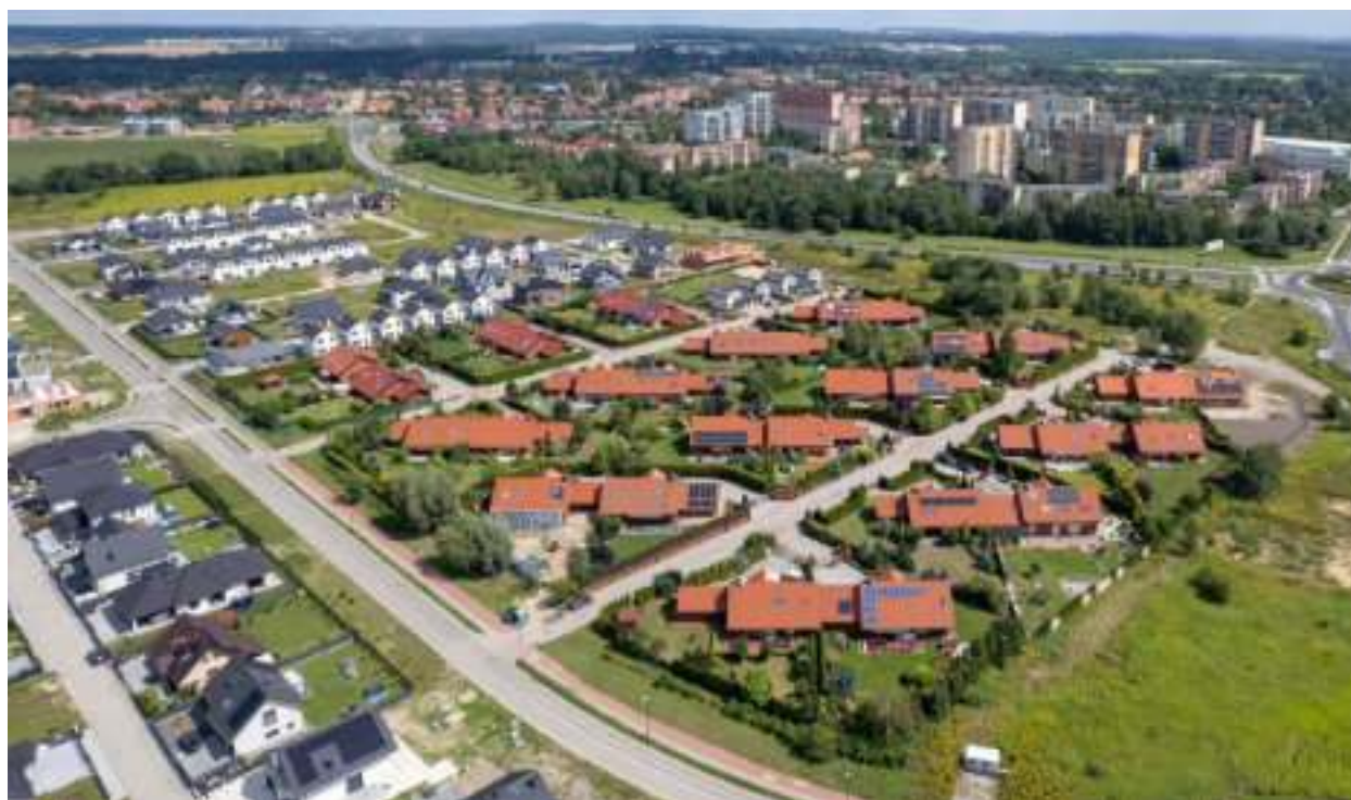
► Kolejne domy powstają na osiedlu Słoneczna Dolina