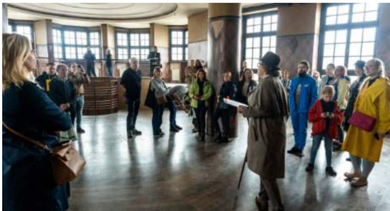
► Każda możliwość zwiedzania historycznych wnętrz cieszyła się ogromnym zainteresowaniem