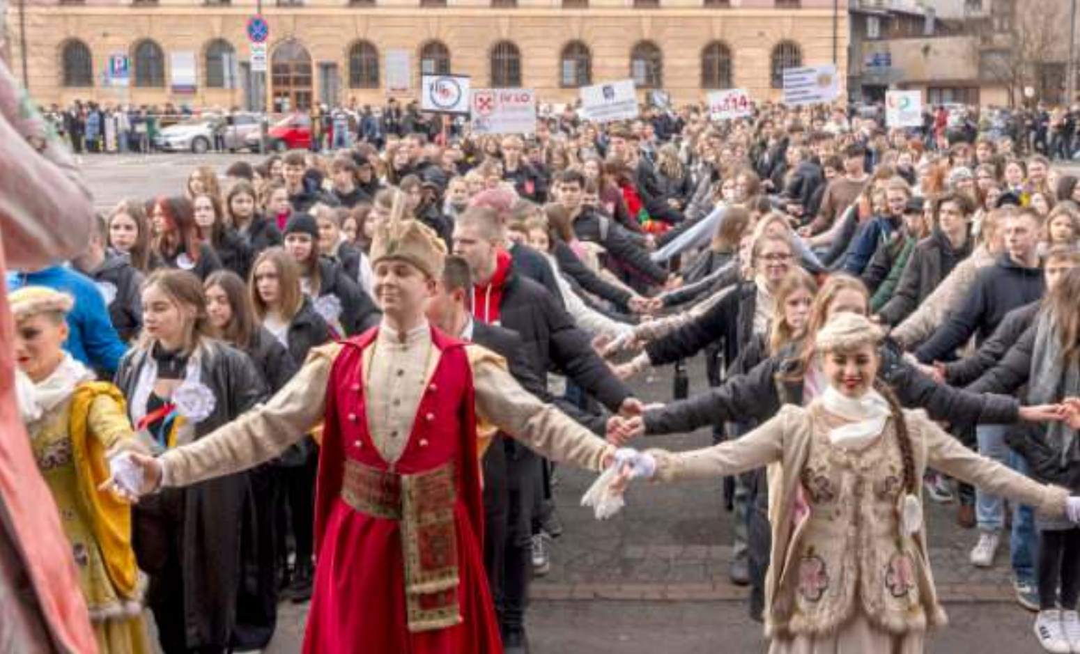
► Plac Warszawski gości co roku maturzystów tańczących tradycyjnego poloneza

URBANIŚCI, ARCHITEKCI I PRZEDSIĘBIORCY ROZMAWIALI NA TEMAT ZAGOSPODAROWANIA