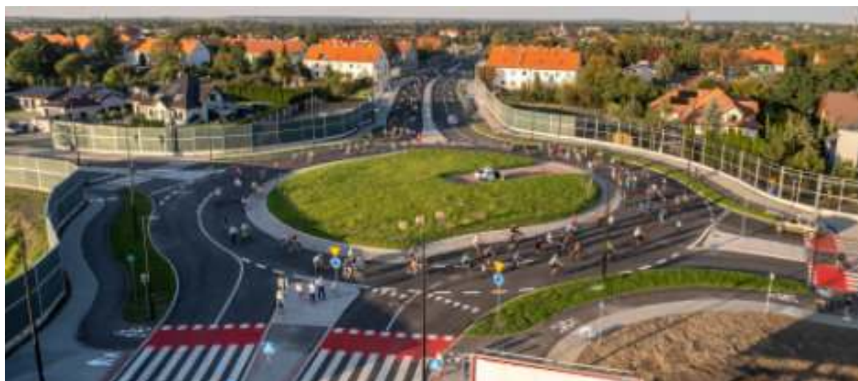
► Wybudowane w ramach przedłużenia alei Korfanteo rondo