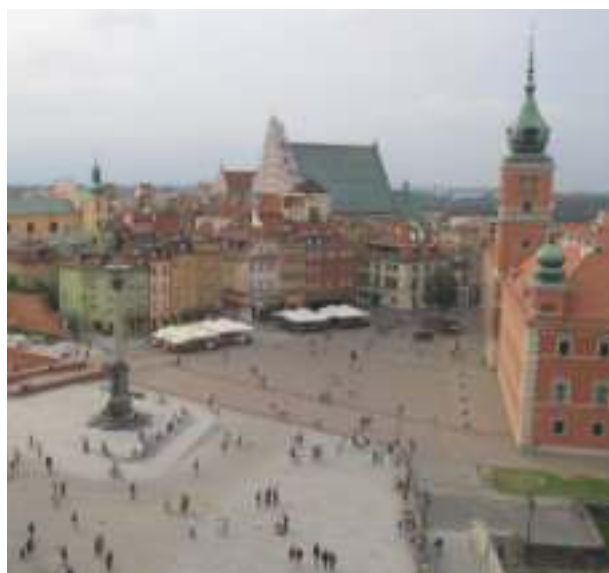
► Stare Miasto w Warszawie