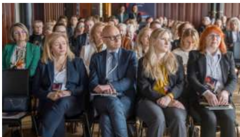
► Podsumowująca projekt konferencja

- Pozyskane przez nas środki norweskie pozwoliły na przeprowadzenie kolejnych ważnych projektów. Zabrze mogą korzystać z pierwszych w mieście tężni solankowych. A już niebawem swoje nowe oblicze zaprezentuje Park Hutniczy, w którym do dyspozycji będą między innymi wodny plac za-