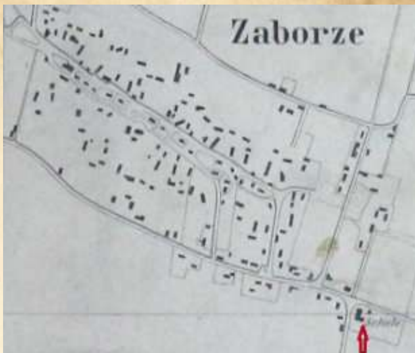
► Katolicka szkoła powszechna w Zaborzu Wsi zaznaczona na planie (fragment) z 1880 roku