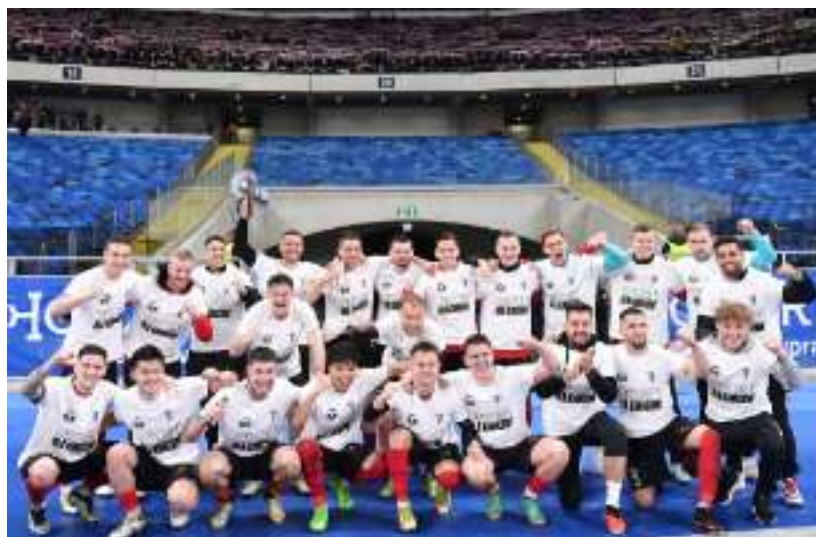
▶ Drużyna Górnika po wygranych Wielkich Derbach Śląska