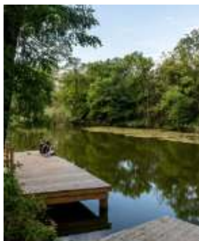
► Geopark w Grzybowicach

Otwarty w ubiegłym roku Geopark to kompleks rekreacyjny stworzony w miejscu dawnego wyrobiska gliny w rejonie ulic Na Lesie i Przy Ujęciu. Na realizację wartego