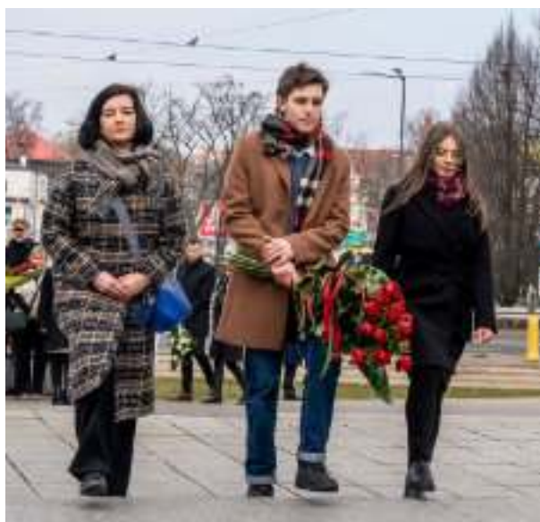
► Przedstawiciele I LO im. prof. Zbigniewa Religi

ODDALIŚMY HOŁD ZMARŁEMU 15 LAT TEMU PROF. ZBIGNIEWOWI RELIDZE