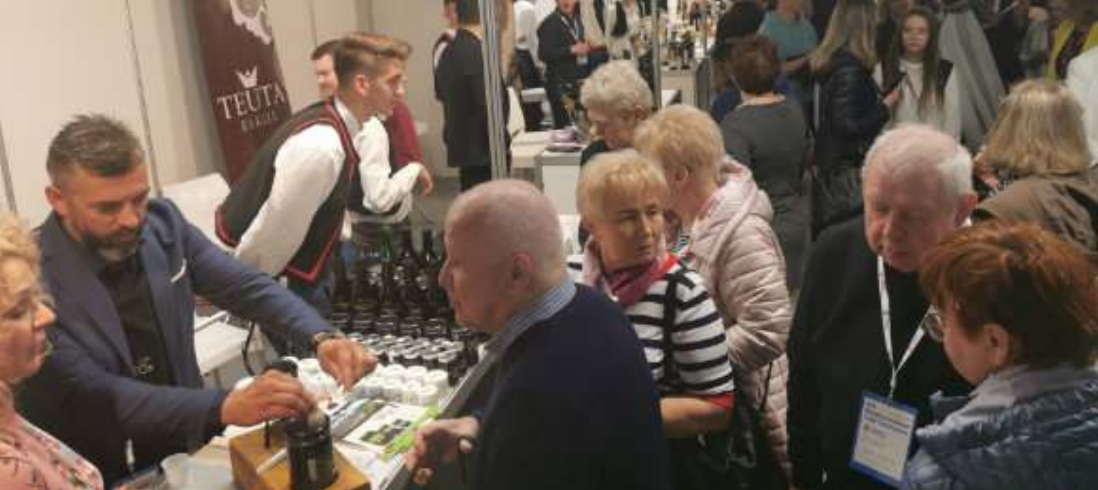
► Targowe stoiska co roku cieszą się ogromnym zainteresowaniem

WYJĄTKOWE PROPOZYCJE NA URLOP LUB WEEKENDOWY WYPAD