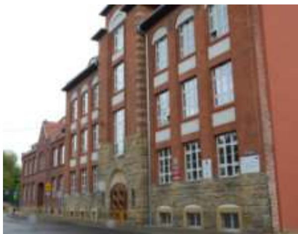
► Zespół Szkolno-Przedszkolny nr 16