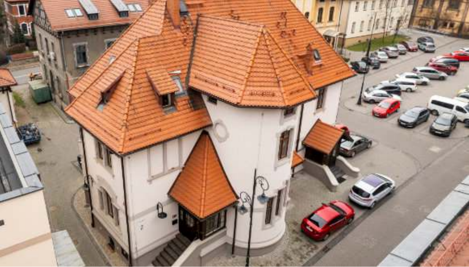
► Budynek administracji Teatru Nowego to kolejny odrestaurowany obiekt w Kwartale Sztuki