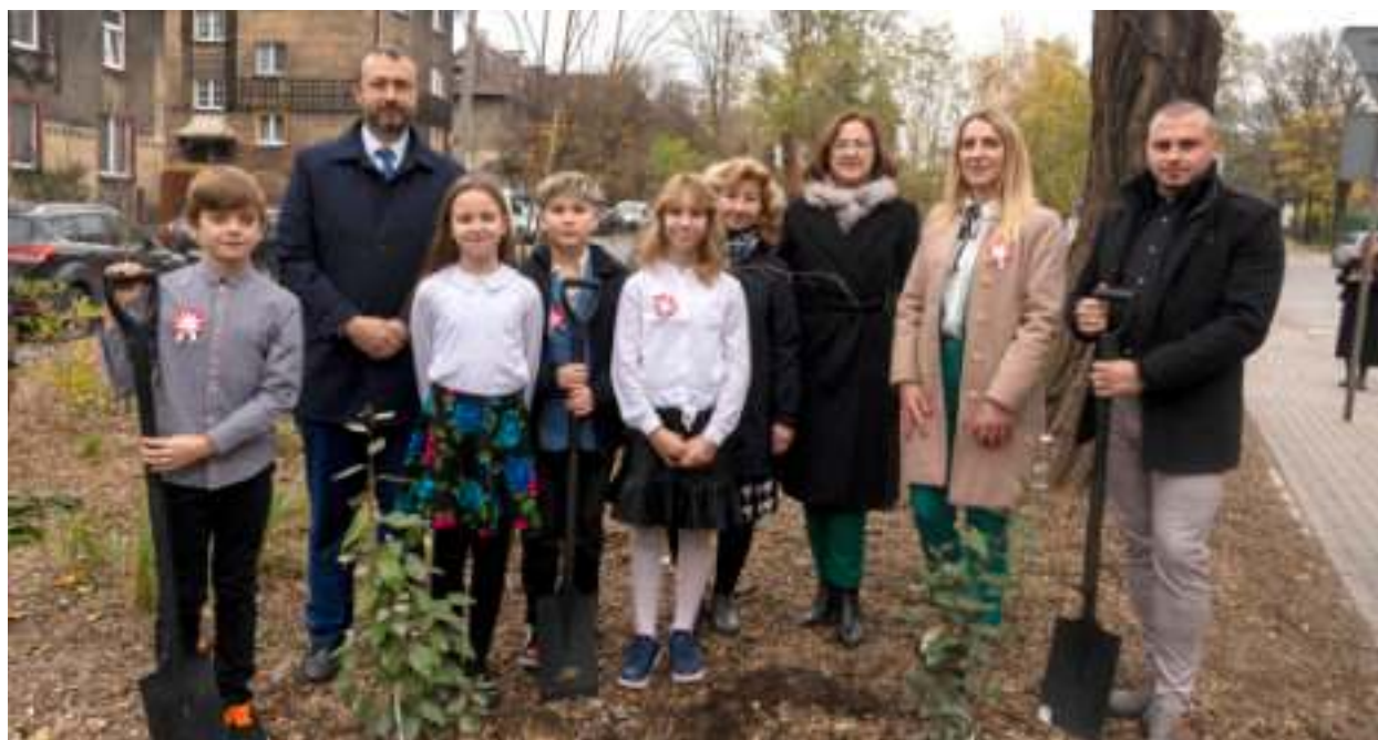
► Przy wsparciu Wojewódzkiego Funduszu Ochrony Środowiska i Gospodarki Wodnej miasto przygotowało dla mieszkańców Zandki skwer