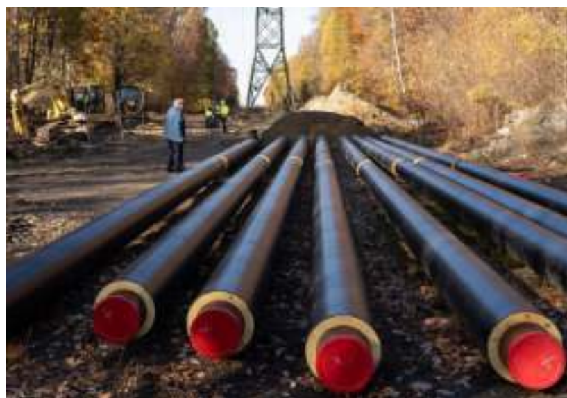
► Budowa sieci ciepłowniczej w Rokitnicy i Helence