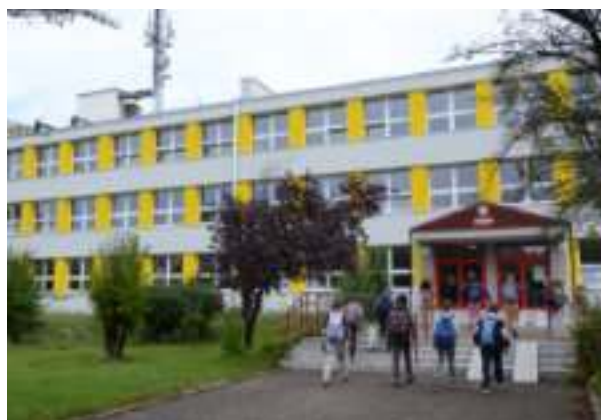
▶ Szkoła Podstawowa nr 18