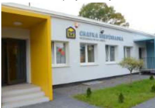
▶ Przedszkole nr 6