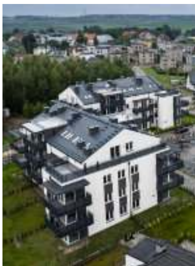
► Osiedle w Grzybowicach