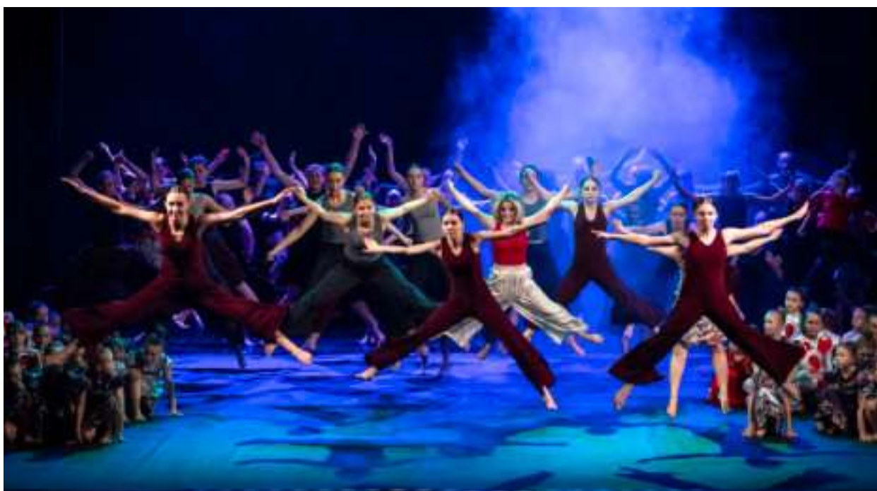
► Pokaz tanecznych umiejętności

Na scenie pojawił się w 1984 roku, a już rok później znalazł się w gronie najlepszych dziecięcych zespołów tanecznych Śląska. Jubileusz grupy „Mak” był również okazją do wspomnienia prowadzących przez lata grupę śp. Małgorzaty i Janusza Makowskich.