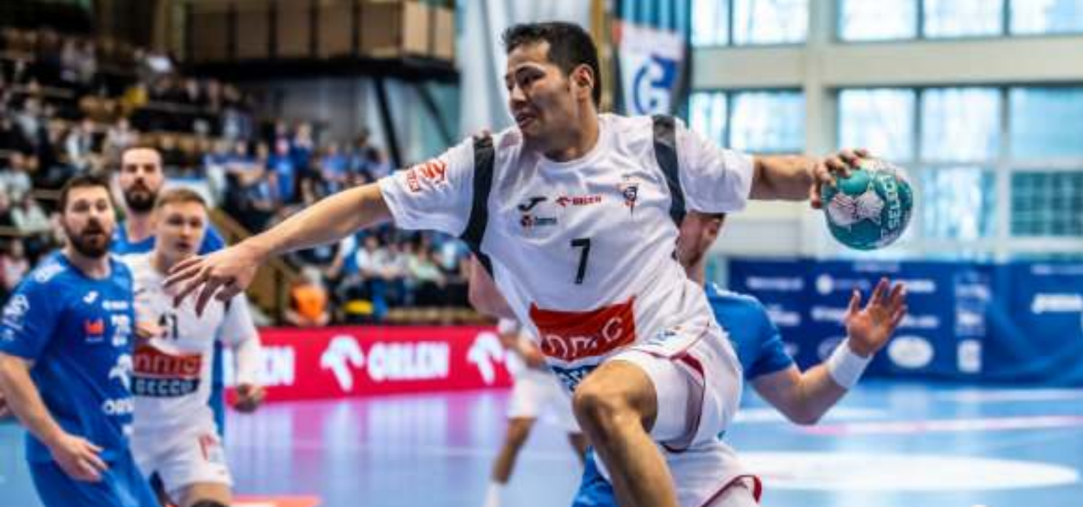
► Emocjonujące starcie z Orlen Wisłą Płock

PRZED NAMI NAJBARDZIEJ ELEKTRYZUJĄCY ETAP RYWALIZACJI