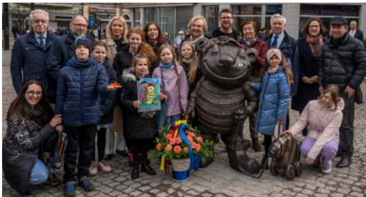
► Pamiątkowa fotografia przy Tygrysku