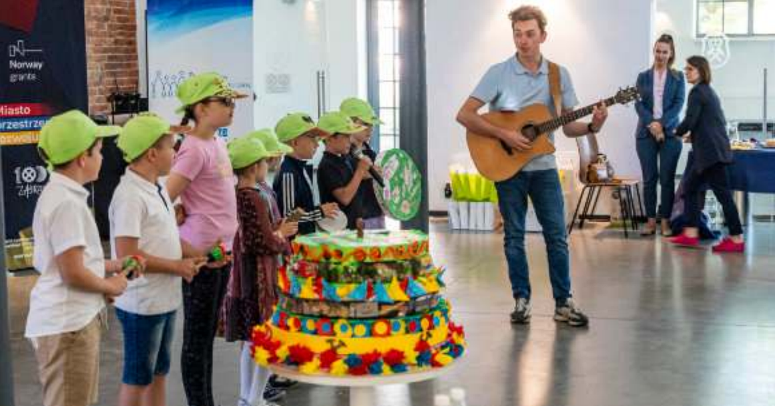
► Uczestnicy zorganizowanych w ramach projektu półkolonii

DOBIEGA KOŃCA REALIZACJA PROJEKTU „MIASTO PRZESTRZENIĄ ROZWOJU”