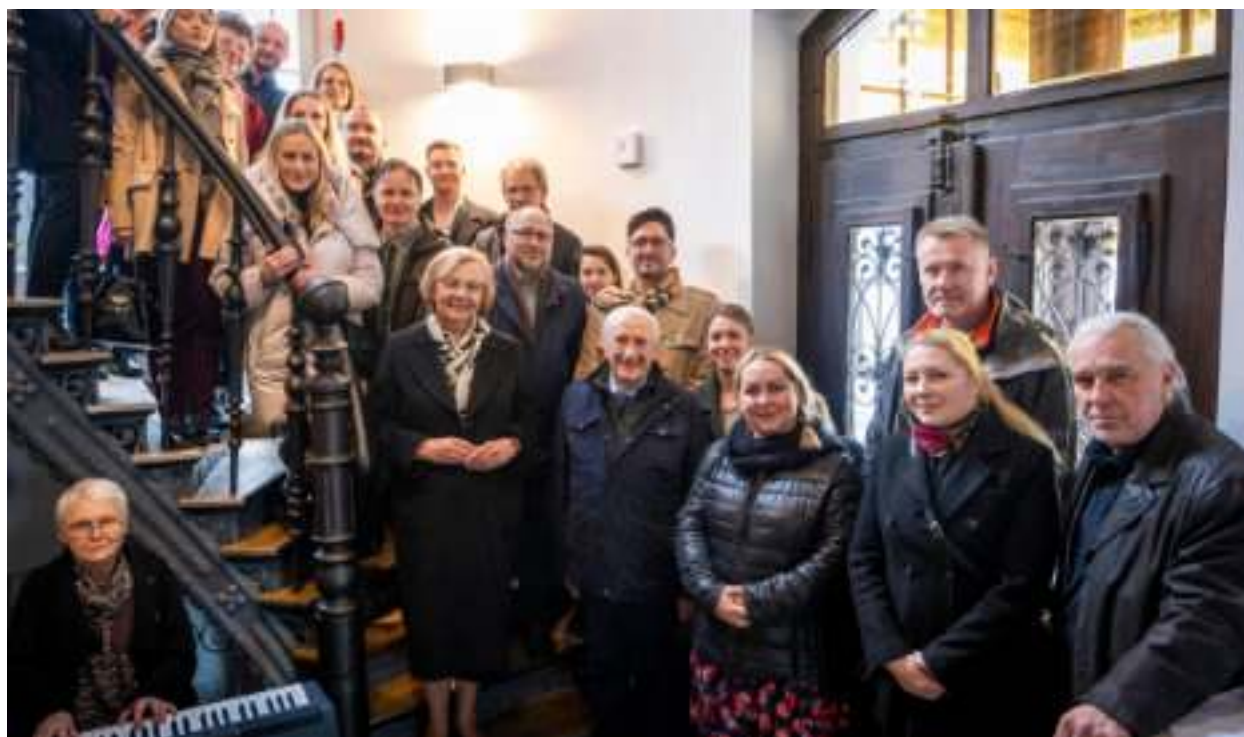
► Goście uroczystości podziwiali m.in. pieczołowicie odrestaurowaną klatkę schodową budynku