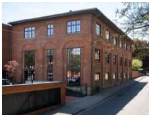
► Centrum Usług Społecznych w budynku dawnej gazowni