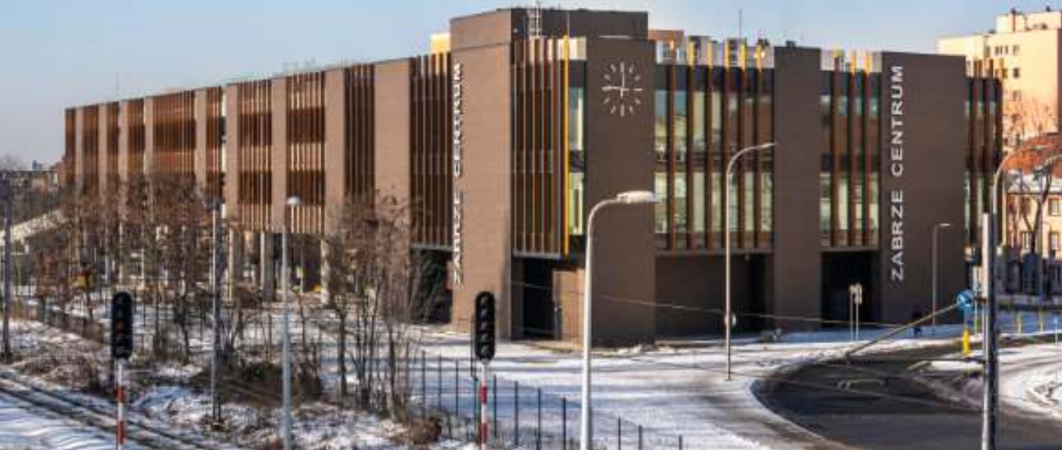
► Centrum przesiadkowe przy ul. Goethego