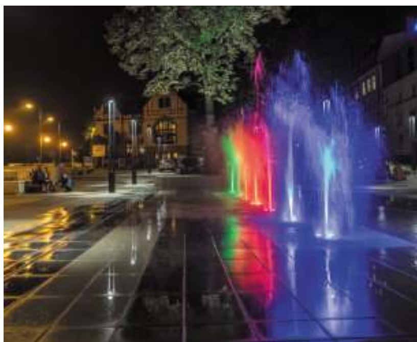
► Efektowna fontanna na pobliskim placu Teatralnym

m.in. wodny plac zabaw, skatepark, boisko, miejsca do grillowania oraz alejki do spacerów. Wartość projektu to prawie 9 mln zł. GOR