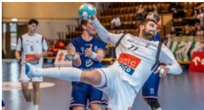
► Mecze w Pucharze Polski z Energą MKS Kalisz