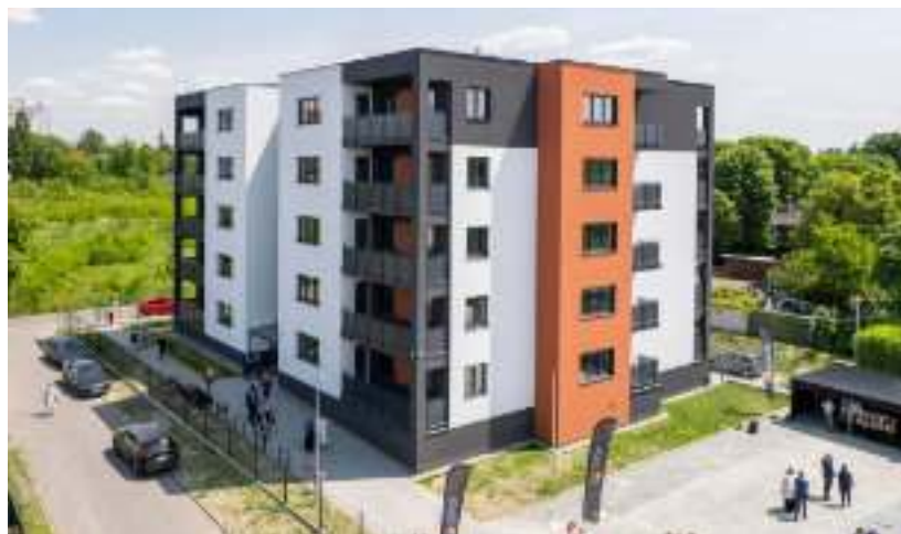
► Blok ZBM-TBS przy ul. Żeromskiego