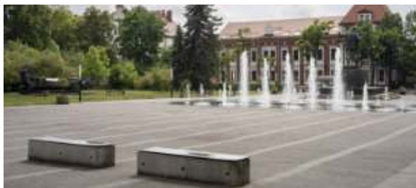
► Skwer z pomnikiem Braci Górniczkiej