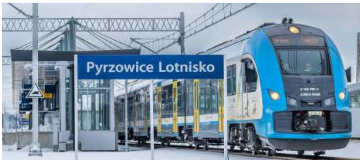
► Już niebawem będzie można dojechać pociągiem z Zabrza do Pyrzowic

nie. Drugim przystankiem będzie Zabrze Maciejów, ulokowany przy ul. Wolności, w okolicach stacji BP. To także dogodna lokalizacja, która umożliwi mieszkańcom szybki dostęp do kolejowych połączeń, bez konieczności długich przejazdów czy dojazdów. W czerwcu rozpoczną się prace, by inwestycja mogła zostać przekazana mieszkańcom do końca tego roku.