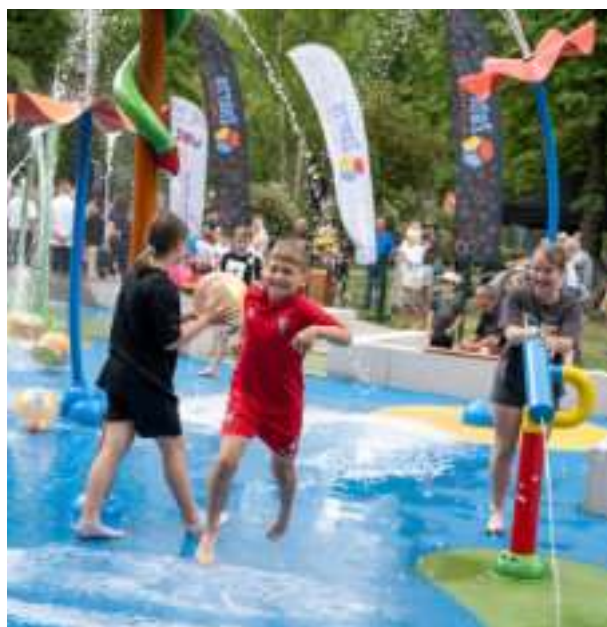
► Wodny plac zabaw na osiedlu Janek