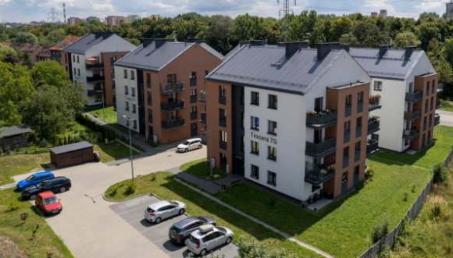
► Osiedle wybudowane przez spółkę ZBM-TBS przy ul. Trocera

MIASTO REALIZUJE ZARÓWNO WŁASNE INWESTYCJE, JAK I WSPIERA DEWELOPE