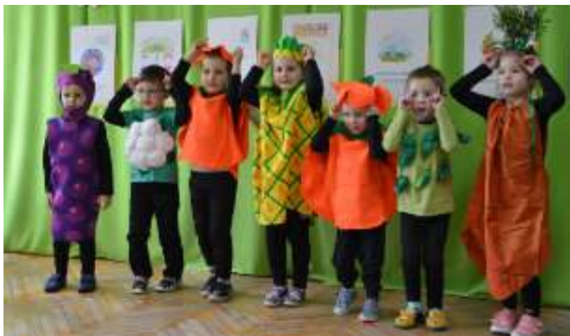
► Przygotowane przez dzieci przedstawienie