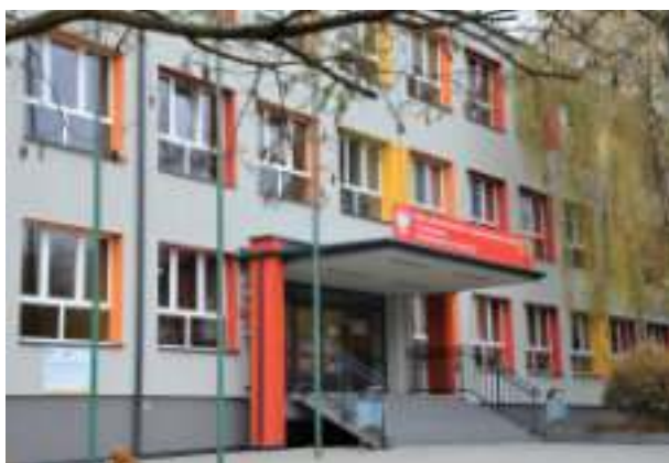
▶ Zespół Szkół Mechaniczno-Samochodowych