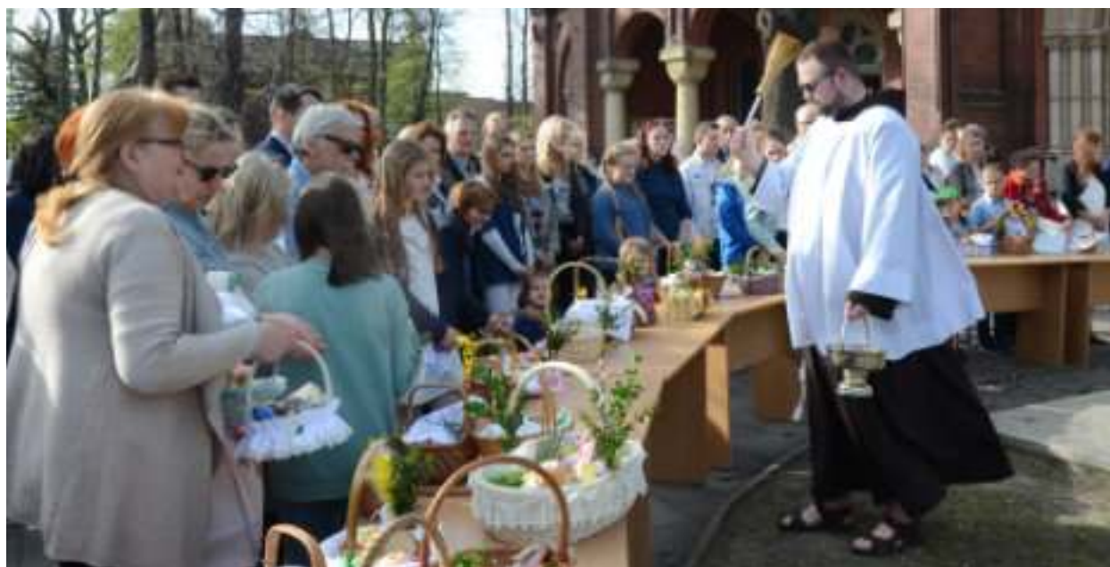
► Święcenie pokarmów w Wielką Sobotę