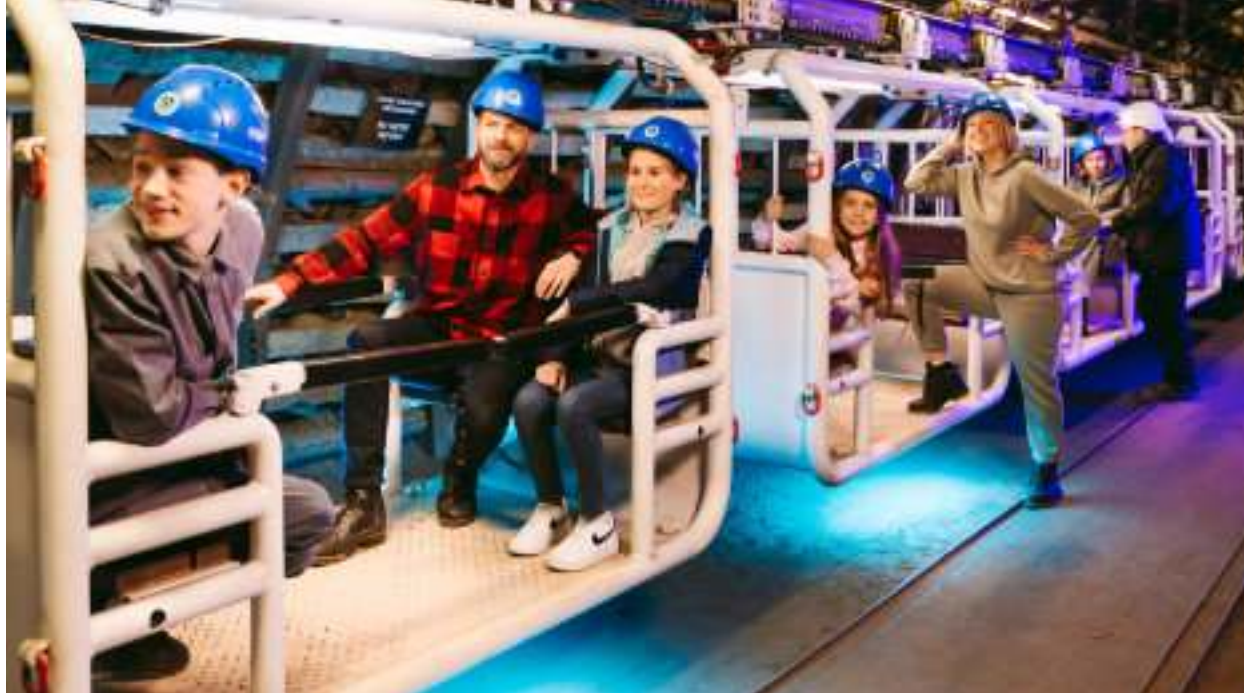
► W Zabrzu turyści mają okazję przejechać się wyjątkową podwieszaną kolejką