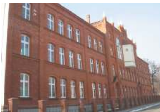
▶ III Liceum Ogólnokształcące