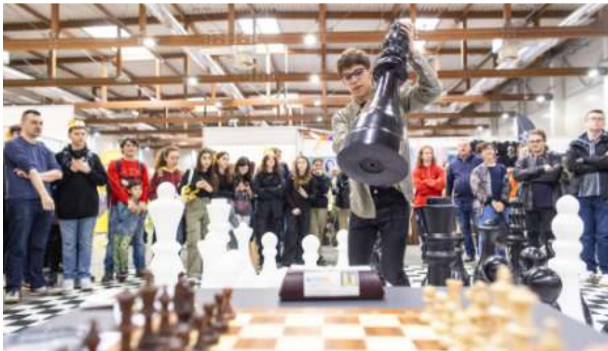
► W imprezie uczestniczył nasz szachowy mistrz świata Jakub Seemann

Odważni mogli się zmierzyć z naszym mistrzem świata w szachach Jakubem Seemannem. Furorę robiła zabrzańska wersja Monopoly. Miejska Biblioteka Publiczna w Zabrzu była jednym z wystawców na Festiwalu i Targach Gier Planszowych BookGame w Krakowie.