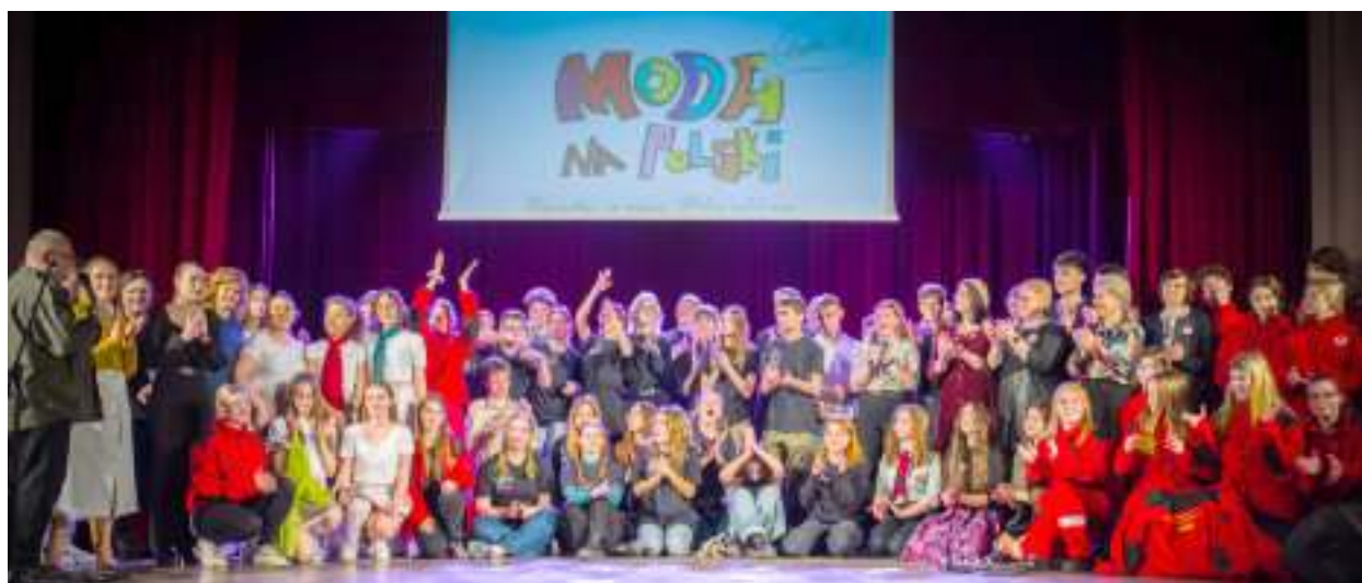
► Uczestnicy wydarzenia na scenie Miejskiego Ośrodka Kultury

Do tematyki związanej z harcerstwem nawiązywała jubileuszowa, 15. już edycja „Mody na polski”. Na scenie Miejskiego Ośrodka Kultury wystąpili m.in. uczniowie IV Liceum Ogólnokształcącego, które od lat koordynuje akcję.