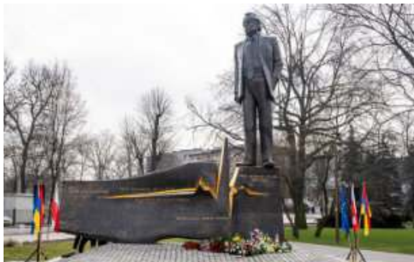
► Pomnik prof. Zbigniewa Religi na skwerze obok ratusza