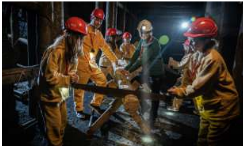
► Podziemna szczyta w Kopalni Guido

Co roku Zabrze gości kraj lub region, który jest partnerem targów. Wśród dotychczasowych partnerów imprezy znalazła się m.in. Kolumbia, Francja, Peru, Grecja, Chorwacja oraz Bośnia i Hercegowina. W tym