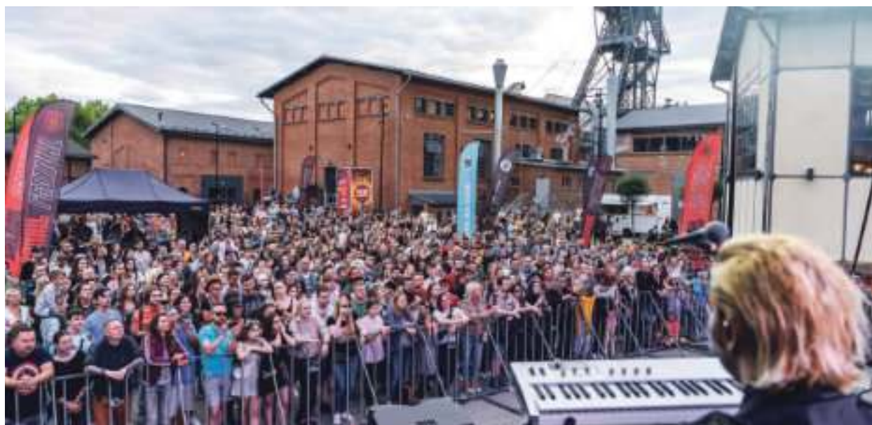
► Naziemna część kompleksu Sztolnia Królowa Luiza to m.in. miejsce przyciągających tłumy koncertów