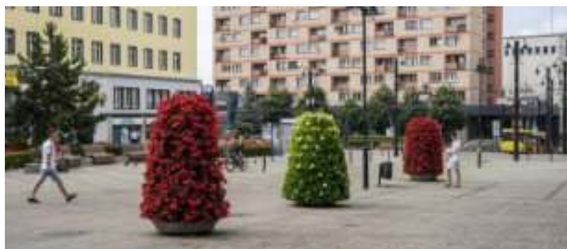
► Plac Wolności