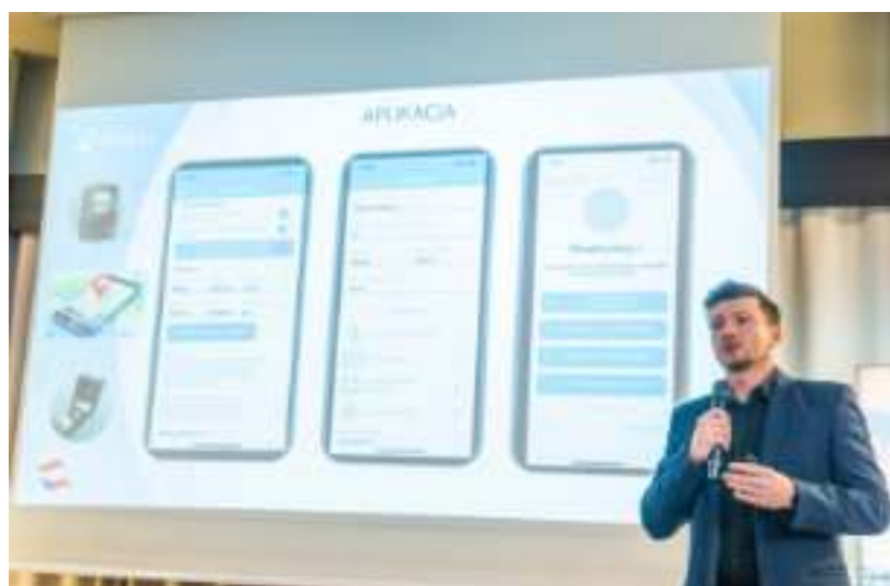
► Jubileuszowa edycja konferencji MedTech Meetup

nauki w zakresie start-upów opartych o innowacyjne technologie w obszarach m.in. zdrowia i medycyny. Do tej pory realizowane przez nas w ramach koncepcji „Zabrzańskie Doliny Medycznej” spotkania zgromadziły już ponad 1,5 tysiąca uczestników i ponad stu prelegentów – podsumowuje prezydent Zabrze Małgorzata Mańka-Szulik. GOR