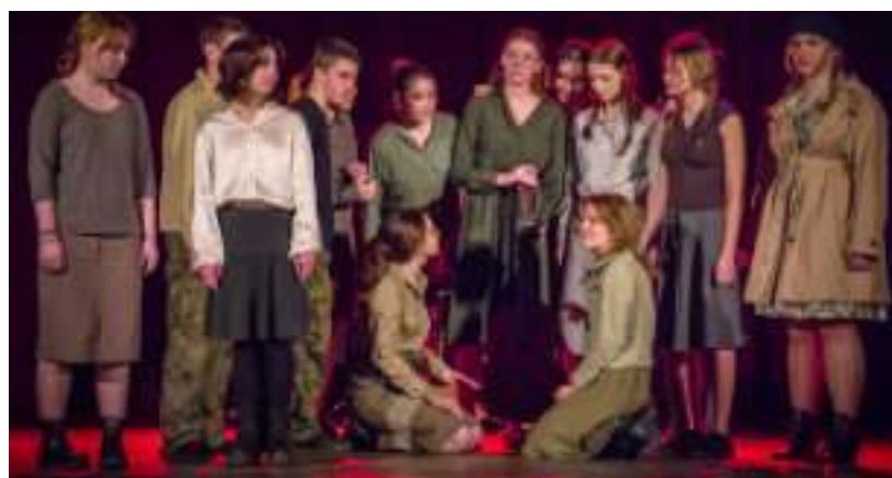
► Tegorocznej „Modzie na polski” towarzyszyły klimaty harcerskie