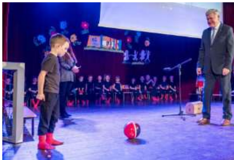
► Mali piłkarze mogli potrenować z legendarnym napastnikiem