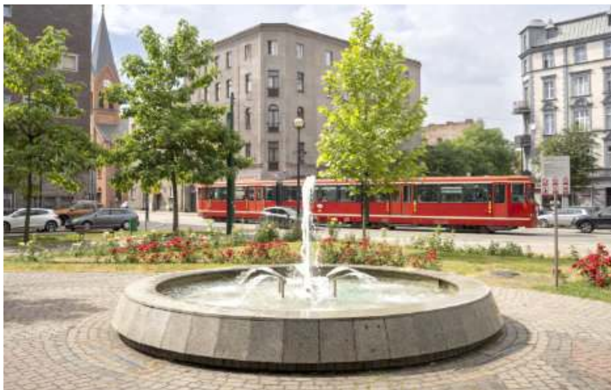
► Plac Krakowski