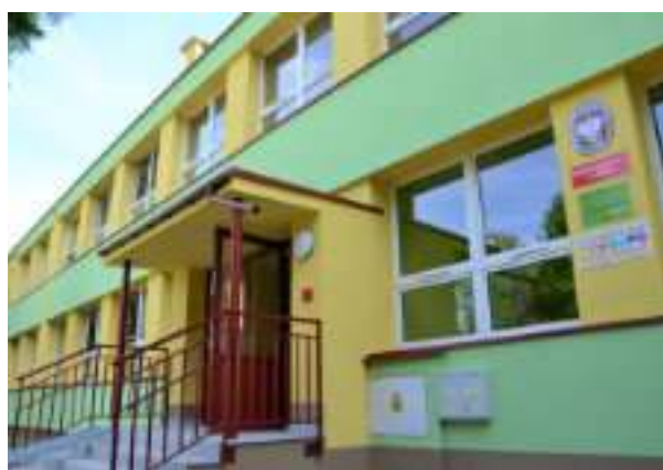
▶ Przedszkole nr 11