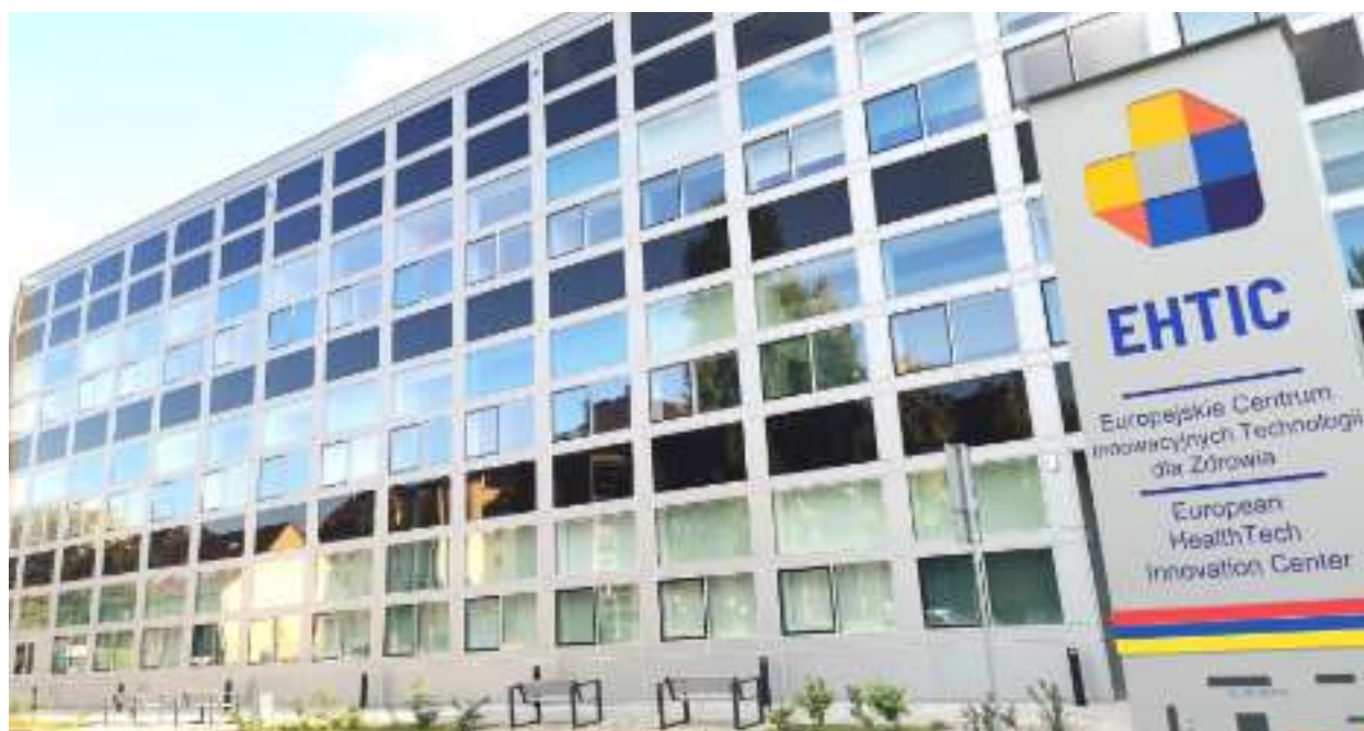
► Europejskie Centrum Innowacyjnych Technologii dla Zdrowia