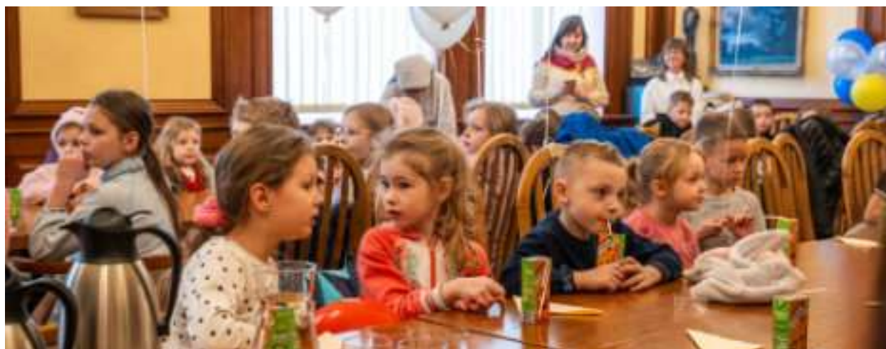
► Maluchy odwiedziły zabrzański ratusz