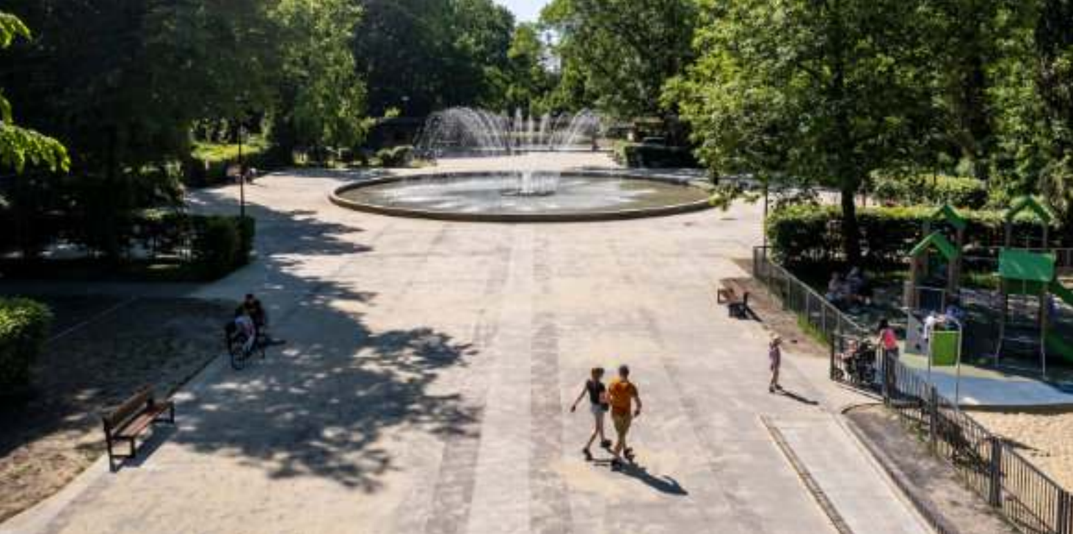
► W parku przy ul. Dubiela odtworzona została fontanna

W ZABRZU PRZYBYWA ATRAKCYJNYCH TERENÓW I OBIEKTÓW SŁUŻĄCYCH REKREACJI