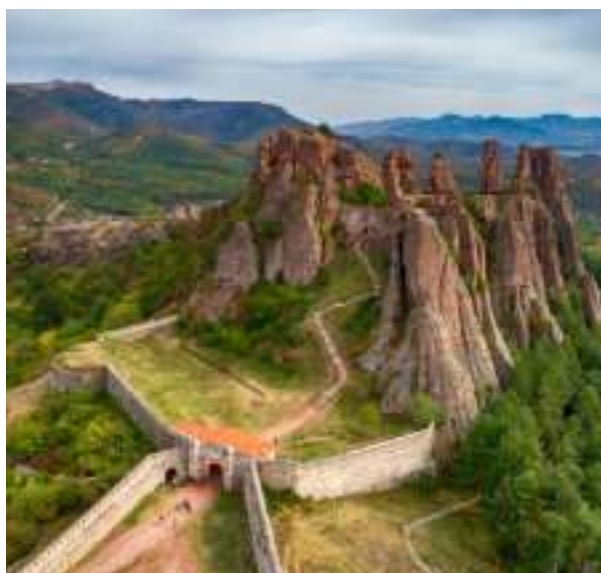
► Zachwycające widoki w Bułgarii