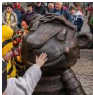
► Tygrysek to postać uwielbiana przez dzieci

ne. Nasza praca polegała między innymi na tym, żeby z tych ilustracji wyciągnąć wspólny mianownik i stworzyć postać, która będzie jednoznacznie identyfikowana, a zarazem fajnie zaprezentuje się w mieście – dodaje.