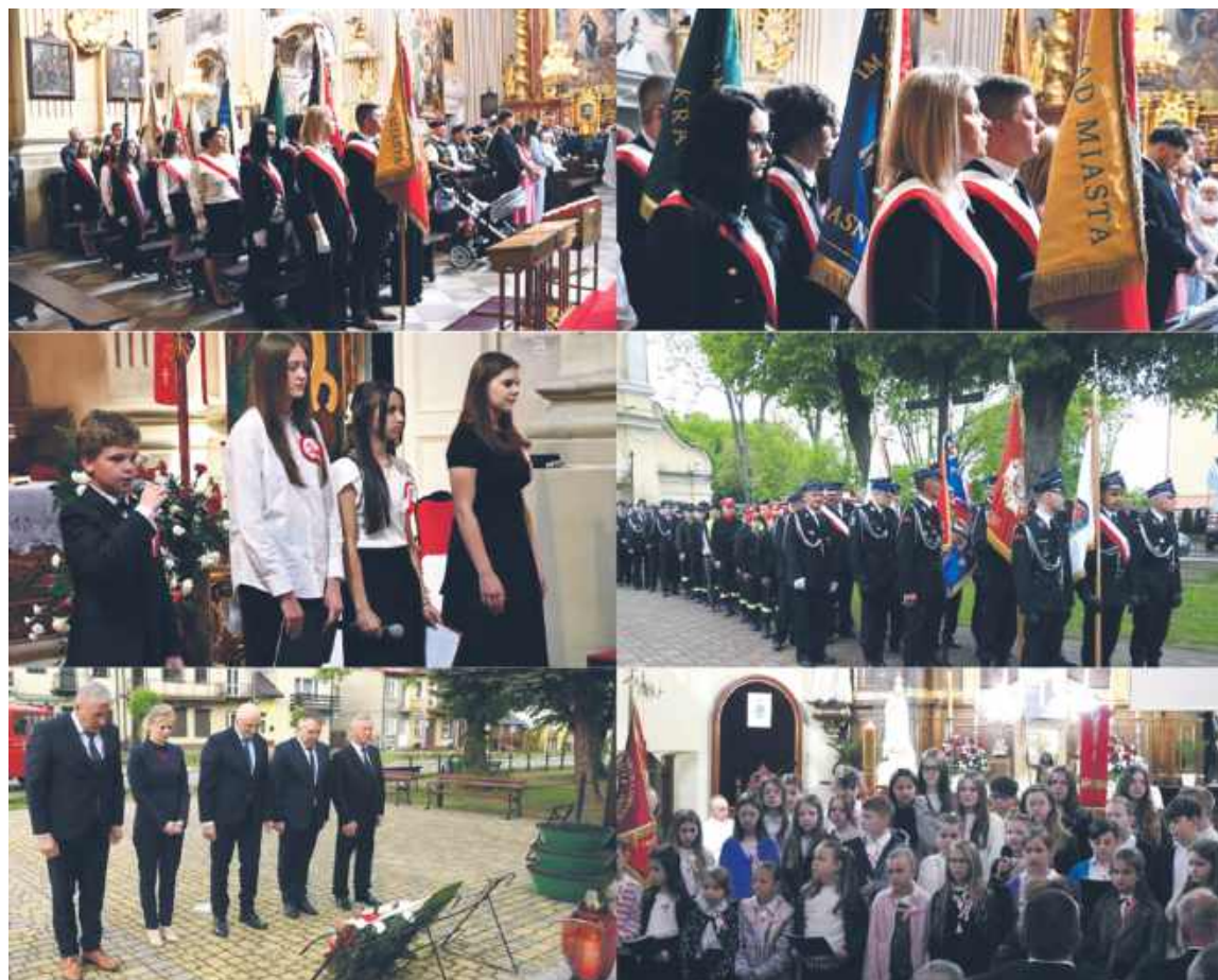
Tak świętowaliśmy 234. rocznicę uchwalenia Konstytucji 3 Maja Na zdjęciach uroczystości w Krasnymstawie i Izbicy