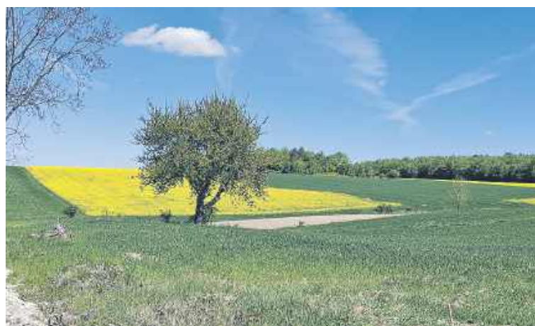
Kompostownia miała stanąć w tym miejscu

- Brak zgody na tę inwestycję jest oznaką dojrzałości i głębokiej mądrości lokalnej społeczności, która wie, że tutaj, w dzikich Kraszczadach cenniejsze od pieniędzy za wszelką cenę jest przyszłość kolejnych pokoleń - mówi nasza rozmówczyni. - Na skrajny absurd zakrawa próba składowania i przetwarzania odpadów w regionie,