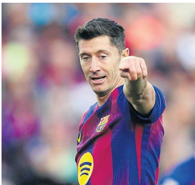
Kapitan reprezentacji Polski Robert Lewandowski zdobył jedenastą bramkę w obecnym sezonie La Ligi

W hiszpańskiej La Lidze lider rozgrywek, Barcelona, pokonała na własnym stadionie Vil-