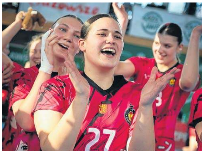
Piłkarki ręczne Korony Handball Kielce wywalczyły brązowy medal Mistrzostw Polski Juniorek

Rywalizację o podium lepiej rozpoczęły zawodniczki z Elbląga. Już w 11. minucie MKS Truso prowadził 5:2, prezentując skuteczną grę w ataku i twardą defensywę. Kielczanki szybko jednak odpowiedziały, doprowadzając do wyrównania. Gdy wydawało się, że przejmują kontrolę, elblążanki ponownie odskoczyły na trzy bramki (22', 7:10) - informuje strona zprp.pl.