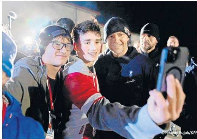
Było wiele pamiątkowych zdjęć z prezydentem Karolem Nawrockim.

W biegu udział wzięło też poseł Marek Suski. ©©