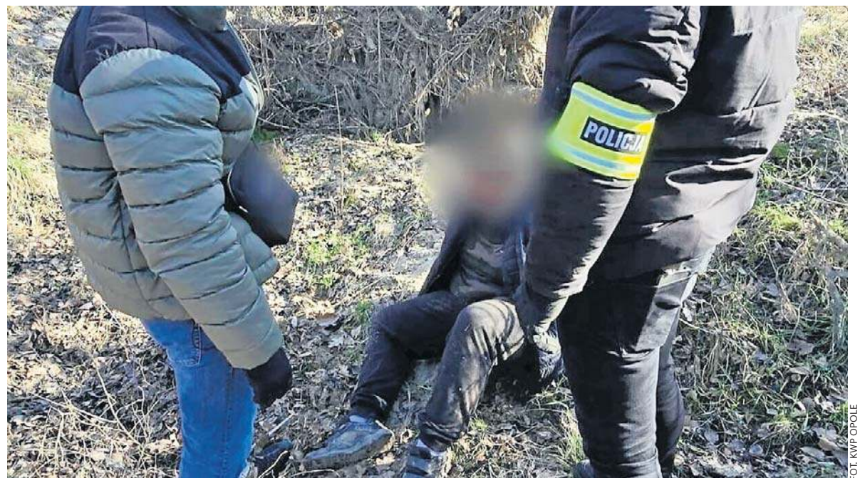
Podjeznanego 17-latkę policjanci zatrzymali blisko 45 kilometrów od miejsca zbrodni

W piątek nastolatek usłyszał zarzuty popełnienia dwóch morderstw dokonanych ze szczególnym okrucieństwem. W sobotę został tymczasowo aresztowany. Może mu grozić nawet 30 lat więzienia.