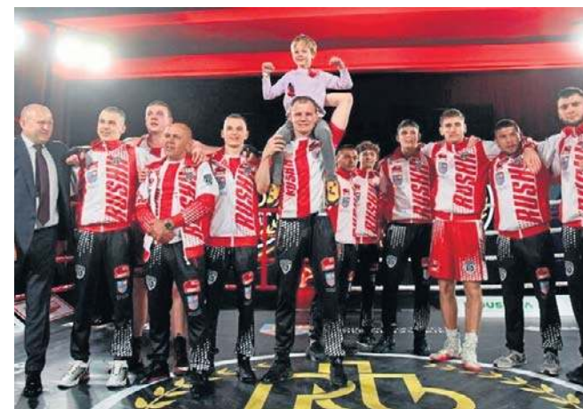
WKB Rushh Kielce w niedzielę, 22 marca, podejmie w hali na Żytniej CKB Potężnie Ciechocinek

Oficjalna inauguracja nastąpi 18 marca spotkaniem Golden Team Nowy Sącz z Concoridią Knurów. Pozostałe mecze pierwszej serii odbędą się 21 marca Królewski Kraków - RKB Wiśłok 1995 Rzeszów i Pomorzanie Boxing Team Toruń - Imperium Boxing Wałbrzych oraz 22 marca WKB Rushh Kielce - CKB Potężnie Ciechocinek.