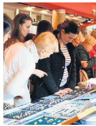
Gięda przyciągnęła wielu miłośników kamieni i biżuterii

W sobotę i niedzielę, w przestrzeni wystawienniczej Kieleckiego Centrum Kultury swoje stoiska rozstawili liczni wystawcy z całej Polski. Na odwiedzających czekały setki okazów minerałów, najróżniejszych skamieniałości, kolekcjonerskich meteorytów oraz bogaty wybór biżuterii, zarówno klasycznej, jak i bardziej artystycznej. Wystawcy chętnie opowiadali o pochodzeniu swoich eksponatów, wyjaśniali proces ich powstawania oraz zdradzali