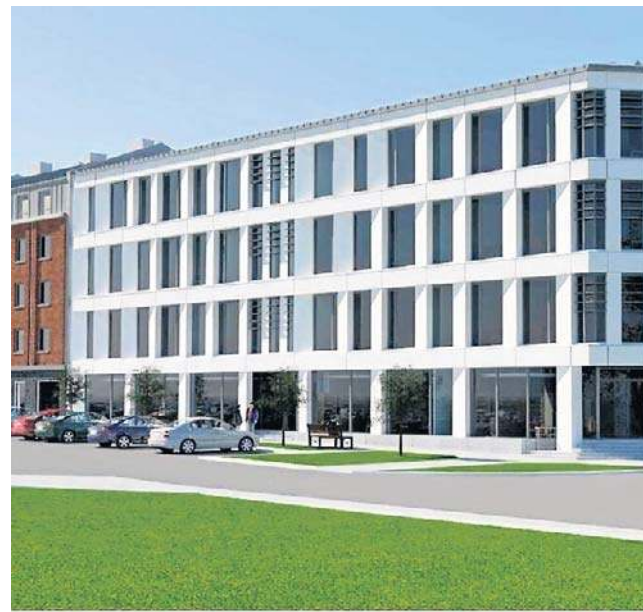
Nowa kamienica przy ulicy Wałowej ma mieć część mieszkaniową, ale też handlowo - usługową.

Nowoczesna kamienica ma stanąć w miejscu dawnego sklepu żelaznego. Kiedyś chodziło się tam po gwoździe, śrubki, łopaty czy kłódki. Od kilku lat budynek stoi pusty i wygląda coraz gorzej.