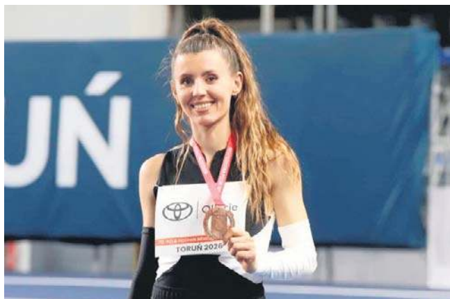
FOT. DAVID LIS

- Kiedyś 7.07 dało mi tutaj rekord świata junierek - przypomina podopieczna trener Iwony