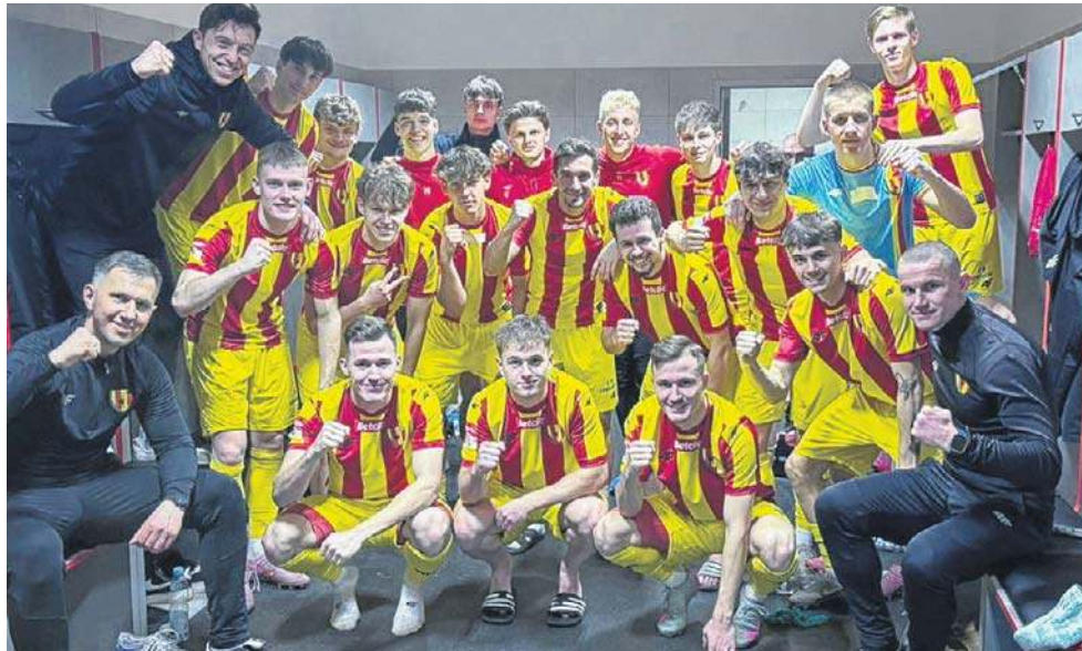
Uśmiechnięci zawodnicy Korony II Kielce po zwycięskim spotkaniu w Betclit 3.lidze