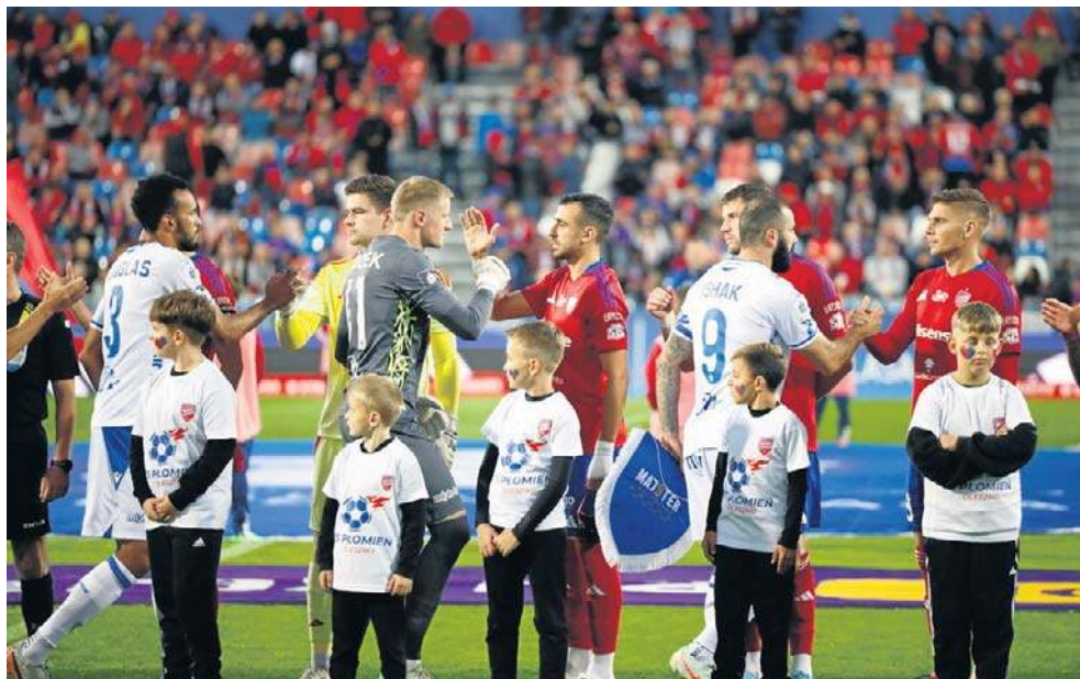
Raków i Lech prezentują odmienne style gry, ale oba zespoły są skuteczne w Europie

Warto odnotować, że jeśli Lech dostałby się do półfinału i osiągnął największy sukces