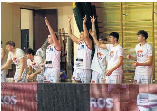
Radość po stronie Hydrotrucku Radom. Drużyna choć nie zachwycała, to wygrała na wyjeździe

Mnóstwo emocji było w samej końcówce. Niespełna cztery minuty przed końcem radomski zespół roztrwoniał przewagę punktową, po czym ponownie wyszedł na prowadzenie. 30 sekund przed końcem przy stanie