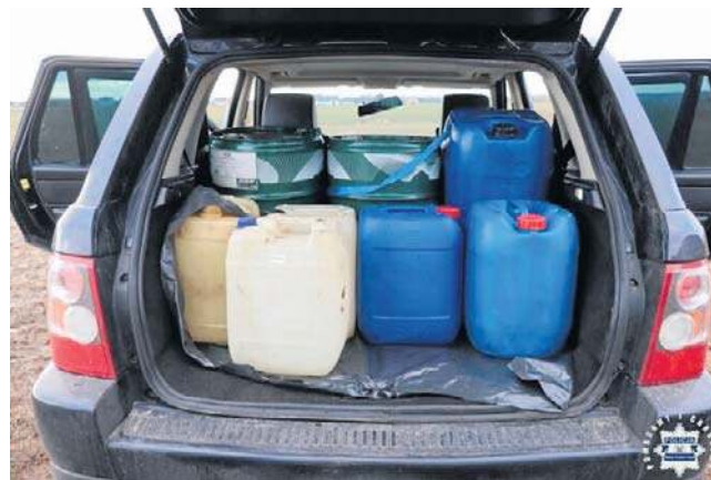
Dwaj mężczyźni podjechali na stację pod Końskimi, zatankowali za około 360 złotych i odjechali nie płacąc

Dwaj mężczyźni podjechali Range Roverem na łódzkich numerach na stację pod Końskimi, zatankowali za około 360 złotych i odjechali nie płacąc. Do takiej sytuacji doszło w środowe popołudnie w zeszłym tygodniu. Personel stacji zaalarmował policjantów. Sygnał trafił do wszystkich radiowozów i auto namierzili w centrum Końskich mundurowi z drogówki. Na widok radiowozu kierowca skręcił