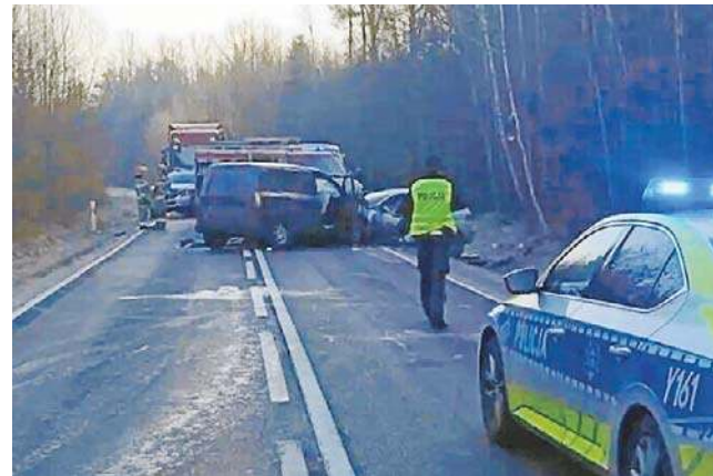
Na miejscu tragicznego zderzenia w Pionkach. Droga przez kilka godzin była zablokowana.

Siła uderzenia była tak duża, że dwie osoby poniosły śmierć na miejscu. Jedna osoba została