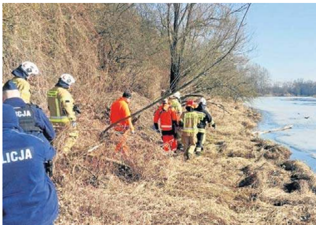
Do miejsca, w którym mężczyzna został odnaleziony, nie dało się podjechać wozem straży czy karetką

Policjanci wykluczyli, by ktoś przyczynił się do powstania obrażeń, jakie miał odnaleziony.