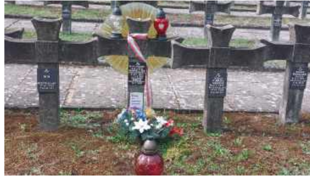
Nimb na krzyżu nagrobnym błogosławionego przypomina wyroby Cepeliady

„W ślad za moją rozmową przeprowadzoną z Panem wicewojewodą na Cmentarzu Mauzoleum w Lesie Palmirskim, ponownie zwracam się z prośbą o spowodowanie uporządkowania cmentarza, a w szczególności o wycięcie krzaków zasłaniających w 80 proc. krzyże / symbol Cmentarza Palmirskiego, niszczące bryłę architektury cmentarza a spełniające rolę śmietnika”.