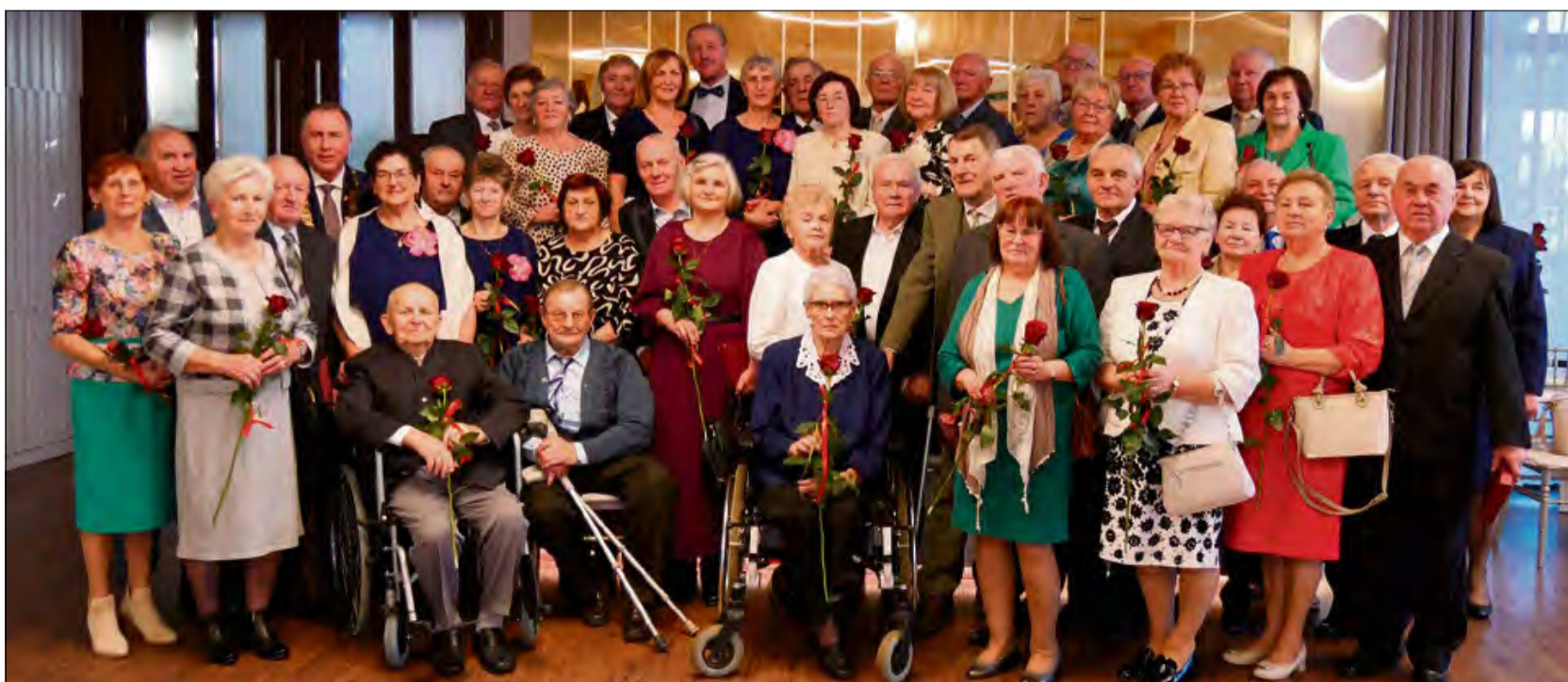
Dwadzieścia dwie pary z terenu gminy Prószków obchodziły złote gody.

Pary obchodzące jubileusz przyznają, że nie ma jednej recepty na udany, wieloletni