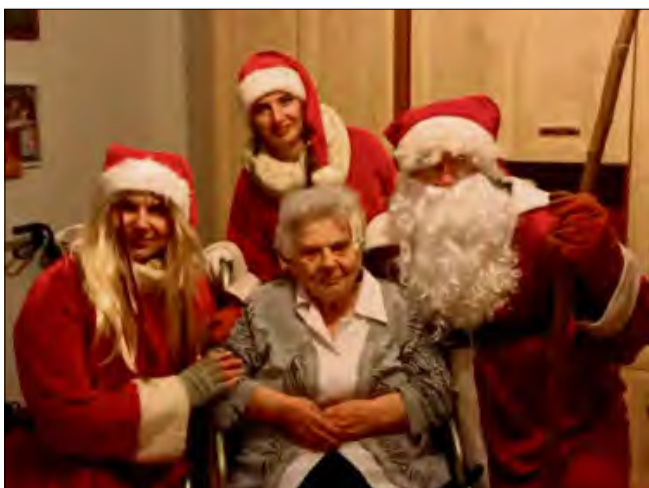
W sołectwie Komprachcice Mikołaj odwiedzał też seniorów.

(ml), Fot. sołectwo Polska Nowa Wieś, OSP Ochodze, sołectwo Komprachcice