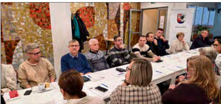
Uczestnicy forum brali udział w warsztatach, prowadzonych przez ekspertów, działających w trzecim sektorze.

Podczas spotkania poruszono istotne tematy, związane z prowadzeniem i rozwojem organizacji pozarządowych. Rozmawiano o takich zagadnieniach jak tworzenie i składanie wniosków o dofinansowanie, zarządzanie projektami, a także zmianami w przepisach prawno-księgowych obowiązujących od 2026 roku. Eksperci z Opolskiego Centrum Wspierania Inicja-