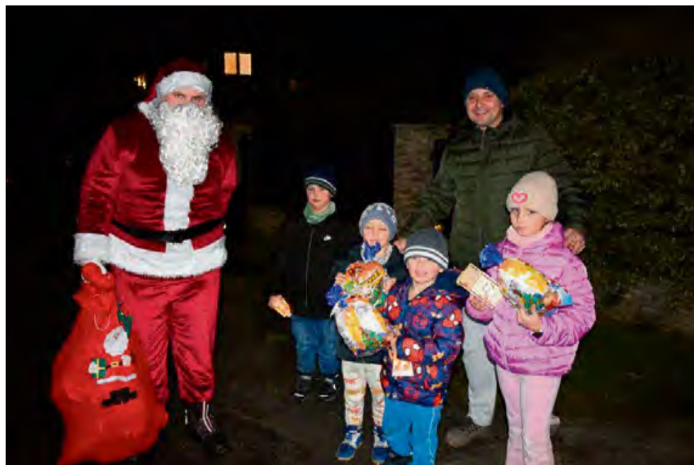
Organizatorem akcji mikołajkowej w Ochodzach była lokalna jednostka Ochotniczej Straży Pożarnej.

W Polskiej Nowej Wsi mikołajkowe obchody rozpoczęły się od krótkiego nabożeństwa w kościele parafialnym. Następnie przyszedł czas na spotkanie ze św. Mikołajem i jego żoną, którzy przybyli na spotkanie z dziećmi świątecznie udekorowanym samochodem, pilotowanym przez wóz strażacki OSP Polska Nowa