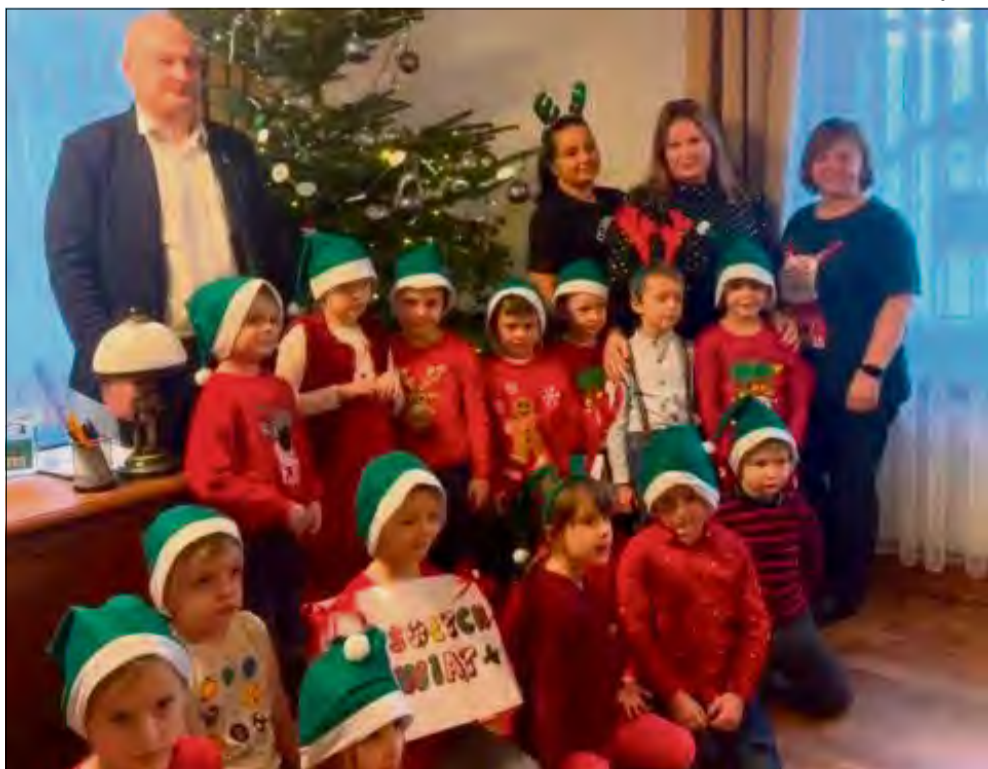
Dzieci z ogromnym zaangażowaniem i uśmiechem na twarzy przystroiły świąteczne drzewko w gabinecie wójta Tarnowa Opolskiego.