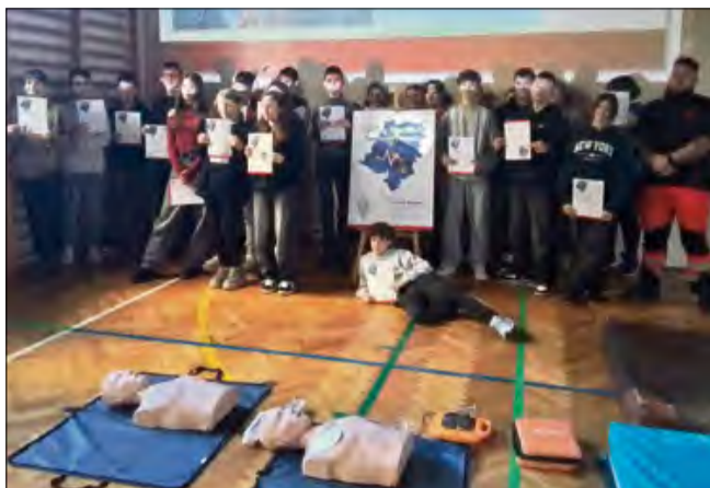
Każde takie zajęcia to szlif umiejętności, które mogą uratować życie.

Projekt „Opolscy Mistrzowie Pierwszej Pomocy” od