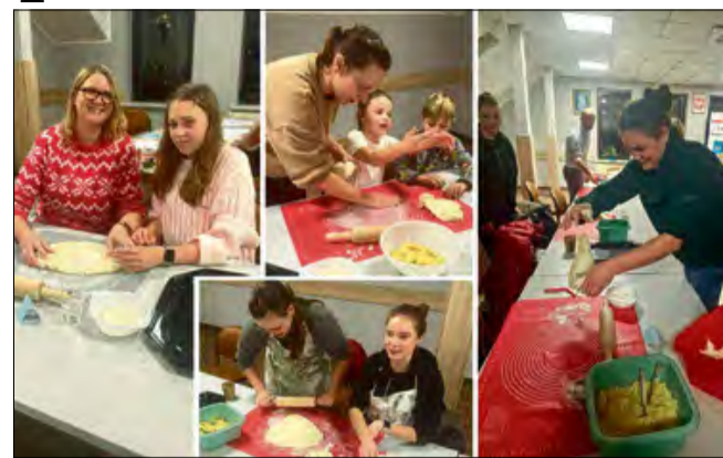
Mieszkańcy wspólnie zabrali się za lepienie pierogów.

Najbardziej dynamicznym momentem wieczoru okazał