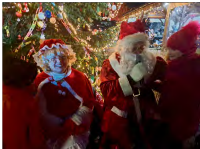
Polską Nową Wieś odwiedził Mikołaj z Mikołajową.

Organizatorem akcji mikołajkowej w Ochodzach była lokalna jednostka Ochotniczej Straży Pożarnej. W wyjątkowym korowodzie, składającym się z samochodu strażackiego, bryczki z końmi oraz roweru,