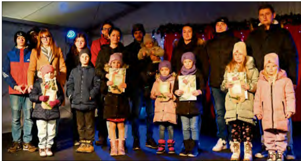
Podczas jarmarku rozstrzygnięto świąteczne konkursy.