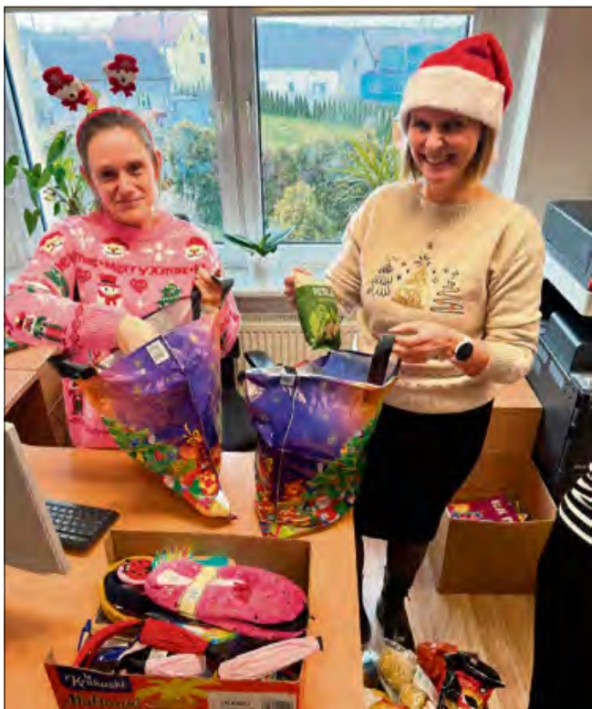
Ośrodek Pomocy Społecznej w Dąbrowie już po raz czwarty zorganizował akcję „Świąteczna Paczka”.

Dużym zainteresowaniem cieszyły się warsztaty plastyczne oraz świąteczna ścianka