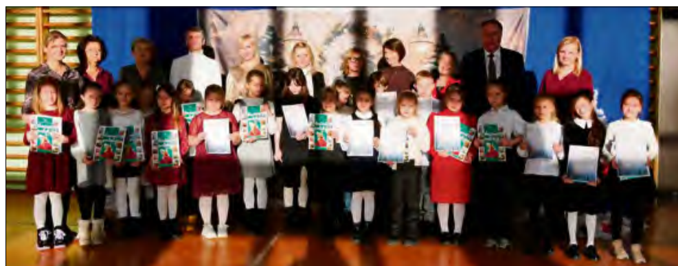
W szkole podstawowej w Zimnicach Wielkich recytowano świąteczną poezję.

W Publicznej Szkole Podstawowej im. ks. Karola Brommera zorganizowano Gminny Konkurs Recyta-