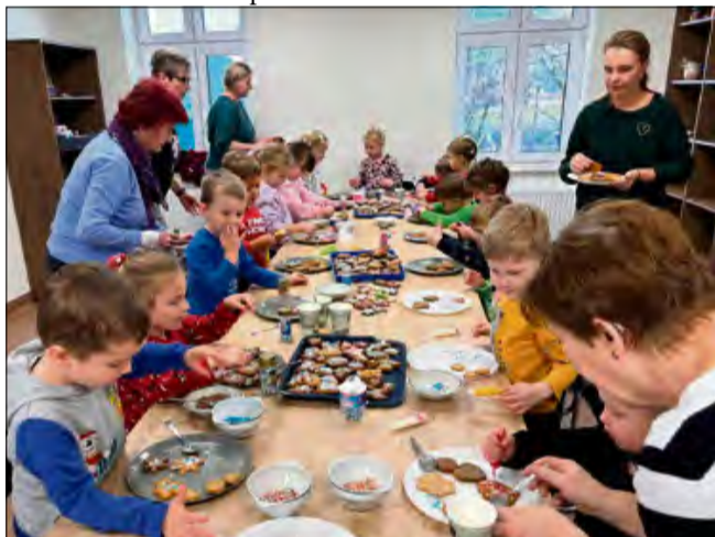
W Centrum Aktywności Lokalnej w Chróście odbyły się międzypokoleniowe warsztaty zdobienia pierników.

rozpoczęły muzyczne występy w wykonaniu uczniów najmłodszych klas oraz występ nauczycieli i pracowników szkoły. W tym roku zaprezentowali oni utwór „Pierwsza gwiazda”, który spotkał się z bardzo ciepłym przyjęciem publiczności.