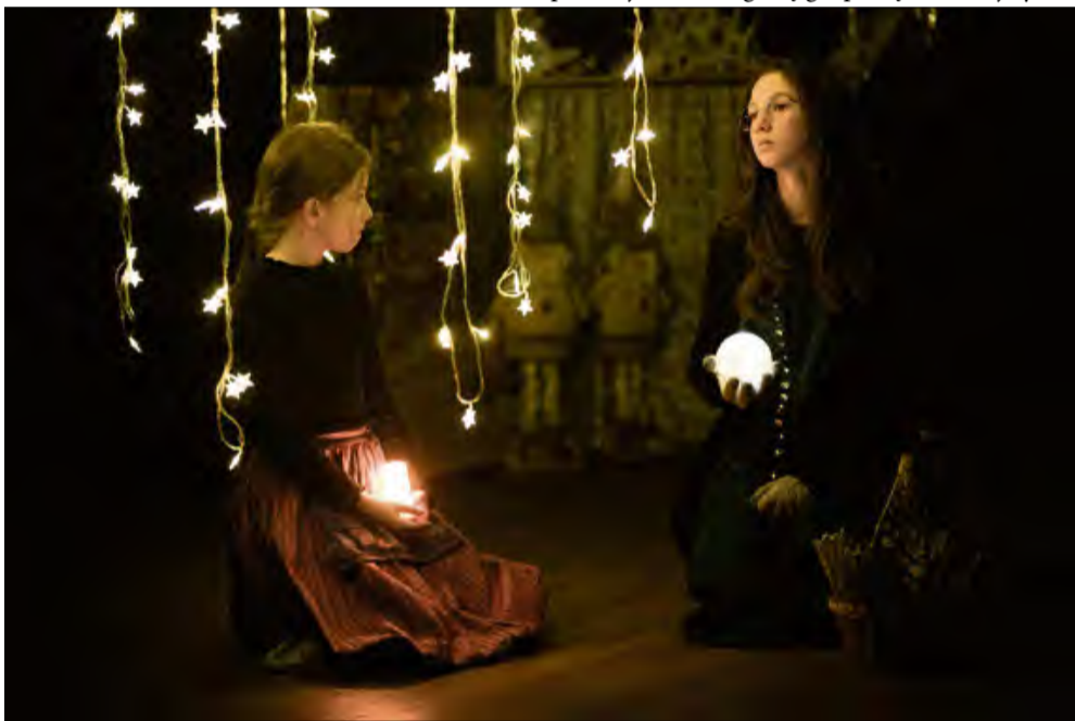
Uczestnicy świątecznego spotkania obejrzyli dwa spektakle.