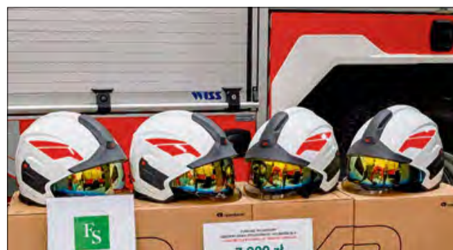
Tak prezentują się nowe helmy. Nowoczesny sprzęt zastąpi wysłużone egzemplarze, co bezpośrednio wpłynie na bezpieczeństwo ratowników podczas akcji.

Całkowita wartość zakupu wyniosła 8 856 zł. Środki pochodziły z dofinansowania Funduszu Składowego Ubezpieczenia Społecznego Rolników, który przekazał 7 000 zł. Pozostałą kwotę, 1 856 zł, pokryto z budżetu jednostki. Nowy sprzęt zostanie