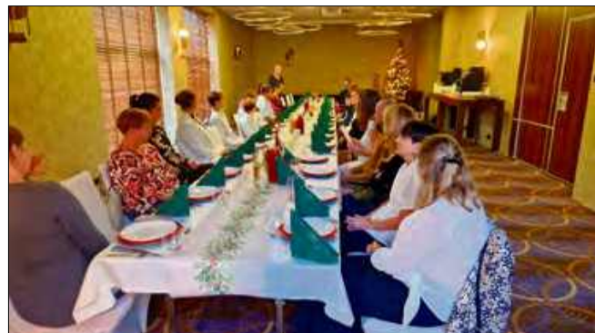
Na to wydarzenie wszyscy czekają cały rok.

- Takie wydarzenia pokazują, jak istotna jest lokalna solidarność i wrażliwość na potrzeby najmłodszych. Dla