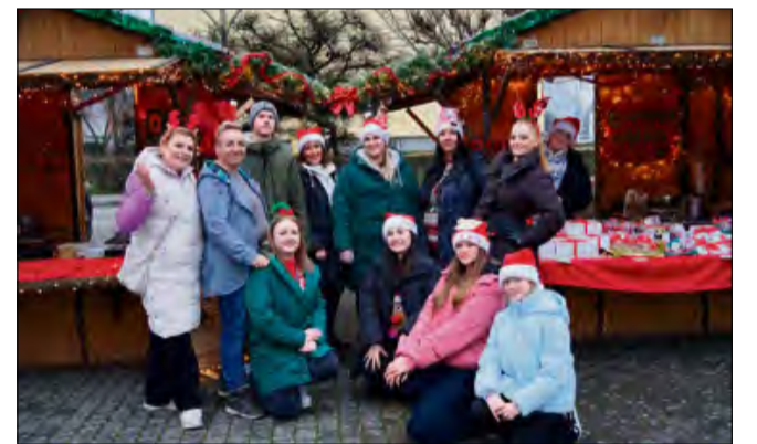
Na stoiskach można było kupić świąteczne rękodzieło.

Równolegle rozstrzygnięto XVI Gminny Konkurs na świąteczną ozdobę choinkową i zawieszkę zimową, w którym