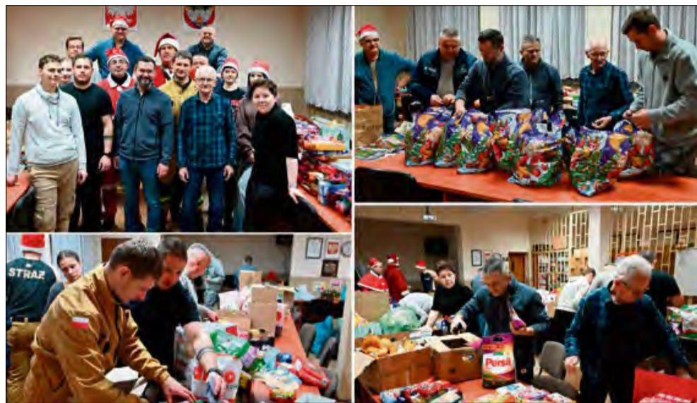
Dobroczytna akcja wywołała uśmiech na wielu twarzach.