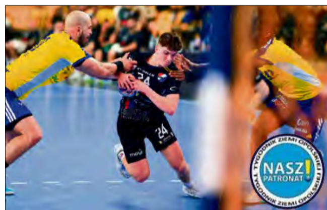
Mimo zaciętej walki Gwardziści zostali pokonani.

Nie było niespodzianki w sobotnim wyjazdowym meczu opolskich szczypioristów. Gwardziści zostali rozbici w Hali Legionów wynikiem 48:26.