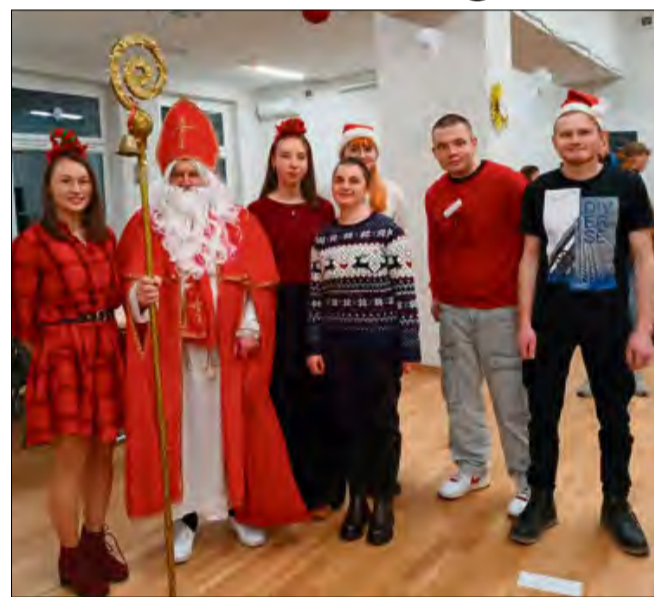
Świąteczny klimat już czuć w Chrzastowicach.

Spotkanie było okazją do wspólnego przeżywania okre-