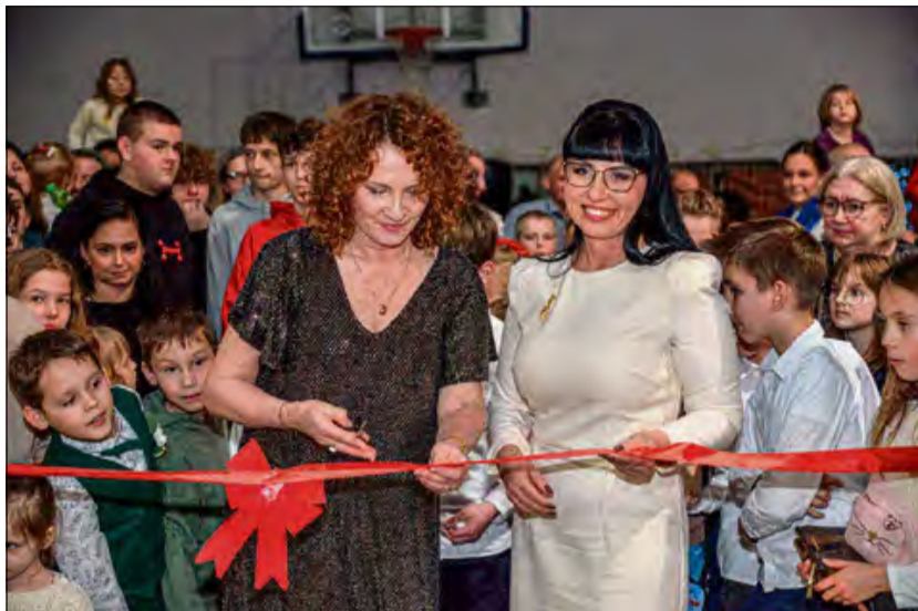
Z kiermaszem świątecznym w Chróście wiąże się wiele pięknych, pielęgnowanych od lat tradycji.

Jak co roku Publiczna Szkoła Podstawowa w Chróście zorganizowała kiermasz świąteczny, który przyciągnął tłumy mieszkańców i zaproszonych gości. Z wydarzeniem wiąże się wiele pięknych, pielęgnowanych od lat tradycji. Organizatorzy podkreślają, że ogromne znaczenie ma starannie przygotowana scenografia, w tym charakterystyczna, okolicznościowa brama prowadząca na teren kiermaszu. Spotkanie