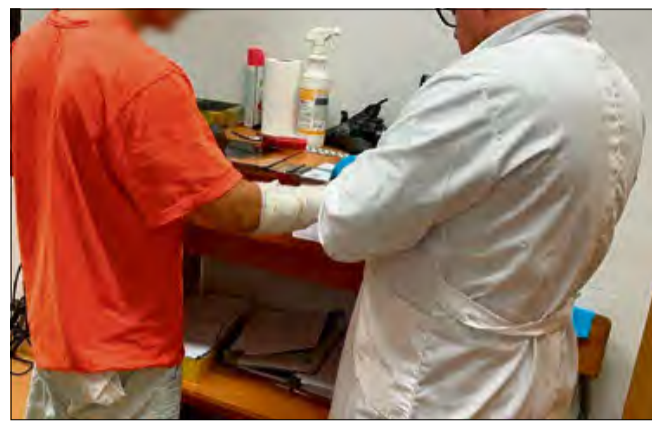
Sprawę rozpoznawać będzie Sąd Rejonowy w Opolu.