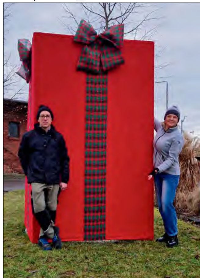
Prezent będzie ozdabiał skwer przez najbliższe, świąteczne tygodnie.