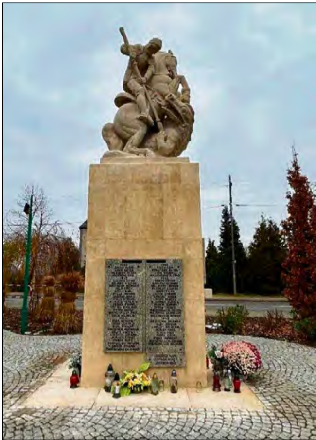
Prace konserwatorskie kosztowały prawie 80 tys. zł.

Warto podkreślić, że ten monument ma też bardzo ciekawą historię powstania. Ufundował go ku czci poległych w I wojnie światowej Związek Weteranów w 1934 roku. Na cokole wyryto nazwiska ofiar. A na szczycie rzeź-