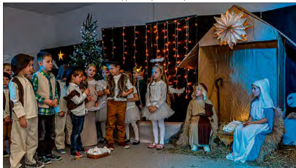
Sześciolatki z przedszkola w Dąbrowie zaprezentowały jasełka bożonarodzeniowe.