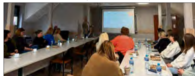
Program szkolenia obejmował kluczowe zagadnienia związane z ochroną ludności i obroną cywilną w Polsce.

Zadanie zrealizowano zgodnie z Ustawą o ochronie ludności i obronie cywilnej oraz Rozporządzeniem Ministra Spraw Wewnętrznych i Administracji w sprawie programów szkoleń z zakresu ochrony ludności i obrony cywilnej oraz wymagań dla