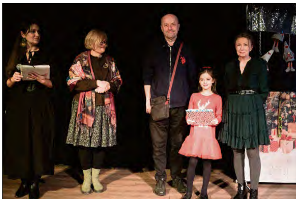
Podczas wydarzenia rozstrzygnięto konkurs szopek bożonarodzeniowych.

Zadaniem uczestników było wykonanie przestrzennej pracy - statycznej lub ruchomej - zawierającej wyraźne odniesienia do tradycji Bożego Narodzenia. Konkurs podzielono na kategorie indywidualne, obejmujące uczestników do 16. roku życia oraz powyżej 16 lat, a także na kategorię grupową, w której rywa-