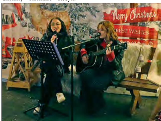
W Górkach nie zabrakło czasu na wspólne, świąteczne kolędowanie.