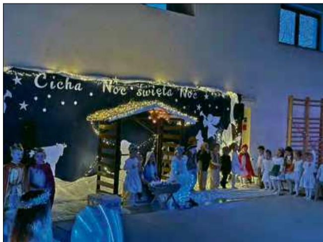
Uczniowie Zespołu Szkolno - Przedszkolnego w Boguszcach przygotowali jasełka.

(ml), fot. gmina Prószków, sołectwo Górki