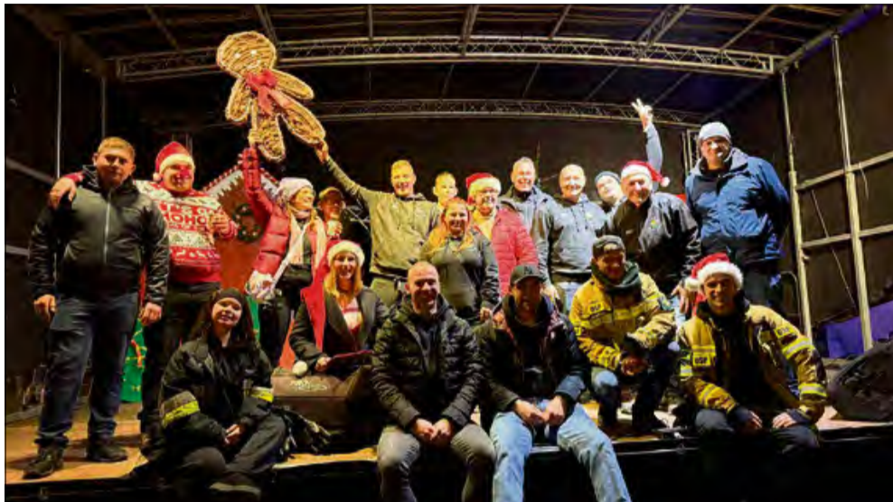
Po raz czwarty w Tarnowie Opolskim odbył się Jarmark Bożonarodzeniowy.

P elen świątecznej atmosfery i zapachu lokalnych przysmaków – tak 7 grudnia prezentował się Tarnów Opolski. Gmina zorganizowała już po raz czwarty Bożonarodzeniowy Jarmark, który po raz kolejny stał się okazją do spotkania społeczności oraz gości. Wydarzeniu towarzyszyła barwna parada pojazdów.