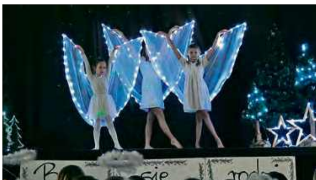
Organizatorzy „Świątecznego spotkania” zatroszczyli się o oprawę artystyczną wydarzenia.

Świąteczne spotkanie rozpoczęło się od jasełek w wykonaniu uczniów starszych klas, którzy wprowadzili publicz-