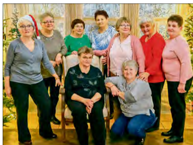
W sali „Rumcajs” w Przysieczy odbyło się świąteczne spotkanie, dedykowane seniorom.