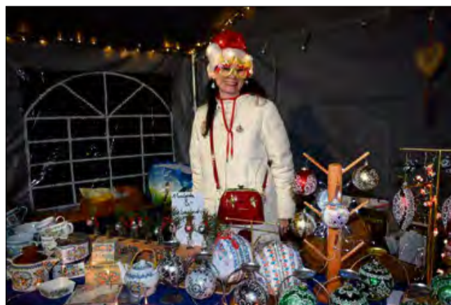
Podczas jarmarku w Szczedrzyku można było kupić świąteczne rękodzieło.