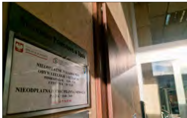
Na stronie internetowej powiatu opolskiego mieszkańcy mają w jednym miejscu zebrane wszystkie formy dostępnego poradnictwa.