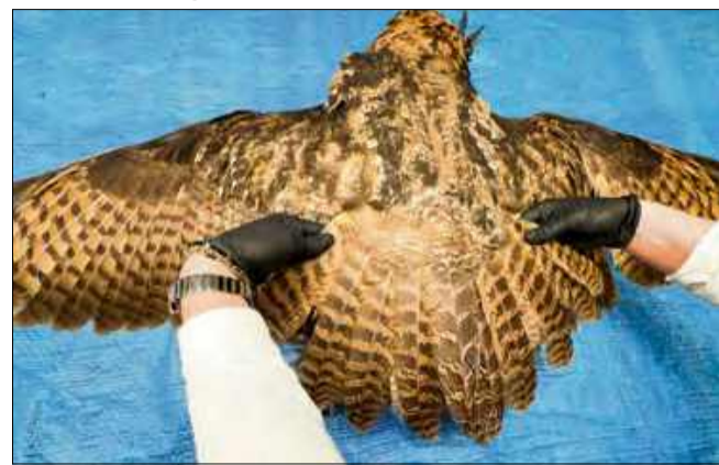
Puchacz – największa sowa Europy i gatunek skrajnie rzadki w Polsce. Śmierć każdego osobnika to ogromna strata dla przyrody.

Nadzieję przerwała smutna wiadomość z 25 listopada. Martwy puchacz został znaleziony około 5 kilometrów od miejsca