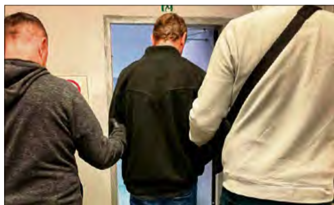
Teraz zatrzymanemu dodatkowo grozi kara do 8 lat więzienia.

Mężczyzna został namierzony przez funkcjonariuszy z Wydziału Ruchu Drogowego Komendy Miejskiej Policji w Opolu. Zatrzymali oni 37-letniego mężczyznę po tym, jak otrzymali zgłoszenie dotyczące osoby fotografującej wyjeżdżające radiowozy oraz karetki pogotowia. Okazało się, że to nie jedyne zabronione czyny, których się dopuścił.