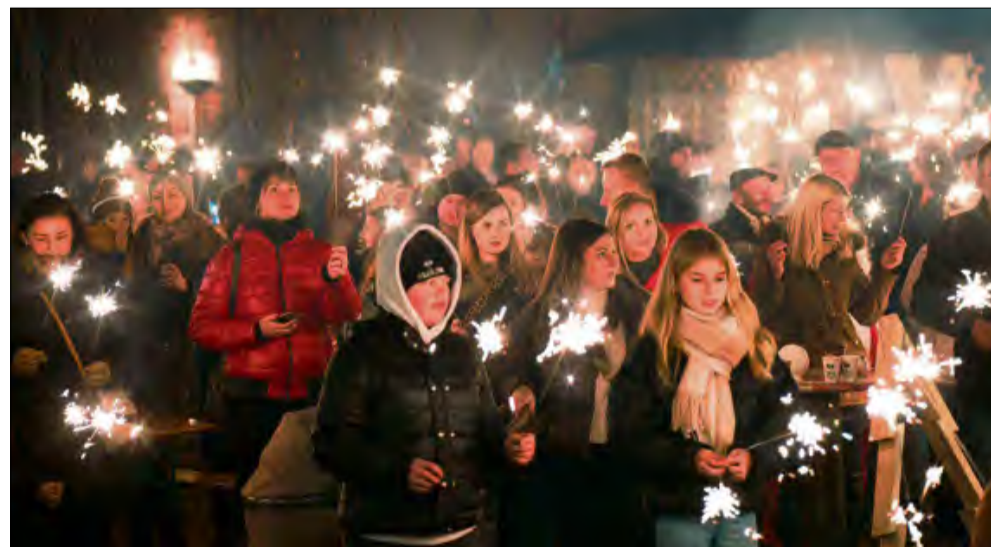
Pokaz zimnych ogniów zrobił na uczestnikach ogromne wrażenie.

Tradycyjny Weihnachtsmarkt zgromadził mieszkańców Starych Budkovic i okolic w niedzielne popołudnie 7 grudnia. Na placu plebanijnym rozbrzmiewała świąteczna muzyka, unosił się zapach grzanego wina i lokalnych przysmaków, a całość zwieńczył zjawiskowy pokaz zimnych ogniów.