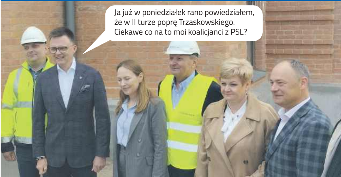
Marszałek Sejmu Szymon Hołowania w Pułtusku w maju 2025.