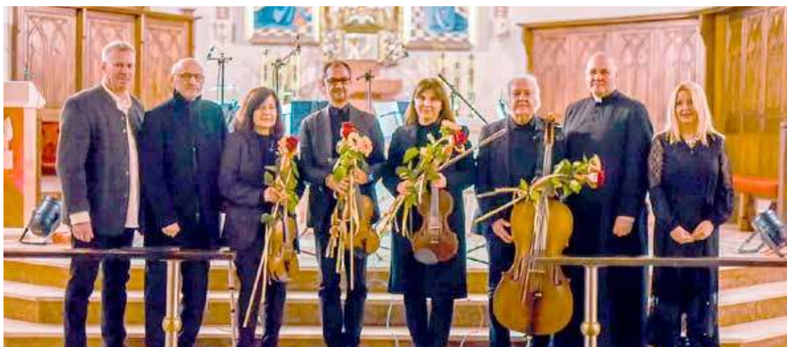
Pamiętkowa fotografia po zakończeniu koncertu

Oratorium „Siedem ostatnich słów Chrystusa na krzyżu” Josepha Haydna to jedno z ważniejszych dzieł muzyki sakralnej. Utwór może być zaprezentowany jedynie w czasie Wielkiego Postu. J. Haydn „Siedem Ostatnich Słów” w 1786 roku, wykorzystując pełną orkiestrę symfoniczną. Oratorium „Siedem ostatnich słów Chrystusa na krzyżu” ma formę siedmiu sonat instrumentalnych, poprzedzonych introdukcją i brawurowym zwieńczeniem.