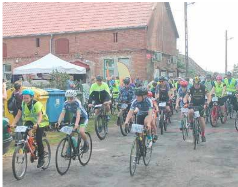
Foto. archiwum z 4. edycji Rajdu

liwa jest tylko online za pośrednictwem firmy świadczącej elektroniczny pomiar czasu - https://panel.maratonczyk.pomiarczasu.pl/nogogardzki-rajd...