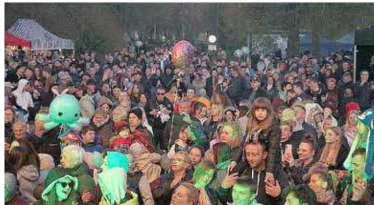
Publiczność w oczekiwaniu na koncert Myslowitz w trakcie majówki w 2023 roku

przy SP w Strzelewie, (oddane rządowe 2 mln zł), Stowarzyszenie wspomagające przez lata