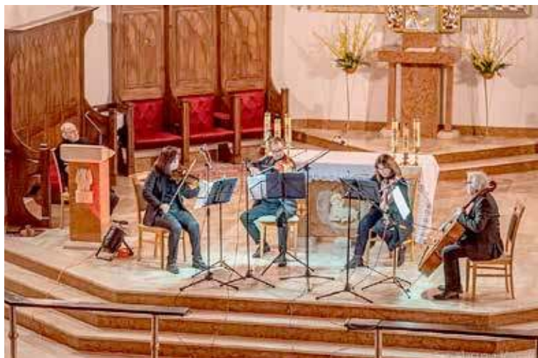
Utwór Haydna znakomicie wybrzmiał w aranżacji na kwartet smyczkowy

- To było prawdziwie misterium. Uczestniczenie w tak doniosłym wydarzeniu było czymś wspaniałym. Warte podkreślenia było to, że koncert zorganizowano w Niedzielę Palmową na chwilę przed rozpoczęciem Wielkiego Tygodnia. Znamiennymi instrumentalistami pokazali również, że utwór J. Haydna może wybrzmieć na kwartet. Co bardzo krzepiące na koncercie pojawiły się osoby w różnym wieku, co pokazało, że kultura wysoka trafia do różnych grup. Życzę Organizatorom, aby cały