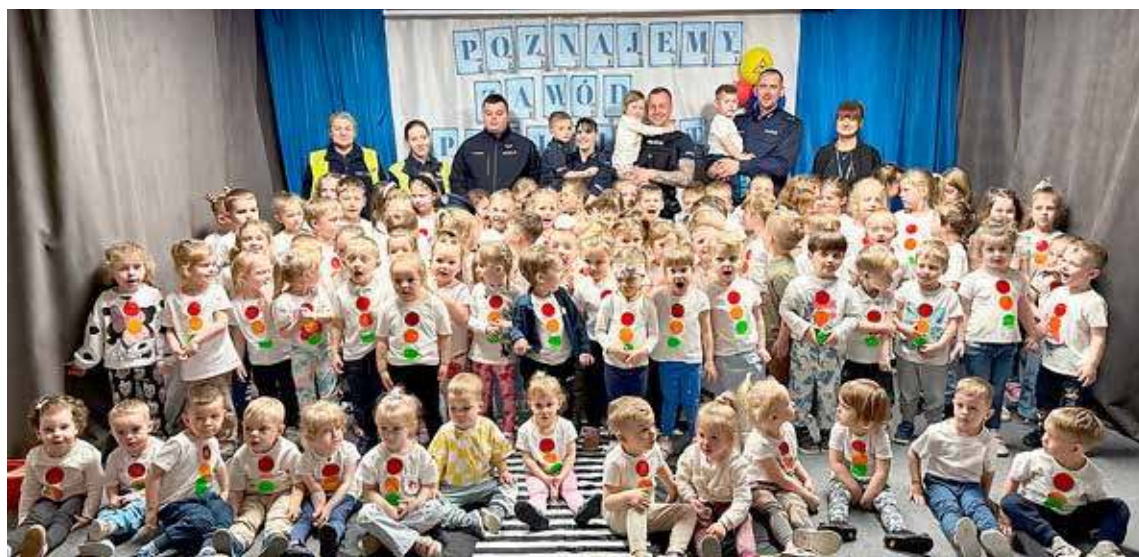
W wydarzeniu uczestniczyły wszystkie grupy przedszkolne Krainy Fantazji

Policjanci opowiedzieli przedszkolakom o swojej codziennej pracy, wyjaśnili, jak wygląda służba w policji, a także przypomnieli podstawowe zasady bezpieczeństwa – zarówno w domu, jak i na drodze. Dzieci miały oka-