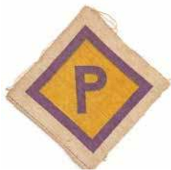
Polak miał chodzić specjalnie oznakowany – fioletowym znakiem z napisem „P” - po rosztyku

180 litrów dla niemieckiej. Od 13.645 dalsza dostawa dla ludności polskiej 225 litrów - dla ludności niemieckiej o 50 litrów [większa] (w stosunku do ostatniej z polecenia Komendanta Wojennego). Pojawiają się też narzekania, że muszą utworzyć stołówkę („kuchnia ludowa dla pracujących Niemców (konieczna ze względu na ingerencje władz sowieckich)”