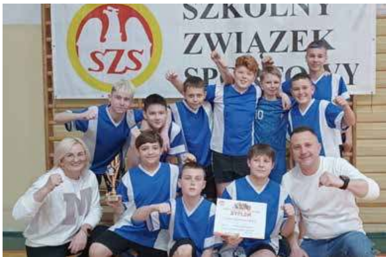
Ekipa z Osiny znalazła się w najlepszej ósemce w województwie