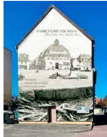
(Historyczny) mural zaproponowany przez burmistrza M. Wiatra

Te ładne domy z tej pocztówki nie były dla nas – no chyba, żeby je posprzątać, państwu ugotować obiad, narąbać drewna. Przy tych stołach, z tymi zastawami kupowanymi na Allegro i e-bay z napisem Naugard nie było dla nas miejsca. Te ponieckie butelki po piwie też nie były dla nas. Nam podludziom nie wolno było wejść do