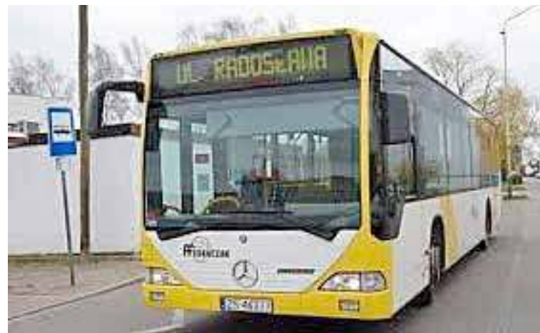
Nowa umowa ws. komunikacji miejskiej wejdzie w życie od 1 maja br.

Od 1 maja 2025 roku wejdzie w życie nowa umowa na świadczenie usług przewozowych komunikacją miejską. Trasa przejazdu autobusu pozostaje bez zmian. Na korektę trzeba będzie poczekać co najmniej rok. Wówczas zapowiadane są zmiany, które mają ułatwić dojazd m.in. do projektowanego centrum handlowego przy ul. Armii Krajowej.