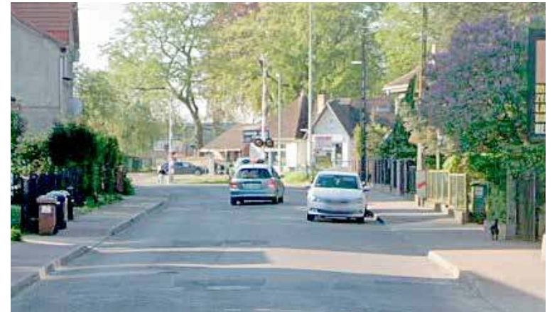
ul. Batalionów Chłopskich dwukierunkowa

Urząd Miejski w Nowogardzie informuje, że z dniem 30 kwietnia planowane jest wprowadzenie zmiany w stałej organizacji ruchu na ulicy Batalionów Chłopskich , polegającej na wprowadzeniu zakazu postoju po prawej stronie ulicy – na odcinku od skrzyżowania z ul. 3 Maja do skrzyżowania z ul. Stanisława Rzeszowskiego. Za utrudnienia