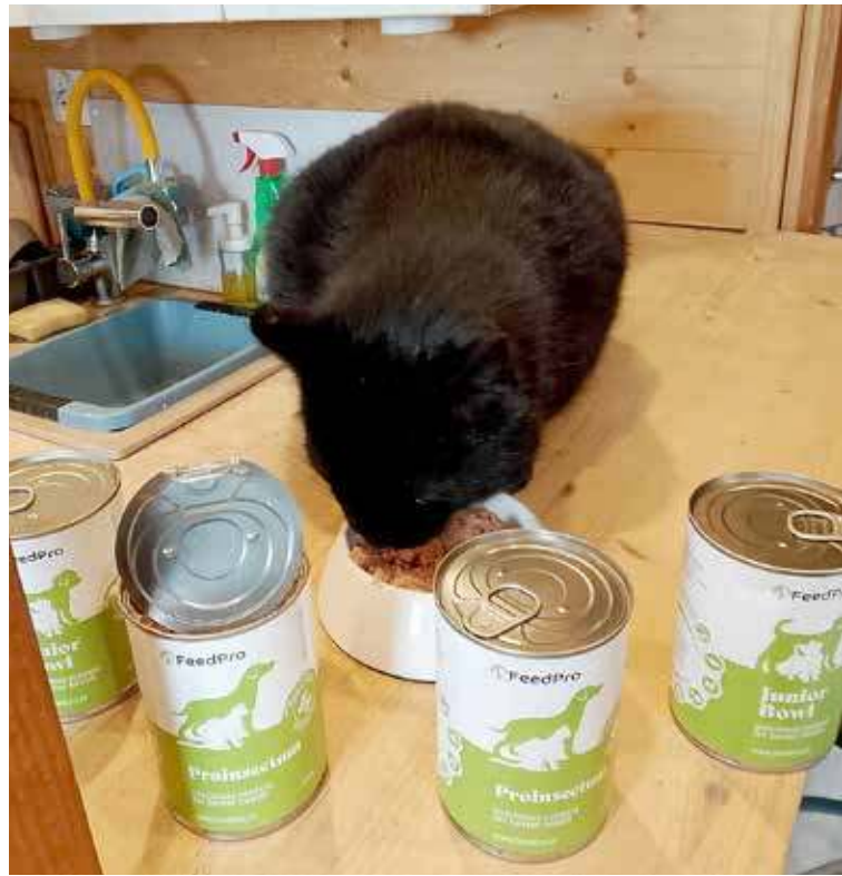
Do naszego Czytelnika szybciej dotarła karma pozyskana dzięki firmie FeedPro niż ta zakupiona przez UM Nowogard.

Jak wynika z wyliczeń pracowników UM Nowogard, w 2024 r. 66 osób złożyło łącznie 93 wnioski o przekazanie bezpłatnej karmy - niektórzy