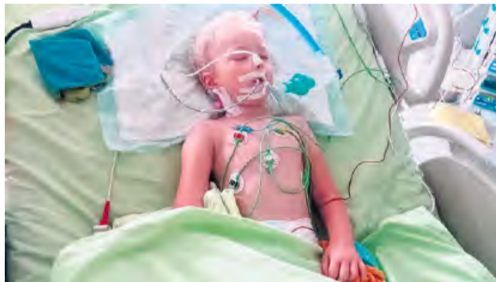
Na stronie zrzutka.pl na proces dalszego leczenia i rehabilitacji utworzono zbiórkę, której celem jest zebranie 150.000 złotych.

Dziewczynka trafiła na OIOM, gdzie lekarze przez 4 miesiące walczyli o jej życie. W tym czasie zostały założone PEG i rurka tracheostomijna, bo Irenka nie je w naturalny sposób, nie mówi. W niewiel-