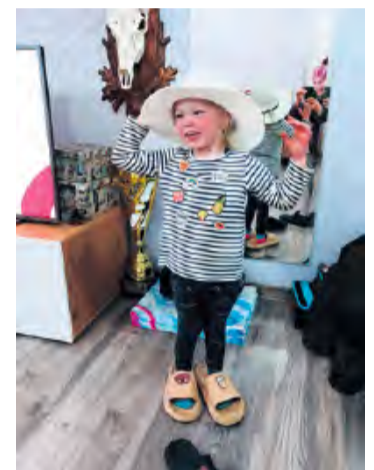
Jak przekazuje „Tygodnikowi” mama Irenki, dziewczynka była wesołym i energicznym dzieckiem.

Jej było wszędzie pełno. Mąż naprawia różne sprzęty, więc siedziała też w garażu z chłopakami. Takie wesołe, radosne dziecko. Uwielbiała ludzi. Zaczepiała każdego. Ktokolwiek obcy do nas przyjechał, potrafiła sprósić dosłownie do domu – opowiada matka.