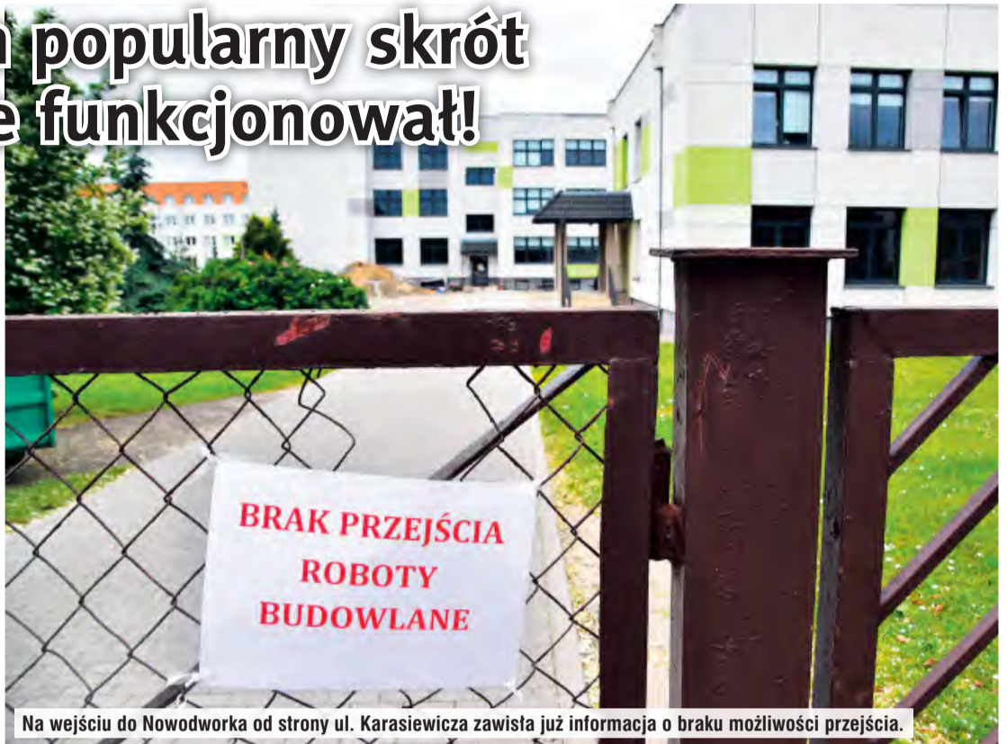
Na wejściu do Nowodworka od strony ul. Karasiewicza zawisła już informacja o braku możliwości przejścia.

Z chwilą wejścia w życie uchwalonego planu ww. dokumenty dostępne będą w siedzibie Urzędu Gminy Gostycyn, ul. Bydgoska 8, 89-520 Gostycyn oraz na stronie internetowej – www.bip.gostycyn.pl oraz www.voxly.pl/gostycyn/ .