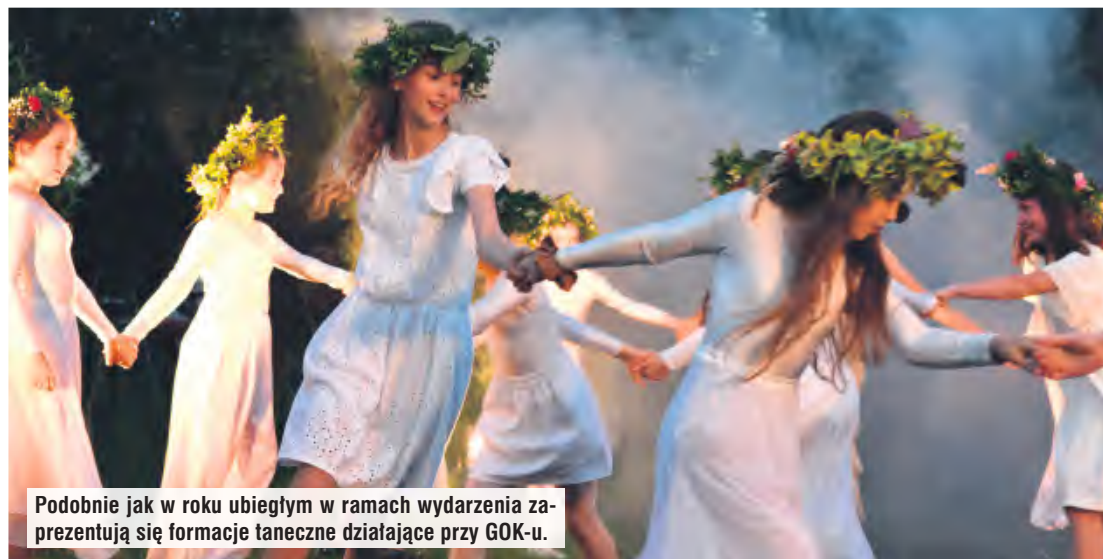
Podobnie jak w roku ubiegłym w ramach wydarzenia zaprezentują się formacje taneczne działające przy GOK-u.

Gminny Ośrodek Kultury w Gostycynie zaprasza w piątek (27.06) na Palinockę.