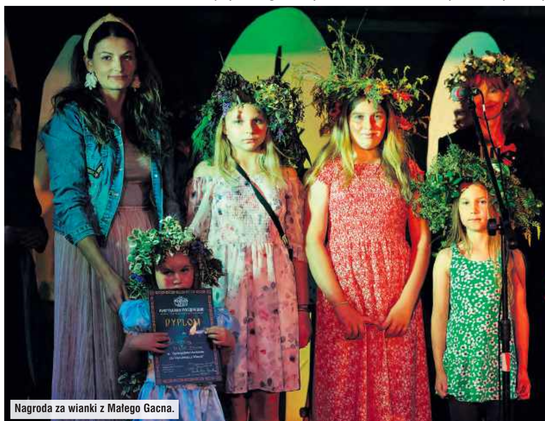
Nagroda za wianki z Małego Gacna.