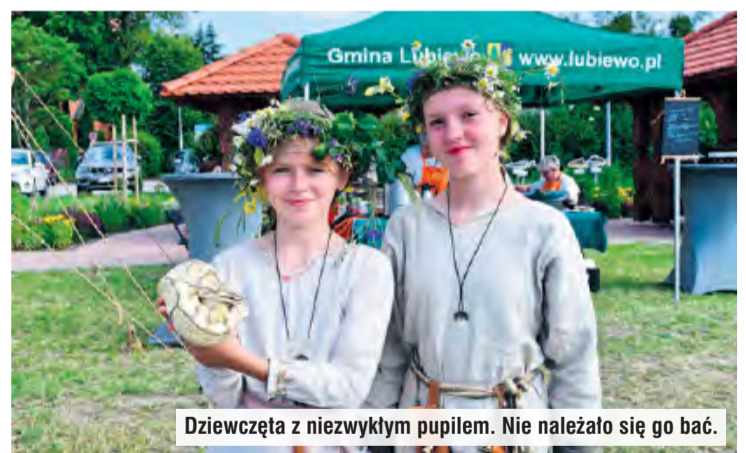
Dziewczęta z niezwykłym pupilem. Nie należało się go bać.