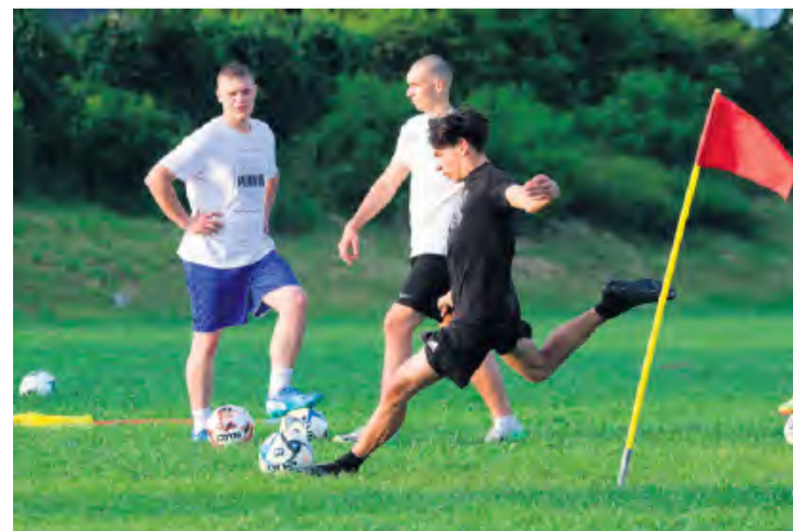
Na treningach, wedle słów trenera, pojawia się dużo przyszłych zawodników.

tu w Żalniu. Boisko już zostało zweryfikowane przez przedstawicieli KPZPN-u i zatwierdzone jako miejsce ligowych meczów. W trakcie natomiast jest proces licencyjny, jednak, jak podkreśla trener zespołu, to tylko formalność. Na treningach drużyna