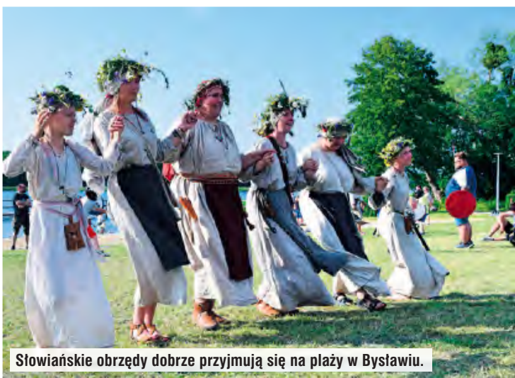
Słowiańskie obrzędy dobrze przyjmują się na plaży w Bysławiu.