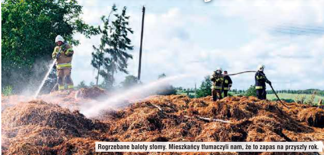
Rogrzebane baloty słomy. Mieszkańcy tłumaczyli nam, że to zapas na przyszły rok.

Właściciele ogrodnictwa w rozmowie z „Tygodnikiem” wstępnie ocenili starty na ok. 25 tys. zł. Zagrożenie