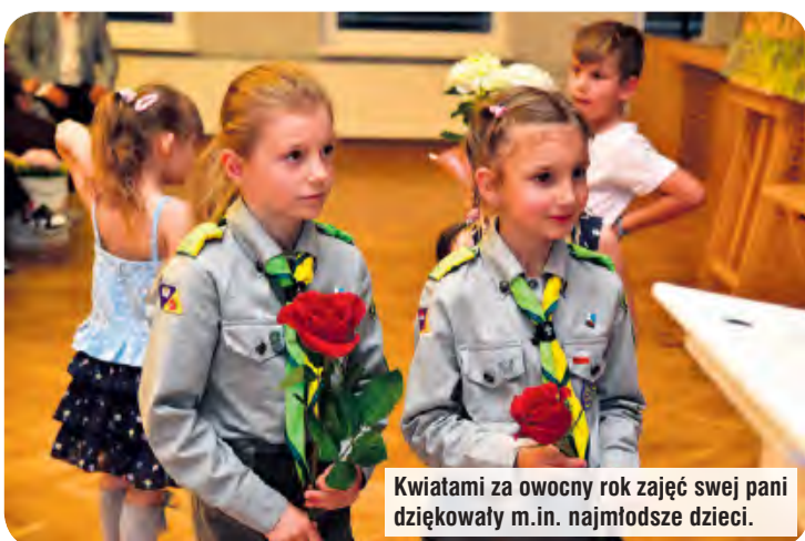
Kwiatami za owocny rok zajęć swej pani dziękowały m.in. najmłodsze dzieci.