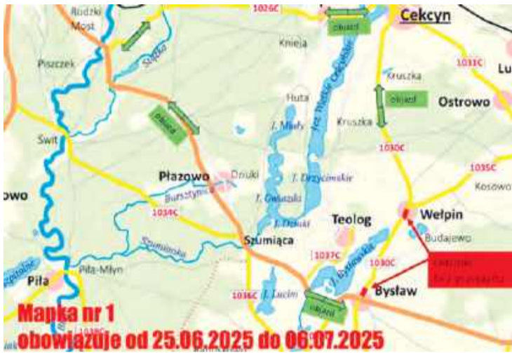
Mapka nr 1 obowiązuje od 25.06.2025 do 06.07.2025 Aktualna organizacja ruchu.

W środę (25 czerwca) w Bystawiu zamknięta została droga powiatowa w centrum wsi. Mowa o odcinku od DW nr 240 do budynku Ochotniczej Straży Pożarnej. Obostrzenia związane są z inwestycją drogową, która zdaniem starosty rozwiąże problem, o którym mówiło się od dawna. Szczegóły poniżej.