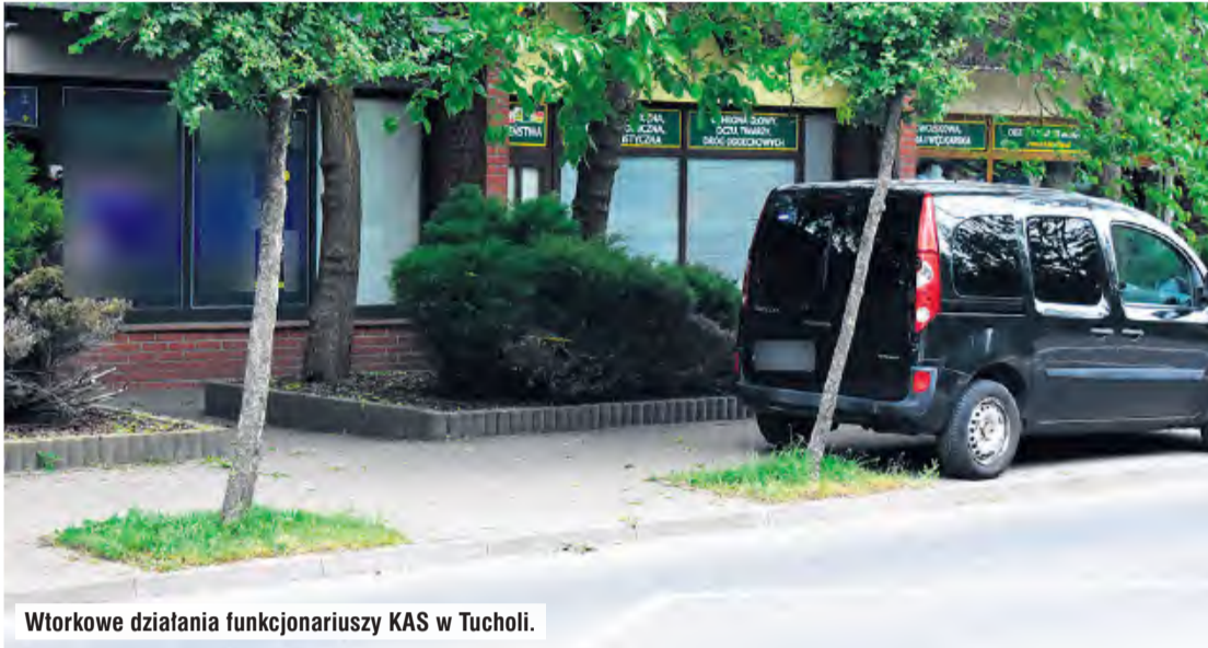
Wtorkowe działania funkcjonariuszy KAS w Tucholi.

W Tucholi we wtorek pojawili się funkcjonariusze Krajowej Administracji Skarbowej. Prowadzili działania w punkcie z zakładami w centrum Tucholi. – Przeprowadzili eksperyment procesowy na trzech znajdujących się w lokalu automatach do gier. Eksperyment potwierdził hazardowy charakter (...) urzędzeń – informuje „Tygodnik Tucholski” rzecznik prasowy Bartosz Stróżyński.