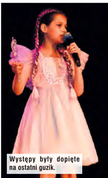
Występy były dopięte na ostatni guzik.

W Gminnym Ośrodku Kultury w Śliwicach zorganizowano Regionalny Konkurs pod nazwą „Młodzieżowa Giełda Piosenki”. Na scenie zaprezentowali się młodzi i utalentowani wokaliści. Wykonali zarówno polskojęzyczne i anglojęzyczne utwory.