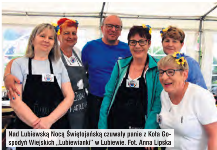
Nad Lubiewską Nocą Świętojańską czuwały panie z Koła Gospodyń Wiejskich „Lubiewianki” w Lubiewie.