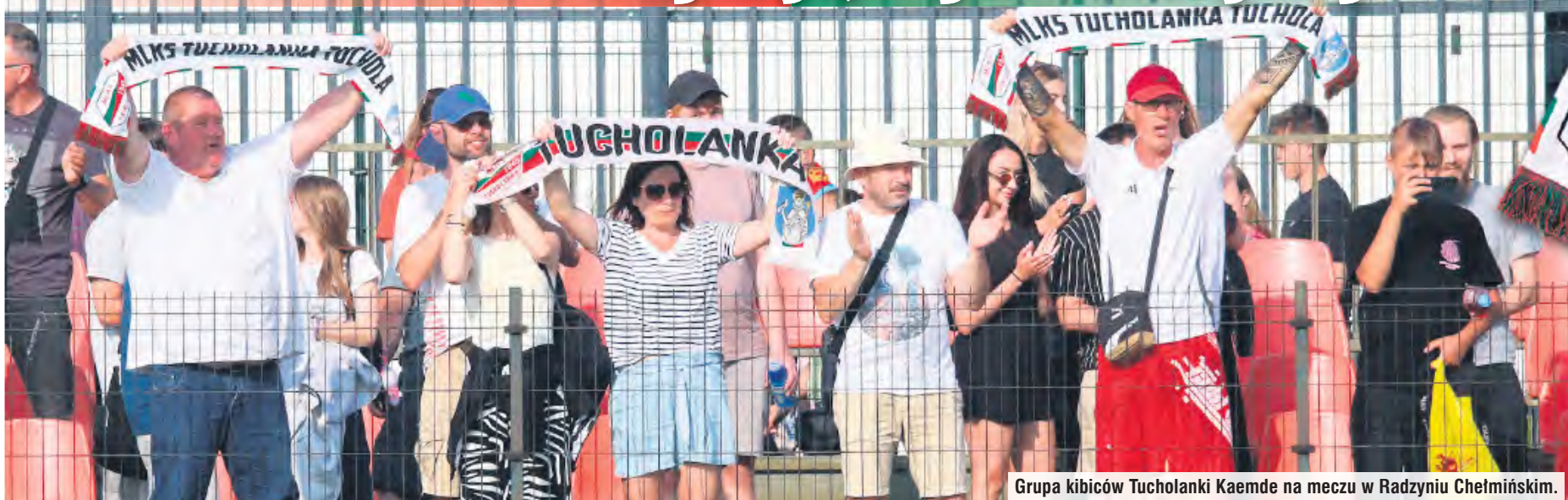
Grupa kibiców Tucholanki Kaemde na meczu w Radzynie Chelmiński.