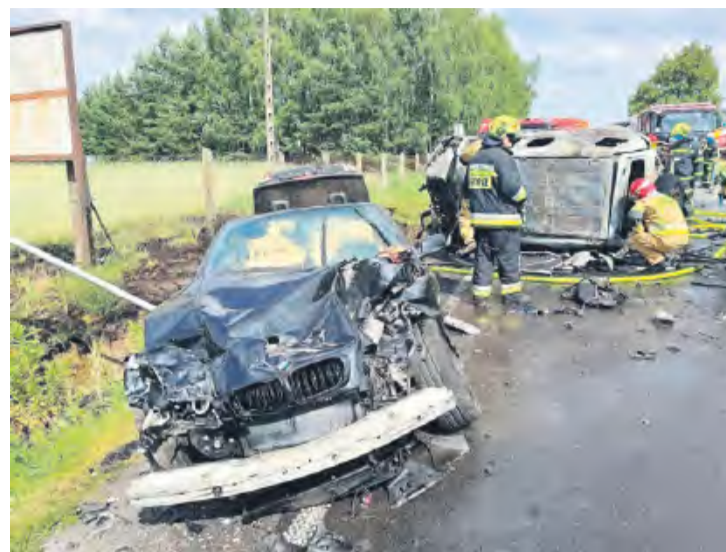
Po zepchnięciu pod TIR-a toyota, którą podróżował filmowiec, stanęła w płomieniach.

– Oskarżony został uznany za winnego zarzucanego mu czynu i skazany na karę pozbawienia wolności w wymiarze 6 lat – informuje Marcin Dobies, prezes Sądu Rejonowego w Tucholi.