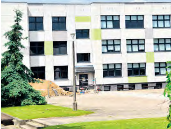
Na poziomie piwnic w LO znajdują się szatnie i pracownie, dlatego też winda będzie obsługiwała i tę kondygnację.

Budowę windy przy tucholskim LO realizuje