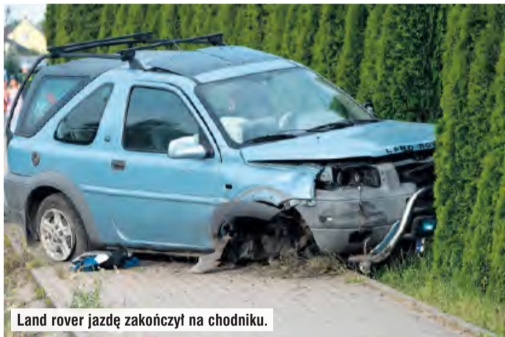
Land rover jazdę zakończył na chodniku.

Agata Wiśniewska, fot. Arkadiusz Lorbiecki