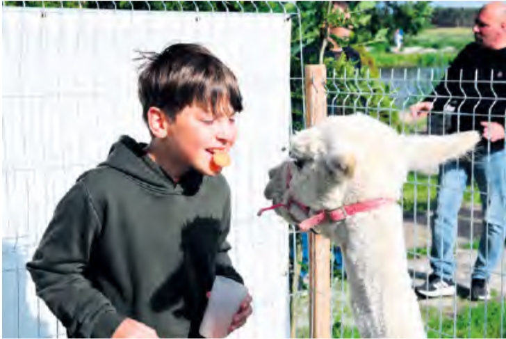
Dokarmianie alpak marchewką przybierało różne postacie, a śmiechu i radości było nieograniczenie wiele.

W Boże Ciało, tj. czwartek (19 czerwca) w Lubiewie odbyła się Lubiewska Noc Świętojańska. Wydarzenie poświęcono tematyce Nocy Kupały, czyli pogańskiemu słowiańskiemu świętu, ściśle związanemu z nadejściem lata. Choć pogoda w czwartek była wietrzna, festyn cieszył się dużym zainteresowaniem ze strony mieszkańców i nie tylko.