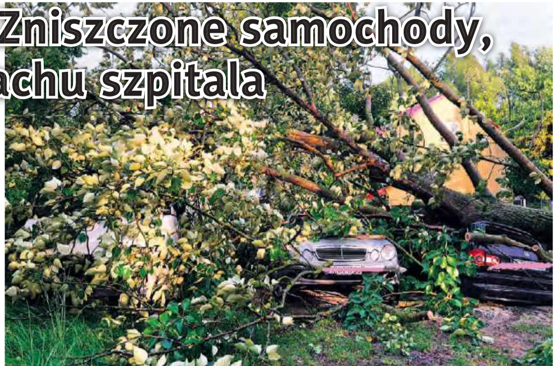
Pod drzewem łącznie trzy samochody. Zniszczony najbardziej jest vw sharan z prawej.

Jednocześnie strażacy przebywali też na dachu Szpitala Tucholskiego. Pokrycie dachowe zostało naruszone i podwiane