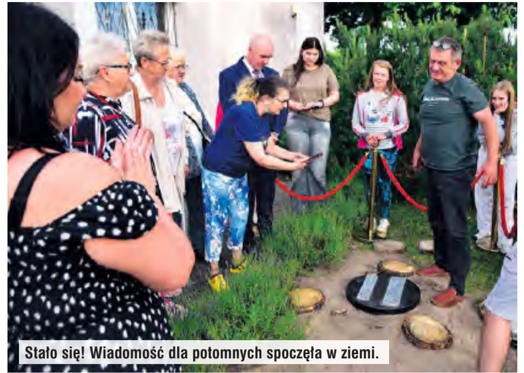
Stało się! Wiadomość dla potomnych spoczęła w ziemi.

złych pokoleń (życzył im pokoju i dbałości o otaczający ich świat) w kapsule umieścił folder z niektórymi swoimi pracami i rzeźbę sowy. Niektórzy przygotowali już wcześniej listy ze wskazaniem ich adresatów.