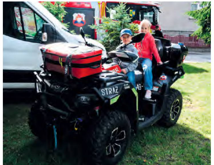
Dzięki uprzejmości Ochotniczej Straży Pożarnej w Lubiewie dzieci z bliska mogły podziwiać sprzęt, który pomaga druhom w ochotniczej służbie.

Lubiewska Noc Świętojańska to również konkursy – dzieci szukały kwiatu paproci, a każdy