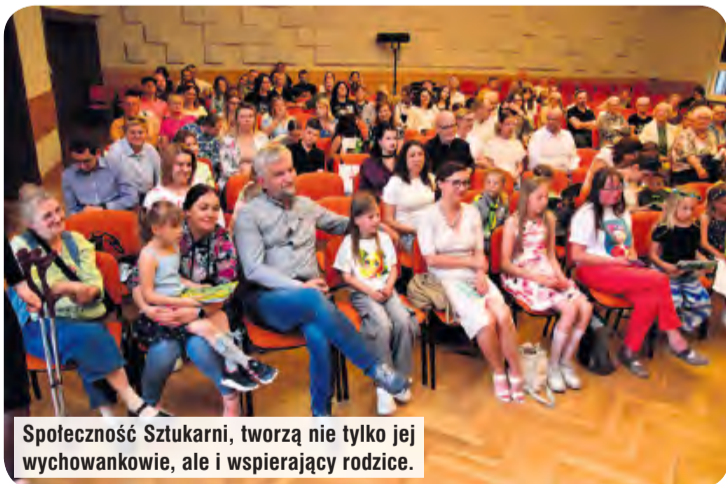
Spoleczność Sztukarni, tworzą nie tylko jej wychowankowie, ale i wspierający rodzice.

ni wypełnili już kwestionariusze ankiety, w których wskazali swoje artystyczne marzenia (te okazały się bardzo różnorodne, od kupienia dobrych farb, przez nocny sens filmu „Mój Vincent” po wyjazd do Francji). Część z nich ma doczekać się realizacji właśnie w związku z dekadą działalności. Możemy spodziewać się m.in. pleneru z udziałem wszystkich wychowanków pracowni. Sama Sztukarnia nieco zmieni swoje funkcjonowanie. Najbliższy nabór na zajęcia będzie większy, co umożliwi liczniejsze grono prowadzących.