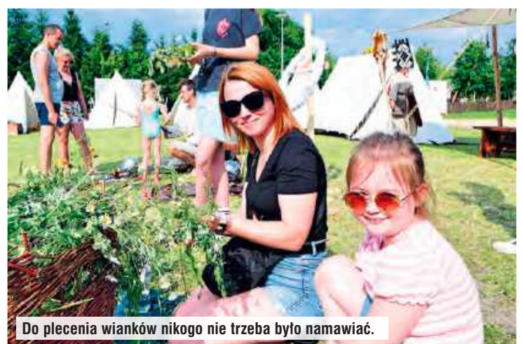
Do plecenia wianków nikogo nie trzeba było namawiać.