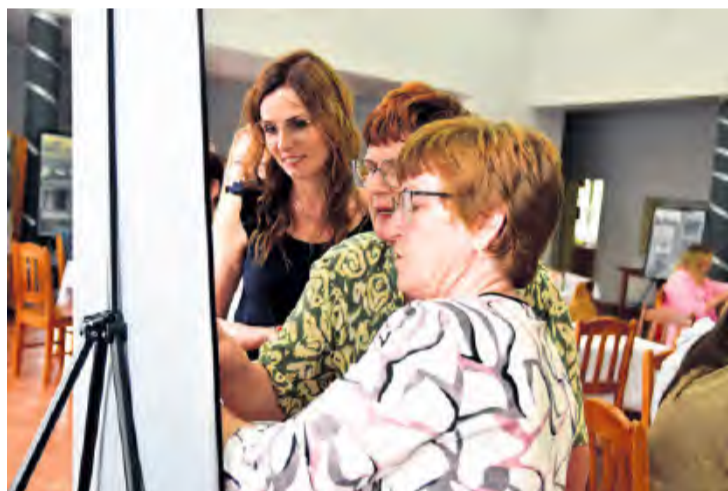
Wydarzeniu towarzyszyła wystawa starych fotografii, wykonanych w Drożdzienicy i Kęsowie. Mieszkańcy oglądali ją z wielkim zainteresowaniem.