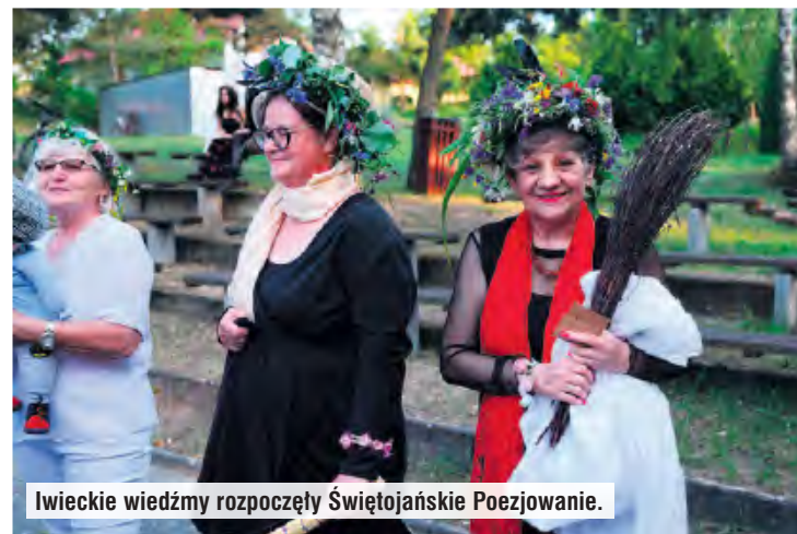
Iwieckie wiedźmy rozpoczęły Świętojańskie Poezjowanie.

dania tomiku wierszy. Nazwiska nagrodzonych w tegorocznym konkursie publikujemy przy artykule. Dodajmy, że specjalnie na Festyn Leśnej Pszczoly gale-