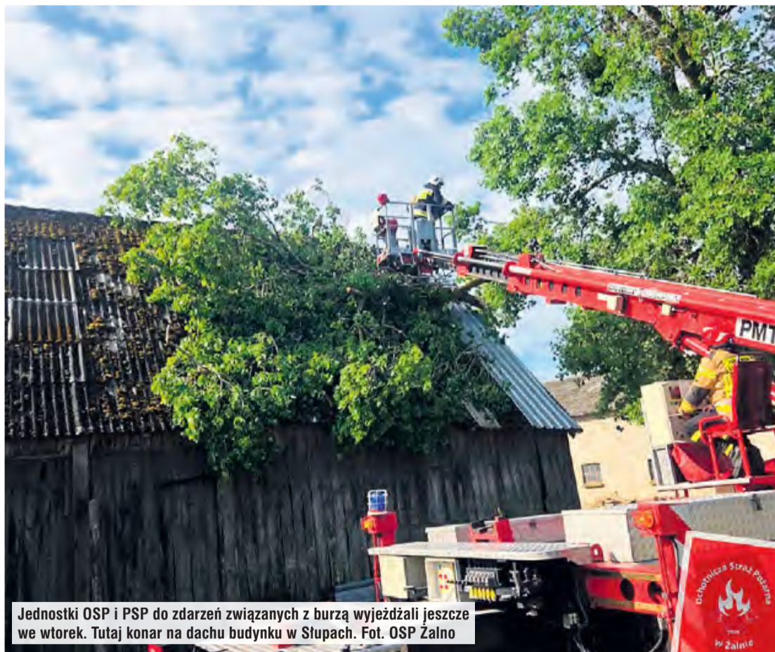
Jednostki OSP i PSP do zdarzeń związanych z burzą wyjeżdżali jeszcze we wtorek. Tutaj konar na dachu budynku w Słupach.