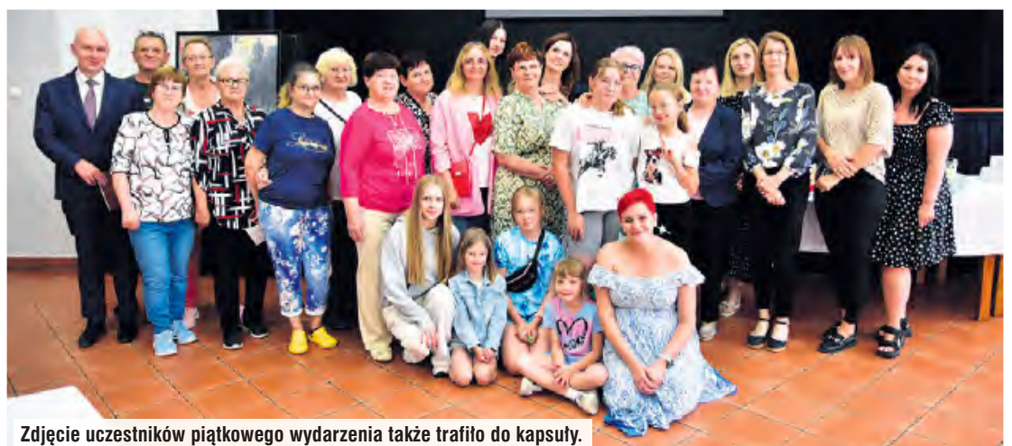
Zdjęcie uczestników piątkowego wydarzenia także trafiło do kapsuły.