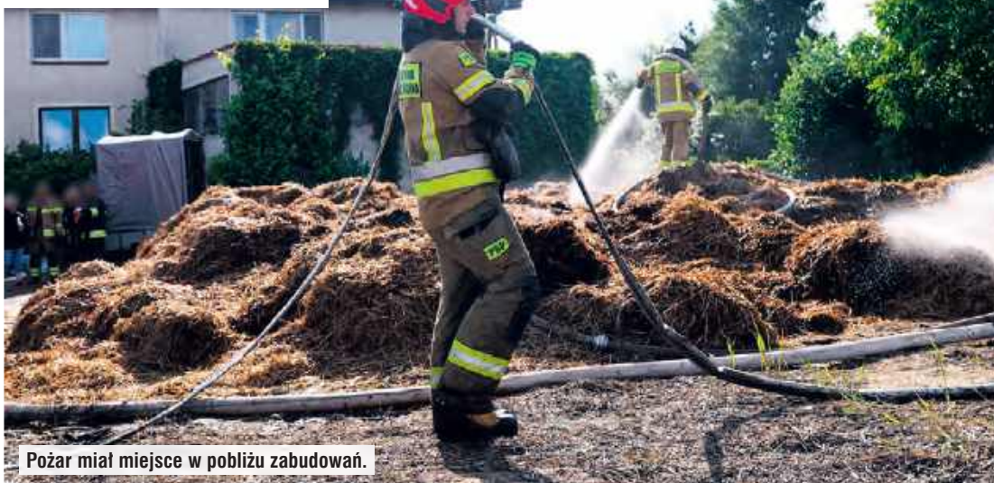
Pożar miał miejsce w pobliżu zabudowań.