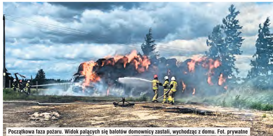
Początkowa faza pożaru. Widok palących się balotów domownicy zastali, wychodząc z domu.

li sąsiedzi ze swoim sprzętem i błyskawicznie od wezwania pojawiały się kolejne zastępy straży pożarnej. Strategiczne znaczenie miał też fakt, że tuż obok przechowywanej słomy znajduje się staw, z którego na bieżąco wodę mogli pobrać strażacy.