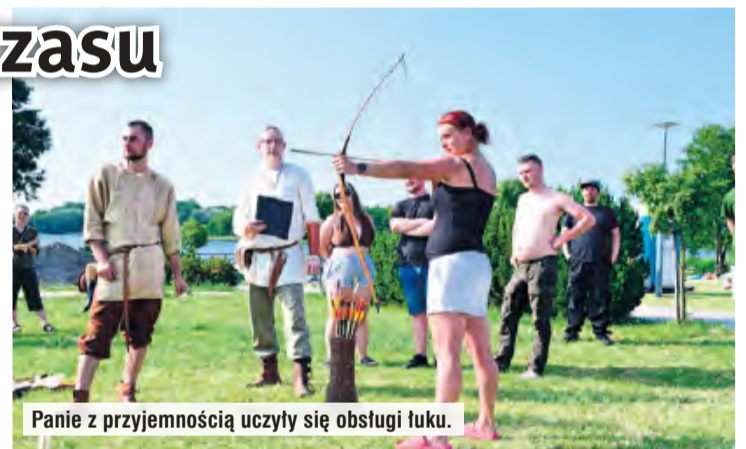
Panie z przyjemnością uczyły się obsługi łuku.