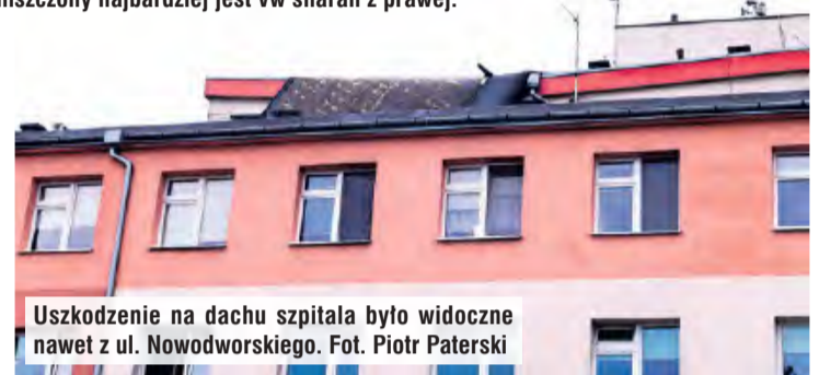
Uszkodzenie na dachu szpitala było widoczne nawet z ul. Nowodworskiego.

– Wydarzenie i uszkodzenia dachu nie ma wpływu na działalność szpitala. Nie ma też żadnych zacieków, nie została uszkodzona instalacja. Czekamy już na dekarzy, którzy dokonają naprawy. Sytuacja jest pod kontrolą – tłumaczyła Nieżurawska.