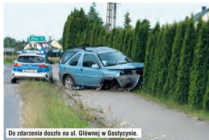
Do zdarzenia doszło na ul. Głównej w Gostycynie.

– W organizmie mężczyzny znajdowały się ponad 2 promile alkoholu. Policjanci ustalili również, że posiada on sądowy zakaz prowadzenia pojazdów. Od 48-letniego mieszkańca gminy Gostycyn została pobrana także krew do dalszych badań – podaje