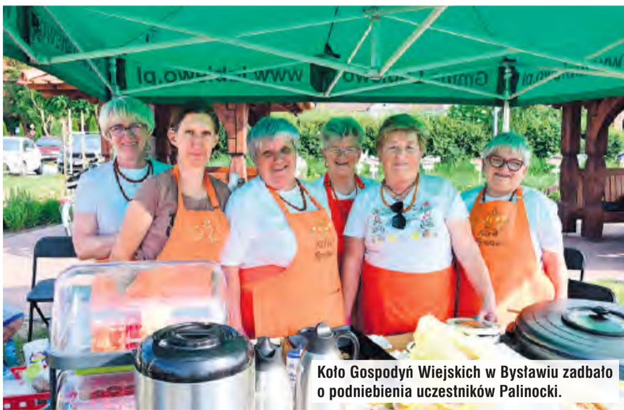
Koło Gospodyń Wiejskich w Bysławiu zadbało o podniebienie uczestników Palinocki.

go nie jest im obce powracanie do obrzędów słowiańskich, walk wojów, zwyczajów sobótkowych