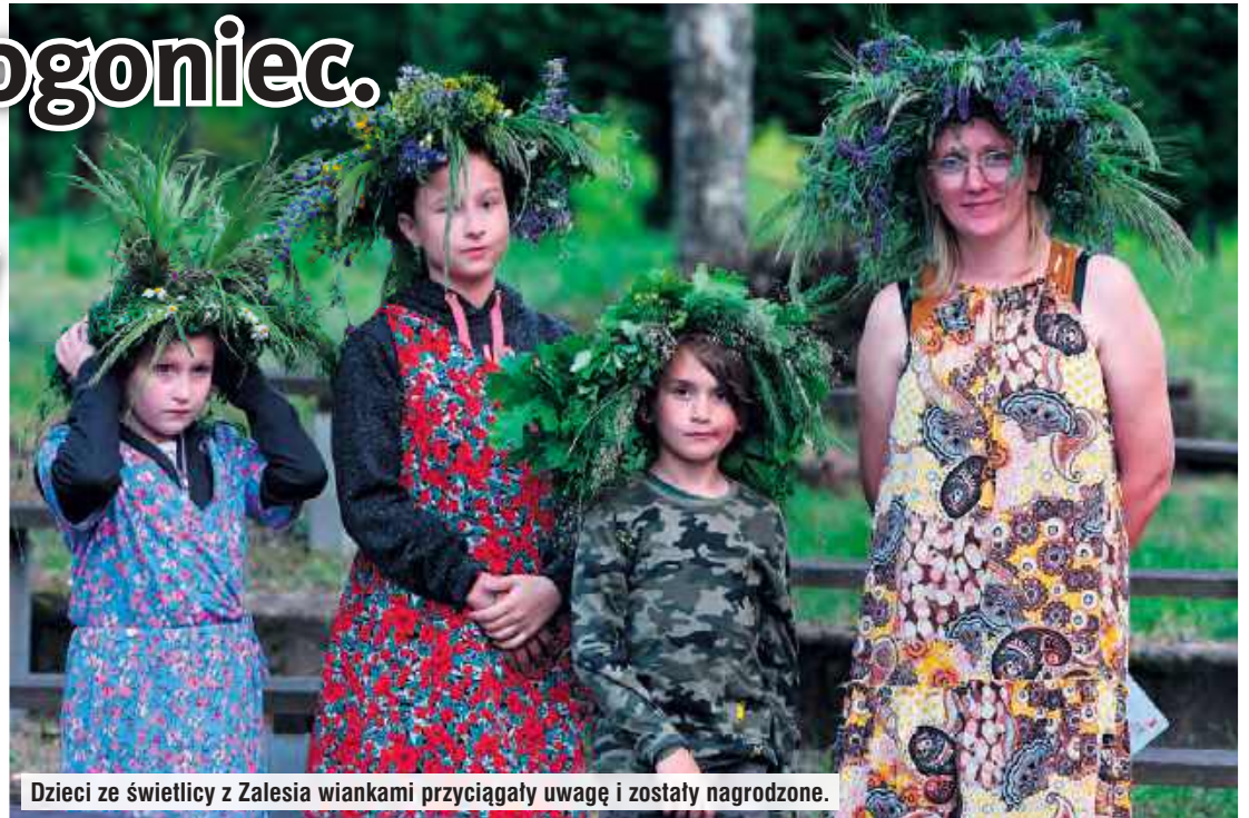
Dzieci ze świetlicy z Zalesia wiankami przyciągały uwagę i zostały nagrodzone.

Spokojna wędrowka z galerii do amfiteatru umiejscowionego nad urokliwym jeziorem to przyjemność, podobnie jak oczekiwanie na rozpoczęcie Świętojańskiego Poezjowania.