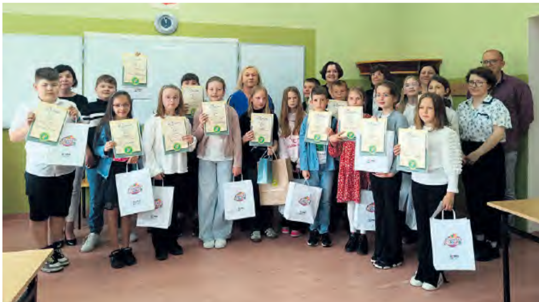
Pamiątkowa fotografia uczestników konkursu wraz z osobami zaangażowanymi w jego organizację i przebieg.