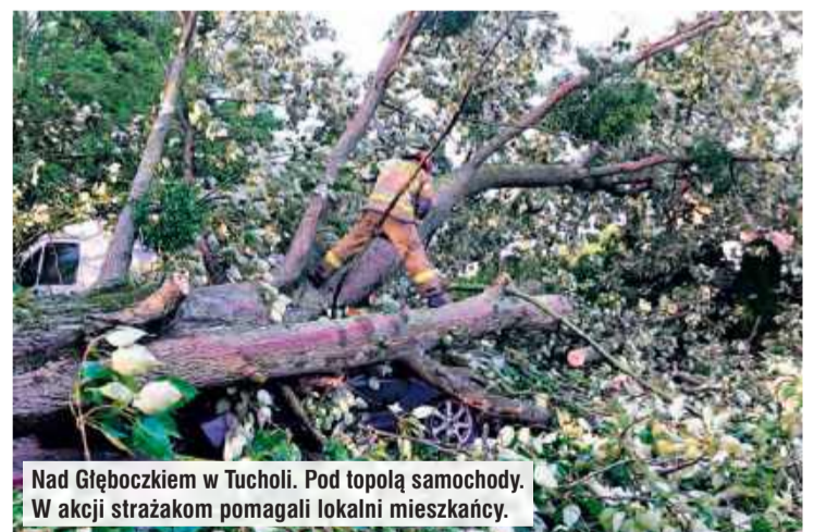
Nad Głębockiem w Tucholi. Pod topolą samochody. W akcji strażakom pomagali lokalni mieszkańcy.