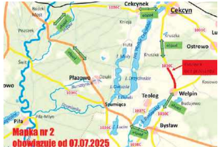
Mapka nr 2 obowiązuje od 07.07.2025 Od 7 lipca (poniedziałek) modernizacja drogi powiatowej rozpocznie się na odcinku od wysokości Leśnictwa Skrajna do Welpina, z tym, że skrzyżowanie do Iwca nadal pozostanie przejezdne.