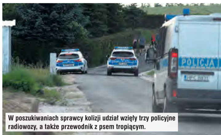
W poszukiwaniach sprawcy kolizji udział wzięły trzy policyjne radiowozy, a także przewodnik z psem tropiącym.

Na miejscu zdarzenia byli świadkowie, którzy wskazali policjantom kierunek, w którym oddalił się kierowca land rovera. W poszukiwaniach udział wzięły trzy radiowozy oraz przewodnik z psem patrolująco-tropiącym. Czworonóg od razu złapał trop. Sprawca kolizji został przez niego odnaleziony niespełna 30 minut później. 48-latek leżał w okolicznym polu.