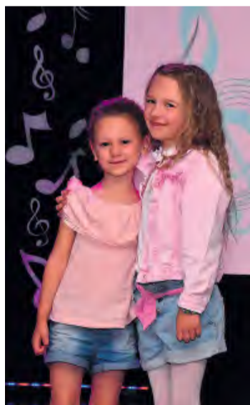
Nie mogło zabraknąć pamiątkowej fotografii na scenie z siostrą.