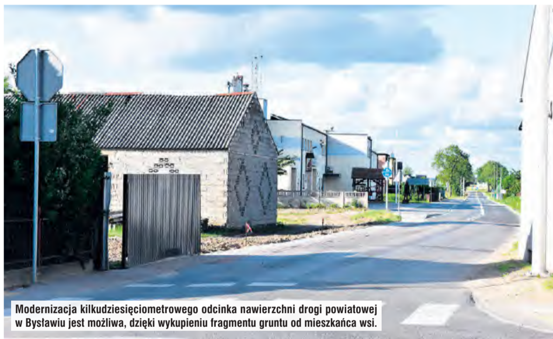
Modernizacja kilkudziesięciometrowego odcinka nawierzchni drogi powiatowej w Bystawiu jest możliwa, dzięki wykupieniu fragmentu gruntu od mieszkańca wsi.