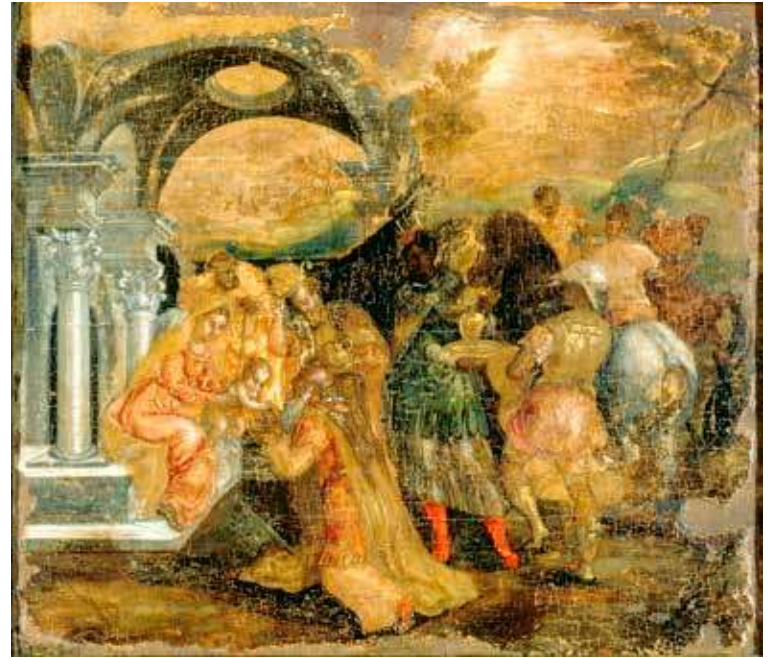
El Greco, Pokłon trzech króli, 1567-1570, olej na desce