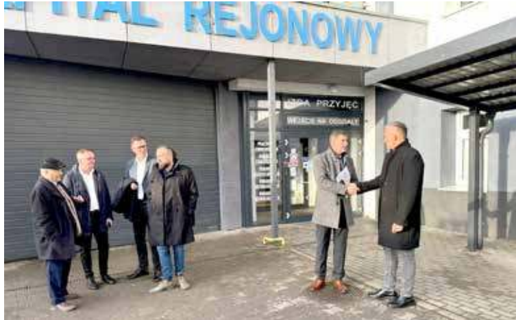
Jeszcze 11 grudnia widzieliśmy uściski dłoni z szefostwem PUM. W nowy rok szpital wchodzi z zamkniętym dwoma oddziałami

- 19 grudnia do Zachodniopomorskiego Urzędu Wojewódzkiego wpłynął wniosek dyrektora SPSR w Nowogardzie o wyrażenie zgody na czasowe, częściowe zaprzestanie działalności leczniczej Oddziału chorób wewnętrznych i Oddziału chirurgii ogólnej od 1 stycznia 2026 r. do dnia 31 stycznia 2026 r. W uzasadnieniu swojego wniosku dyrektor placówki podał niedobór lekarzy specjalistów chorób wewnętrznych zatrudnionych w szpitalu