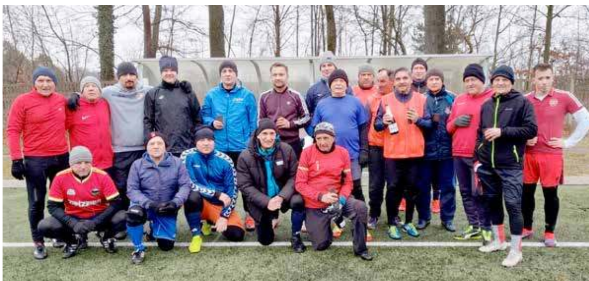
Tradycyjny mecz noworoczny to już tradycja w wykonaniu Bosmana