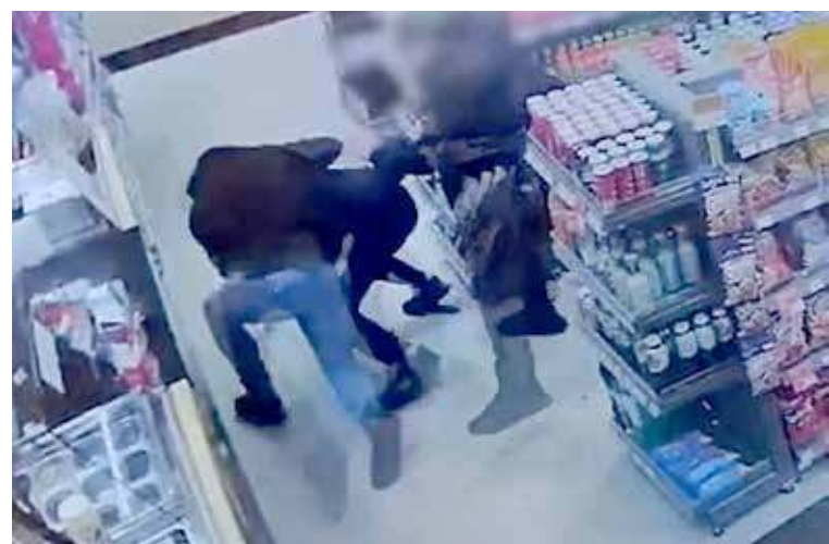
Jednego ze sprawców zatrzymano w sklepie w trakcie wykonywania przez niego zakupów