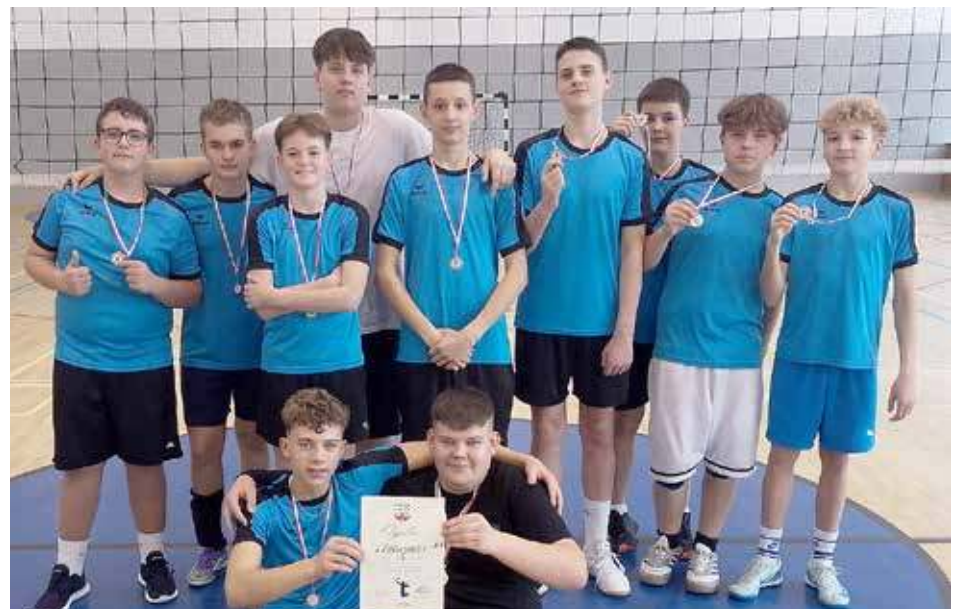
Drużyna chłopców SP nr 1