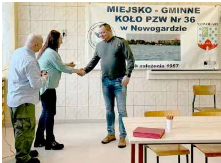
Zebranie zostało przeprowadzone tradycyjnie w sali stołówki szkolnej w SP nr 3