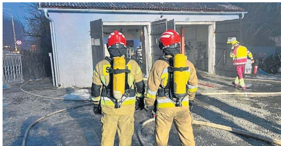
Zgłoszenie o pojawieniu się ognia wpłynęło w niedzielę 22 lutego przed godziną 17:00. Na miejsce natychmiast zadysponowano cztery zastępy straży pożarnej