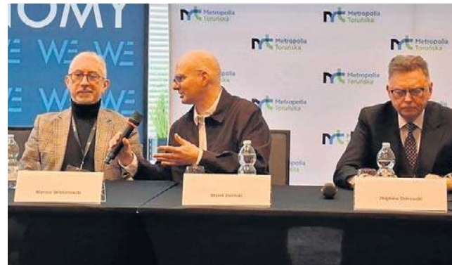
Dyskusje w Hotelu Copernicus odbywały się równoległe w kilku salach

Generał wskazywał na konkretne działania rosyjskich służb w Polsce: penetrację środowisk