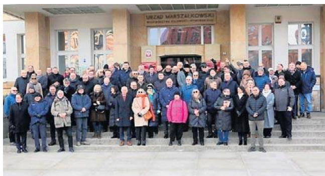
Obchody 45-lecia NZS odbyły się przed gmachem Urzędu Marszałkowskiego i w jego wnętrzu

Pod wmurowaną w fasadę Urzędu Marszałkowskiego tablicą upamiętniającą strajk studencki z 1981 roku uczestnicy obchodów złożyli wiązanek kwiatów oraz wspominali walczących studentów,