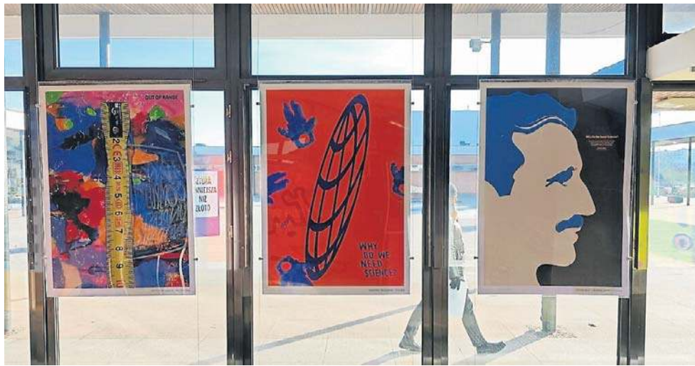
Wystawę można oglądać w Galerii RE na parterze rektoratu UMK w Toruniu

Wernisaz tej międzynarodowej wystawy odbył się 18 lutego, a teraz wszyscy chętni mogą ją oglądać i podziwiać na parterze Rektoratu UMK. Wśród tego międzynarodowego towarzy-