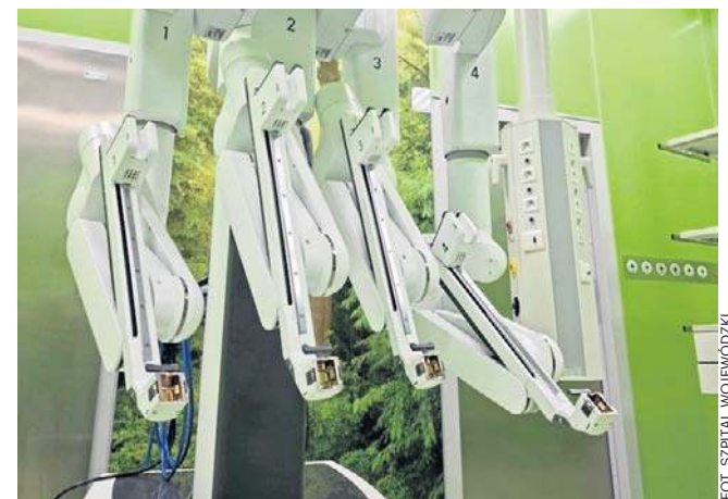
Na początku lutego do włocławskiego szpitala dzięki KPO trafił robot chirurgiczny

Przypomnijmy, że kilka tygodni temu dzięki KPO do Wo-