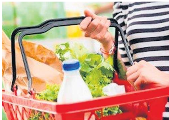
„Lokalna półka” obliguje markety do zapewnienia nie mniej niż 2/3 lokalnych produktów spożywczych

Jego zdaniem, ustawa „Lokalna półka” mogłaby także „wywołać zakłócenia w zabez-