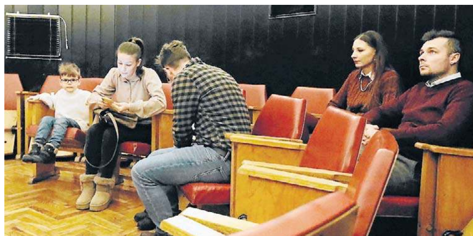
FOT. PIOTR BILSKI