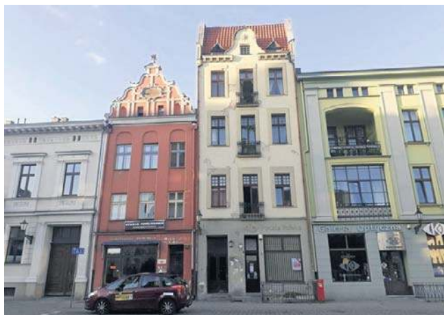
Opuszczony przed laty „warzywniak” przy Rynku Nowomiejskim 23 w Toruniu

Na liście było kilkanaście pomieszczeń - większych i mniejszych, w różnych częściach Torunia. Lista wystawionych na przetarg ofertowy lokali była zatem dość długa, ale ostatecznie - jak właśnie poinformował Zakład Gospodarki Mieszkaniowej w Toruniu - udało się wynająć się tylko dwa lokale.