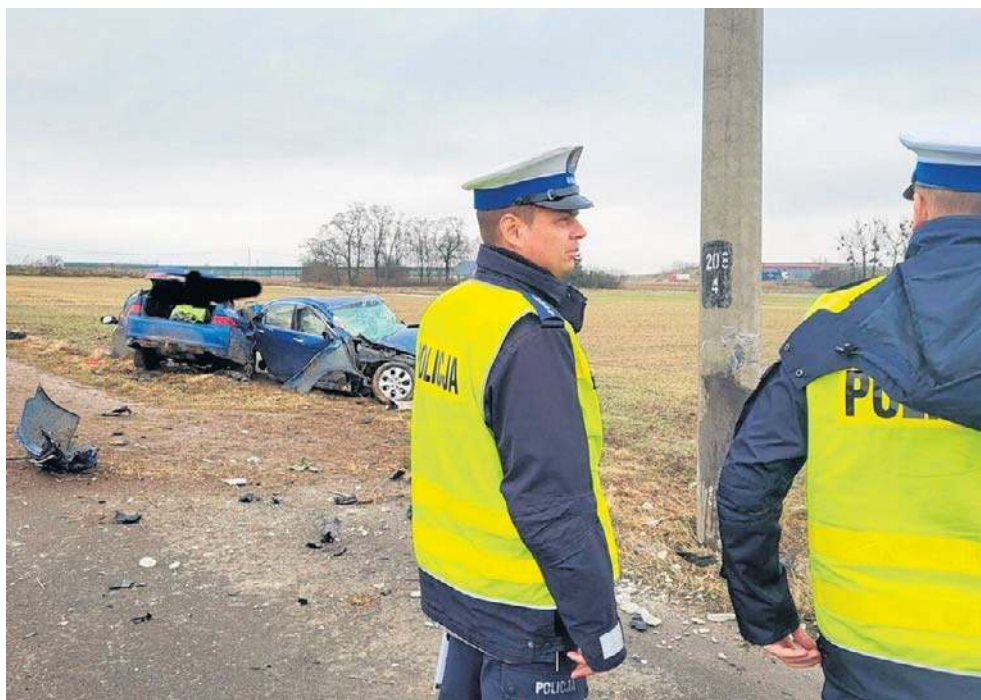
19-latek jadąc hondą z m. Bilno do m. Szewo zjechał na pobocze i uderzył w słup

W działaniach na miejscu wypadku brały udział wyspecjalizowane jednostki ratownicze.