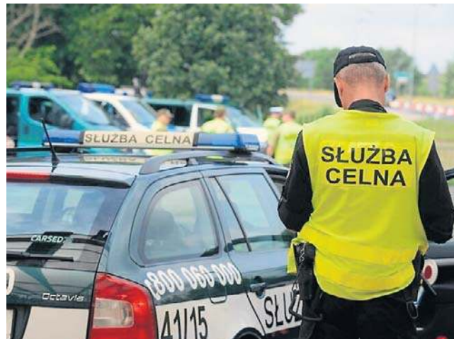
Zaglądamy na konta mundurowych KAS, jak: ekspert Służby Celno-Skarbowej czy kierownik działu

Uposażenie zasadnicze przewidziane dla zajmowanego stanowiska pracy, dodatek za stopień służbowy, za psa oraz dodatek funkcyjny ustala się z zastosowaniem mnożnika kwoty ba-