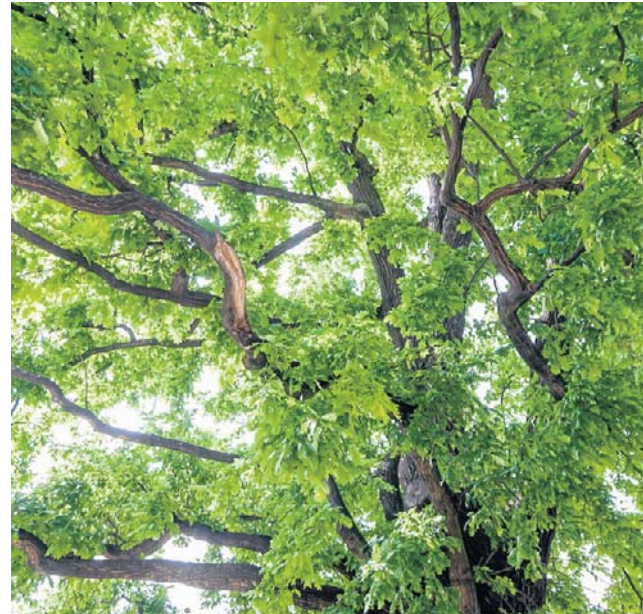
Zielone projekty są chętnie zgłaszane do BBO, ale często przegrywają z innymi projektami

Wyodrębnienie specjalnej puli środków na zielone projekty nie jest nowym pomys-