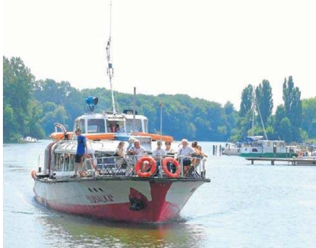
Przed „Rusałką” kolejny pracowity sezon turystyczny na Goplu. Warto pamiętać, że statek ma już 66 lat

To oznacza, że kultowa jednostka będzie pływać