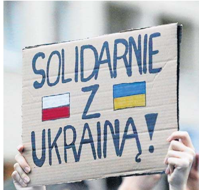
Rok temu pod pomnikiem Mikołaja Kopernika odbyła się demonstracja solidarności z narodem ukraińskim