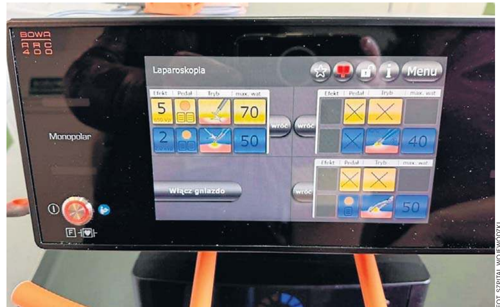
Praktycznie co kilka dni szpital wojewódzki wzbogaca się o kolejny sprzęt

Oddział Położniczo-Ginekologiczny został wyposażony w nowoczesną diatermię chirurgiczną o wartości blisko 160 tys. zł. Urządzenie wykorzystuje prąd o wysokiej częstotliwości do wycinania zmienionych tkanek oraz koagulacji naczyń krwionośnych. Dzięki precyzyjnej regulacji parametrów pracy ogranicza uszkodzenie tkanek sąsiednich, zmniejsza