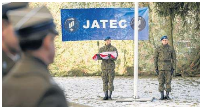
JATEC osiągnęła gotowość operacyjną w lutym 2025

Na uroczystości w Bydgoszczy była wtedy Olha Stefaniyszyna, wicepremier Ukrainy. Pytana o przyszłość współpracy Ukrainy z NATO, mówiła: - Myślę, że częściowo odpowiedź na to pytanie jest moja obecność dzisiaj tutaj. To ma znaczenie - mówiła Olha Stefaniyszyna. - Jestem bardzo szczęśliwa, że tu jestem, widząc tu was wszystkich. Wcześniej tylko wyobrażaliśmy sobie tę instytucję, kiedy powstawała „na papierze”, kiedy zapadała decyzja o jej powołaniu na szczycie waszyngtońskim.