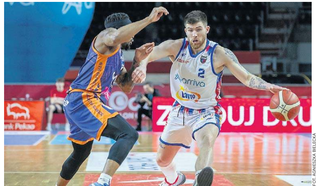
FOT. AGNIESZKA BIELECKA

Brak wzmocnień i ewentualna absencja Persons oznaczają, że trudno będzie nawiązać rywalizację o play in. Na szczęście drużyna ma pięć zwycięstw przewagi nad ostatnią drużyną w tabeli na dwanaście kolejek przed końcem. ©