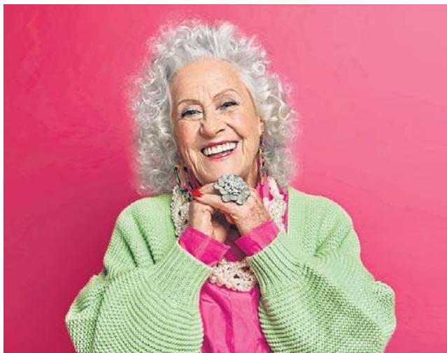
Na trzecim miejscu w rankingu znajduje się emerytka z Bydgoszczy, która otrzymuje najwyższą kobiecą emeryturę

Kolejne miejsca w zestawieniu zajmują emeryci z Opolszczyzny (38 293,70 zł brutto), Wielkopolski (37 527,62 zł brutto), Pomorza (36 625,81 zł brutto), Łódzkiego (36 289,00 zł brutto), Małopolski (35 695,23 zł brutto), Dolnego Śląska (35 341,45 zł brutto), Lubelszczyzny (34 708,34 zł brutto),