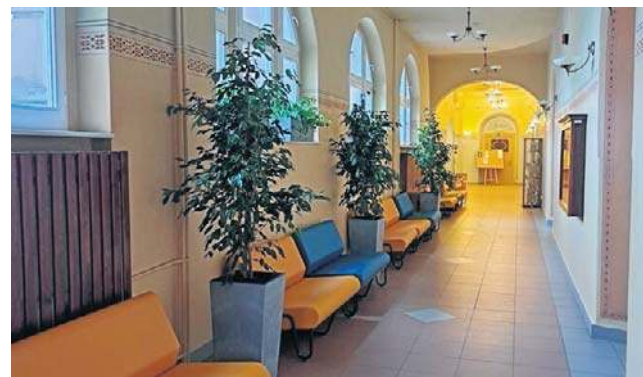
Tak obecnie prezentują się korytarze w VI Liceum Ogólnokształcącego w Bydgoszczy

Szkoła postanowiła nie tylko zadbać o zieleni, ale też o zakup