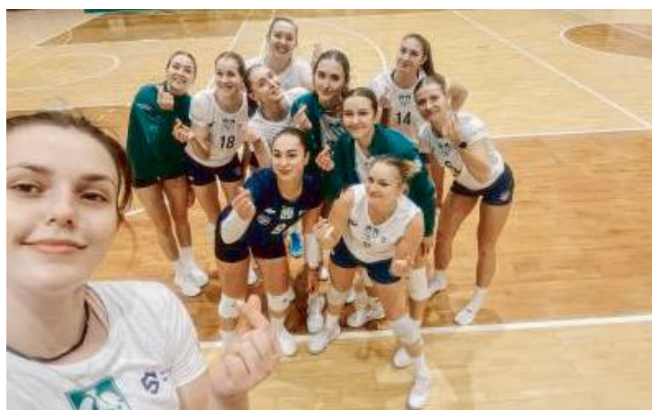
To niesamowity sukces dla siatkarek Uws!

Stoimy na stanowisku, że uniwersytet to nie tylko kształcenie i badania naukowe, ale również kreowanie postaw moralnych, wskazywanie i inspirowanie do osobistego rozwoju i samorealizacji. W tym duchu, Uniwersytet w Siedlcach od wielu lat tworzy otwartą przestrzeń, gdzie wszyscy zainteresowani mogą pogłębiać swoją wiedzę i rozbudzić ciekawość świata. Dotyczy to zarówno najmłodszych w ramach Uniwersytetu Dziecięcego, jak i "trochę starszych" mieszkańców miasta, których od wielu lat zapraszamy na Uniwersytet Otwarty.