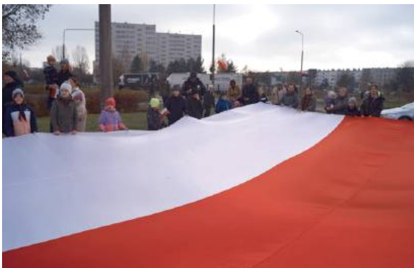
Przemarsz z białą-czerwoną flagą.

Kolejnym punktem obchodów był uroczysty przemarsz ulicami Bolesława Chrobrego i Władysława Broniewskiego na Plac Wolności. Tam, w podniosłej atmosferze, rozpoczęto główne uroczystości od wspólnego odśpiewania hymnu państwowego. Następnie przemó-