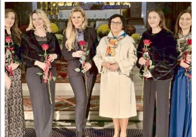
Wspaniale wykonawczynie koncertu przyjęły podziękowania

Licznie zgromadzona publiczność hojnie i długo oklaskiwała mistrzowskie wykonanie najpiękniejszych „Ave Maria” kompozycji Gomeza, Gounoda, Cacciniego, Lorenca. Organizatorami wydarzenia była Konkatedralna Parafia Rzymskokatolicka pw Niepokalanego Serca NMP w Sokołowie Podlaskim, Stowarzyszenie Edukacyjne Ziemi Węgrowskiej oraz Samorząd Województwa Mazowieckiego. Partnerem koncertu było Miasto Sokołów Podlaski. MAT.INF.