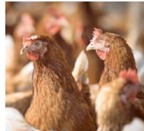
Mieszkańcy Dąbrówki Niwki nie chcą kurników za płotem. Uważają, że fermy powinny być oddalone od domów.

Mieszkańcy nie czekają bezczynnie. Pukają do wszystkich drzwi, proszą o pomoc i szukają wsparcia, by zatrzymać budowę fermy, która zagrozi ich codziennemu życiu. „Kto chciałby mieszkać tuż obok fermy drobiu? Przecież nasze domy powstały tu wcześniej!” – mówią. „Gdybyśmy wiedzieli, co się szykuje, nie zdecydowalibyśmy się na życie w tym miejscu”. Uważają, że ich obawy są zupełnie