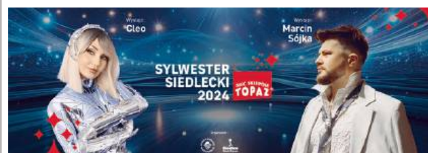
Sylwester miejski wraca po kilku latach przerwy.

Po kilku latach przerwy sylwester miejski w Siedlcach powraca na plac gen. Sikorskiego, a mieszkańcy będą mieli okazję świętować Nowy Rok w wyjątkowym towarzystwie.