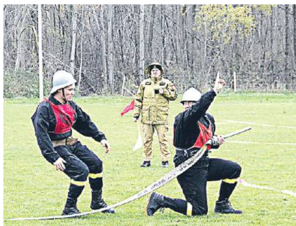
Zespoły konkurowały w sztafecie pożarniczej i ćwiczeniach bojowych.

Zespoły konkurowały w dwóch konkurencjach - sztafecie pożarniczej 7x50 m z przeszkodami i ćwiczeniach bojowych. Nad poprawnością przeprowadzonych zawodów czuwała komisja sędziowska z Państwowej Straży Pożarnej w Łukowie. Przewodniczył jej starszy kapitan Łukasz Osiak. W klasyfikacji generalnej wśród męskich drużyn pierwsze miejsce przypadło w udziale Ochotniczej Straży Pożarnej z Woli Gułowskiej przed jed-