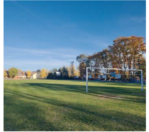
Boisko trawiaste gotowe na nowe rozgrywki

pewniając mu pielęgnację oraz gruntowną regenerację nawierzchni. Wykonano wertykulację, aerację, nawożenie i piaskowanie, a w miejscach najbardziej zniszczonych dosiano trawę lub ułożono darń z rolki. Boisko jest teraz regularnie koszone i odchwaszczane, aby utrzymać jego wysoką jakość