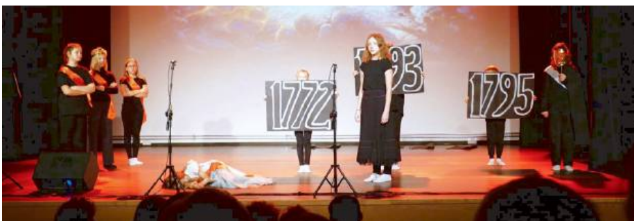
Grupa teatralna ŁDK przygotowała patriotyczny program artystyczny.