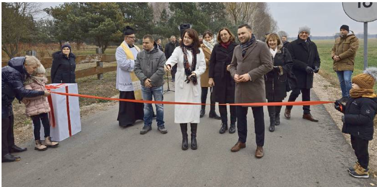
Przebudowa dróg została dofinansowana ze środków budżetu województwa mazowieckiego.

Dwa zadania inwestycyjne polegające na przebudowie dróg w Klimontach dofinansowane zostały ze środków budżetu Województwa Mazowieckiego. Całkowita wartość pierwszego odcinka wyniosła ponad 182 tys. zł przy współfinansowaniu w wysokości ponad 91 tys. zł. Wartość drugiego zadania opiewała na kwotę ponad 187 tys. zł, dofinansowanie wyniosło 80 tys. zł. Wykonawcą obu zadań było Przedsiębiorstwo Robót Drogowo-Mostowych