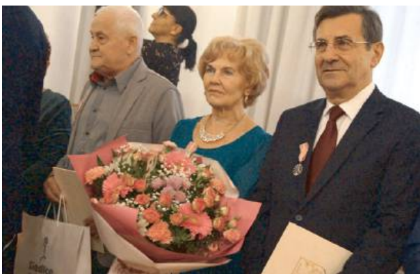
Każda z par otrzymała medal za długoletnie pożycie małżeńskie.

Każda z par została uhonorowana medalem za długoletnie pożycie małżeńskie, nadany przez Prezydenta RP. Odnaczenia wręczyli osobiście gospo-