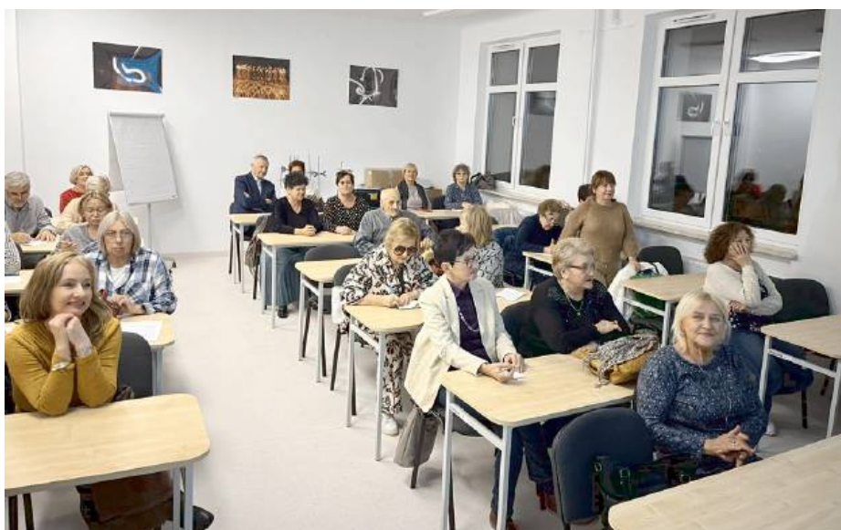
Uniwersytet Otwarty to propozycja dla wszystkich, niezależnie od etapu życia.

Siedlce są najmniejszym miastem w Polsce, które może poszczycić się uniwersytetem klasycznym. To wielka wartość i olbrzymia społeczna odpowiedzialność oraz zaszczytny obowiązek, które Uniwersytet w Siedlcach z pełną świadomością przyjmuje.