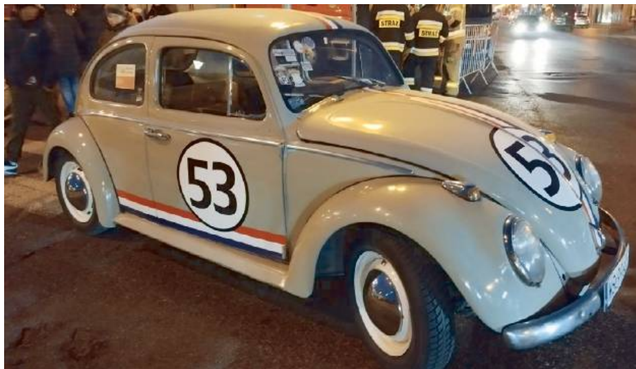
Samochody różnych marek i roczników, różnych gabarytów i kolorów wyruszyły w drogę.

Podziękowania należą się sponsorom wydarzenia: Mal-Pol, ZIS Łuka, KORONTO, INSTALWENT, Centrum Kształcenia Zawodowego w Siedlcach, Zielona Osiedlowa, Instal-Tech, Cem-Hurt, ZUO Siedlce, Marflex, AUTO-ARGO.