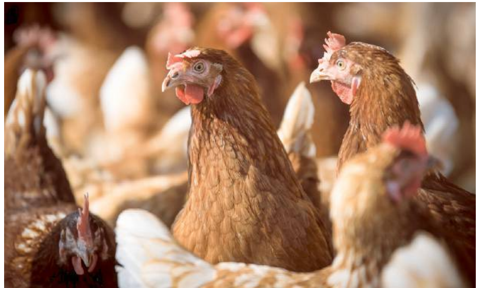
Konflikt nie sprzyja budowaniu dobrych relacji sąsiedzkich.