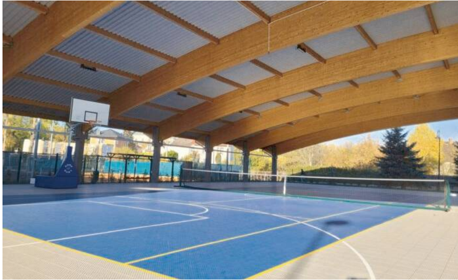
Boisko wielofunkcyjne z nową nawierzchnią

Zadanie pn. „Rozwój lokalnej infrastruktury rekreacyjno-sportowej w Garwolinie poprzez wykonanie wielofunkcyjnej nawierzchni sportowej do streetballu i tenisa ziemnego oraz modernizację trawiastego boiska piłkarskiego”. Ostateczny i rzeczywisty koszt realizacji zadania wyniósł 169.500,00 zł, z czego wysokość dofinansowania to 82.326,14 zł, zaś wkład własny Miasta Garwolina to 87.173,86 zł. Wysokość przyznanego dofinansowania wyniosła stanowi znaczące wsparcie realizacji miejskich inwestycji sportowych.