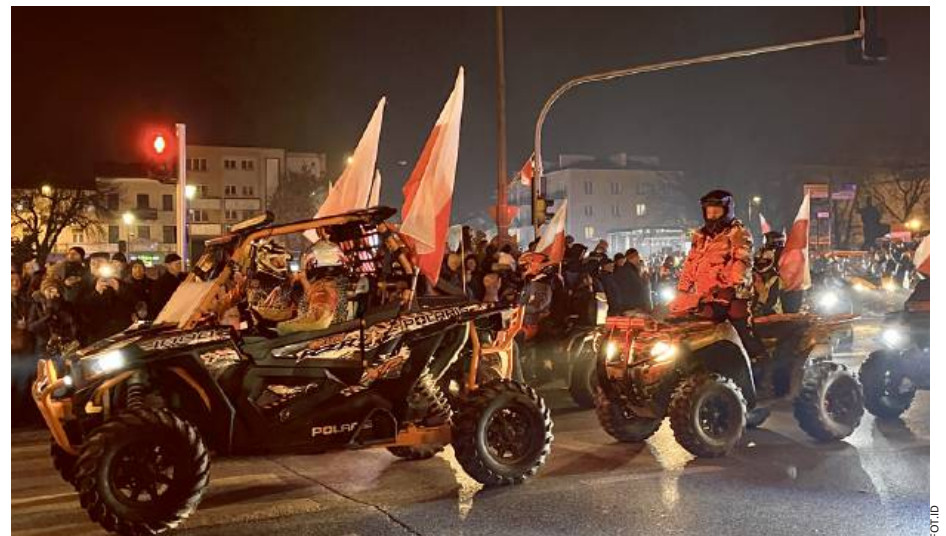
Motocykle, quady, a nawet wozy strażacki przybrane w narodowe barwy dla Niepodległej.