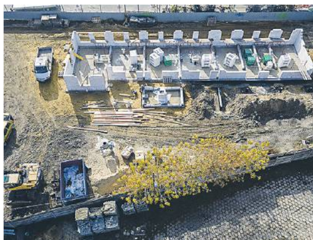
Wykonawca prac rozebrał już stary budynek i uprzątnął gruz z placu budowy. Wykonany został także tzw. stan zerowy budynku.

Obok powstanie 5 kontenerów mieszkalnych wyposażonych w takim samym stopniu, co lokale w bloku. Będą one wykorzystywane w sytuacjach kryzysowych albo jako rozwiązanie tymczasowe. Zagospodarowa-