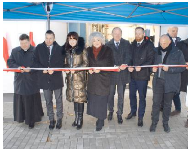
Nowy etap lepszego życia dla mieszkańców.

Po wielu latach funkcjonowania stacja uzdatniania wody wymagała już remontu i gruntownej modernizacji. Sprawa gospodarki wodnej w gminie stała się jednym z priorytetów i trzeba powiedzieć, że zakończyła się sukcesem.