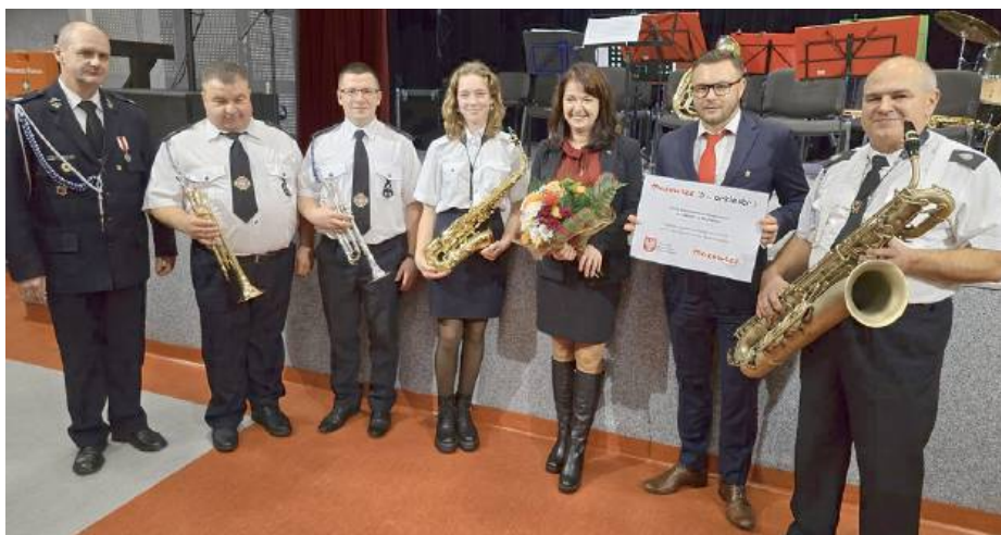
Kolejne punkty programu miały miejsce w Miejsko-Gminnym Ośrodku Kultury w Mordach.