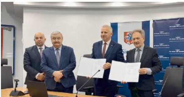
Docelowo powstanie 160 miejsc parkingowych.

Całkowity koszt inwestycji wyniesie około 2,1 miliona złotych, a całość finansować będzie PKP PLK SA. Miasto zobowiązało się do późniejszego utrzymania obiektu. Prace budowlane mają rozpocząć się w styczniu 2025 roku, a ich zakończenie planowane jest na listopad 2025. PA