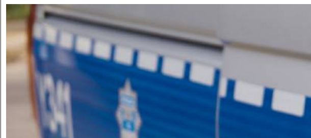
30-latek został osadzony w policyjnym areszcie.

30-latek został osadzony w policyjnym areszcie, skąd trafi do zakładu karnego. Mężczyzna odpowie za niestosownie się do wyroku sądu, za które ustawodawca przewidział karę od 3 miesięcy do 5 lat pozbawienia wolności. KPP ŁOSICE