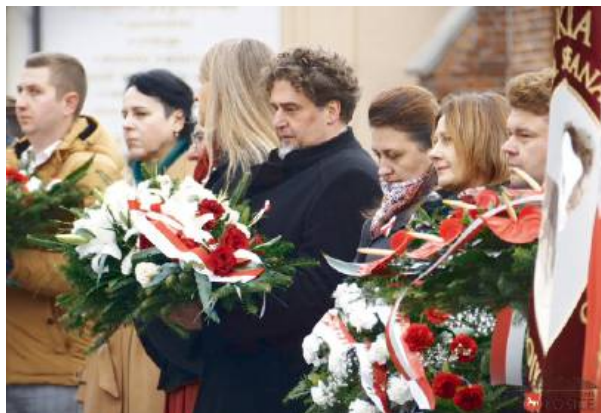
Zebrani udali się pod pomnik Marszałka Józefa Piłsudskiego.