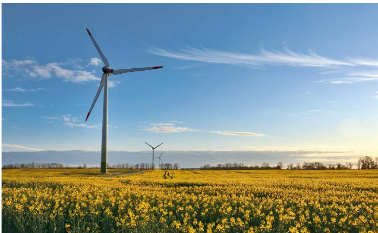
Zielona energia, która opłaca się każdemu. Odnawialne źródła energii wpływają korzystnie na środowisko w skali lokalnej.

O zaletach energetyki wiatrowej mówi się głównie w kontekście tego, że jej wpływ na środowisko naturalne jest dużo mniej-