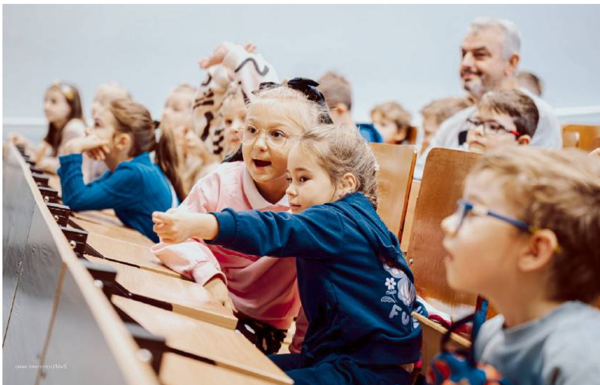
Uniwersytet Dziecięcy to doskonała przestrzeń, by rozbudzić pasję do nauki.