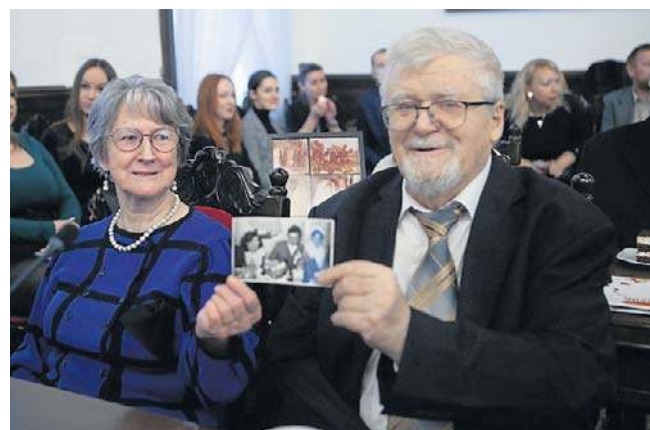
W małżeństwie bardzo ważne jest wsparcie, wiara, nadzieja i miłość - mówią jubilaci z 50-letnim stażem

- Najważniejsze, że jesteśmy we dwojkę. Gdy trzeba coś załatwić, jedno drugiemu pomoże, dopowie, popchnie do przodu. Ważne jest wsparcie, wiara, nadzieja i miłość - to wszystko razem sprawia, że można iść dalej - dodała.