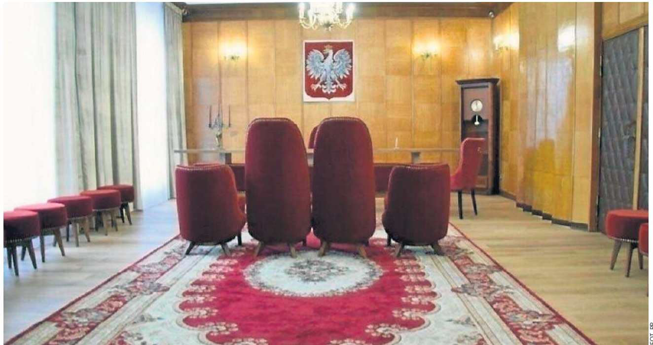
Zmiany w formularzach USC zaskoczyły wiele osób, nie tylko starszych