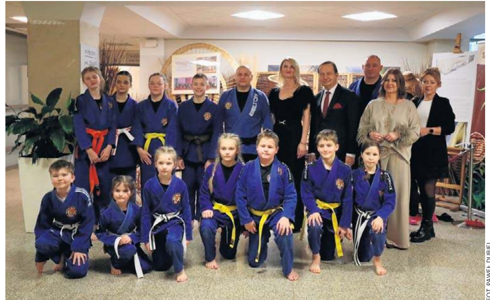
Zawodniczki i zawodnicy ze Szkoły Sztuk Walki „Cobra” mogą trenować bezpłatnie dzięki dofinansowaniu z Funduszy Europejskich