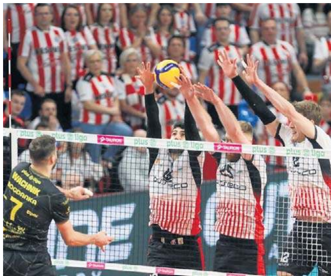
Dobra gra w bloku była jednym z kluczowych elementów, który zdecydował o wygranej Asseco Resovii z Bogdanką

- Dla kibica był to bardzo dobry mecz, z widowiskowymi atakami, mocnymi zagrywkami, z wieloma fajnymi obronami, dotego spektakularne bloki. Cieszy, że Lublin nie był nas w stanie złamać, praktycznie w każdym momencie meczu byliśmy w stanie wrócić - komentował