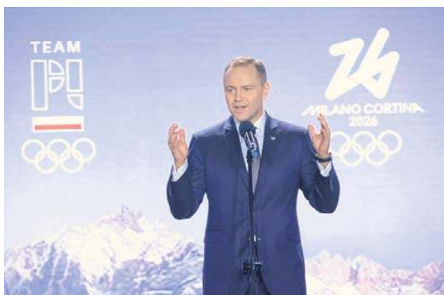
Na uroczystość w PKOl przybył Prezydent Karol Nawrocki, który życzył polskim sportowcom jak najwięcej medali