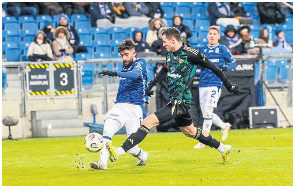
Piłkarze Lecha bardzo krótko cieszyli się z wyrównania w starciu z Lechią

Również w piątek została zdobyta ostatnia ekstraklasowa twierdza - Lubin. Miejscowe Za-