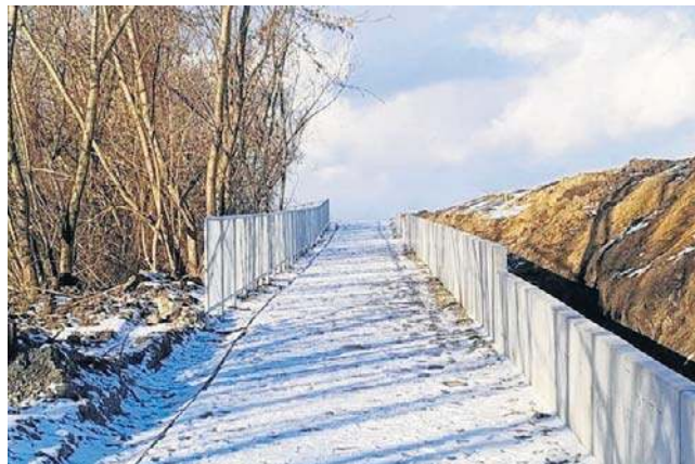
Nowa ścieżka rowerowa rozpoczyna się w rejonie mostu na Sanie. Odcinek ma 2,3 km długości

Odcinek liczy 2,3 km długości oraz 2 metry szerokości. Zdecydowana większość trasy została wykonana z nawierzchni asfaltowej, co znacząco podnosi komfort jazdy. W miejscach wymagających szczególnych rozwiązań, zwłaszcza w rejonie skarp, zastosowano bezpieczną konstrukcję drewnianą - balustrady. Całość harmonijnie wpisuje się w nadrzeczny krajobraz