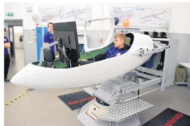
Infrastruktura BCU umożliwi prowadzenie zaawansowanych szkoleń lotniczych i przemysłowych