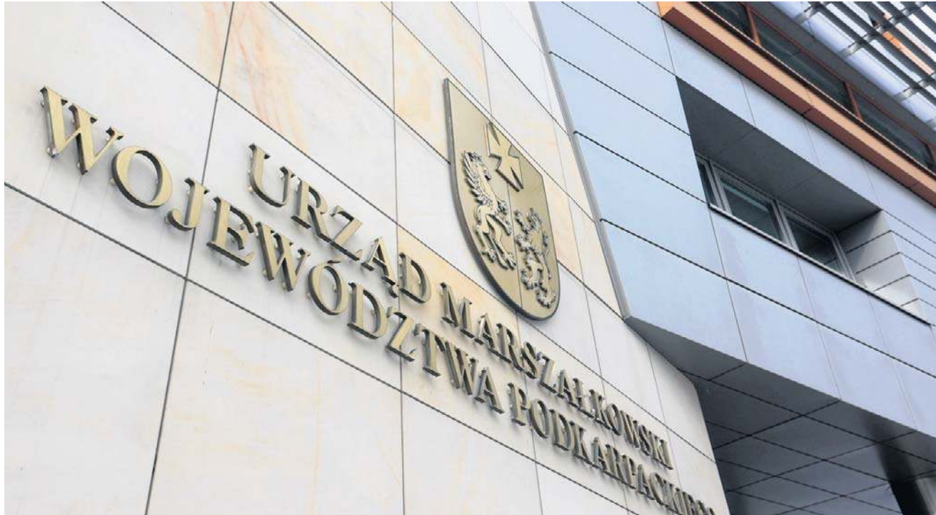
Pracownik Urzędu Marszałkowskiego miał przedłożyć ten poświadczający nieprawdę protokół odbioru końcowego w Polskiej Agencji Rozwoju Przedsiębiorczości

Rzecznik urzędu zapytany przez PAP, czy podejrzany nadal będzie pełnił funkcję dyrektora, odpowiedział, że na obec-