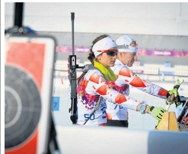
Reprezentanci Polski w biathlonie zajęli podczas weekendu odległe miejsca w ME w Sjusjoen