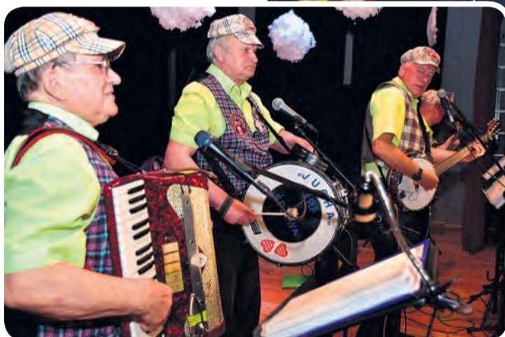
Kapela Jucha bawi publikę już od trzech dekad!