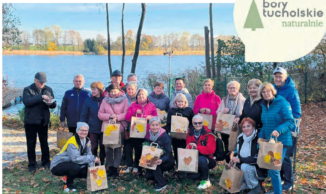
Grupa zadowolonych uczestników rowerowej wyprawy „Za jesiennym liściem”.