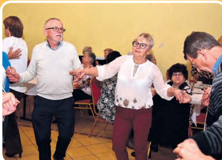
Nie zabrakło też tańca w kółeczku.