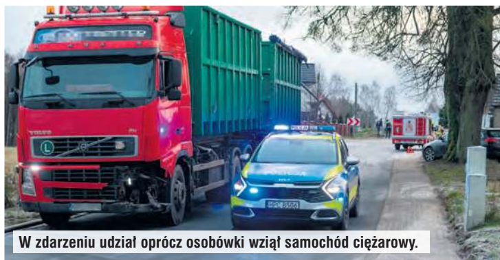
W zdarzeniu udział oprócz osobówki wziął samochód ciężarowy.

czołowego z prawidłowo jadącym pojazdem ciężarowym marki Volvo, którym poruszał się 58-letni mężczyzna (zam. Osie). Uczestnicy posiadają uprawnienia do kierowania i byli trzeźwi. Udzielono pomocy medycznej. Sprawca został ukarany man-