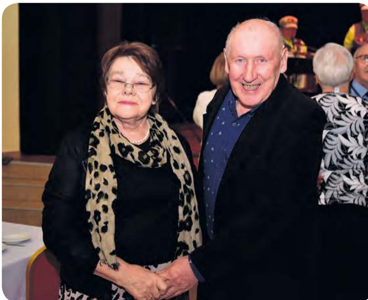
Tego popołudnia uśmiech praktycznie nie schodził seniorom z twarzy.