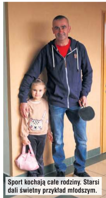
Sport kochają całe rodziny. Starsi dali świetny przykład młodszym.

trzeba było czekać dłużej, ale kto skończył szybciej, mógł kibicować siatkarkom albo grającym w darta czy tenisa stołowego. Po podsumowaniu rywalizacji szachowej dekoracja odbyła się w holi i tam zgromadzono wszystkich uczestników. Wrę-