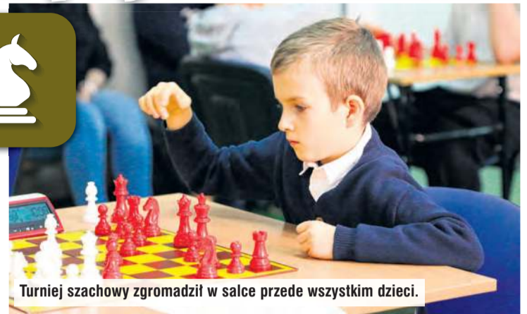
Turniej szachowy zgromadził w salce przede wszystkim dzieci.