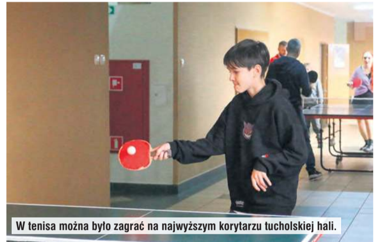
W tenisa można było zagrać na najwyższym korytarzu tucholskiej hali.