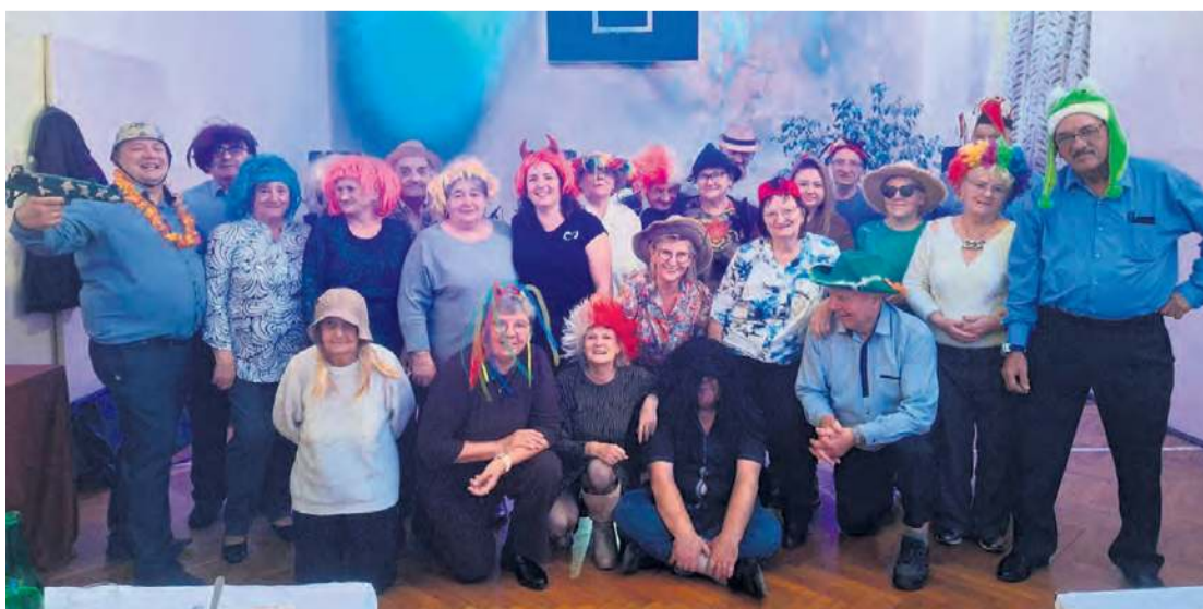
Dzień Seniora w Kamienicy zagościł po raz drugi i z pewnością nie ostatni.