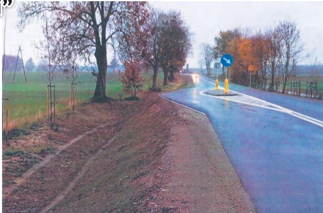
W dolnym lewym rogu, gdzie wykonany jest rów, zauważyć można ślady opon.

oznakowanie poziome grubowarstwowe. Ponadto miejsce to jest z odpowiednim wyprzedzeniem oznakowane znakami [...], które ostrzegają o zmianie przebiegu geometrii drogi [...] – czytamy