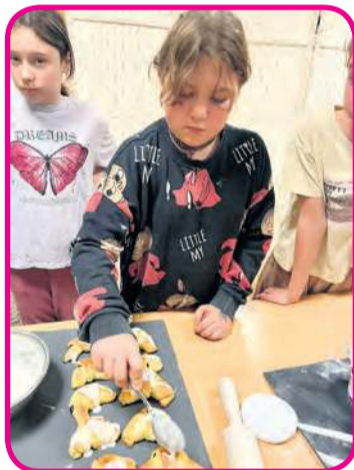
Po darciu pierza przyszła pora na pieczenie pysznych rogalików.

– Zgodnie z tradycją panie gromadziły się kiedyś zimowymi wieczorami, by wspólnie drzeć pierze na poduszki i pierzyny – przy śpiewie, rozmowach i żartach, które umilały długie godzi-