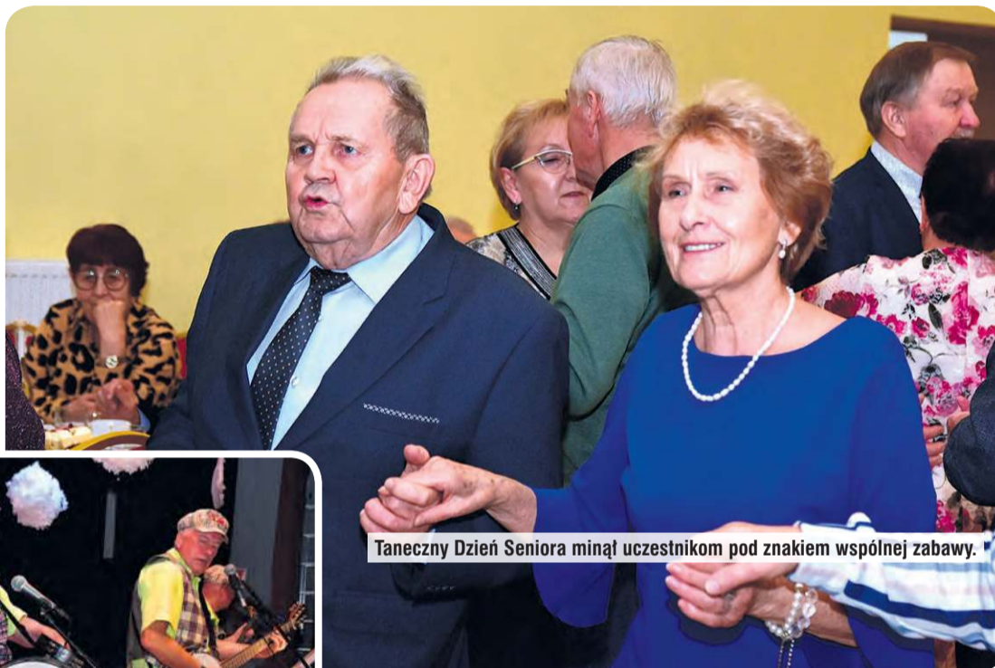
Taneczny Dzień Seniora minął uczestnikom pod znakiem wspólnej zabawy.