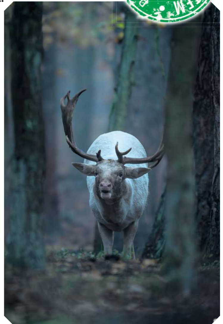
Tegoroczne bekowisko okiem Marcina Ossowskiego.

– Wiedziałem, że do nowej tematyki zdjęć mam zły obiektyw – brakowało zasięgu. Od razu też zacząłem podglądać inne zdjęcia przyrodnicze w internecie – wspomina tucholanin. Rozwój