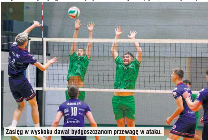
Zasięg w wysokości dał bydgoszczanom przewagę w ataku.