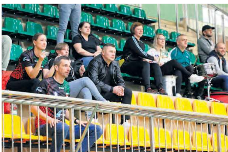
Rodzinny Klub Kibica – najgłośniejszy sektor w każdym meczu.