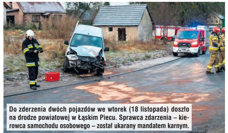
Do zderzenia dwóch pojazdów we wtorek (18 listopada) doszło na drodze powiatowej w Łąskim Piecu. Sprawca zdarzenia – kierowca samochodu osobowego – został ukarany mandatem karnym.

datem karnym – poinformowała Marta Porożyńska z Komendy Powiatowej Policji w Tucholi.