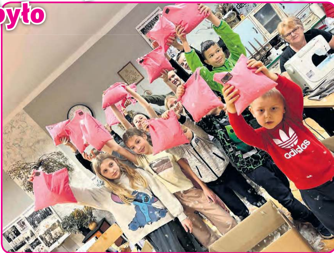
Na własnoręcznie wykonanych jaśkach to dopiero będą sny!