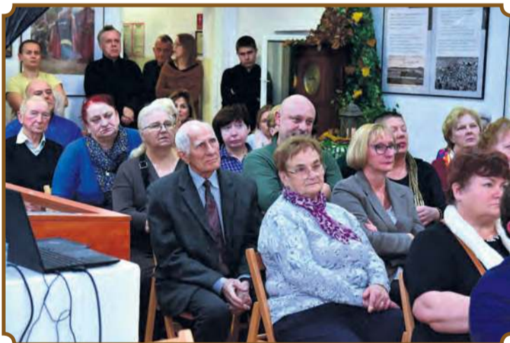
Mieszkańcy przybyli na wystawę z uwagą słuchali wygłaszanych prelekcji. Sami też chętnie zabierali głos.

dowane przez jeńców – głównie żołnierzy niższych stopni. W jednej ziemiance mogło mieszkać około 80 osób. Ich ślady są widoczne w lesie do dziś. Kolejne grupy jeńców wznosiły drewniane baraki, a dla oficerów zbudowano baraki z blachy falistej.