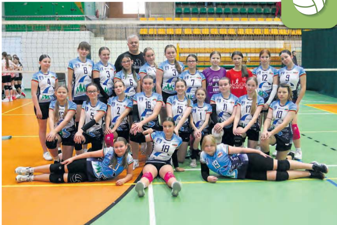
Młodsze dziewczęta pokazały waleczność i radość z każdego punktu.

wyczerpał gospodynie na tyle mocno, że drugiego seta oddały bez walki (9:25). Za to tie-break znów rozgrzał publiczność, bo aż do jedenastego punktu wynik był remisowy. Więcej szczęścia w końcówce miały tucholanki i to one wygrały mecz po trzech setach – w tie-breaku 15:11.