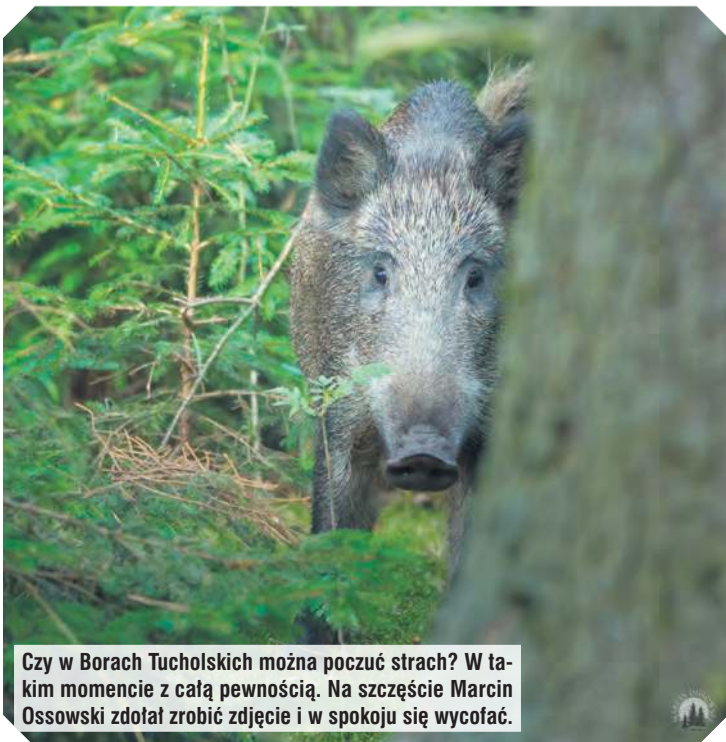
Czy w Borach Tucholskich można poczuć strach? W takim momencie z całą pewnością. Na szczęście Marcin Ossowski zdołał zrobić zdjęcie i w spokoju się wycofać.