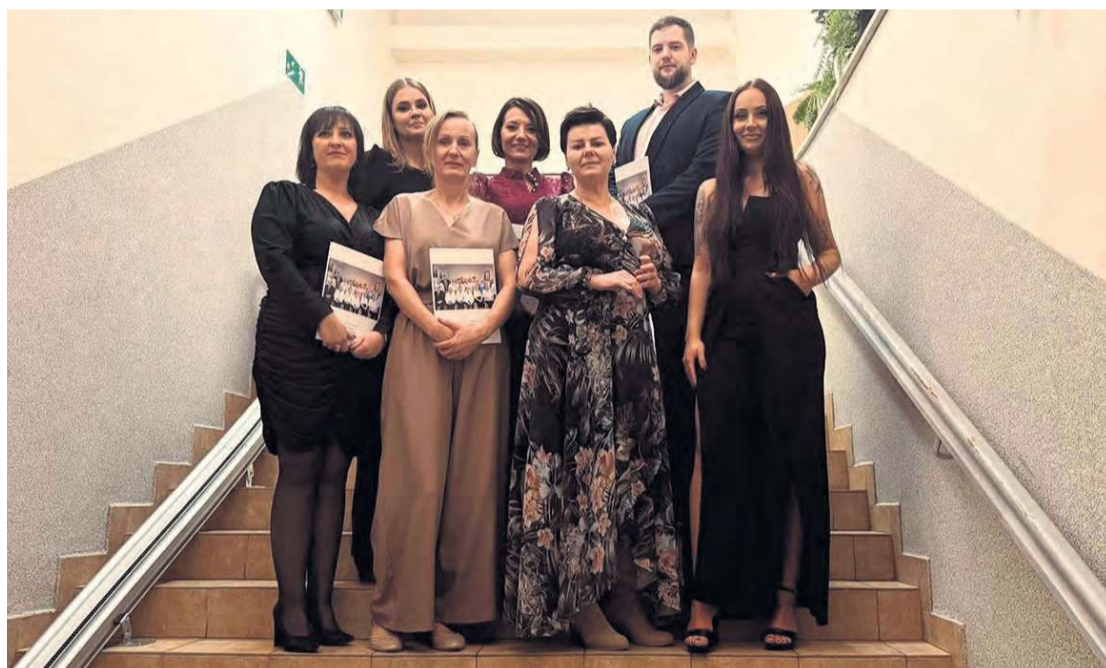
Z okazji jubileuszu obecni i byli pracownicy placówki chętnie stanęli do wspólnego zdjęcia.