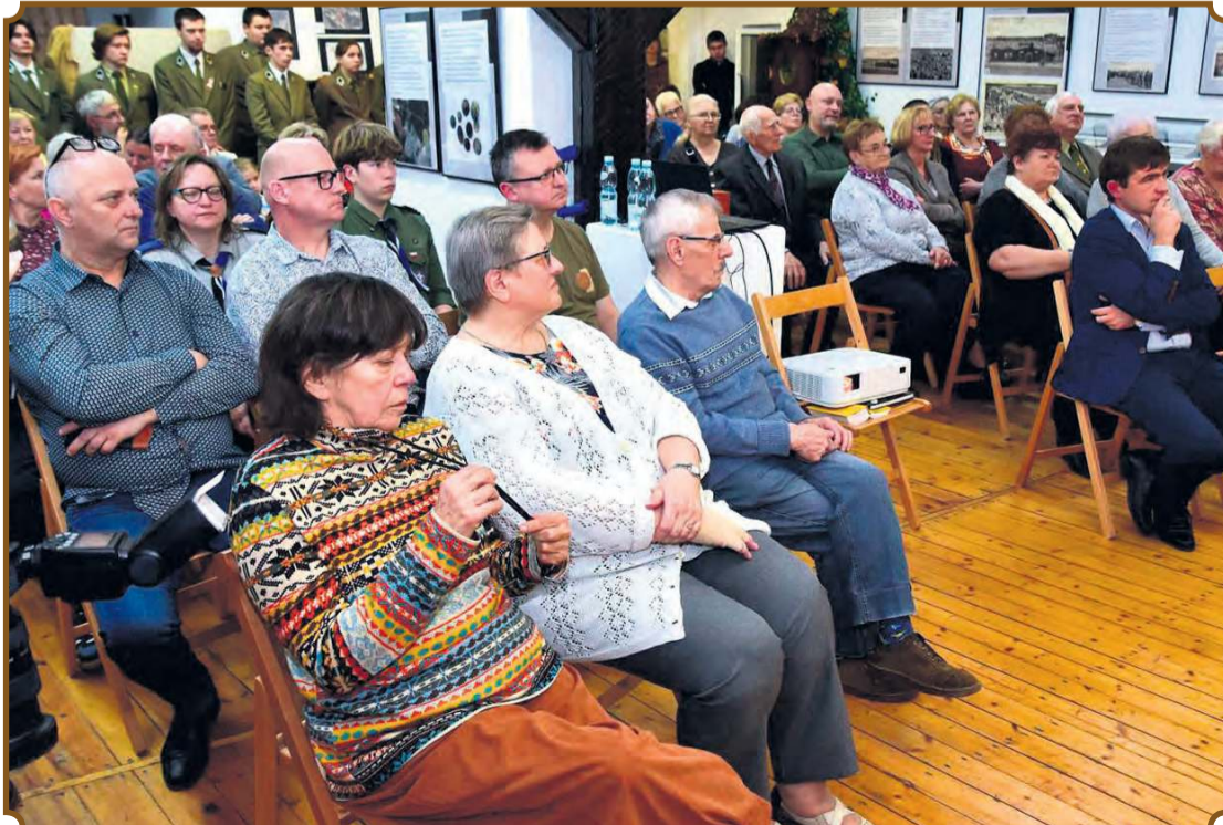
Wydarzenie organizowane przez muzeum spotkało się z ogromnym zainteresowaniem ze strony mieszkańców.