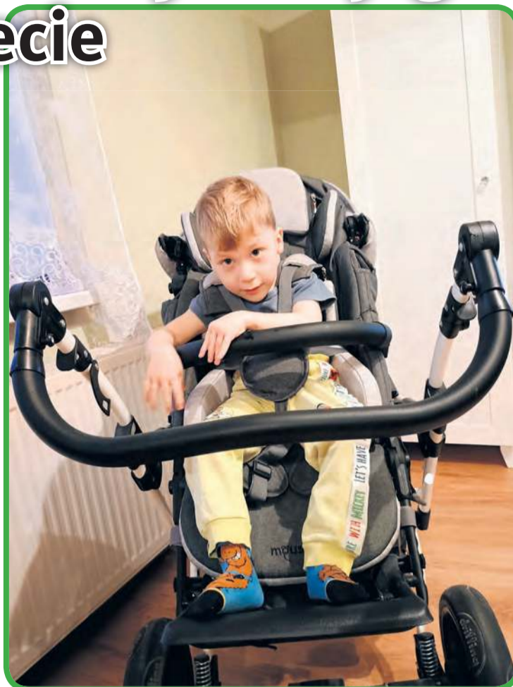
Chłopiec porusza się na spacerach w specjalnym wózku, który utrzymuje jego kręgosłup w prawidłowej, wyprostowanej pozycji.