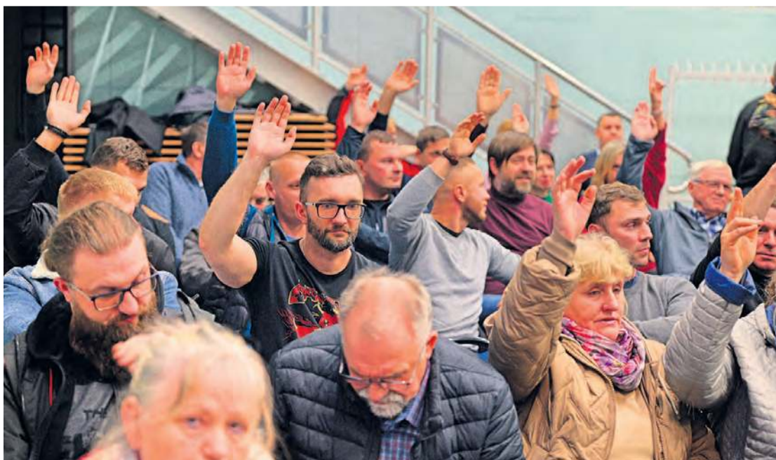
Czwartkowe (13 listopada) zebranie w Cekcynie. Uczestnicy po kolei wygaszali mandaty radnych sołeckich, którzy we wrześniu zrezygnowali ze swoich funkcji.