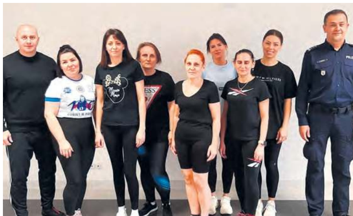
Z zajęć jest i pamiątkowe zdjęcie w towarzystwie instruktora i komendanta.