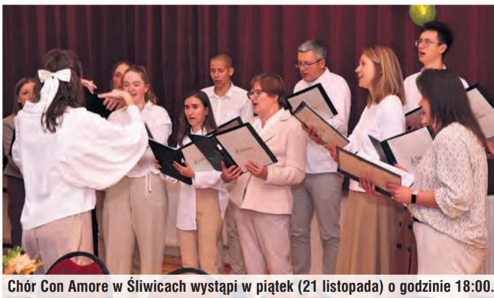
Chór Con Amore w Śliwicach wystąpi w piątek (21 listopada) o godzinie 18:00.

W piątek chór Con Amore z Suchej (gmina Lubiewo) zagości w śliwickim domu kultury.