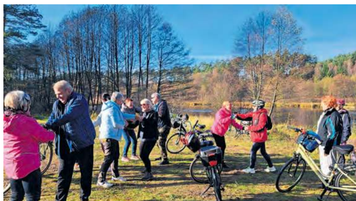
Chwila przerwy w możliwie najpiękniejszych okolicznościach przyrody.