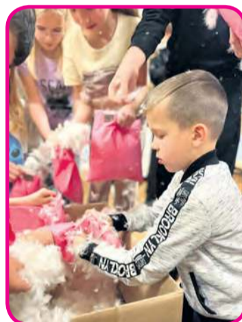
Chłopcy z ogromną werwą przystąpili do darcia pierza.

– Dzieci dowiedziały się między innymi: jaką rolę odegrały gęsi