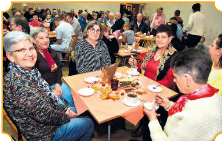
Przy kawie, ciastku i doborowym towarzystwie. Właśnie tak mieszkańcom Wielkiej Kloni minął poniedziałkowy wieczór.