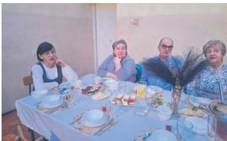
Niedziela w Kamienicy upłynęła pod znakiem wspólnej zabawy i rozmów.