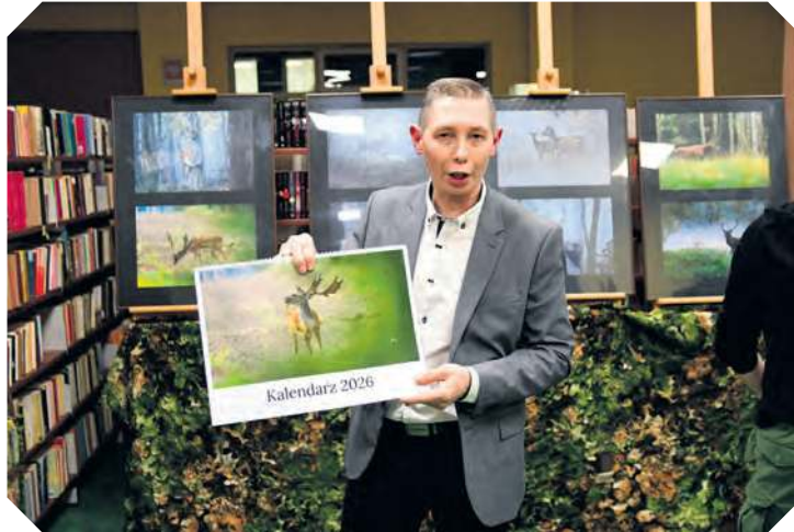
Fotograf przyrody przygotował kalendarz ze zdjęciami swojego autorstwa. Aby go nabyć, należy skontaktować się bezpośrednio poprzez profil na Facebooku: Fotografia przyrodnicza Marcin Ossowski.

– Moim pierwszym „zleceniem” fotograficznym były zdjęcia w związku z pogrzebem, konkretnie różańcem – przynajmniej