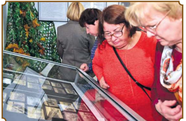
W wystawowych gablotach znalazły się m.in. obozowe pocztówki z kolekcji Zenona Wędzickiego .

– Jego infrastruktura była mocno zniszczona – tylko 13 baraków z blachy i 24 ziemianki