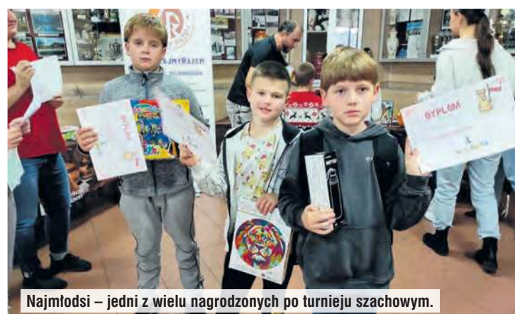
Najmłodszy – jeden z wielu nagrodzonych po turnieju szachowym.