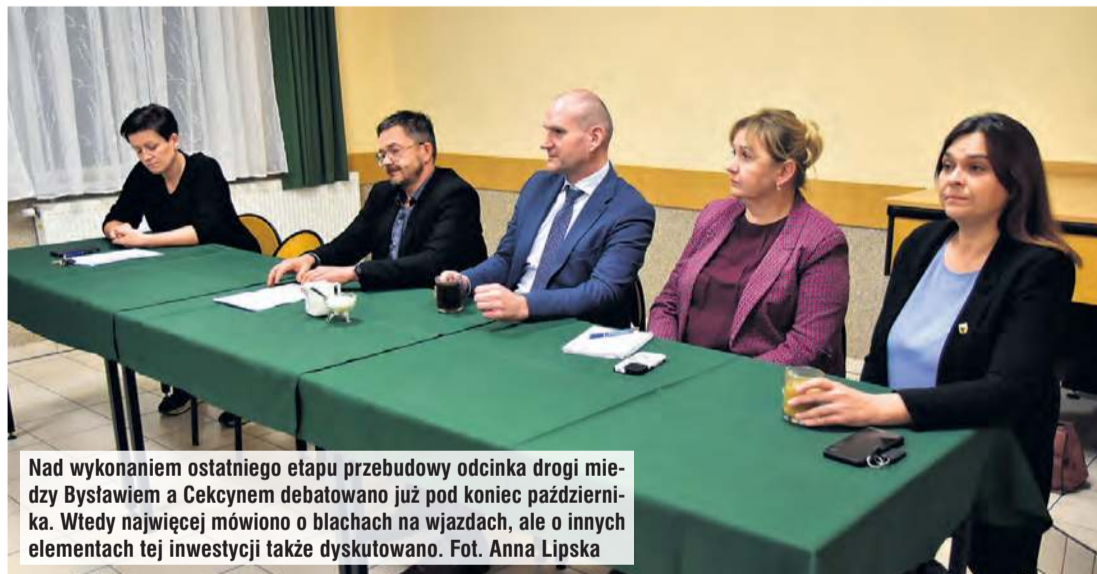
Nad wykonaniem ostatniego etapu przebudowy odcinka drogi między Bysławem a Cekcynem debatowano już pod koniec października. Wtedy najwięcej mówiono o blachach na wjazdach, ale o innych elementach tej inwestycji także dyskutowano.