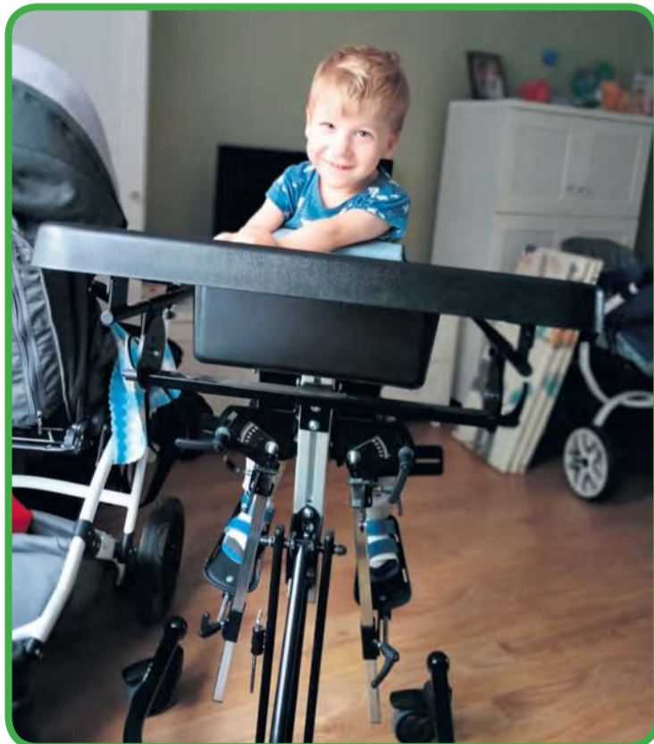
Codziennosc małego mieszkańca Pamiętowa obejmuje także korzystanie z pionizatora.

rehabilitacja będzie musiała być jednak jeszcze bardziej intensywna ze względu na planowaną w czerwcu we Włoszech fibrotomię. Ten mało inwazyjny zabieg, polegający na podskórnym przecinaniu włókien mięśniowych, pomaga w leczeniu przykurczy. Koszt zabiegu to 4200 euro, a do tego należy doliczyć koszty dojazdu i pobytu. Po kilku tygodniach od operacji konieczne będzie zwiększenie godzin rehabilitacji.