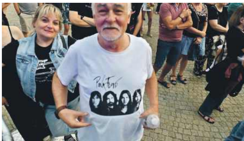
Fani Pink Floyd mieli sporo uciechy

Zanim jednak zaprezentował się jej ulubieniec, sceną zawładnęła kapela Raszones85, a więc Laureat Przeglądu Zespołów Muzycznych Bytom Live Music: Zagrał też zespół Another Pink Floyd oddający muzyczny hołd