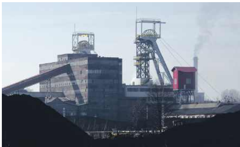
Zgodnie z planem ostatnia bytomska kopalnia ma zakończyć fedrowanie 31 grudnia

Ale wszystko zmieniło się po tragicznym wypadku, w którym zginął górnik. Uznano, że nie można zagwarantować pozostałym górnikom bezpieczeństwa i przesunięto termin zakończenia działalności na koniec roku 2025. Wraz z początkiem roku następnego właściciel zakładu, a więc spółka Węglokoks Kraj powinna rozpocząć proces likwidacji. Górnicy – w sumie pracuje ich