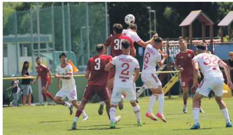
W sparingu Polonii Bytom i Ružomberoka goli nie oglądaliśmy

Natomiast w sobotnie przedpołudnie bytomianie rozegrali drugi mecz kontrolny i bezbramkowo zremisowali w nim z MFK Ružomberok,