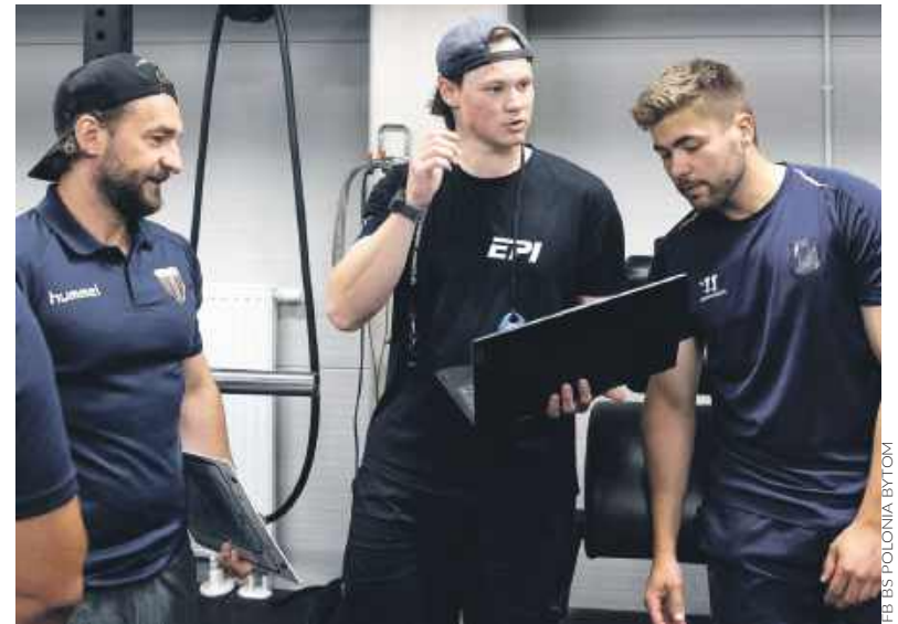
Hokeiści sprawdzali swoje możliwości

Hokeiści bytomskiej Polonii intensywnie przygotowują się do sezonu, który po wykupieniu dzikiej karty spędzą w ekstraklasie, a więc w THL.