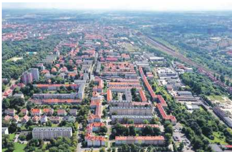
Bytom podobnie jak wiele samorządów musi walczyć o stabilizację finansową