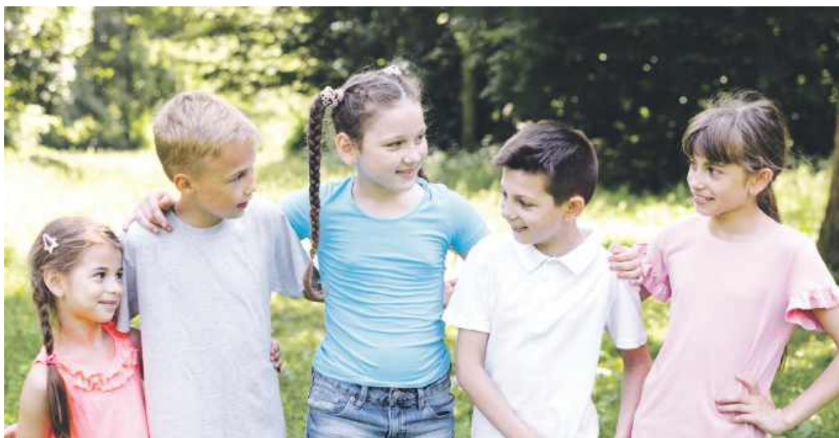
Jedno jest pewne: na półkoloniach organizowanych przez kluby BSM dzieci się nie nudzą

Co zatem czeka uczestników półkolonii odbywających się w pierwszym z klubów, a więc Sezamie przy ul. Chorzowskiej? Dzieci mają w planie między innymi wyjścia na bytomski basen otwarty w parku miejskim, wyjazd do parku linowego, czy do kina na atrakcyjny pokaz filmowy. Wielkim wydarzeniem powinien być rejs jachtem po jeziorze pław-