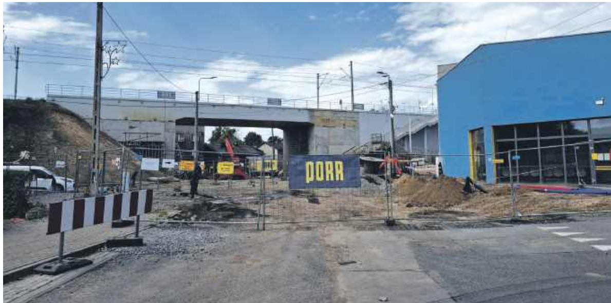
Tak obecnie wygląda plac budowy

Początkowo wykonawca zadania, a więc firma PÓRR zapowiadał, że potrzebuje na wszystko około cztery miesiące. Ale życie bardzo szybko zweryfikowało te plany. Okazało się, że budowa została zrobiona solidnie, jest masywna i pełno w niej zbrojenia, a w efekcie stawia opór ciężkiemu sprzętowi. Zaczęło się więc od przesunięcia