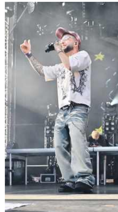
Miejsce tuż przy scenie - rzecz bezcenna