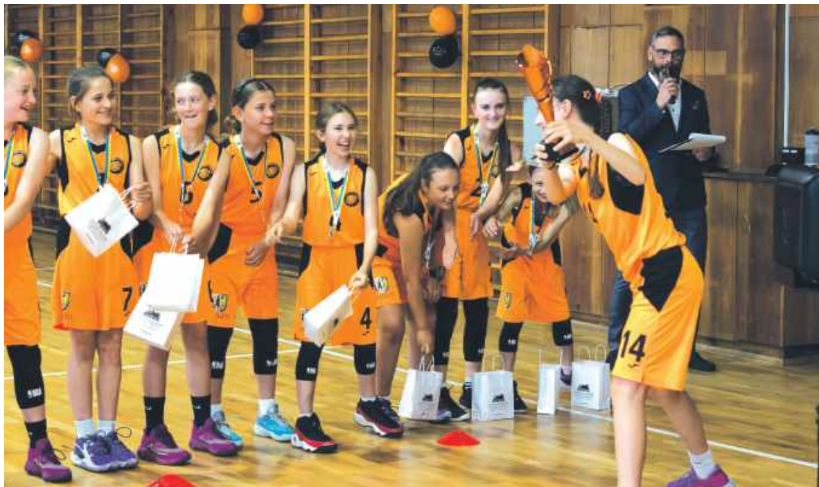
Dziewczyny z rocznika 2013