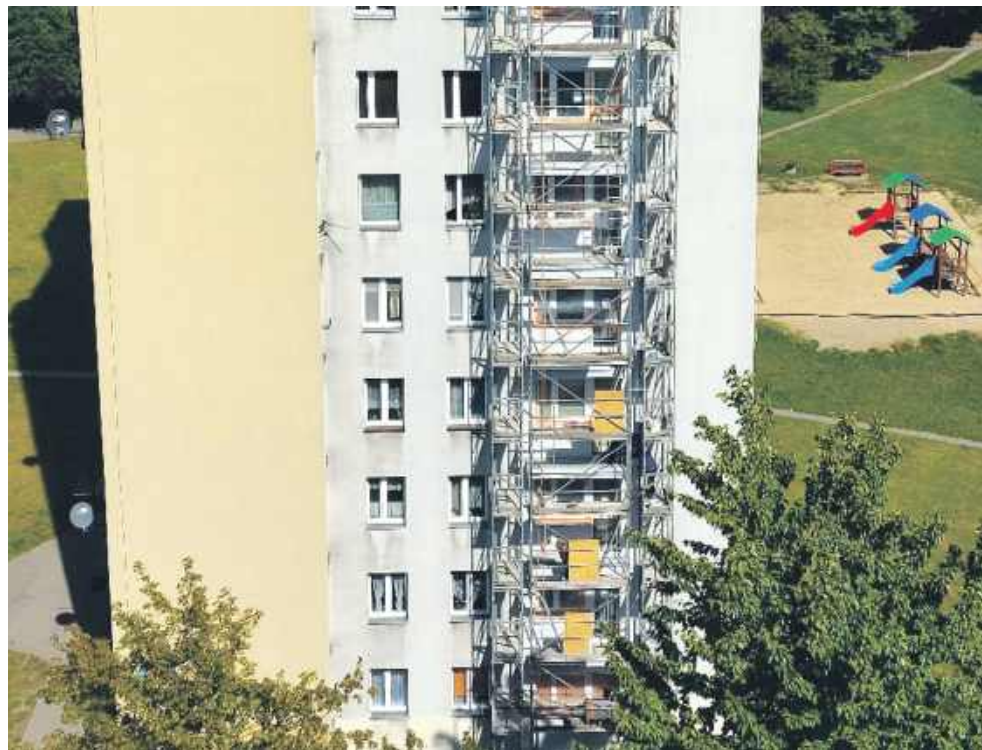
Nowe balkony zwiększą estetykę i bezpieczeństwo

Dzieje się też na terenie zarządzanym przez Administrację nr 5. W minionym roku kontynuowano tam prace związane z kompleksowym remontem balkonów. Połączono je z wymianą