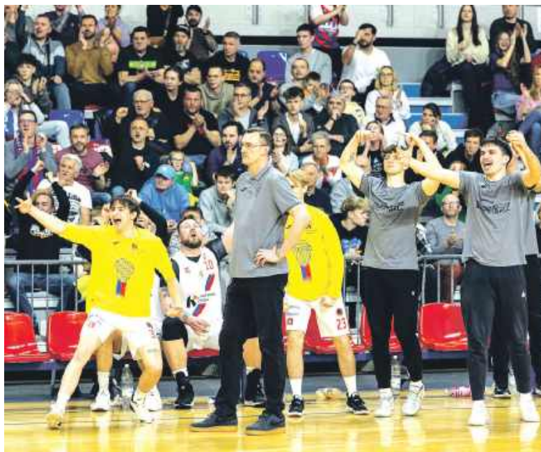
Okazuje się, że wielu znanych z poprzedniego sezonu zawodników nie zobaczymy już w szeregach Polonii Bytom

Przypomniano tam też, że Bogdanowicz rozegrał 130 meczów,