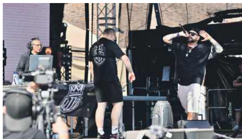
Raszone85 zakreślił publicznością