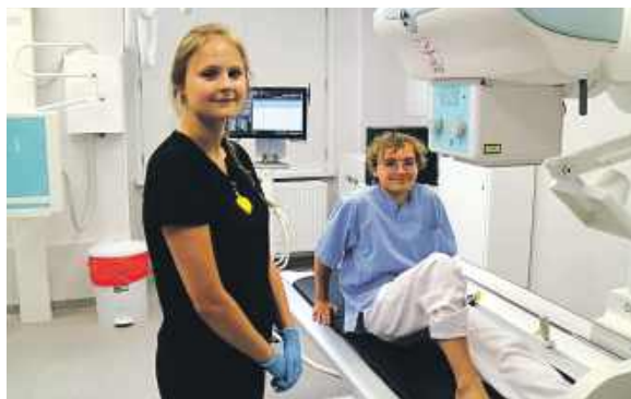
Opera T90 kosztował 1,7 mln zł

Najnowsza technologia pomaga lepiej diagnozować pacjentów Wojewódzkiego Szpitala Specjalistycznego nr 4 przy al. Legionów. Teraz zdjęcia RTG robi tam nowoczesny aparat za bagatela 1,7 mln zł.