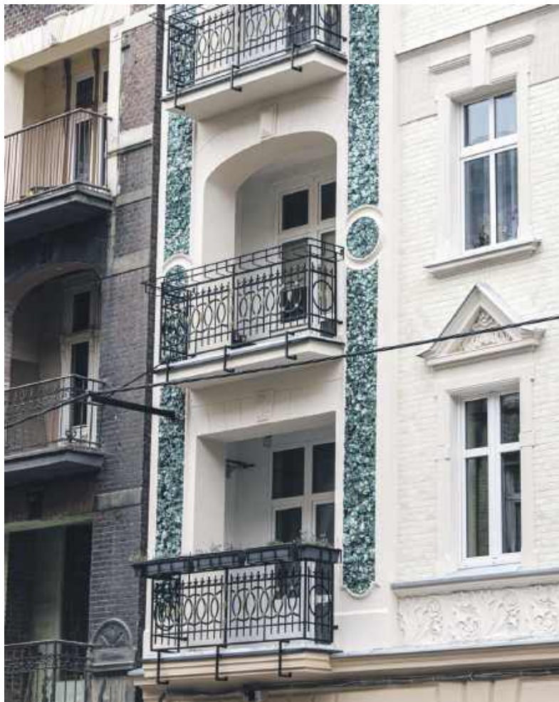
Kamienica po rewitalizacji

Bytom jest jednym z miast o największych potrzebach rewitalizacyjnych. W Krajowej Strategii Rozwoju Regionalnego 2010-2020 nasze miasto zostało wymienione wśród Obszarów Strategicznej Interwencji (OSI). W ciągu ostatnich lat w mieście wyremontowano kilkadziesiąt kamienic. W następnych latach, dzięki obecnemu wsparciu rządu, miasto planuje remont od 40 do 60 kamienic. Mimo zmniejszającej się liczby mieszkańców potrzeby mieszkaniowe w Bytomiu nadal są bardzo duże. Szczególnie w grupie osób o ograniczonych dochodach. Na liście oczekujących na lokal z najmem socjalnym jest 960 rodzin. Na liście uprawnionych do otrzymania