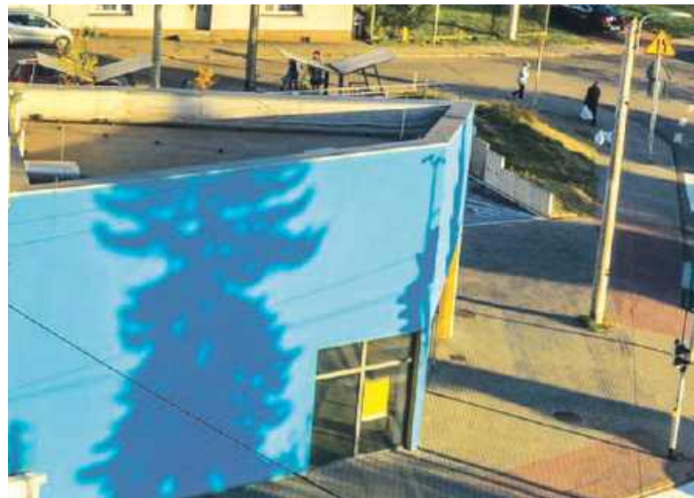
Ściana niebieska, a nie będzie mural

Od samego początku trudno było powiedzieć, że centrum jest oblegane przez podróżnych. W zasadzie przez zdecydowaną większość czasu stoi ono puste. Nawet były wicebu-