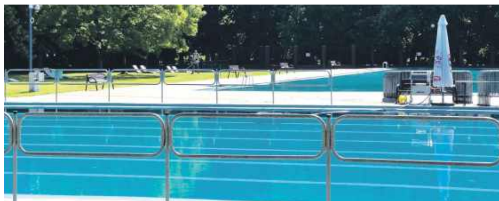
Basen w bytomskim parku miejskim oferuje sporo atrakcji

Z początkiem lipca bywalcy obiektu muszą się przyszykować na zmiany. Bilet normalny będzie kosztować 18 zł, a jeśli wejdziemy na teren pływalni po godz. 16 - 10 zł. Za ulgowy zapłacimy 10 zł (po godz. 16 - 5 zł). Grupy zorganizowane z opie-