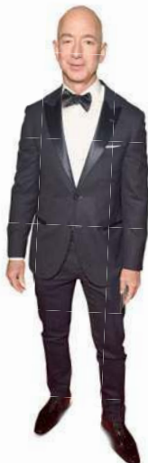
100 najbogatszych Polaków uzbierało w sumie 153 MLD ZŁ majątku. To zaledwie jedna trzecia fortuny JEFFA BEZOSA , twórcy Amazona.

Na liście sporo niespodzianek. Największą z nich jest dramatyczny spadek Leszka Czarneckiego, który w zeszłym roku z 1,5 mld zł majątku plasował się na 22. miejscu listy 100. W tym roku ledwie się do rankingu załapał. Z niecałymi 400 mln zł znalazł się na przedostatnim miejscu. A jeszcze 11 lat temu twórca Getinu był w wiodącej trójce najbogatszych ludzi w kraju. Po raz pierwszy w gronie 100 najbogatszych Polaków znalazł się Marcin Gortat. Po tym, jak rok temu zmienił klub z Washington Wizards na Los Angeles Clippers, dostał ponad milion dolarów podwyżki za sezon. Długo się nią jednak nie nacieszył, bo na początku tego roku kalifornijski klub podjął decyzję, żeby Gortata zwolnić. Przez lata gry w NBA zdążył się jednak dorobić potężnych pieniędzy, które inwestuje przede wszystkim w nieruchomości położone w Stanach