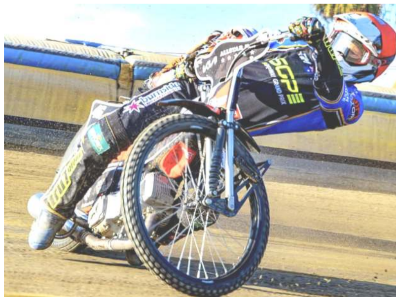
Latem, na PGE Narodowym w Warszawie, Jason Doyle może sięgnąć po złoty medal FIM Speedway World Cup – jedyny tytuł, którego brakuje w jego imponującej kolekcji.