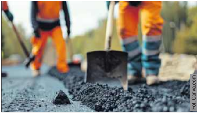
Remont drogi obejmuje m.in. budowę ścieżki pieszo-rowerowej, ale nie tylko.

Zarząd Dróg Powiatowych w Kolbuszowej ogłosił przetarg na budowę chodnika przy drodze powiatowej relacji Cmolasa - Świerczów. Trakt dla pieszych ma mieć długość około 3,5 km i kotować blisko 8 milionów złotych. Za te pieniądze wykonane zostanie jeszcze kilka innych rzeczy, m.in. oświetlenie, czy przejście dla pieszych. Co jeszcze?