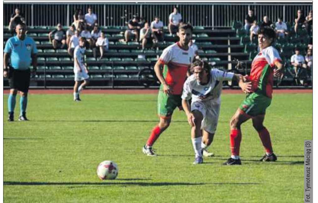
KKS Kolbuszowianka Kolbuszowa zwycięża w 1. kolejce Klasy Okręgowej Dębica.