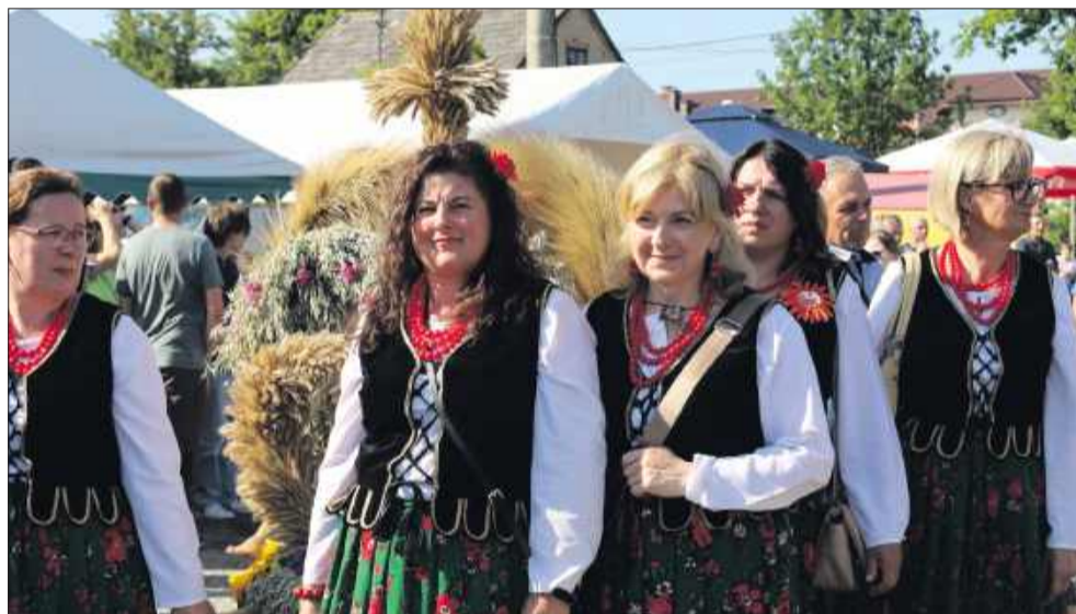
Uroczystość uświetniły m.in. Koła Gospodyń Wiejskich.