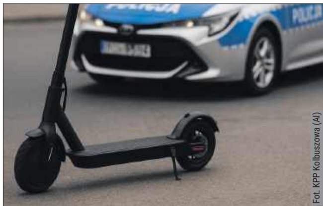
Wyścigi młodych chłopców hulajnogami mogły zakończyć się tragicznie.