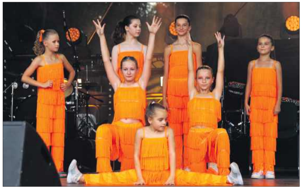
Scena należała także do młodych artystów.