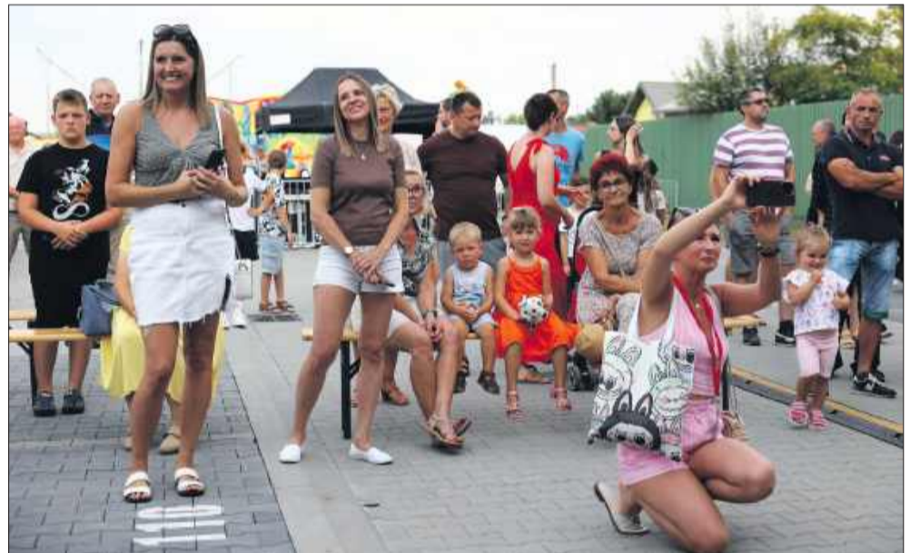
Pogoda i świetne nastroje dopisały wszystkim.

zespołów folklorystycznych, muzycznych i tanecznych. Na scenie mogliśmy podziwiać m.in. grupę artystyczną Saga RKL, czy młodych akrobatów z Acro-Clinic. Wieczorem gwiazdą wieczoru był koncert zespołu Organek, który przyciągnął tłumy. Po jego występie odbyła się zabawa taneczna, która trwała do późna. W niedzielę, 17 sierpnia odbyły się dożynki gminy Kolbuszo-