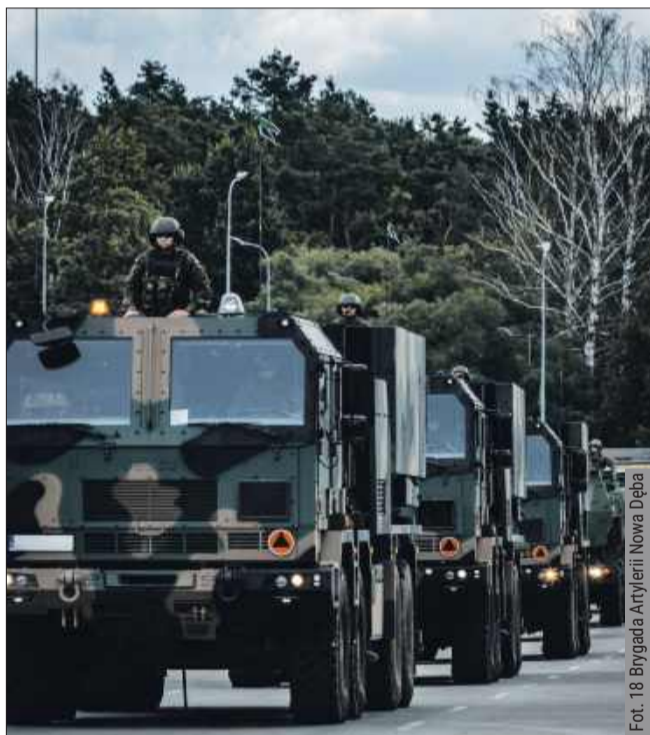
We wrześniu będzie wzmożony ruch pojazdów wojskowych.

Planowany czas wzmożonego ruchu to okres od godziny 03:00 do 20:00. Jak wskazano w komunikacie wydanym przez dowództwo 18 Brygady Artylerii w Nowej Dębie, przejazd kolumn wojskowych będzie miał charakter szkoleniowy, a celem jest przeprowadzenie ćwiczeń w ramach misji Sił Zbrojnych.