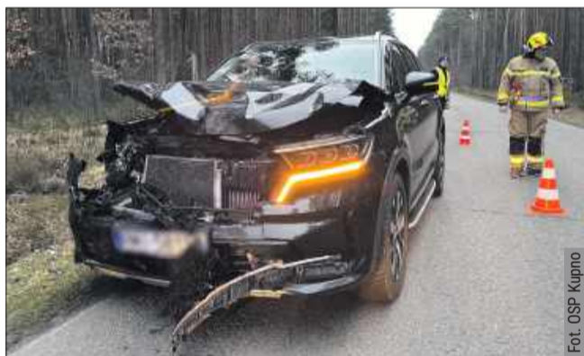
Kolizje z dziką zwierzyną to niebezpieczne sytuacje – uderzenie zwierzęcia z impetem, które może ważyć nawet kilkadziesiąt kilogramów, często prowadzi do poważnych uszkodzeń pojazdu i stanowi zagrożenie dla zdrowia kierowcy. Tak zakończyło się „bliskie spotkanie” z jeleniem w Leszczach 4 lutego tego roku.

■ Zabezpiecz miejsce zdarzenia – jedź na pobocze i ustaw trójkąt ostrzegawczy.