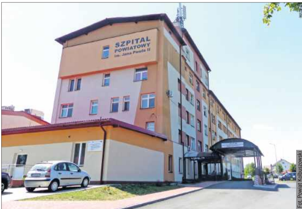
W tym roku Samorząd Powiatu Kolbuszowskiego zamierza wesprzeć Szpital Powiatowy kwotą niemal 2 milionów złotych.

Kolejne 150 tysięcy złotych zostanie przeznaczone na modernizację dachu budynku szpitala. Prace te, podobnie jak w przypadku innych obiektów,