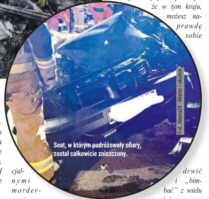
Seat, w którym podróżowały ofiary, został całkowicie zniszczony.

Plaga wypadków na polskich drogach. Plaga pijanych degeneratów, którzy decydując się wsiąść za kółko, stają się poten-