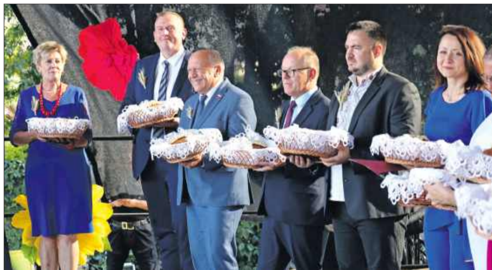
Tradycyjnie przedstawicielom władz i instytucji wręczono chleby.