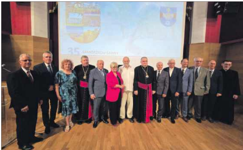
Uroczystość była okazją do wspólnego świętowania.

Obchody 35-lecia samorządu Gminy Kolbuszowa były wyjątkową okazją do podkreślenia znaczenia samorządu lokalnego w rozwoju regionu. Wydarzenie zgromadziło wielu mieszkańców, którzy chcieli uczcić ten szczególny dzień. Rozpoczęło się od przemarszu, który przeszedł przez centralne ulice Kolbuszowej. Mieszkańcy z dumą