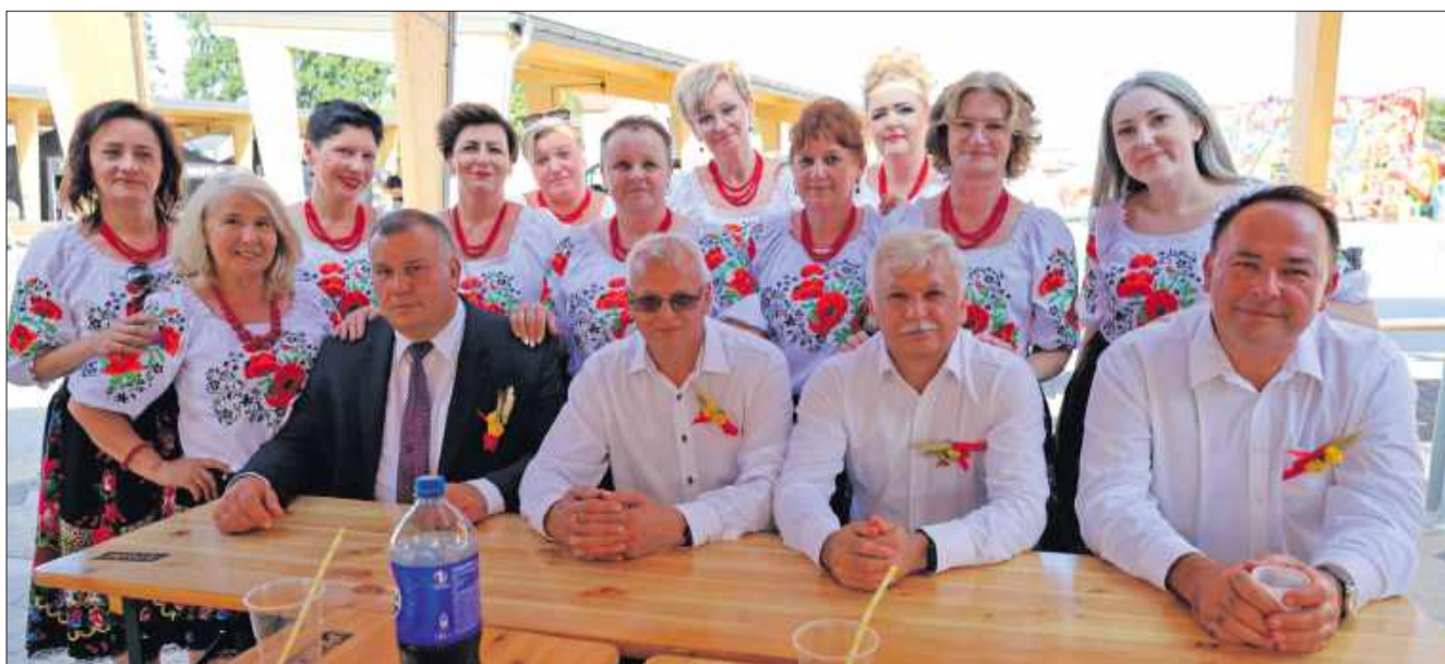
Panie i panowie z KGW Kolbuszowa Dolna z chęcią stanęli do wspólnego zdjęcia.

Więcej zdjęć na stronie www.korsokolbuszowskie.pl