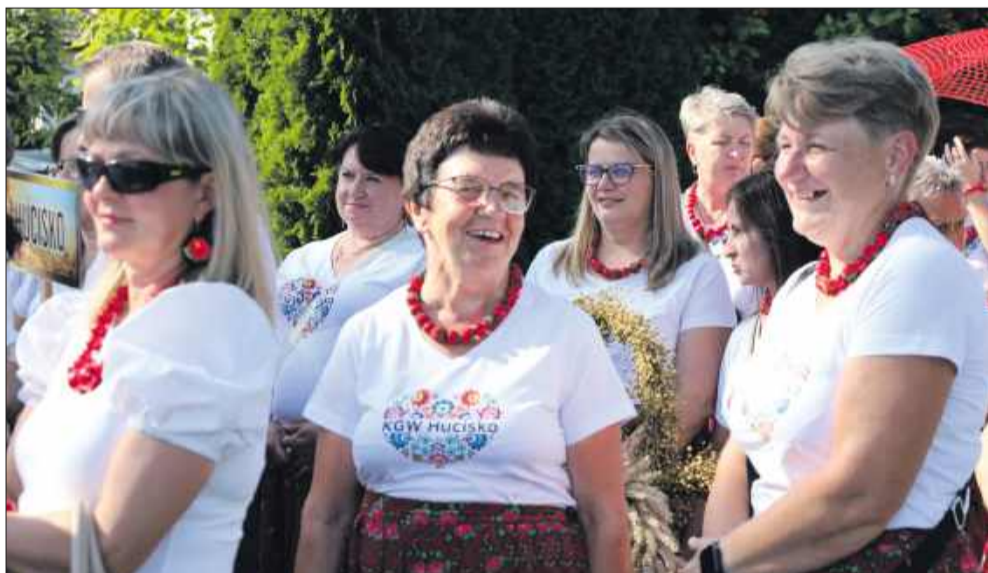
Dożynki w gminie Niwiska to tradycja, która wciąż cieszy się ogromnym zainteresowaniem.