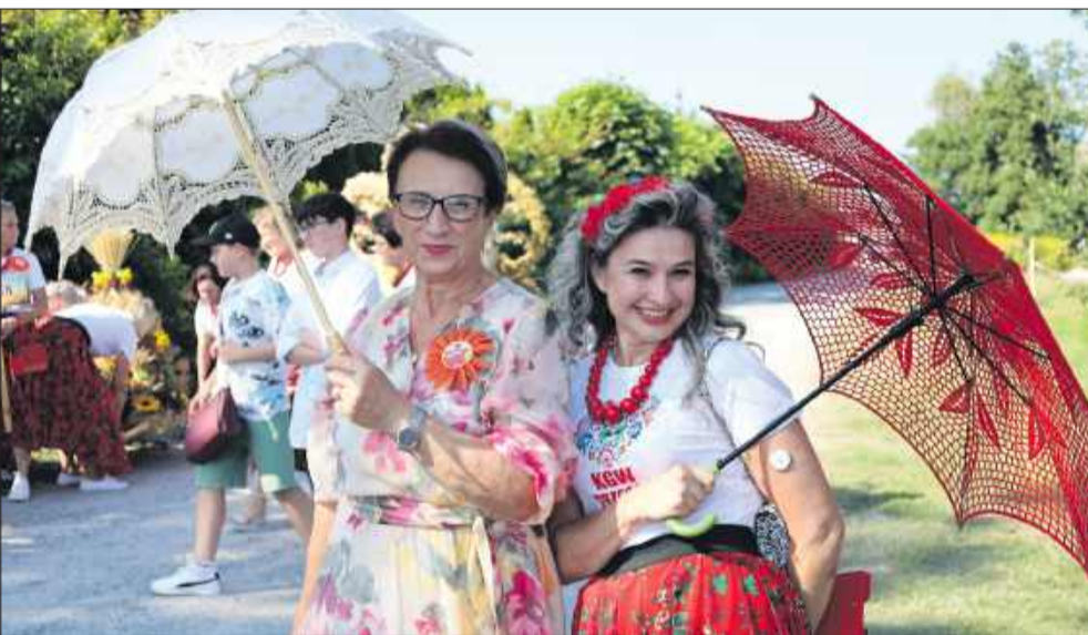
Kolorowe stroje, piękne wieńce dożynkowe, muzyka i śpiew - tak było na tegorocznych dożynkach w Zapolu.

szedł, prezentując mieszkańcom piękne dzieła wieńcowe.