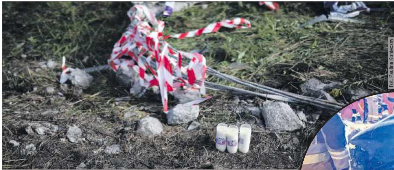
Tak wygląda miejsce tragedii kilkanaście godzin później.

W wyniku uderzenia auto osobowe odbiło się od lawety i z impetem uderzyło w żelbeto-