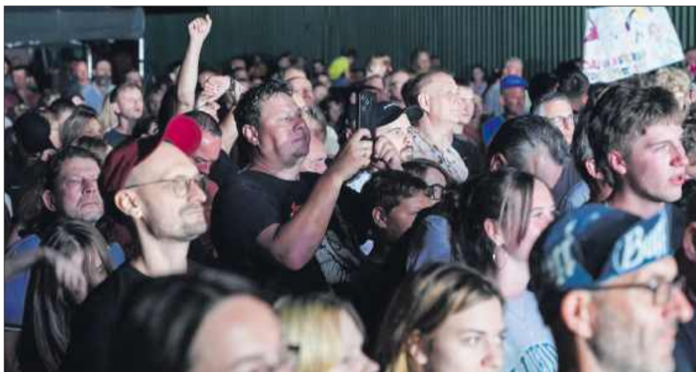
Mieszkańcy świetnie bawili się podczas tegorocznego długiego weekendu w Kolbuszowej.