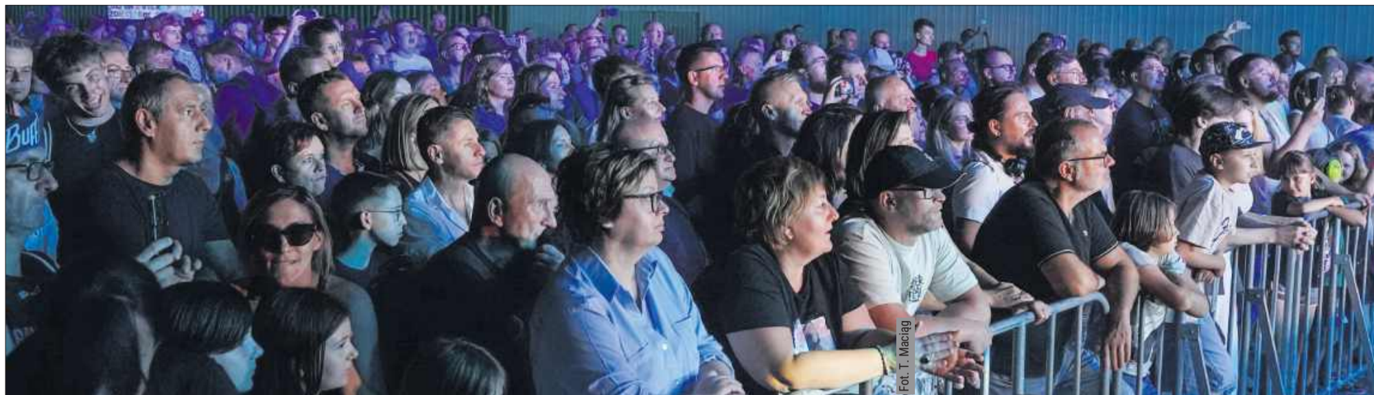
Największą publiczność zgromadził koncert zespołu Organek.

wa, które były główną atrakcją ostatniego dnia weekendu.