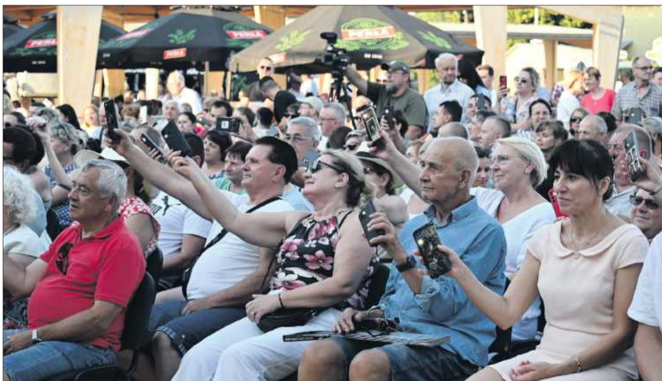
Publiczność podziwiała występy artystów.