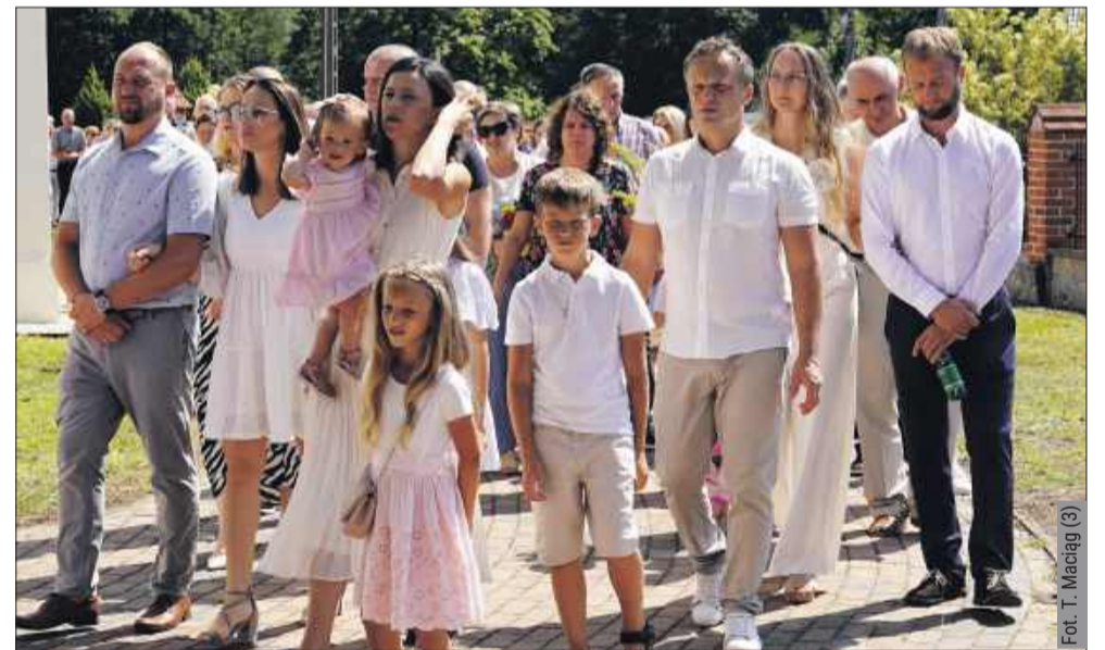
W uroczystościach licznie wzięli udział wierni.

Dla wielu uczestników był to także czas spotkań z rodziną i znajomymi, którzy