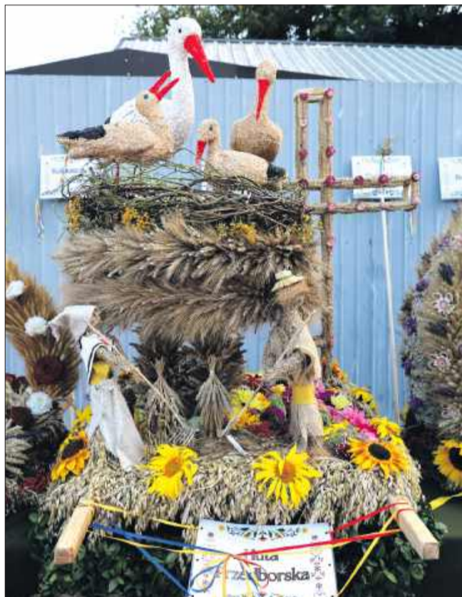
Każde sołectwo przygotowało piękny wieńiec.