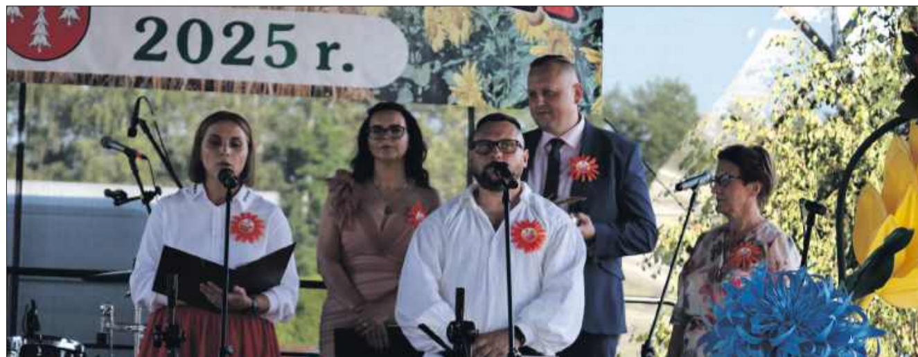
Dożynki to tradycja, która w naszym regionie ma się świetnie.

wy charakter. Były to wydarzenia, które łączyły społeczność lokalną, niezależnie od różnic społecznych. Obrzęd rozpoczynał się od poświęcenia wieńca dożynkowego, symbolizującego urodzaj. W wielu wsiach w regionie Podkarpacia. Tradycja ta jest pielęgnowana do dziś.