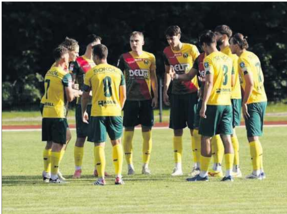
Sokół Kolbuszowa Dolna pokonał Siarkę Tarnobrzeg. To kolejne zwycięstwo.

Avia Świdnik - Sparta Kazimierza Wielka, 22 sierpnia, 17:00 Chelmianka Chelm - Czarni Połaniec, 23 sierpnia, 17:15 Korona II Kielce - Stal Kraśnik, 24 sierpnia, 12:00 Naprzód Jędrzejów - KSZO 1929 Ostrowiec Świętokrzyski, 24 sierpnia, 17:00 Pogoń-Sokół Lubaczów - Siarka Tarnobrzeg, 23 sierpnia, 16:00 Sokół Kolbuszowa Dolna - Wisła II Kraków, 22 sierpnia, 17:30 Star Starachowice - Świdniczanka Świdnik, 23 sierpnia, 19:26 Wisłoka Dębica - Podlasie Biała Podlaska, 23 sierpnia, 17:00 Wiślanie Skawina - Cracovia II, 22 sierpnia, 17:00