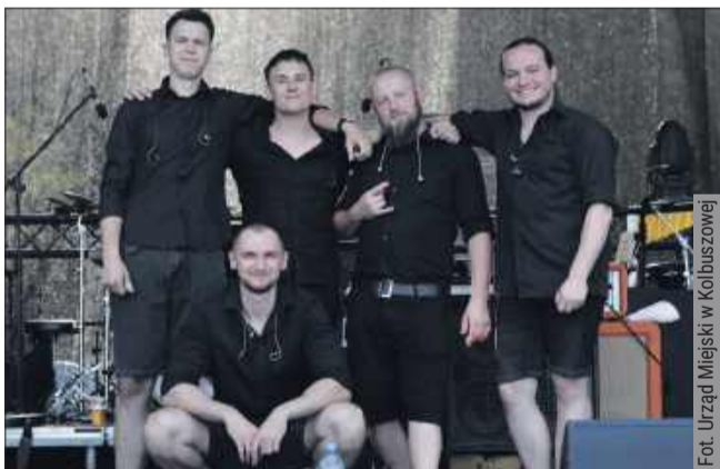
Spinacz wspiera też mniejszych twórców, którzy mają możliwość zaprezentować się przed większą publicznością.

15 sierpnia w Kolbuszowej odbył się Festyn z Orkiestrami. Program rozpoczął się od rekonstrukcji historycznej oraz zlotu samochodów i motocykli, a później publiczność mogła podziwiać koncerty orkiestr, w tym Krakowskiej Orkiestry Staromiejskiej i Orkiestry Dę-