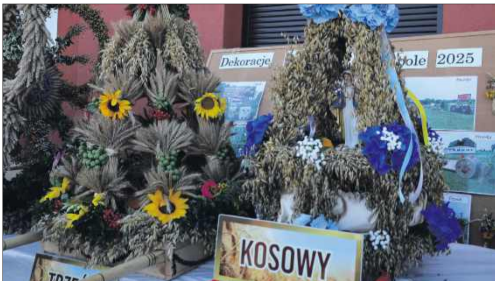
Każdy wieńec dożynkowy robił wrażenie, a mieszkańcy mogli podziwiać trud, jaki włożyły sołectwa w ich wykonanie.