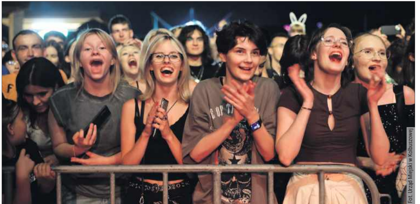
Mieszkańcy świetnie się bawili w pierwszy dzień maratonu imprez.