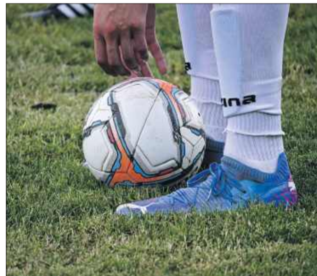
Pierwszy piłkarski weekend w A i B klasie oraz okręgówce za nami. Drużyny z powiatu kolbuszowskiego rozpoczęły mecze w sezonie 2025/2026.

Florian Ostrowy Tuszowskie - Wilga Widelka, 23 sierpnia, 16:00