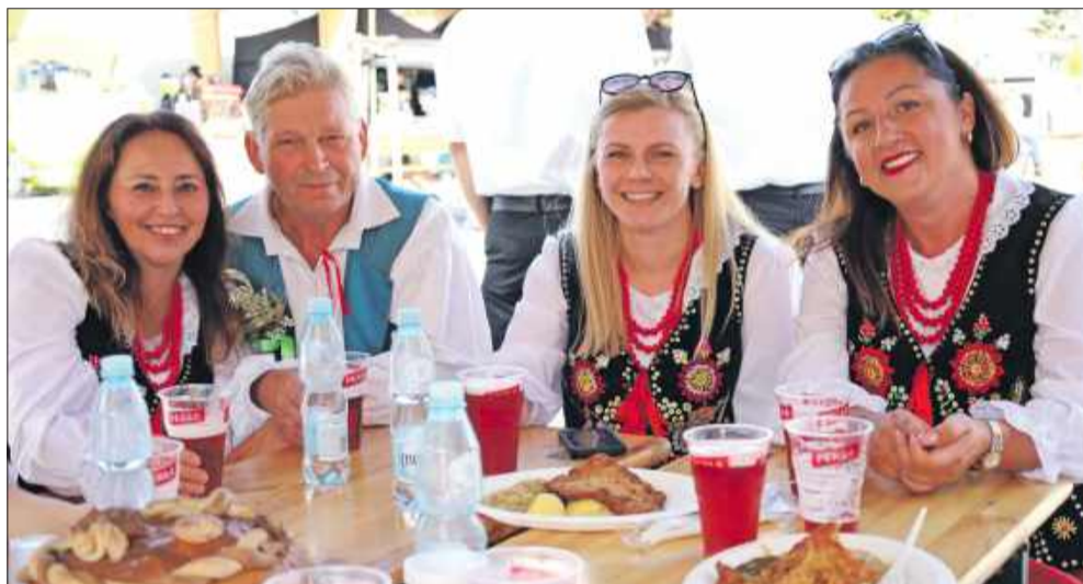
KGW Kupno pięknie prezentowało się w regionalnych strojach.