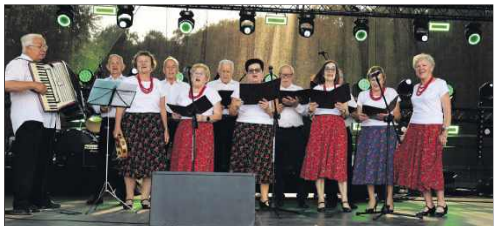
Podczas Dni Miasta zaprezentowały się także lokalne zespoły.