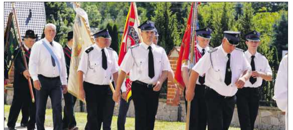
Strażacy uświetnili uroczystość, biorąc udział w procesji i mszy świętej.

często specjalnie przyjeżdżają na odpust z dalszych stron.