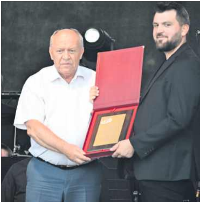
Orkiestra Dęta Miejskiego Domu Kultury w Kolbuszowej świętowała swoje 75-lecie.