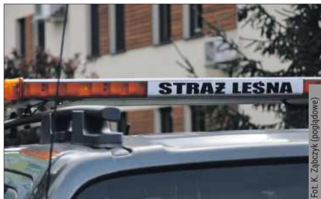
Na terenie powiatu wprowadzono okresowy zakaz wstępu do lasów.

Zakaz wstępu obejmuje leśnictwa, w których prowadzone