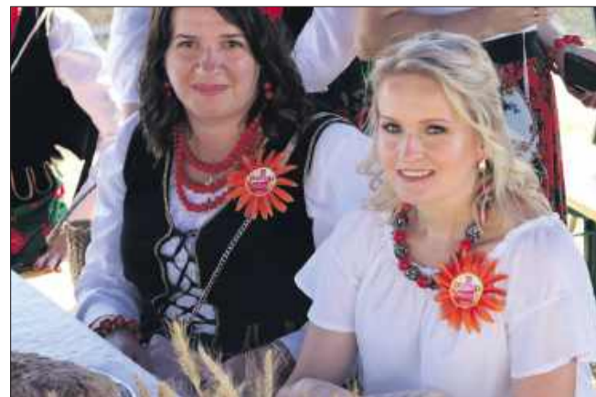
Tego dnia każdemu towarzyszył dobry humor.