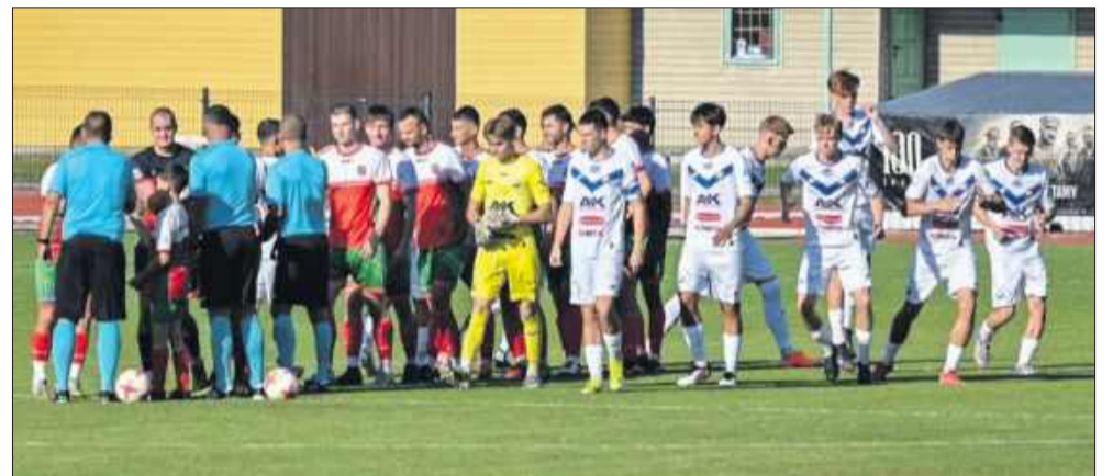
KKS Kolbuszowianka Kolbuszowa rozpoczęła nowy sezon dębickiej Klasy Okręgowej, pokonując 2:0 rezerwy Stali Mielec.