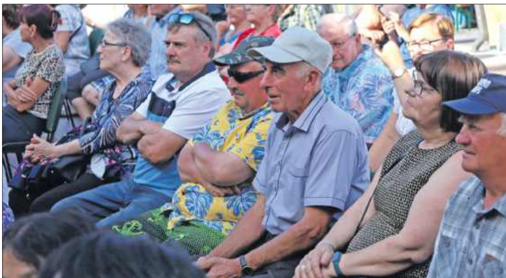
Mieszkańcy licznie przybyli na święto plonów.