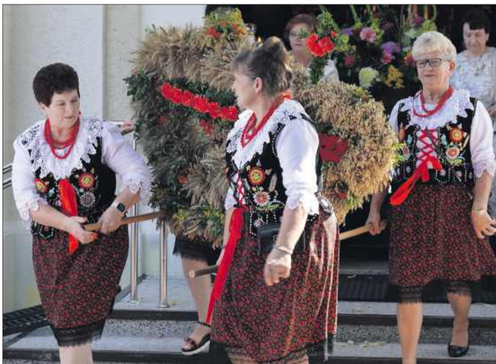
Podczas procesji niesiono także tradycyjne wiance.