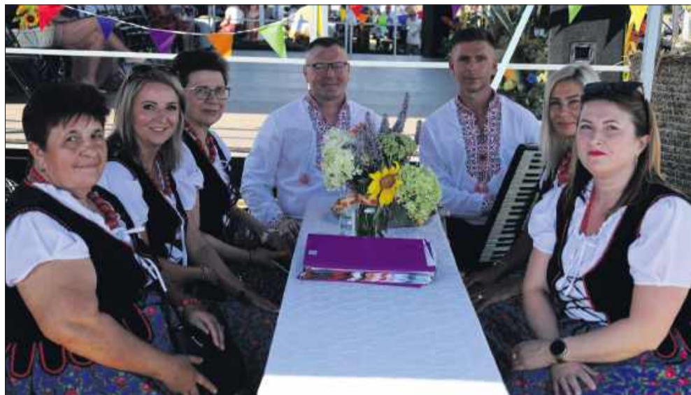
Wszystkie sołectwa pochwaliły się swoimi wieńcami i wystąpiły przed publicznością.