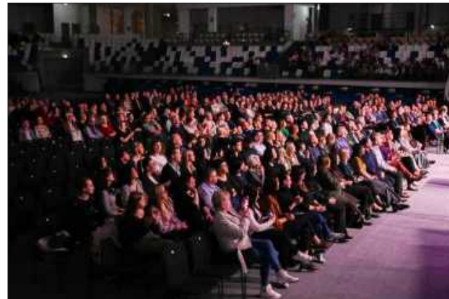
Fani muzyki klasycznej tłumnie zebraли się w hali MOSIR