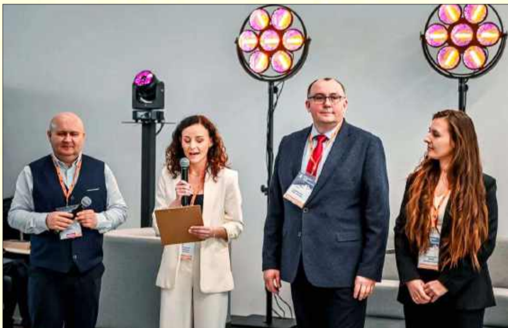
Targi czas zacząć!