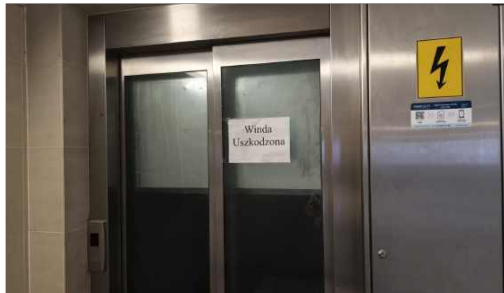
Naprawa nastąpi, gdy nadejdą części.