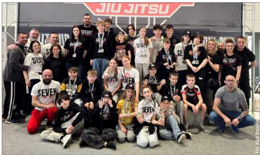
Klub Brazylijskiego Jiu-Jitsu SEVEN wystartował w Nowym Sączu.