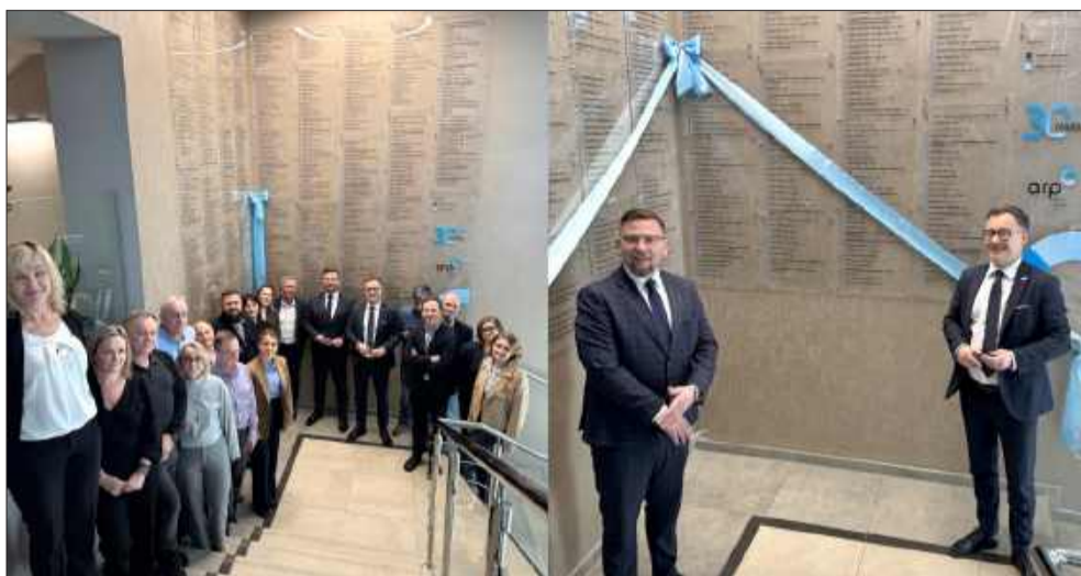
Nowa „Hall of Fame” to podziękowanie dla wszystkich, którzy przez lata pracowali na sukces SSE.

Nowa „Hall of Fame” ma symboliczny charakter. To forma podziękowania dla wszystkich, którzy przez lata przyczy-