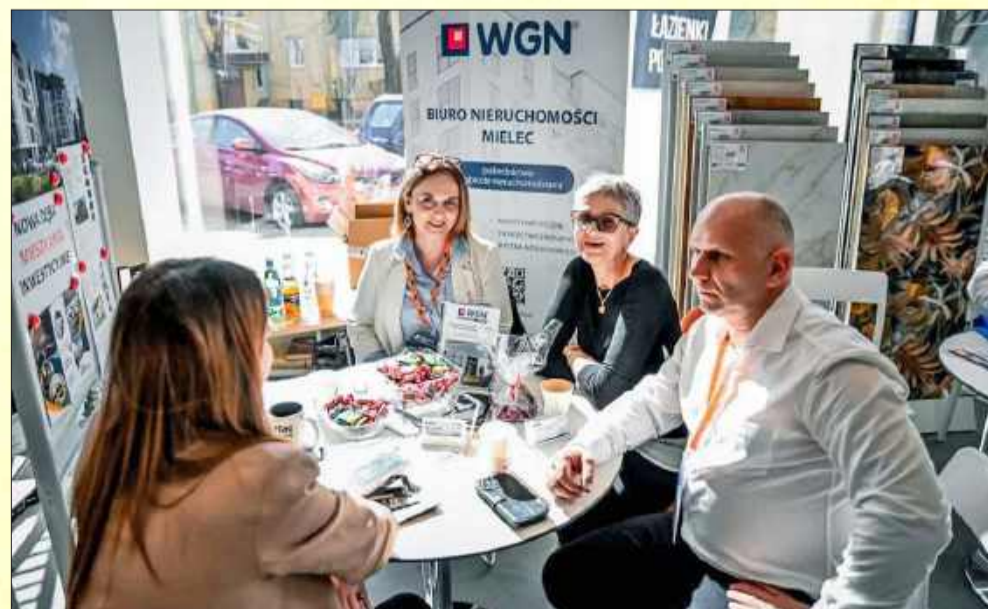
Mielczanie zadali wystawcom wiele pytań.