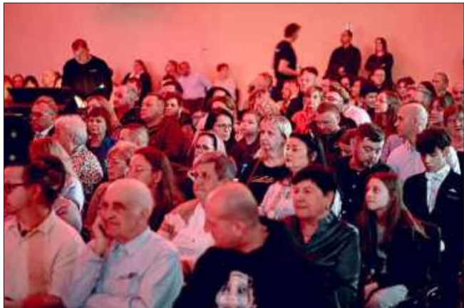
Przybyło wielu mieszkańców regionu,