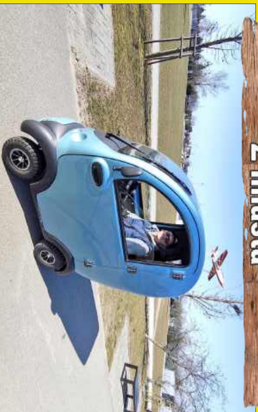
Takie pojazdy można spokonać w Mielcu