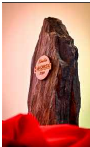
Statuetka Korso - przyznawana najbardziej zasłużonym mielczanom.

2. Głosowanie SMS: Dla tych, którzy cenią wygodę, dostępna jest droga SMS-owa. Ta forma głosowania potrwa nieco dłużej.