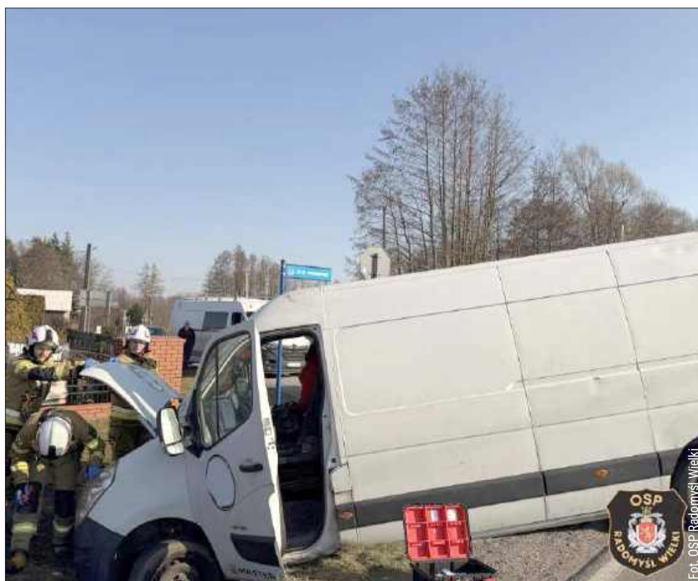
Dostawczak wylądował w rowie.