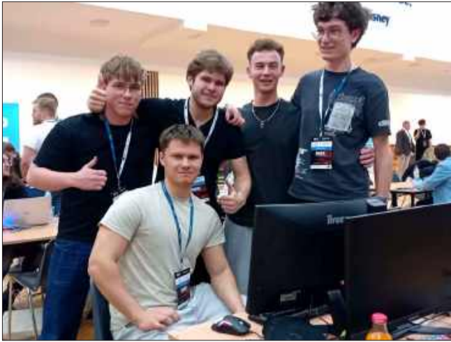
Technologiczny maraton w ZST za nami.

Mielec, obok Krosna, stał się w tym roku kluczowym przystankiem na mapie największe-