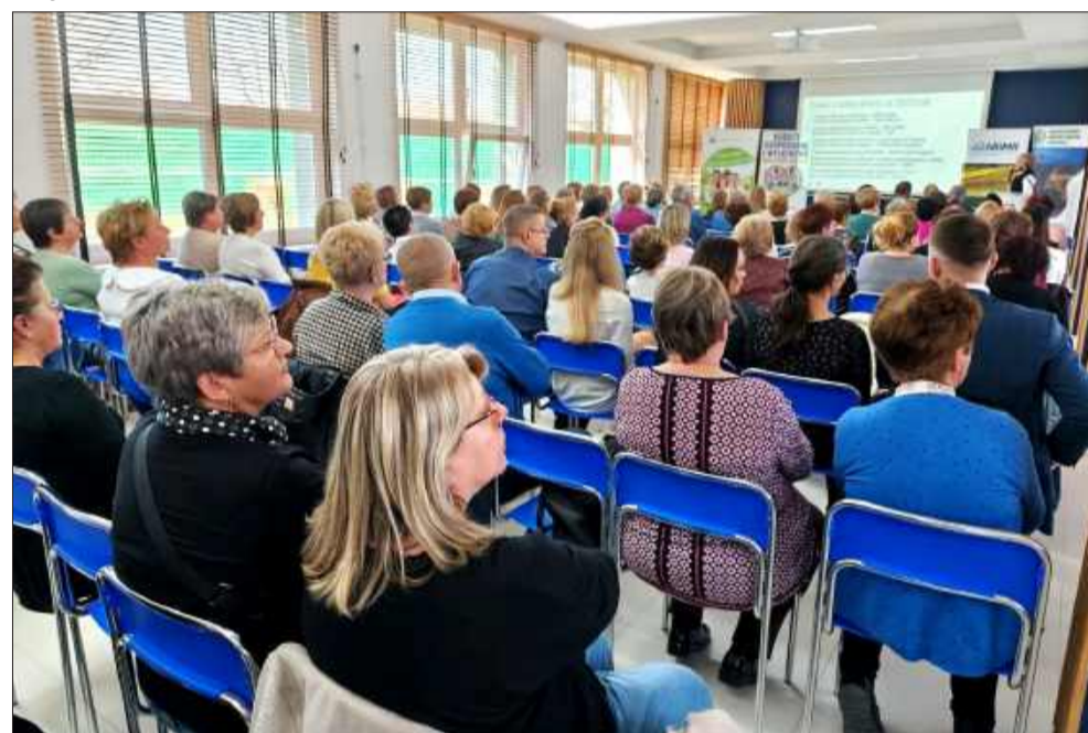
Wydarzenie zgromadziło pełną salę gości

ich udziału zależy od wielkości danego koła. Aby koło mogło ubiegać się o dotację, musi liczyć co najmniej 10 członków lub członkiń. Wyższe wsparcie finansowe przysługuje organi-