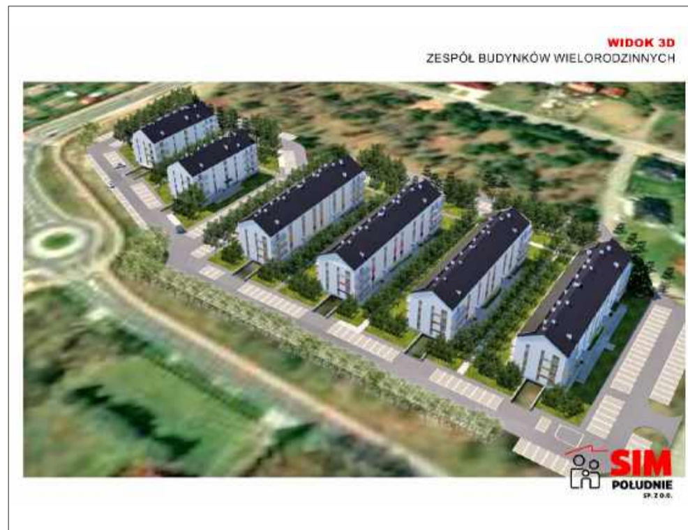
Tak będzie wyglądało nowe osiedle.

- To mieszkania dla ludzi, którzy mają dochody dobre - czyli, że stać ich na opłacenie