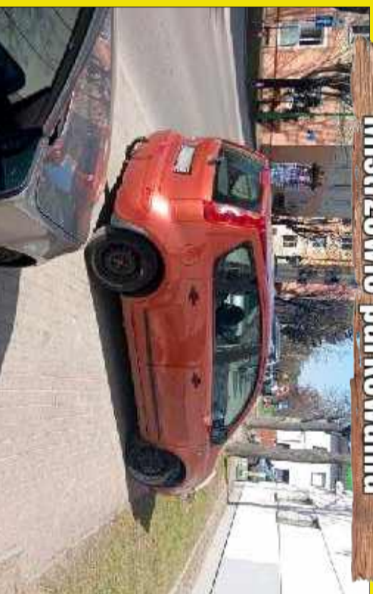
Chyba chciał się wyróżnić.