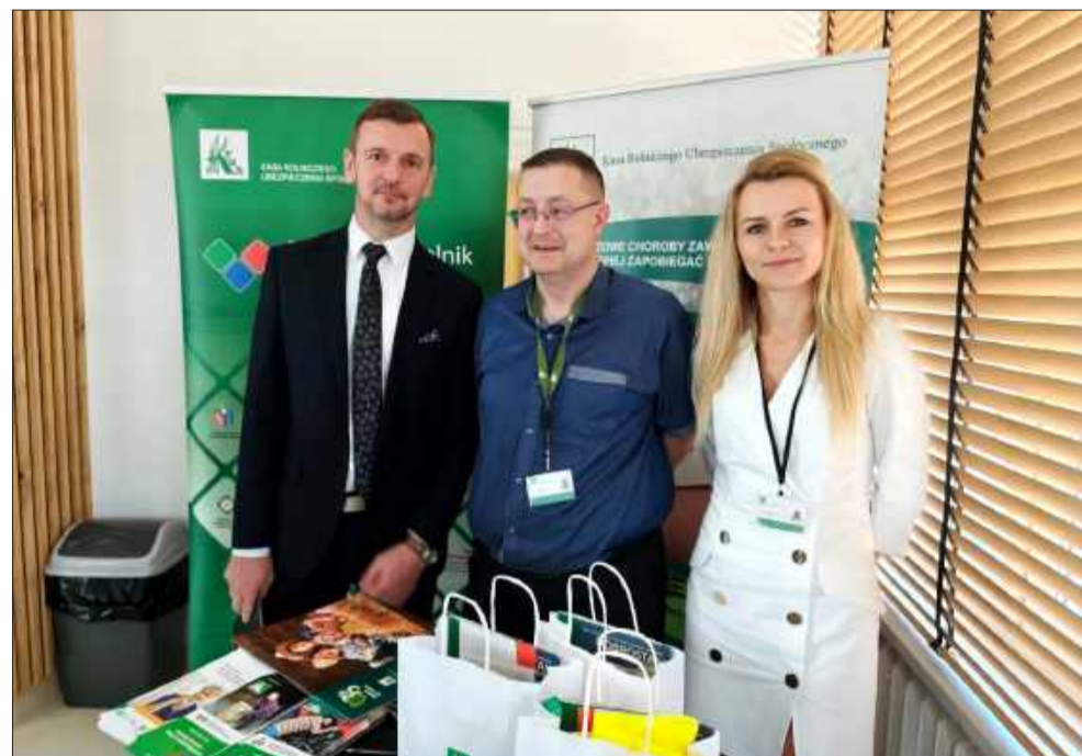
Swoje stoisko miała KRUS

W strukturach Kół Gospodyń Wiejskich mogą działać także gospodarze, a możliwość