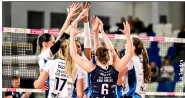
Siatkarki z Mielca w znakomitym stylu pokonały KS DevelopRes Rzeszów.

Dwa zwycięstwa w ostatnim tygodniu odniosły siatkarki z Mielca. Najpierw pokonały na wyjeździe Chemik Police, a potem sprawiły ogromną niespodziankę i pokonały KS DevelopRes Rzeszów.