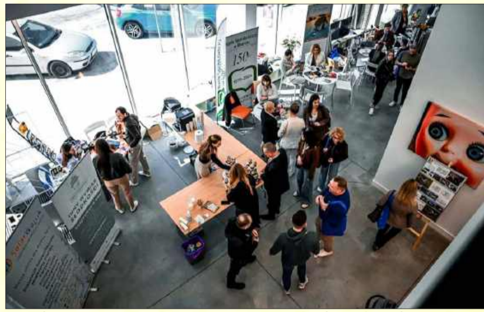
Wiele osób wiosną zaczyna remont lub budowę domu. Dobrze więc skorzystać z porad fachowców.