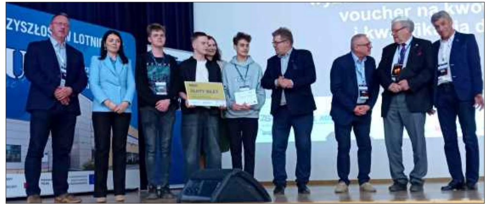
Mielec wysłał mocną reprezentację na podbój Rzeszowa.

go hackathonu na Podkarpaciu. Nowa formuła wydarzenia zakłada wyłonienie najlepszych z najlepszych już na etapie lokalnym, by w kwietniu mogli oni zmierzyć się z międzynarodową konkurencją w Rzeszowie.