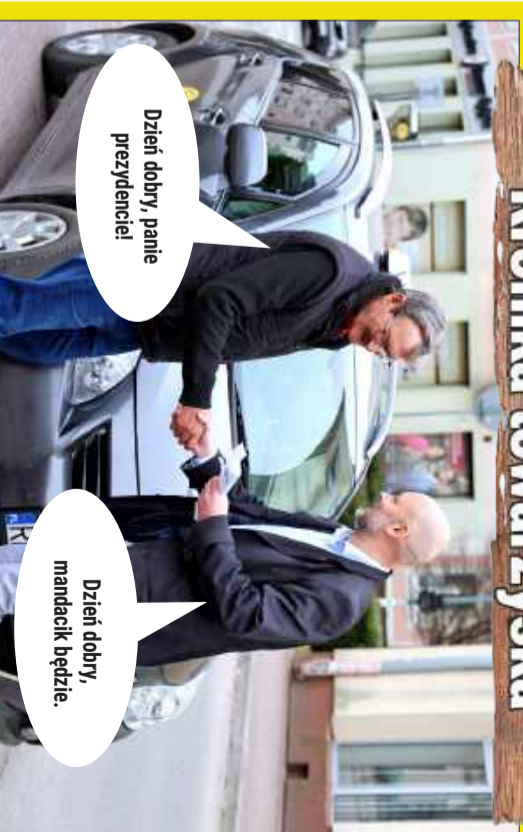
Prezydent obdarował panów wejściówkami na mecz FKS Stali Mielec z okazji przypadającego Dnia Mężczyzny.