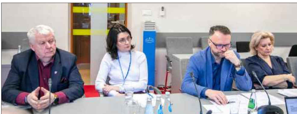
Podczas spotkania omówiono bieżącą, trudną sytuację finansową placówki.

Wójt Gminy Borowa informuje , że został zamieszczony na stronie internetowej Urzędu Gminy Borowa oraz wywieszony na tablicy ogłoszeń na okres 21 dni, wykaz dotyczący przeznaczenia do zbycia w drodze sprzedaży w trybie bezprzetargowym na rzecz najemcy kontener mieszkalny stanowiący własność Gminy Borowa o powierzchni użytkowej 35,00 m 2 , usytuowany na działce nr ewid. 885 w miejscowości Gliny Małe, obręb Gliny Małe. Szczegółowe informacje można uzyskać w Urzędzie Gminy Borowa pokój nr. 21 lub pod numerem telefonu 17 5810320 w godzinach pracy Urzędu Gminy.