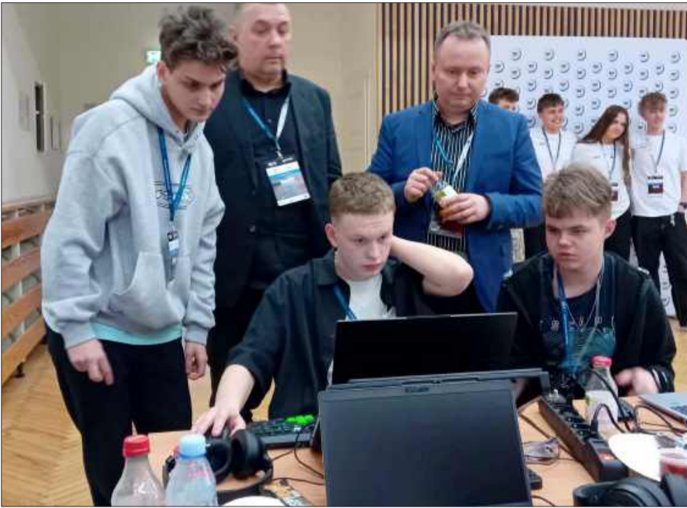
70 uczestników i 15 wizjonerskich projektów.