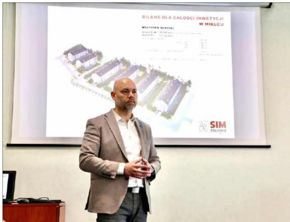
Prezydent Mielca prezentuje program budowy mieszkań.

256 mieszkań zamiast kredytu hipotecznego? Mielec stawia na Społeczną Inicjatywę Mieszkaniową. Przy ul. Witosa powstanie 6 budynków wielorodzinnych z parkingami i bogatym zapleczem gospodarczym. Znamy już dokładną strukturę lokali oraz metraże, które będą dostępne dla mielczan szukających własnego „M”.