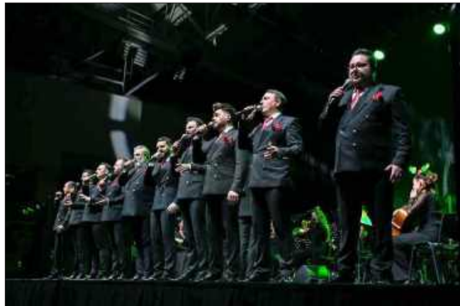
10 wspaniałych tenorów na scenie

Koncert okazał się nie tylko uczcą dla ucha, ale i wzruszającym przeżyciem, które przypomniało o sile muzyki w wyrażaniu emocji i miłości. JB