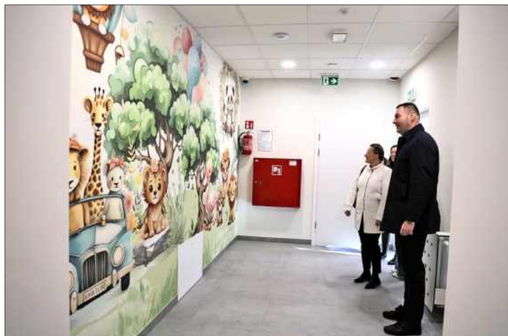
Odbiór końcowy inwestycji planowany jest pod koniec marca 2026 roku.

Inwestycja obejmowała rozbudowę, przebudowę oraz nadbudowę istniejącego budynku placówki. W nowej części żłobka powstały przestronne sale dla dzieci, a każda z nich została wyposażona w dedykowaną łazienkę. Dodatkowo utworzono specjalne pomieszczenie dla matek karmiących. W ramach inwestycji zakupione zostanie również kompletne wyposażenie dla nowych pomieszczeń: od mebli i przewijaków, przez urządzenia kuchenne, po armaturę sanitarną i wyposażenie łazienek.