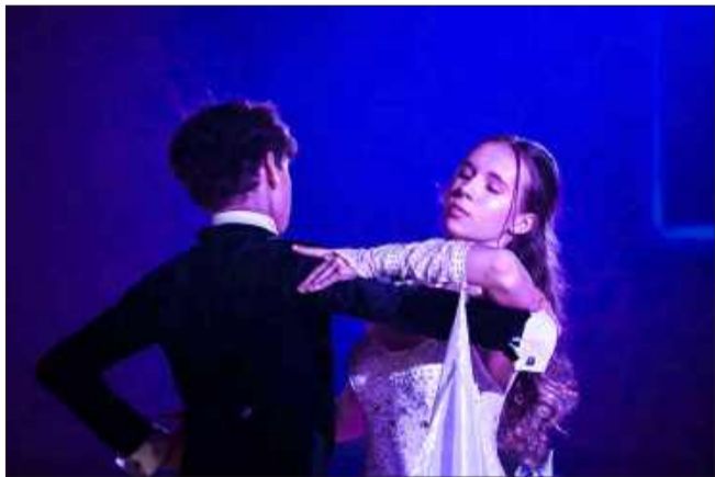
Para taneczna urozmaiciła wieczór