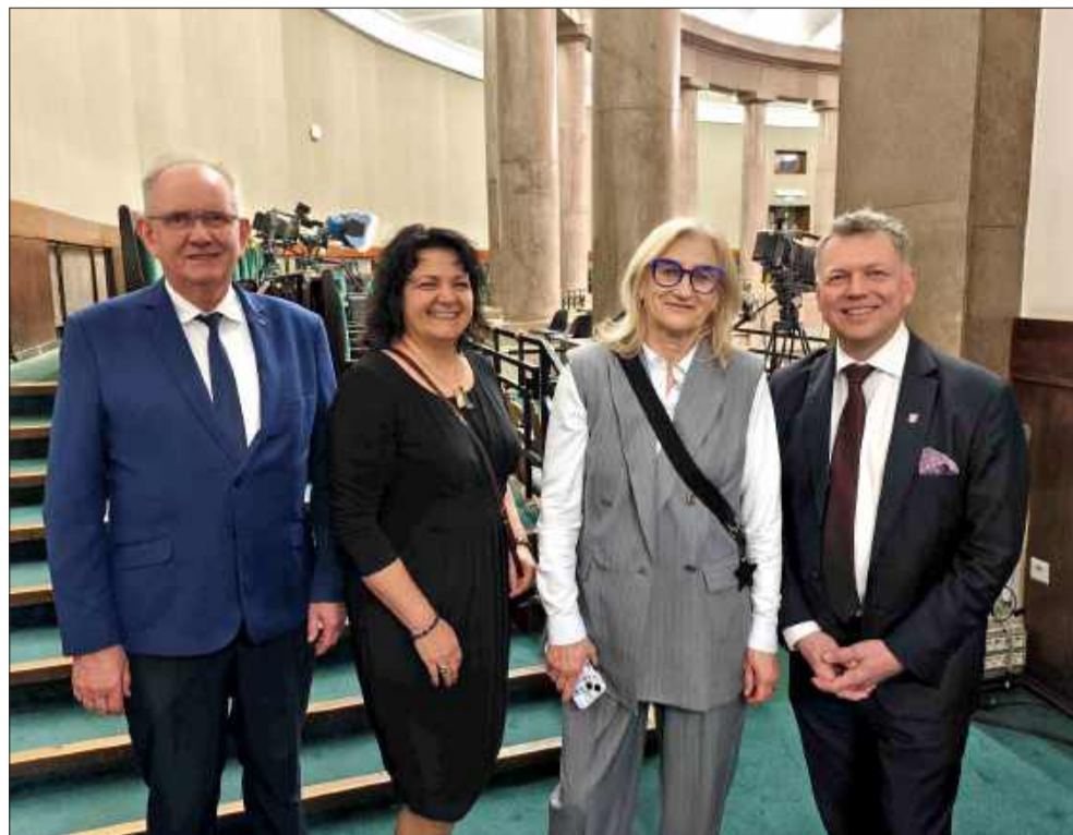
Przedstawiciele naszego powiatu odwiedzili także salę plenarną