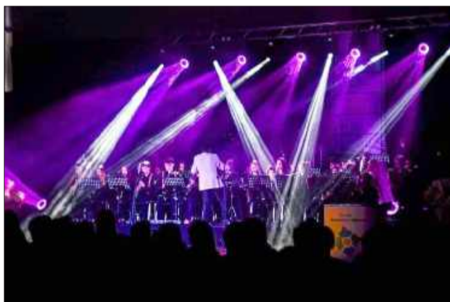
Muzyka filmowa zabrzmiała w Wadowicach

Na scenie wystąpiła Orkiestra Dęta Państwowej Szkoły Muzycznej II stopnia w Mielcu pod batutą dyrygenta Piotra Rysiewicza. Artyści zabrali publiczność w niezwykłą podróż przez świat kina - od klasycznych tematów filmowych po współczesne kompozycje znane z popularnych produkcji filmowych i serialowych. jb