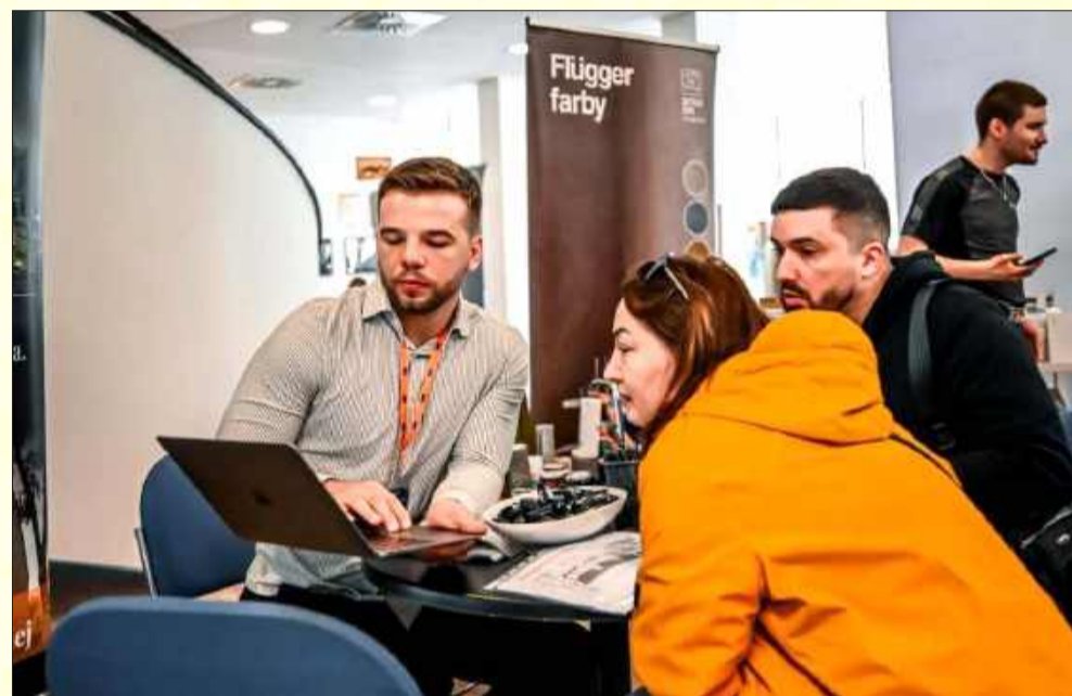
Swoje budowlane pomysły można było skonsultować ze specjalistami.