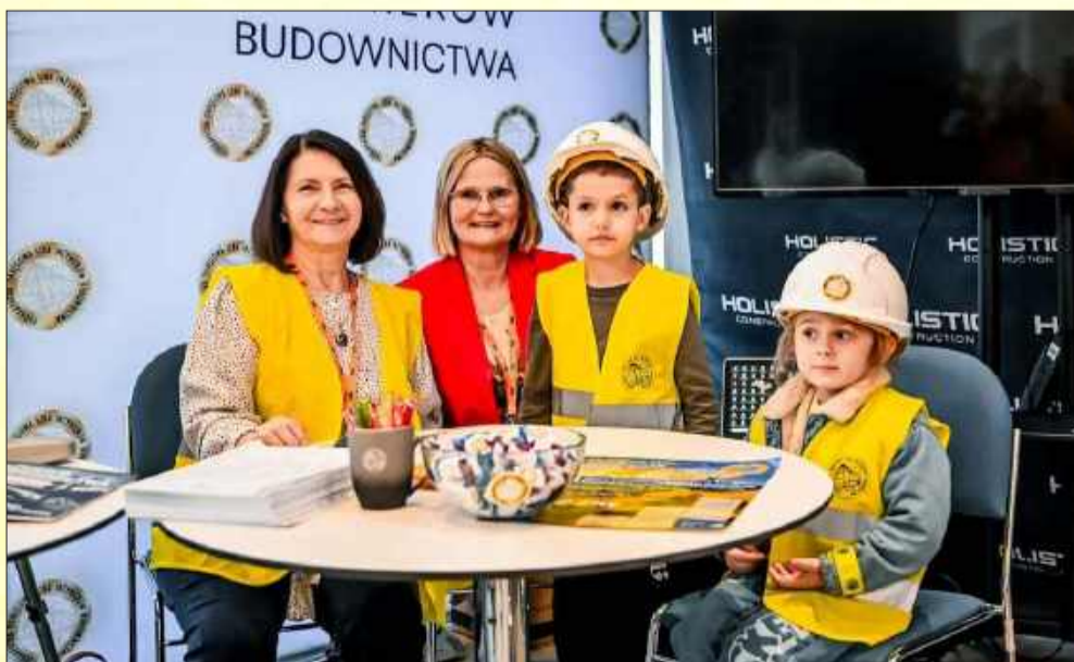
Najmłodszy wcale się nie nudził.