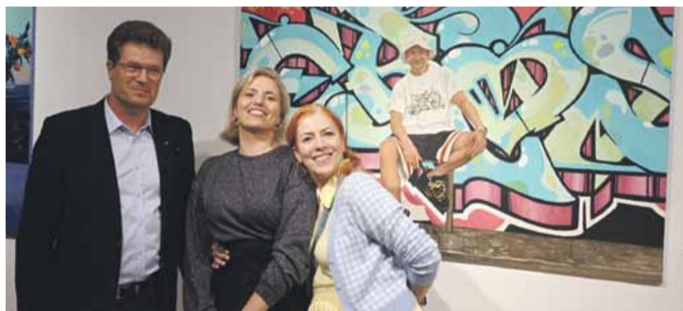
Artystka z bliskimi.