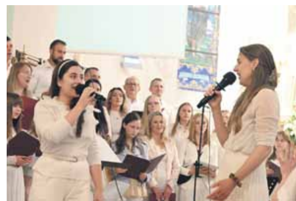
Chór Kanto wiele miejsce poświęca muzyce chrześcijańskiej.

Chór Kanto w niedzielny wieczór 4 czerwca „porwał” licznych górali i turystów do wspólnego uwielbienia. Niezwykły koncert zatytułowany „Więcej Ciebie” i modlitwa miały miejsce w kościele parafialnym w Białym Dunajcu.