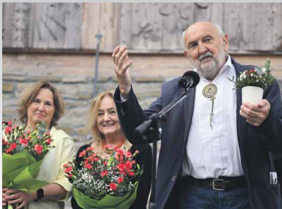
Po latach oczekiwania Zakopane doczekało się wystawy Stanisława Cukra, jednego ze swoich najwybitniejszych współczesnych twórców. Relacja z wernisażu - str. 12.