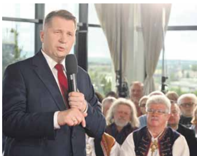
W pierwszych rządach zasiedli podhalańscy parlamentarzyści.

Jednym z głównych tematów wystąpienia była potrzeba