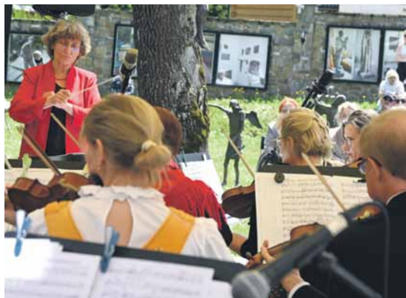
Pod Tatrami trwają Dni Zakopanego, które organizowane są, by upamiętnić wizytę Jana Pawła II pod Giewontem w czerwcu 1997 r. W ich ramach w sobotę 6 czerwca wystąpiła w willi Czerwony Dwór z koncertem plenerowym Tatrzańska Orkiestra Klimatyczna.