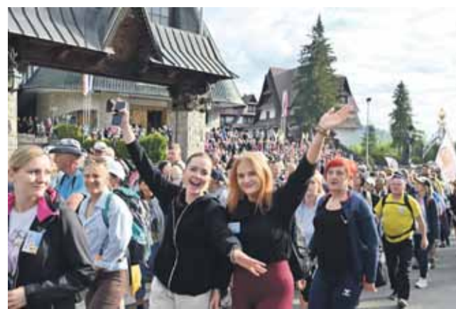
Setki pątników na trasie Pielgrzymki Sursum Corda.

Pątnicy wyszli na szlak pielgrzymi po krótkim błogosławieństwie i modlitwie