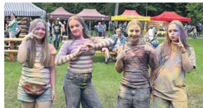
Zabawa z kolorami nie miała końca.

Publiczność oklaskami nagrodziła pokaz karate zaprezentowany przez Nowotarski Klub Kyokushin Karate Yokozuma oraz popisy wokalne uczniów Szkoły Wokalnej Beti. Najmłodszy z zaciekawieniem oglądali spektakl „Kopciuszek” przygotowany przez grupę teatralną ze Szkoły Podstawowej im. A. Suskiego w Szaflarach. Nie zabrakło też uwielbianej przez dzieci i mło-