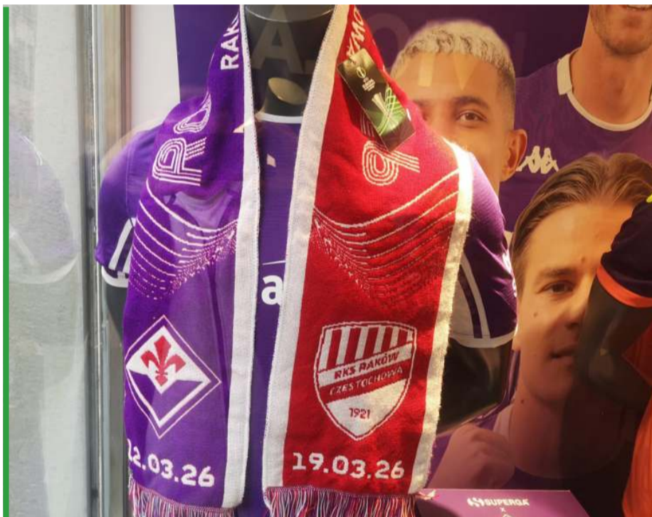
Pamiątkowe szaliki z okazji tego meczu musiały się pojawić!

Italia kojarzy się przede wszystkim z piękną pogodą, ale akurat jak na złość w dniu meczu w Częstochowie było cieplej i słoneczniej niż w deszczowej Florencji! To niewątpliwie urokliwe miasto jest rajem dla miłośników architektury renesansowej oraz potężnych kościołów z tego okresu. Katedra Santa Maria del Fiore jest czwartym co do wielkości kościołem na świecie. Florencja żyje swoim tempem, nikomu specjalnie się tu nie spieszy. Korzystając z komunikacji miejskiej, warto wziąć na poprawkę, że godziny odjazdu na rozkładzie niekoniecznie pokrywają się z rzeczywistością, a i trasa tej samej linii w jedną stronę nie musi oznaczać identycznego powrotu. Jednak zwiedzanie miasta, w którym prawdopodobnie ostatni raz Juliusz Słowacki spotkał się ze swoim przyjacielem Zygmuntem Krasińskim, nie było głównym celem na-