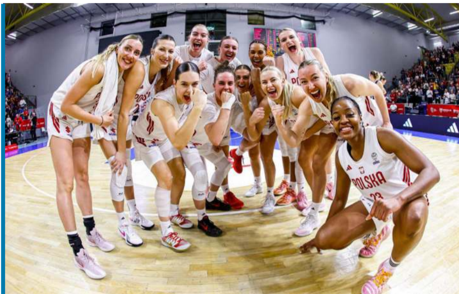
Cztery mecze, cztery wygrane. Jest się z czego cieszyć!

Polska kadra, która od 2015 roku pozostawała poza turniejem głównym EuroBasketu, wykonała w ostatnich latach gigantyczny skok jakościowy. Sygnał do zmian nadszedł już w poprzednich kwalifikacjach, gdy Polki sensacyjnie ograły w Belgii ówczesne mistrzyni kontynentu. Wówczas jednak brakowało stabilizacji – trzy kolejne spotkania z Litwą i Belgią