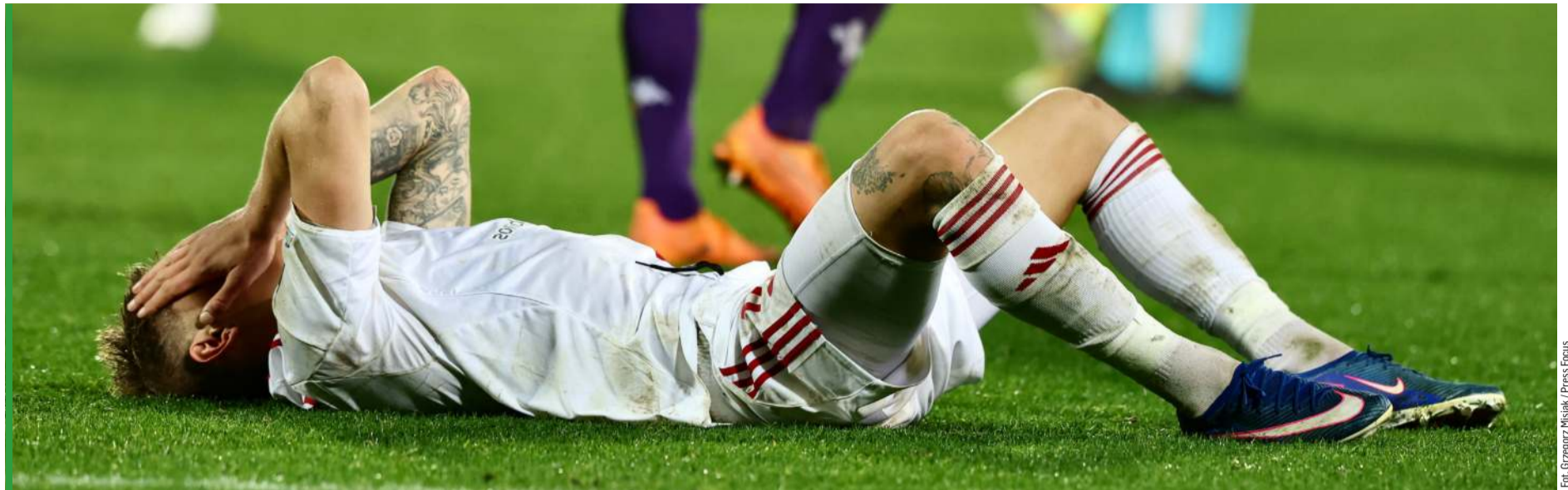
Piłkarze Rakowa byli wściekli i rozczarowani po ostatnim gwizdku we Florencji.