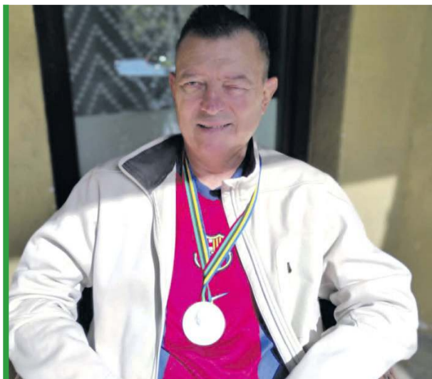
Przed wszystkim życzymy zdrowia!