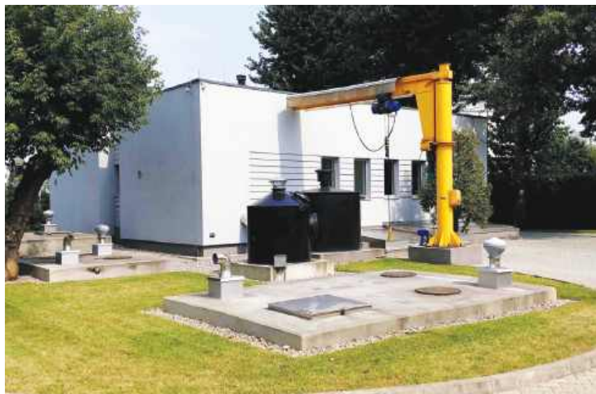
Przepompownia Ścieków „Centralna” odprowadzająca kolektorem ściekowym wszystkie ścieki z Legionowa do Oczyszczalni „Czajka” w Warszawie.

Istniejąca wówczas infrastruktura kanalizacyjna nie pozwalała już na dalszą rozbudowę Legionowa. Dwa przewody o przekroju DN 400 mm nie dawały już rady odprowadzać ścieków z miasta. Dlatego przed 1990 r. ówczesne władze Legionowa podjęły decyzję o podłączeniu miasta do Warszawskiej Oczyszczalni Ścieków „Czajka”. W tym celu zaplanowano budowę przewodu tłocznego pod ciśnieniem o przekroju 800 mm i długości 6,6 km z Legionowa do Oczyszczalni. Projekt kolektora przewidywał dwa etapy. Pierwszy etap, który zakładał budowę przepompowni ścieków oraz rurociągu zakończono w 1990 r. Etapu drugiego zakładającego budowę drugiego, zastępczego rurociągu, niezbędego na wypadek awarii, nigdy jednak nie wykonano. Projektując przewód tłoczny z Legionowa myślnie też perspektywicznie, bo przewidziano na przykład