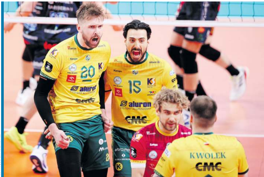
Zawiercie w wielkim stylu zameldowali się w Final Four.

Zawiercie do Final Four zakwalifikowali się w efektownym stylu, bez straty seta, odsyłając jednego z europejskich potentatów, Cucine Lube Civitanova. Goście z Włoch jedynie