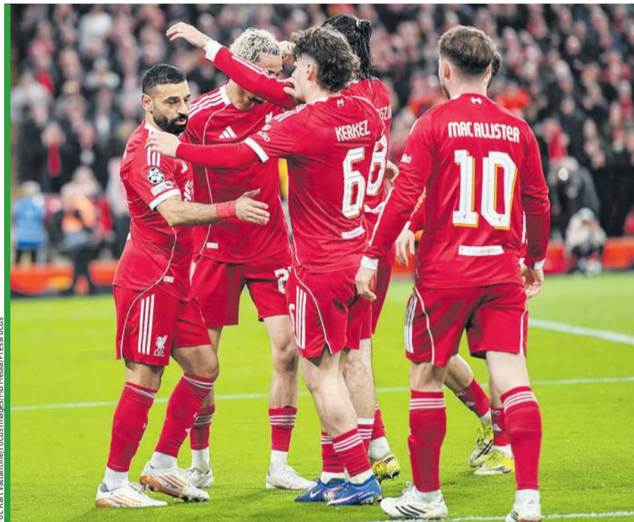
The Reds chcą mieć dzisiaj powody do radości!

już dwukrotnie – to jedno. Ale 8 i 14 kwietnia czeka ich wymagający dwumecz Ligi Mistrzów z PSG, gdzie będą paść żądzą rewanżu za ubiegłoroczną porażkę. W lidze zaś, choć rywale będą niżej notowani, zagrają potem z Fulham i derby z Evertonem – a obie te drużyny są niedaleko za plecami Liverpoolu. W kwietniu wiele może się więc dla The Reds rozstrzygnąć. – Większość naszych piłkarzy grała w trakcie przerwy reprezentacyjnej, ale nie wszyscy zaliczyli dwa razy po 90 minut. Oczekuję, że wszyscy będą gotowi na najbliższy cykl – mówił trener mistrzów Liverpoolu, który przypomniał nierówną formę swojej drużyny w ostatnim czasie – w lidze zdobyła punkt w 3 kolejkach. Holender zachwiania tłumaczył m.in. napiętym terminarzem i intensywnością spotkań, w czym nie pomagają kontuzje. Teraz powinno być już lepiej, bo do pełnych treningów wró-