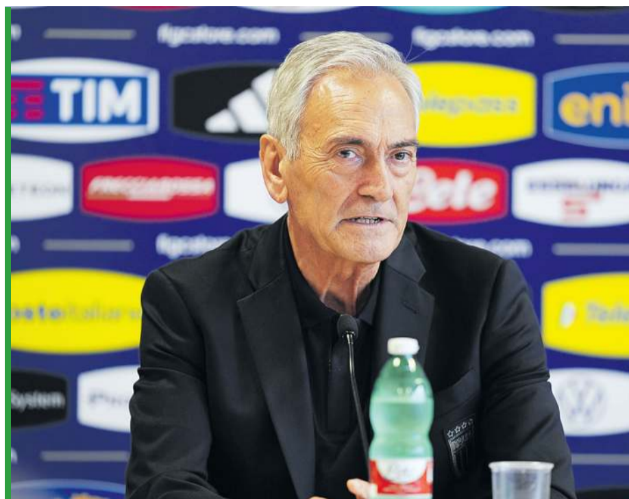
We Włoszech panuje radość po rezygnacji prezesa związku, Gabriela Graviny.

te formalnych kwestii. Klub jednak przekazał o jego odwołaniu, ale nie podał powodu. Przyczyny określił mianem „organizacyjno-technicznych”.