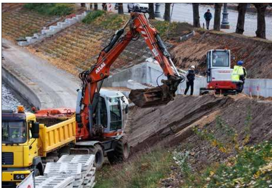
■ Prace nad Wilią już trwają

Opr. A. K. na podst. vilnius.lt, mat. pras., KW