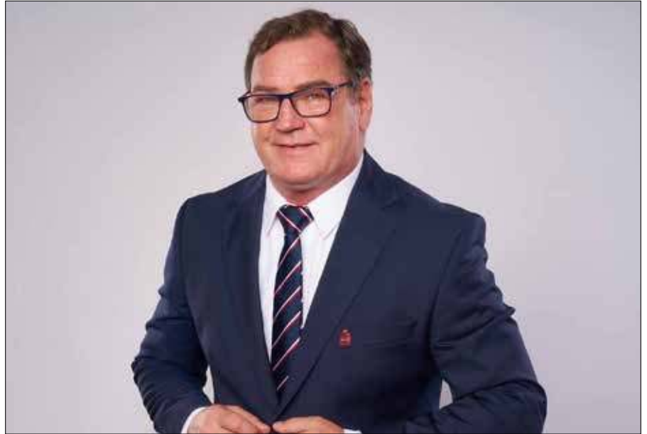
Selekcjoner reprezentacji Polski Jan Urban

31 marca rozpoczyna się ostatni etap eliminacji do największej na świecie imprezy sportowej, czyli XXIII Mistrzostw Świata w Piłce Nożnej 2026.