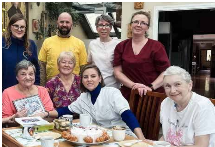
Obecność wolontariuszy jest dla pacjentów i dla zespołu hospicjum ogromnym wsparciem

Inf. i fot. Hospicjum bł. ks. Michała Sopoćki w Wilnie