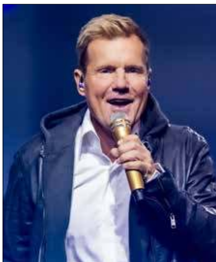
Dieter Bohlen w 2019 r.