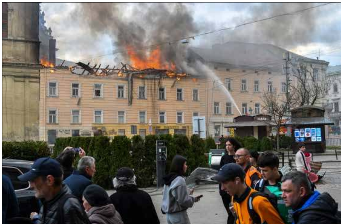
We wtorek Rosja za pomocą dronów ostrzelała Ukrainę. W nalocie zginęło osiem osób. We Lwowie rosyjski dron trafił budynek wpisany na listę światowego dziedzictwa UNESCO