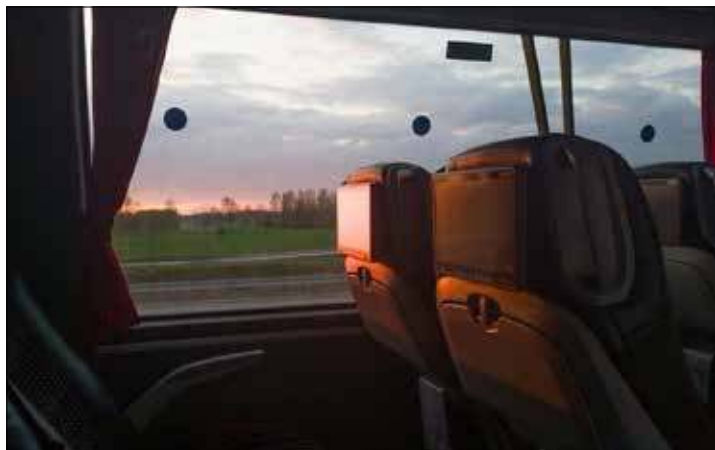
Do połączenia z Wilnem wszedł Leo Express. Nie bezpośrednio, bo póki co koordynuje swoje pociągi w Polsce ze znanym przewoźnikiem Lux Express (na zdj. wewnątrz autobusu)

Czy RegioJet lub Leo Express ruszy do Wilna? Czesi mogą chcieć takiego połączenia. Może za kilka lat będzie zainteresowanie kierunkiem bałtyckim, wtedy połączeń będzie jeszcze więcej, niż jest teraz. Nie leżałoby to też w gestii decyzji przewoźników państwowych, a możliwości sektora prywatnego. ■