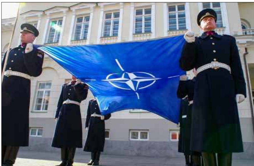
W tym roku Litwa obchodzi 22. rocznicę przystąpienia do Sojuszu Północnoatlantyckiego

Jak dodaje, dziś widzimy, że przez długi czas panował na świecie dość kruchy pokój, który się rozpada, a rosnące napięcia geopolityczne, konflikty i wojny wyraźnie pokazują, że nasz wybór był słuszny. Oczywiście, jak zauważa nasza rozmówczyni, pojawia się wiele pytań dotyczących przyszłości samego NATO jako organizacji, ale patrząc bardziej z perspektywy zarządczej niż politycznej, wiele organizacji wcześniej czy później