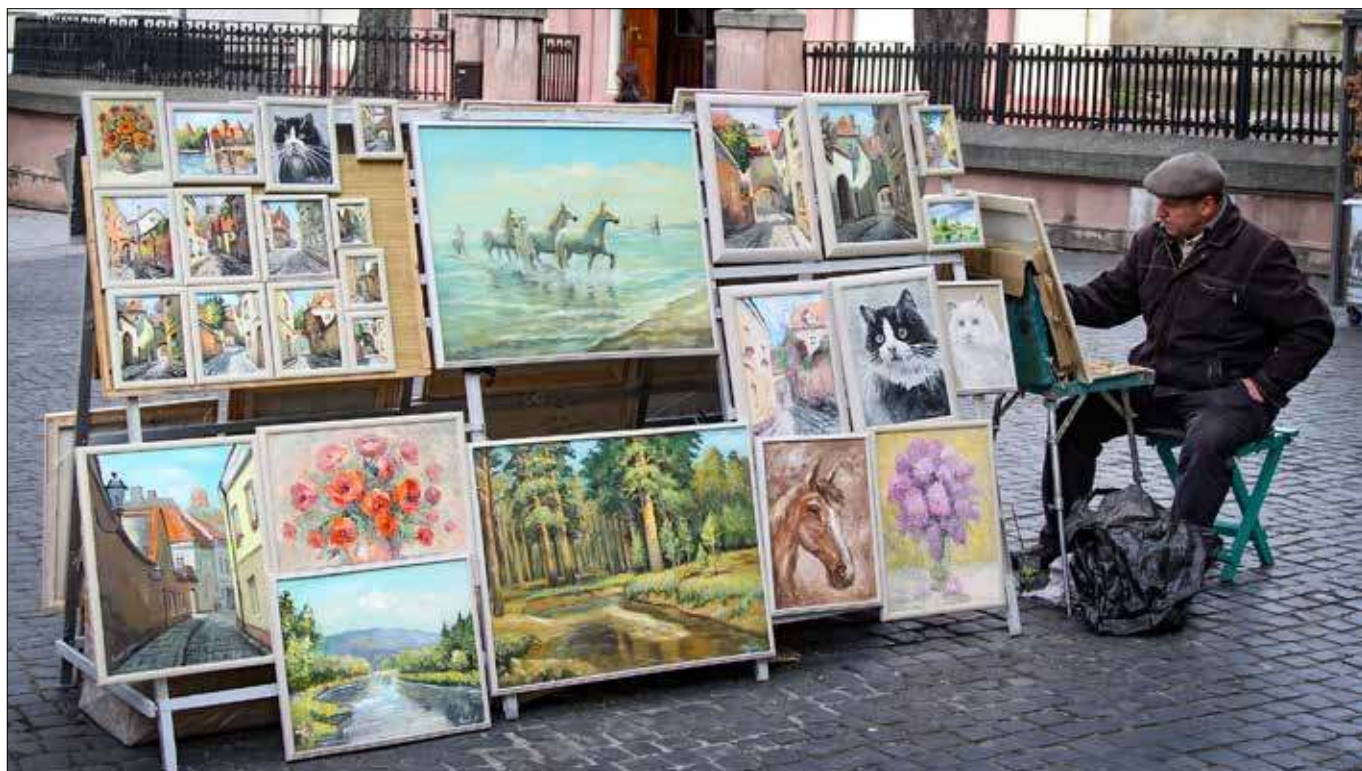
▀ Obrazy czekają na nowych właścicieli, a artysta wciąż tworzy