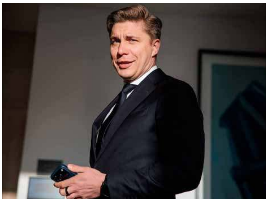
Mindaugas Sinkevičius oświadczył, że zachowanie koalicjantów jest nie do przyjęcia.