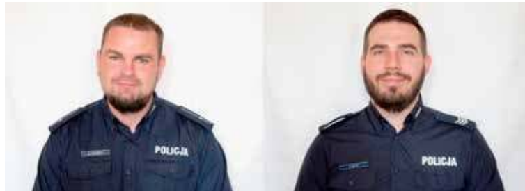
Dzielnicy z Gminy Przybiernów