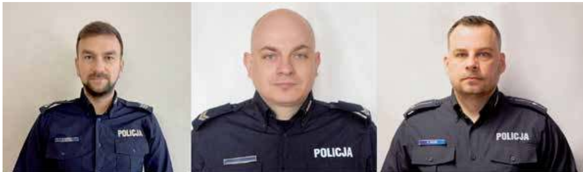
Dzielnicy z Gminy Goleniów