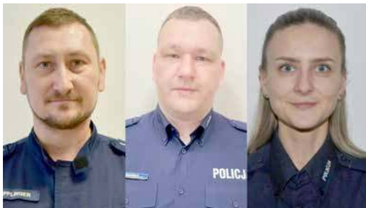
Dzielnicy z Gminy Maszewo