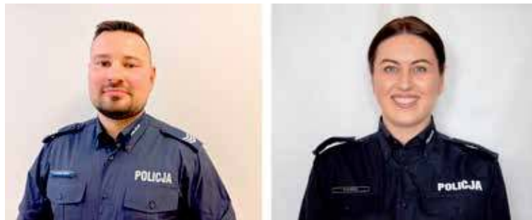
Dzielnicy z Gminy Stepnica