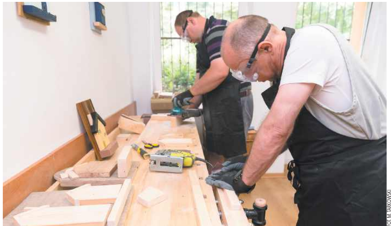
Realizacja projektu „ZA KROKIEM KROK” w ramach Działania 11.2 Usługi społeczne i zdrowotne RPO WL 2014-2020 w Powiatowym Centrum Pomocy Rodzinie w Kraśniku

Wspieranie aktywnego włączenia społecznego w celu promowania równości szans, niedyskryminacji i aktywnego uczestnictwa w życiu społecznym oraz zwiększanie zdolności do zatrudnienia, w szczególności grup w niekorzystnej sytuacji – to cel szczegółowy naboru w ramach Działania 8.1 Aktywizacja społeczna i zawodowa programu Fundusze Europejskie dla Lubelskiego 2021-2027. Na przedmiotowe wsparcie zabezpieczono środki w wysokości blisko 2,7 mln zł!