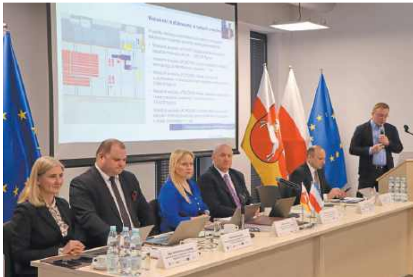
Prezydium Komitetu Monitorującego FEL 2021-2027 podczas XX posiedzenia w dniu 17 marca 2025 r. w Lublinie