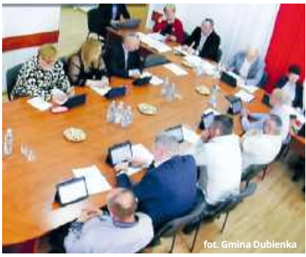
RC fot. Gmina Dubienka

Miejsce handlowe zlokalizowane będzie na działce położonej przy ul. kmdr. ppor. Bogusława Krawczyka w Dubience. Sprzedających, czyli rolników bądź ich domowników, obowiązywać będzie kilka zasad. Przedmiotem handlu mogą być tylko i wyłącznie produkty rolne lub spożywcze oraz rękodzieła wytworzone w gospodarstwie rolnym. Poza tym handel może odbywać się z pojazdów, z ręki, kosza lub rozstawionych stolików i stoisk handlowych. Z przepisów wynika więc wyraźnie, że przedmioty lub produkty nie mogą być rozłożone bezpośrednio na ziemi.