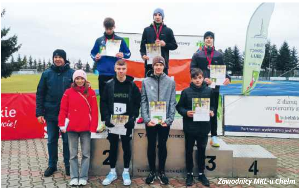
Zawodnicy MKL-u Chełm