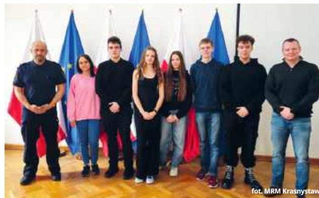
fol. MRM Krasnystaw

- Spotkanie było wynikiem ustaleń z ostatniej sesji młodzieżowej rady i dotyczyło