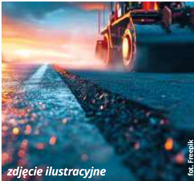
zdjęcie ilustracyjne

● GM. CHEŁM Wydaje się, że przebudowa drogi powiatowej, która łączy Okszów-Kolonię ze Srebrzyszcem, to jedno z tych zadań inwestycyjnych, jakie zarząd powiatu musi tymczasem odłożyć „ad acta”. Nie po myśli inwestora poszły działania związane z opracowaniem dokumentacji projektowej, a i gmina ma wątpliwości związane z wydaniem niezbędnej decyzji o środowiskowych uwarunkowaniach dla tego przedsięwzięcia.