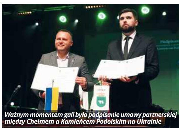
Ważnym momentem gali było podpisanie umowy partnerskiej między Chełmem a Kamińcem Podolskim na Ukrainie