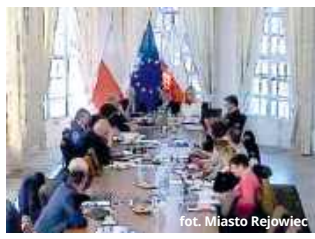
radni. Miasto Rejowiec

- Te dokumenty nie ujrzały tak naprawdę światła dziennego. Z pewnością są osoby, np. nauczyciele, którzy chcieliby