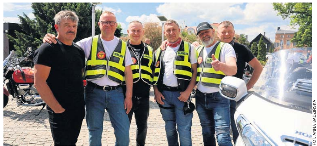
FOT. ANNA BADZIŃSKA

Artyści nie zapomnieli o swoich wiernych fanach również po zejściu ze sceny. Gierliwi i rozentuzjzmowani uczestnicy imprezy mogli liczyć na pamiątkowe zdjęcia ze swoimi idolami, a łowcy autografów wracali do domów z podpisami. ©