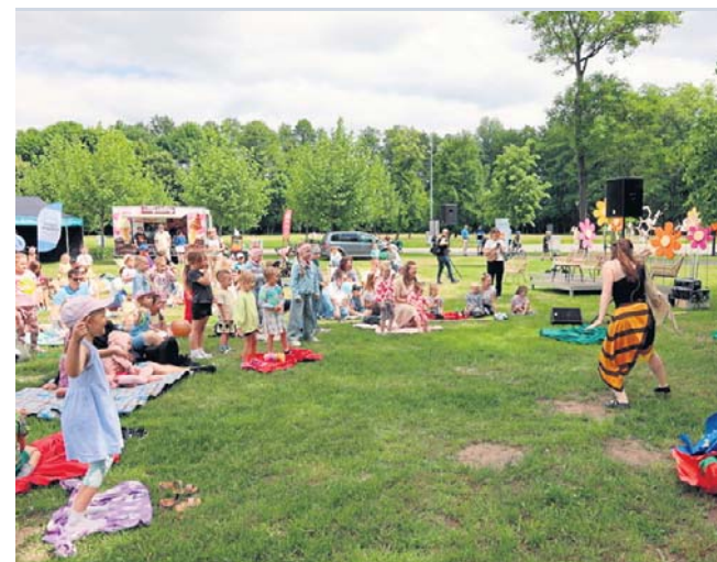
Nie brakowało koców piknikowych oraz dobrej zabawy w otoczeniu zieleni

Anna Badzińska anna.badzinska@polskapress.pl