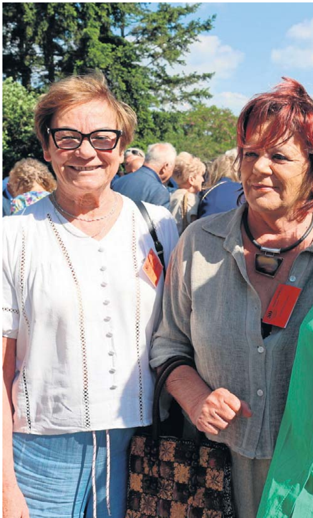
Jednym z najpiękniejszych momentów jubileuszu są spotkania dawnych uczniów

Obchody były również okazją do przekazania jednostce licznych upominków. Zaproszeni goście wręczyli strażakom sprzęt usprawniający codzienną pracę, pamiątkowe tablice oraz nowe elementy wyposażenia. Świętowanie dopełnił pełen atrakcji strażacki festyn. ©©