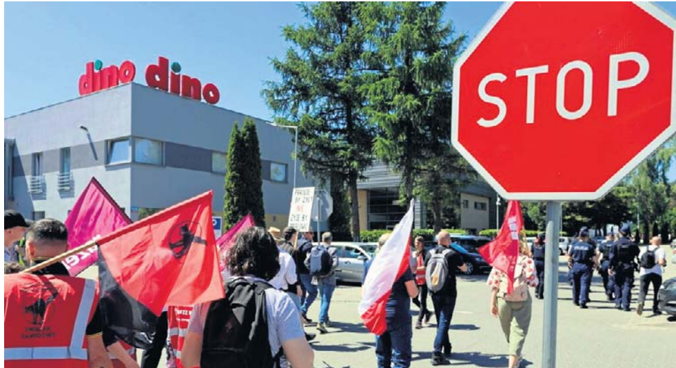
Protestujący przed centralą Dino w Krotoszynie próbowali spotkać się z zarządem sieci. Spotkanie się nie odbyło mimo wezwania do podjęcia rozmów

- Strajk może być zorganizowany bez zachowania zasad określonych w ustawie (dotyczących organizacji referendum strajkowego - przyp. red.), jeżeli bezprawne działanie pracodawcy uniemożliwiło przeprowadzenie rokowań lub mediacji, a także w wypadku, gdy pracodawca rozwiązał stosunek pracy z prowadzącym spór działaczem związkowym. W tej