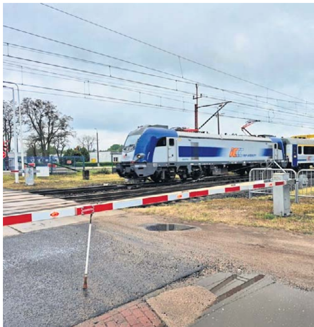
Jeden z przejazdów, który ma zostać zlikwidowany

Dodajmy, że w ramach programu, na liście podstawowej znalazło się 18 lokalizacji z całego kraju. W Wielkopolsce podobne inwestycje planowane są również m.in. w Czempiniu,