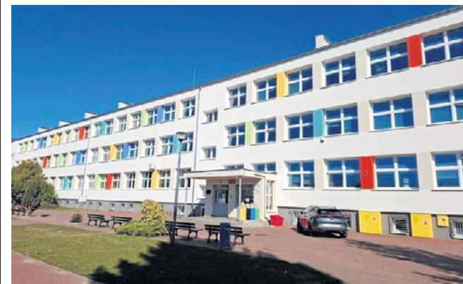
Drzwi otwarte Szkoły Podstawowej nr 1 w Grodzisku Wielkopolskim odbędą się 11 czerwca

Drzwi otwarte odbędą się w czwartek, 11 czerwca, w godzinach od 16:30 do 18. ©