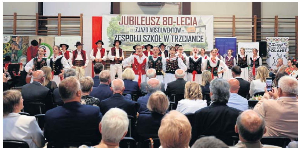
Chlubą szkoły jest Zespół Pieśni i Tańca „Polanie”