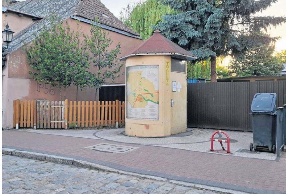
Na terenie Grodziska funkcjonuje łącznie pięć takich obiektów

Dalej podkreślają, że finalna cena zależy od ostatecznej konfiguracji toalety, ponieważ dodatkowe elementy wyposażenia, takie jak automatyczne systemy czy wrzutniki monet, wymagają dopłat.