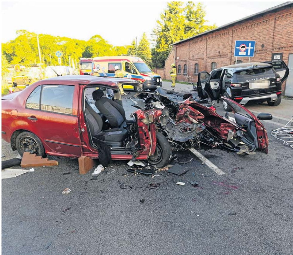
Jak wynika z ustaleń policji, kierowca Skody stracił panowanie nad pojazdem i uderzył czołowo w prawidłowo poruszający się pojazd marki Range Rover

GM. WIELICHOWO STAN NIEMOWŁĘCIA JEST KRYTYCZNY