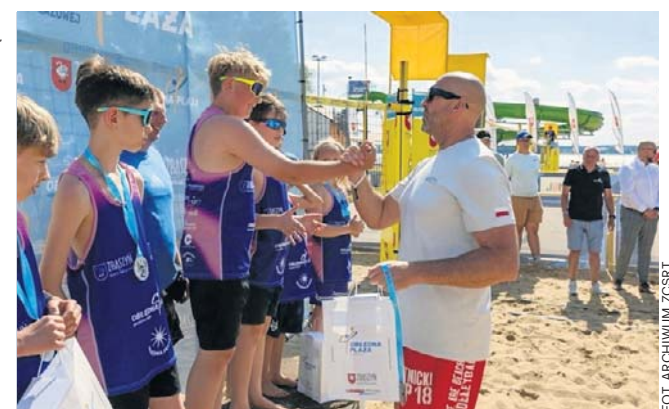
Na boiskach można było oglądać też najmłodszych zawodników