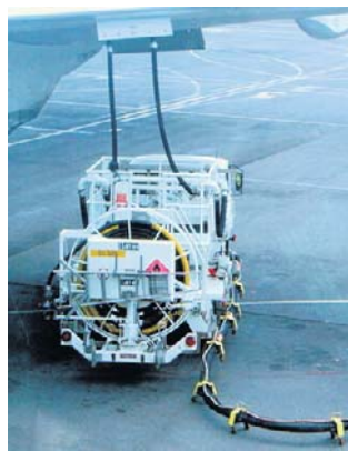
Moskwa zakazała eksportu paliwa lotniczego

W ubiegłym tygodniu Kreml rozważał ograniczenie eksportu oleju napędowego i paliwa lotniczego, o czym pisała we wtorek rosyjska agencja Interfax, powołując się na własne źródła. Z kolei agencja Reutersa poinformowała w piątek, że produkcja oleju napędowego w kraju spadła już o około 20 proc. w kwietniu i maju.