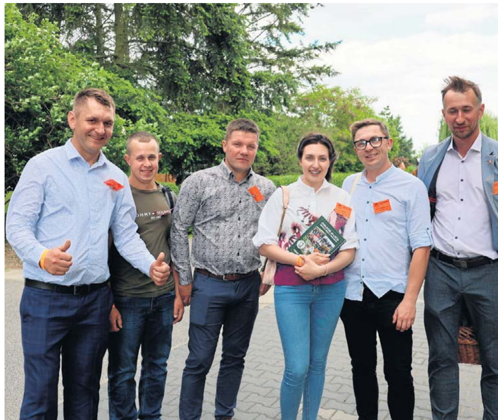
Na teren szkoły wrócili absolwenci wielu roczników - od najstarszych po tych, którzy ukończyli szkołę stosunkowo niedawno