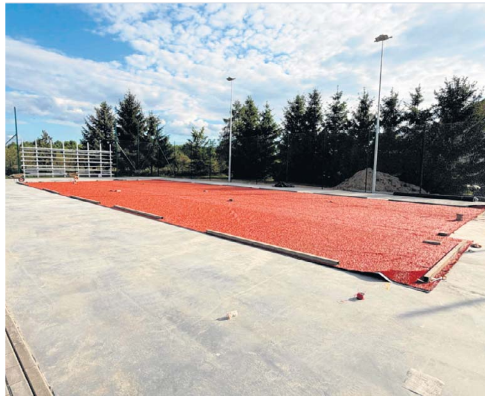
Prace obejmują zarówno istniejącą infrastrukturę, jak i nowe obiekty sportowe

Całkowita wartość realizowanego zadania wynosi 1 mln 881 tys. 900 zł. Co ważne, połowę kosztów pokrywa dofinansowanie pozyskane z Ministerstwa Sportu i Turystyki w ramach programu „Moje boisko - Orlik 2012”. ©