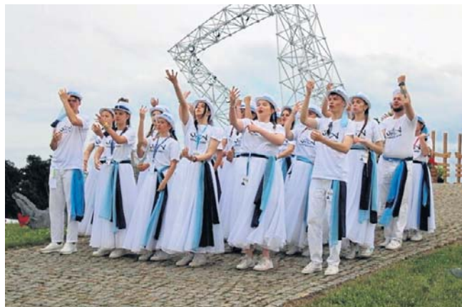
Spotkanie Młodych co roku przyciąga tłumy