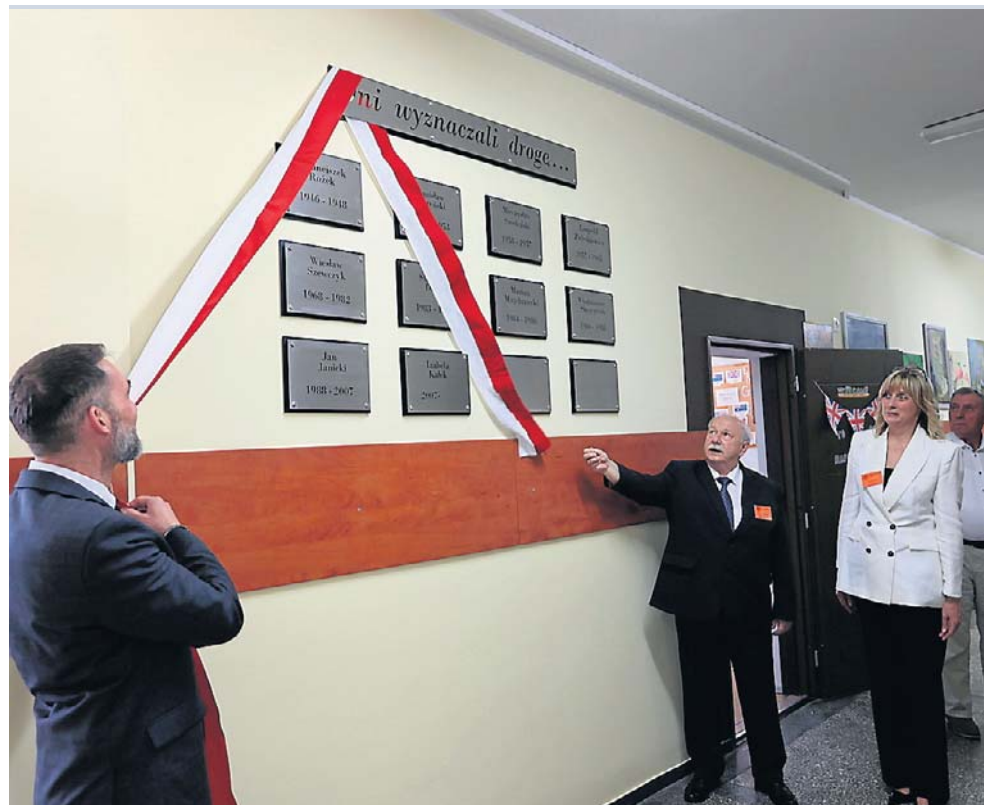
Wyjątkowym i symbolicznym momentem obchodów było również uroczyste odsłonięcie tablic pamiątkowych poświęconych wszystkim dotychczasowym dyrektorom szkoły