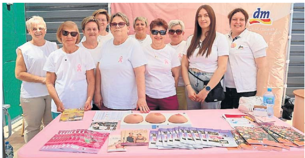
Akcja profilaktyczna w Grodzisku Wielkopolskim odbyła się we wtorek i czwartek

Wtorkowa akcja przy ulicy Fabrycznej trwała do godziny 16, jednak na tym działania grodzkich amazoнок się nie zakończyła. Dla kobiet, które z różnych przyczyn nie zdołały dotrzeć na miejsce, przygotowano kolejną możliwość do zdobycia bezcennej wiedzy. W czwartek, 28 maja, przedstawicielki stowarzyszenia dyżurowały w sklepie Esotiq przy ulicy Przemysłowej. W godzinach od 11 do 18 można było tam otworzyć porozmawiać o barierach profilaktycznych, skonsultować swoje wątpliwości oraz przełamać opór przed regularnymi wizytami u lekarza. ©