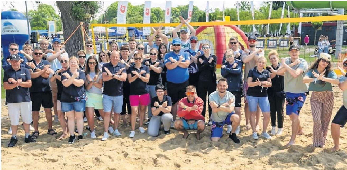
17 boisk i setki rozegranych spotkań – tak wyglądała tegoroczna Obłędna Plaża