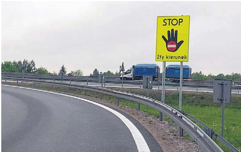
Nie wszyscy kierowcy reagują na takie znaki

drogę innym kierowcom. Świadkiem tej szaleńczej jazdy był Przemysław Koperski, wiceminister infrastruktury,