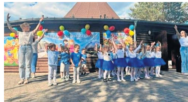
Urodzinowe świętowanie przeniosło się w tym roku do Zdroju

młodsi oblegali dmuchane zamki oraz ustawioną na miejscu fotobudkę, w której można było zrobić pamiątkowe zdjęcia. Wielką atrakcją, zwłaszcza dla małych fanów motoryzacji, okazał się grillowóz druhow z OSP Grąblewo, którzy dbali o podniebienia gości. ©©