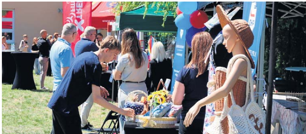
Piknik odbył się na terenie Powiatowego Centrum Sportu przy osiedlu Północ

Jednym z głównych punktów wydarzenia była prezentacja stoisk lokalnych przedsiębiorców, instytucji i organizacji.