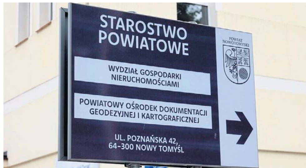
Jest osoba zastępująca. Wkrótce konkurs

W związku z pojawiającymi się informacjami, nasza redakcja skontaktowała się ze starostą