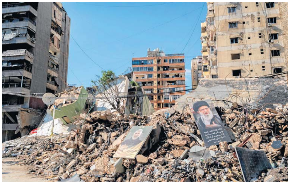
Zniszczone budynki na południowych przedmieściach Bejrutu. Tysiące mieszkańców po atakach trwających od marca zostało zmuszonych do opuszczenia swoich domów

Walki w Libanie były jednym z najbardziej znaczących skutków ubocznych wojny z Iranem - ocenił Reuters. Od 2 marca, kiedy Hezbollah rozpoczął raketowy i dronowy ostrzał Izraela, ponad 1,2 mln Libańczyków musiało opuścić domy w wyniku izraelskich