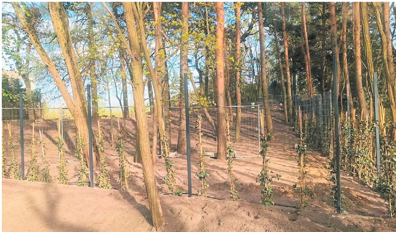
Zdjęcie opublikowane w mediach społecznościowych

Przed wszystkim należy bardzo wyraźnie podkreślić, że nie doszło do sprzedaży parku ani jego prywatyzacji. Przedmiotem zamiany były wydzielone działki położone na obrzeżach parku, które zgodnie