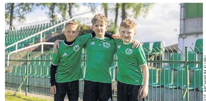
To nie tylko okazja do rozwijania młodych talentów piłkarskich, ale również szansa na udział w profesjonalnych treningach, rywalizację w ligach WZPN i w przyszłości możliwość awansu do seniorskiej kadry biało-zielonych

Po wysłaniu formularza wszystkie szczegóły dotyczące kolejnych kroków zostaną przesłane bezpośrednio na adres e-mail opiekuna. Wszelkie pytania i wątpliwości można kierować na klubową skrzynkę ma-