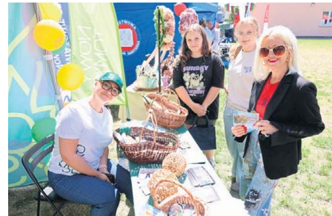
W wydarzeniu licznie uczestniczyli uczniowie szkół podstawowych i ponadpodstawowych