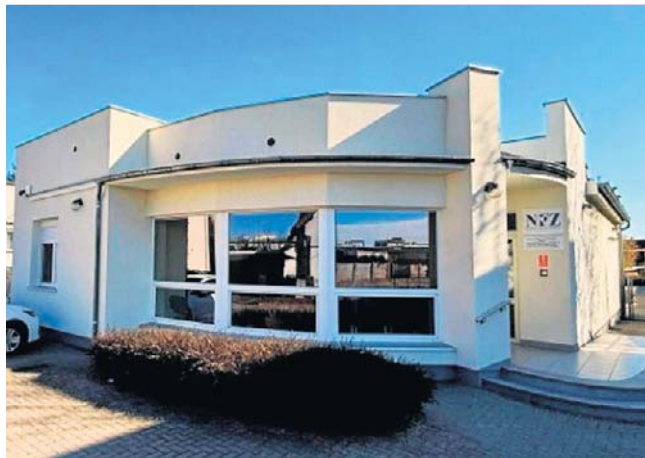
Niepubliczna Szkoła Podstawowa rozpoczęła właśnie nabór do klas specjalnych

Kluczem do sukcesu nowej placówki ma być praca w bardzo małych zespołach. Taka organizacja pozwoli nauczycielom na precyzyjne dopasowanie metod dydaktycznych do realnych możliwości każ-