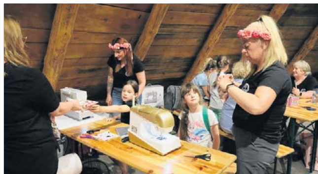
Panie z KGW w Zdroju zorganizowały z kolei fantastyczne warsztaty rękodzieła