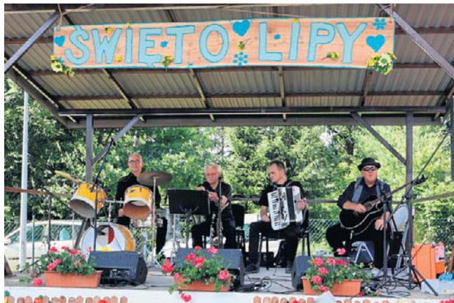
Zdjęcie z poprzednich edycji wydarzenia

Miłośnicy folkloru, tradycji i dobrej zabawy już mogą rezerwować termin w kalendarzu. W sobotę, 13 czerwca, w Jabłonce Starej odbędzie się wyjątkowe wydarzenie „Święto Lipy na Ludowo”. Organizatorzy przygotowali mnóstwo atrakcji inspirowanych kulturą ludową, a na uczestników czekać będą występy, konkursy, muzyka na żywo oraz wspólna zabawa pod gołym niebem.