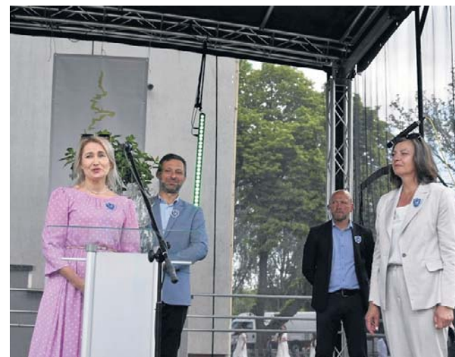
Jubileusz stał się również okazją do wyrażenia wdzięczności wszystkim, którzy przez lata współtworzyli społeczność szkoły

W swoim wystąpieniu zaznaczył również ogromną rolę kolejnych pokoleń nauczycieli, dyrektorów i pracowników szkoły, którzy przez dziesięciolecie dbali o rozwój placówki i wysoki poziom edukacji.