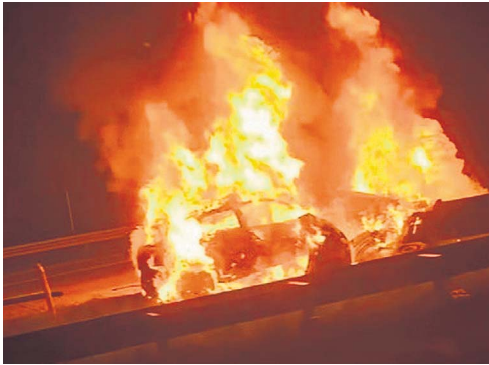
Efekt nocnego czołowego zderzenia na autostradzie A1

Okazało, że jechał autostradą pod prąd 27 kilometrów, po czym zawrócił, zajeżdżając