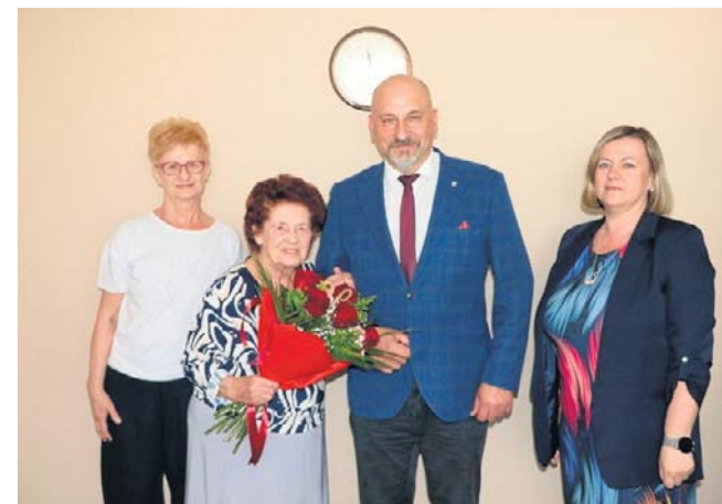
Nie brakowało okolicznościowego bukietu kwiatów

każdy kolejny dzień będzie wolny od trosk, a ewentualne codzienne trudności napotykała na niewyczerpane pokłady cierpliwości i pogody ducha. Życzymy wielu lat zasłużonego odpoczynku w gronie kochającej rodziny. ©©