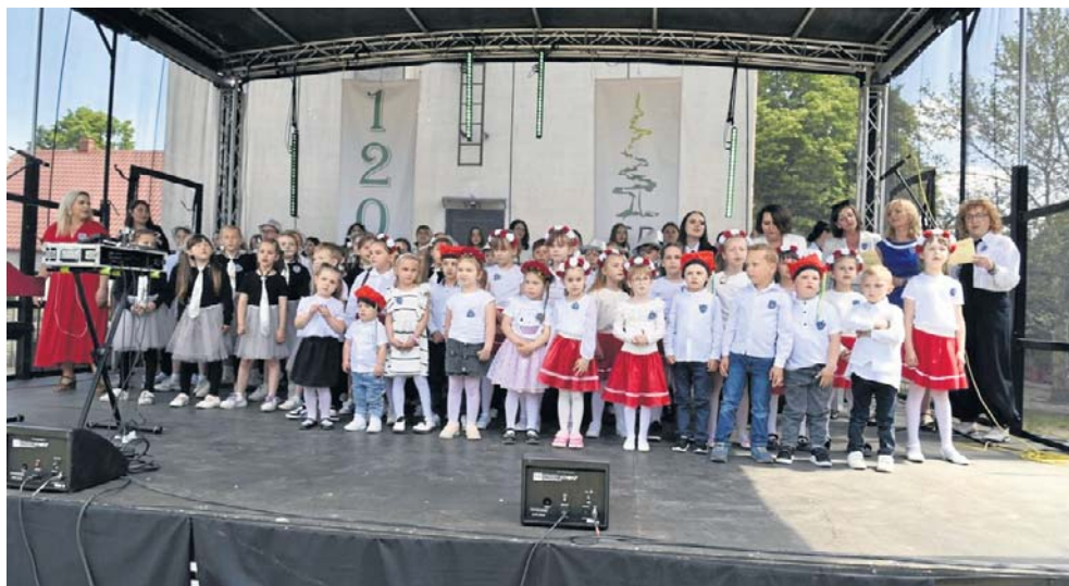
Nie zabrakło części artystycznej przygotowanej przez uczniów