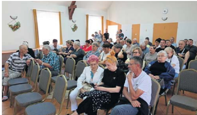
Zdjęcia wykonano przed rozpoczęciem zebrania w sali wiejskiej w Głuponiach

Według relacji spółdzielców, byli członkowie zarządu mieli kilka lat temu przekonywać udziałowców do sprzedaży udziałów za stosunkowo niewielkie kwoty, wskazując na trudną sytuację finansową spółdzielni i możliwość jej likwidacji. Część osób - jak twierdzili nasi rozmówcy - miała podejmować decyzje pod presją i w oba-