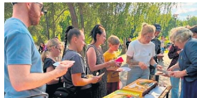
Podczas obchodów nie zabrakło gigantycznego tortu, który starczył dla wszystkich