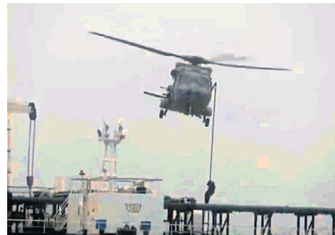
Francuska marynarka wojenna dokonała przejęcia tankowca Tagor na wodach Oceanu Atlantyckiego

W styczniu Francja zatrzymała na Morzu Śródziemnym tankowiec Grinch. W marcu doszło do zatrzymania tankowca Deyna. Oba są zaliczane do rosyjskiej „floty cieni”. PAP