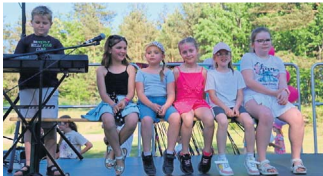
Od samego początku scenę opanowali najmłodsi

warsztaty rękodzieła, podczas których uczestnicy mogli spróbować swoich sił w szyciu unikalnych poduszek oraz tradycyjnym dzierganiu.