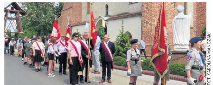
Wydarzenie było okazją do wspólnego pielęgnowania pamięci historycznej, ale również integracji środowisk pielęgnujących dziedzictwo powstania

Dużym zainteresowaniem cieszyły się także pokazy grupy rekonstrukcyjnej, prezentacja pojazdu pancernego z okresu Powstania Wielkopolskiego oraz tradycyjna wojskowa grochówka, która – jak co roku – przyciągnęła wielu uczestników.