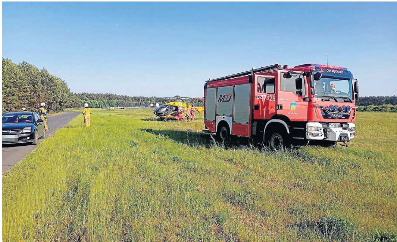
Śmigłowcem LPR został przetransportowany do szpitala

Policjanci przypominają, że nie warto czekać na zmiany w przepisach, które wprowadzą nakaz jazdy w kaskach. Zadbajmy o własne bezpieczeństwo już teraz. ©