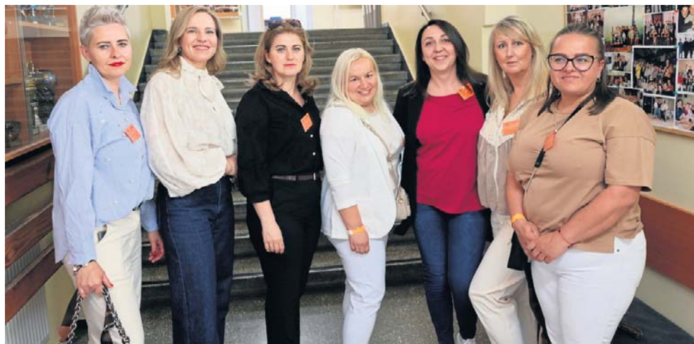
Historia szkoły obecna była na niemal każdym kroku - w rozmowach absolwentów oraz fotografiach z minionych lat