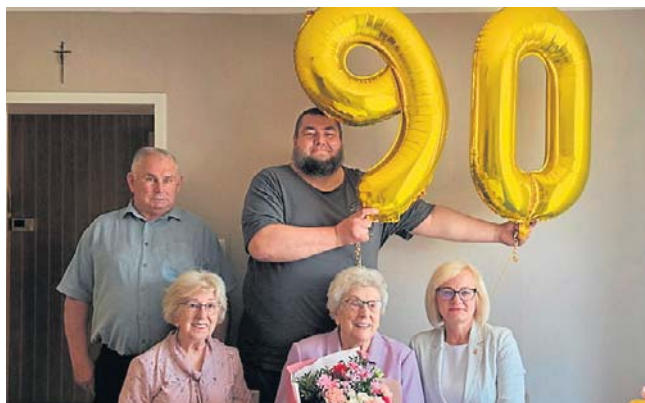
Jubilatka od urodzenia mieszka w Wielichowie