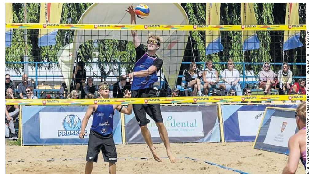
Zawodnicy mogli liczyć na doping publiczności