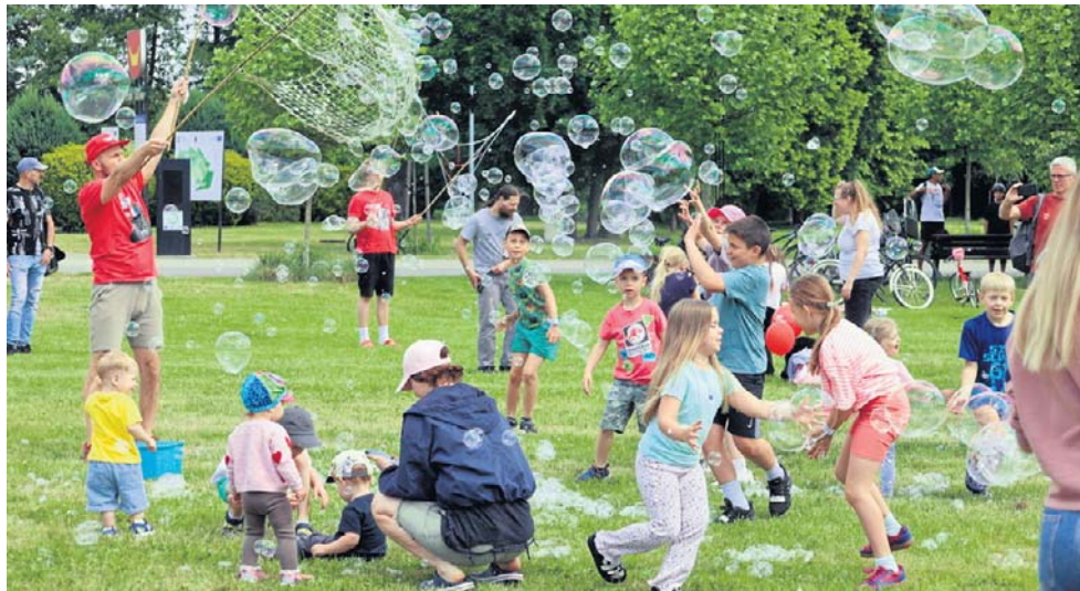
Kolorowe bańki unoszące się nad parkiem przyciągały dzieci

Dużym zainteresowaniem cieszył się spektakl „Pszczółki to mistrzyni” przygotowany przez Teatr Mozaika. Najmłodsi