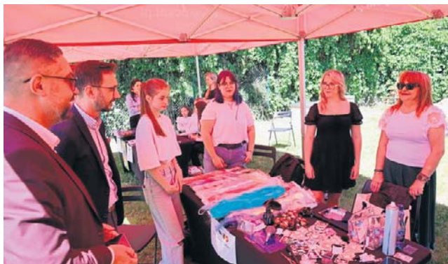
Jednym z głównych punktów wydarzenia była prezentacja stoisk lokalnych przedsiębiorców, instytucji i organizacji