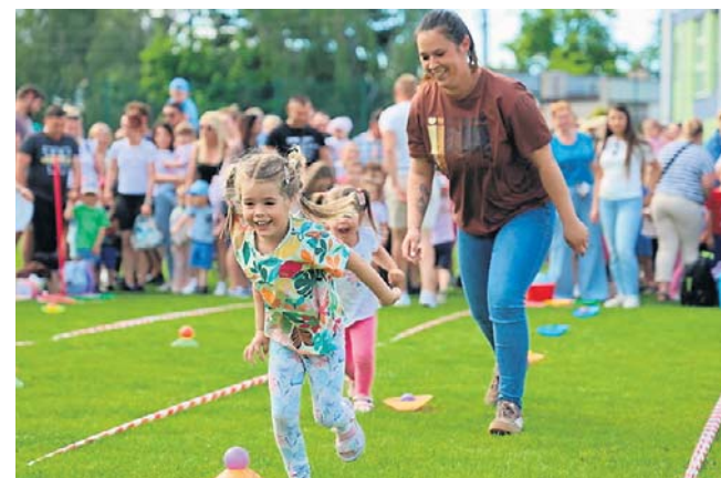
W przygotowanych zabawach liczyły się szybkość i zwinność, a także dobra współpraca w duetach

się w kolejkach do malowania twarzy, zaplatania kolorowych warkoczyków czy robienia zmywalnych tatuaży. Wielu chętnych przyciągnęła także loteria fantowa z nagrodami. Na tych, którzy potrzebowali chwili wytchnienia po sportowych wyczynach, czekała kawiarenka. Cały dochód z festynu zostanie przeznaczony na rzecz przedszkola „Bajkowa Kraina”. ©©