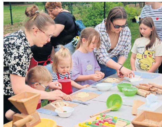
Przez cały czas trwania wydarzenia uczestnicy korzystali z licznych warsztatów

Imprez z okazji Dnia Dziecka nie brakowało w całym naszym regionie. ©©