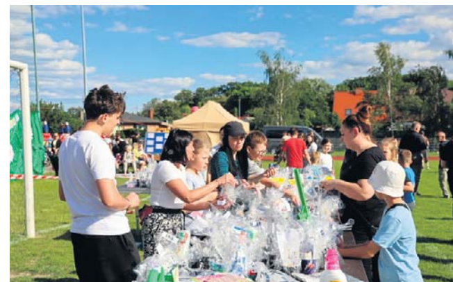
Wielu chętnych przyciągnęła także loteria fantowa z nagrodami