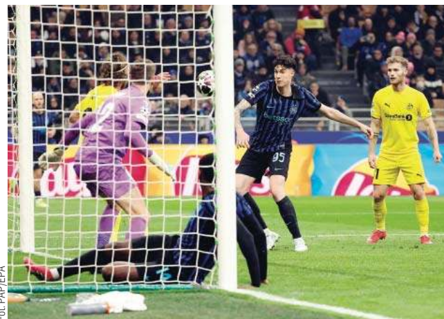
W Mediolanie słynny Inter tylko raz pokonał bramkarza norweskiego zespołu

„Kompromitacja Interu” – to najczęściej powtarzane słowa we włoskich mediach po wtorkowym meczu w Mediolanie. Zwycięstwo norweskiego klubu uznano