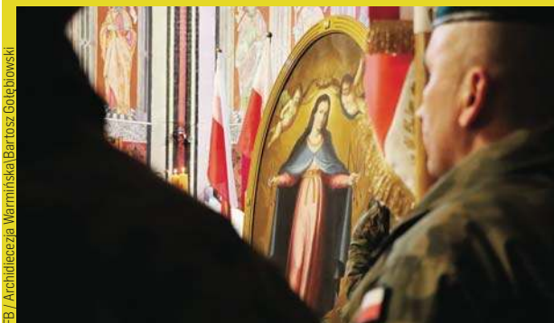
Obraz Matki Bożej Łaskawej Patronki Warszawy i Strażniczki Polski kilka dni temu zawitał do Olsztyna

Obraz Matki Bożej Łaskawej, który od kilku lat nawiedza parafie w całej Polsce, 26 lutego zostanie powitany w parafii wojskowo-cywilnej św. Wojciecha w Braniewie. Wcześniej zatrzymał się w Olsztynie i Elblągu, gromadząc żołnierzy oraz mieszkańców na wspólnej modlitwie.