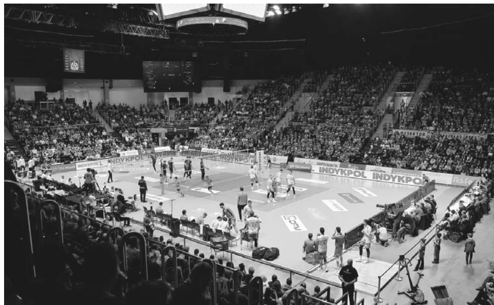
Bilety na mecz z mistrzami Polski rozeszły się w błyskawicznym tempie