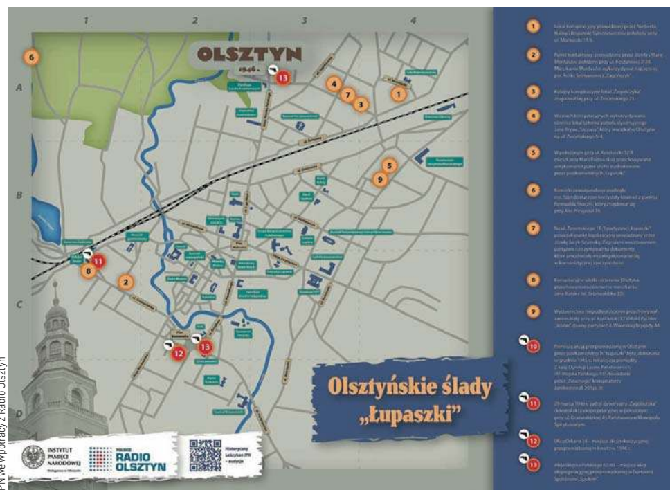
Mapa mieszkań konspiracyjnych Łupaszk w Olsztynie