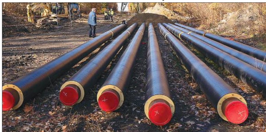
Przy modernizacji i rozbudowie sieci Zabrzańskiego Przedsiębiorstwa Energetyki Ciepłej wykorzystywane są najnowocześniejsze technologie i materiały.

W ramach projektu na terenie oczyszczalni ścieków Śródmieście przy ul. Pestalozziego 10 w Zabrze-Maciejowie, powstanie farma fotowoltaiczna o mocy 1,4 MW, silnik gazowy kogeneracyjny zasilany biogazem (będzie miał moc około 0,5 MW i wytwarzać będzie jednocześnie energię elektryczną i ciepło) oraz pompa ciepła wykorzystująca ciepło z wody oczyszczonych ścieków. Owa pompa będzie sercem całego systemu i będzie specjal-