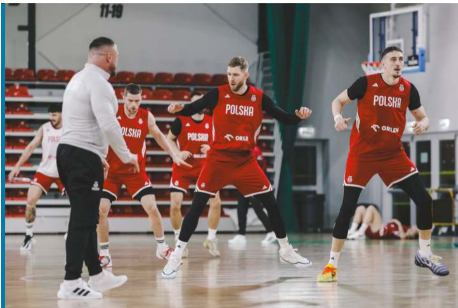
Reprezentacja Polski do dwumeczu z Łotwą przygotowywała się na obiektach w Warszawie.