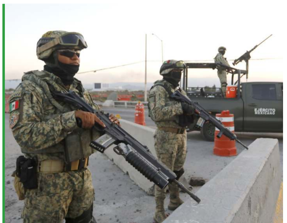
Meksykańskie wojsko przed lotniskiem w Guadalajarze, gdzie już za niedługo mają lądować tysiące fanów z całego świata.