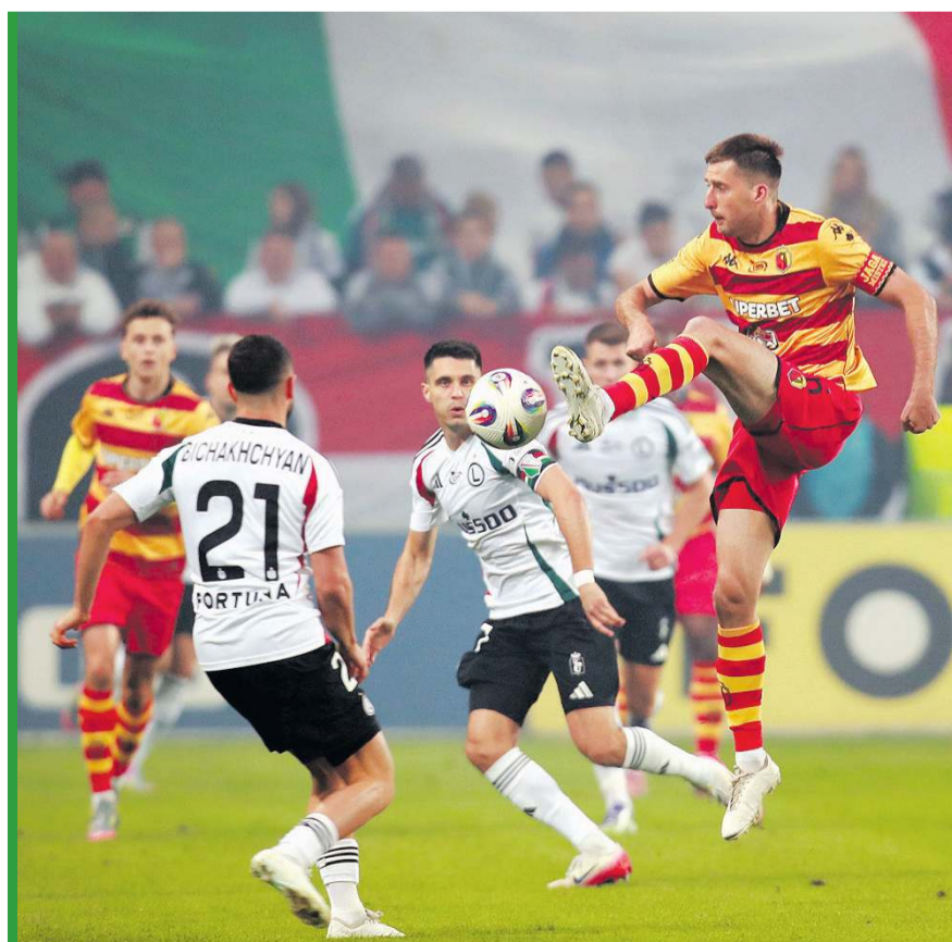
Czy Jagiellonia pograży w niedzielę Legię?