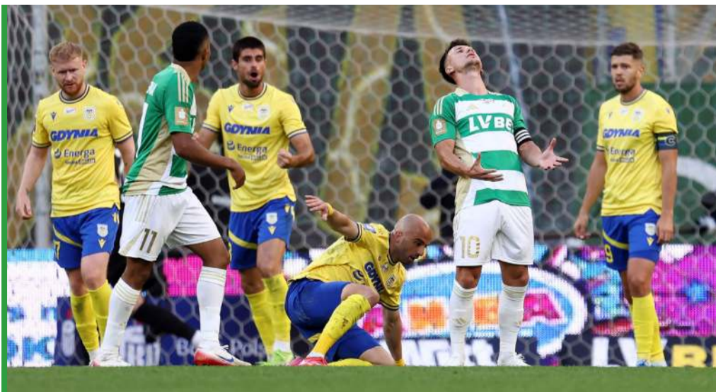
Trójmiejskie derby to wydarzenie na skalę nie tylko Pomorza!