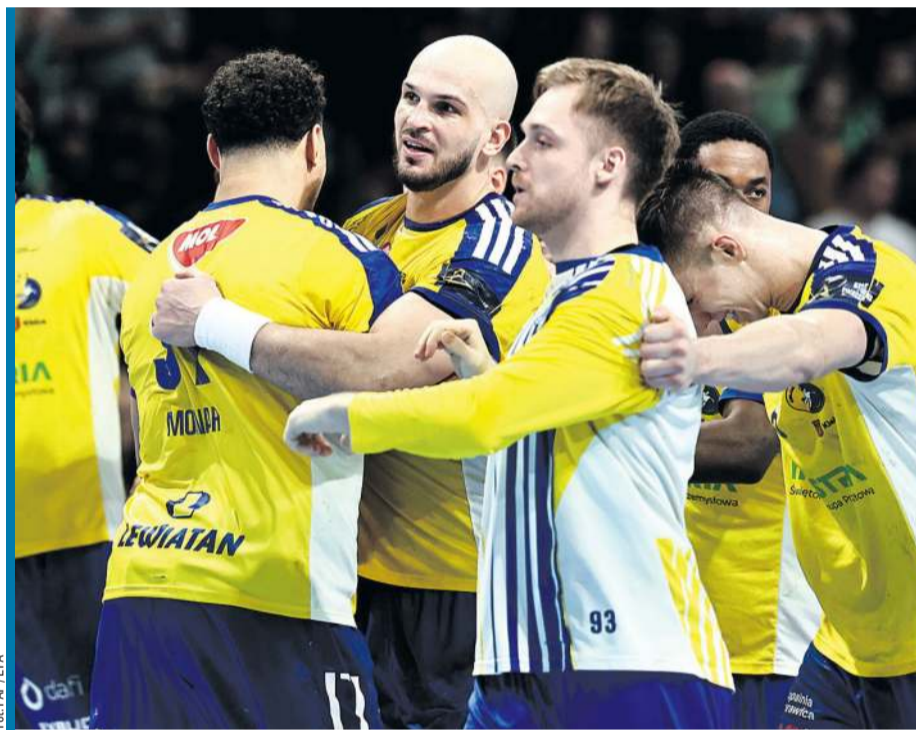
Kielczanie celebrowali ogromny sukces w berlińskiej Max Schmeling-Halle.

Dujszebajew. Tym samym ogromna sensacja stała się faktem. Od remisu (33:33) Z HBC Nantes w zeszłym sezonie Lisy odprawiły z kwitkiem dwunastu z rzędu rywali. Po 13. zwycięstwo we własnej hali nie zdążyli już sięgnąć.