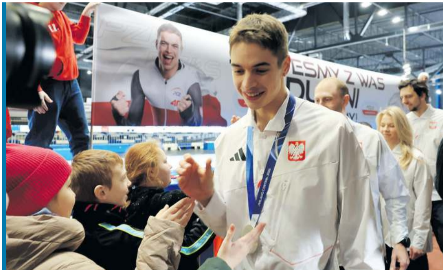
Srebrny medalista olimpijski wzbudza ogromne zainteresowanie.

S emirunnij jest jedynym reprezentantem Polski w kadrze panczenistów, który stanął na podium zakończonych w niedzielę igrzysk olimpijskich Mediolan-Cortina d'Ampezzo. Po powrocie do kraju urodzony w Jekaterynburgu srebrny medalista na 10 000 m zyskał dużą popularność. Jak przyznał, nie spodziewał się aż tak duże zainteresowania ze strony kibiców oraz mediów, ale – jak zapewnił – rozdawanie autografów i robienie zdjęć z fanami nie stanowi dla niego kłopotu i nie zmienia jego nastawienia do podejścia do treningów oraz kolejnych startów. – Przede mną mistrzostwa świata, a dziś po południu siłownia – żartował w rozmowie z dziennikarzami podczas uroczystego powitania w Tomaszowie Mazowieckim, w którym mieszka od ponad dwóch lat.