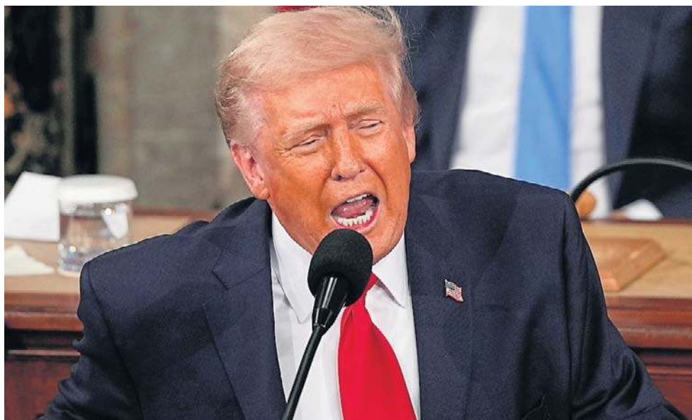
Przemawiając przez godzinę i 48 minut, Donald Trump mówił o wielkich chwilach, jakie czekają w najbliższej przyszłości Amerykę i krytykował Demokratów

Trump - mierzący się z podupadającymi notowaniami i gniewem wyborców z powodu wysokich kosztów życia - poświęcił większość przemówienia podkreślanie świetnej jego zdaniem kondycji gospodarki, wielokrotnie w charakterystycznym stylu wyolbrzymiając statystyki i liczby. Wbrew faktom twierdził, że inflacja „pikuje” i - zgodnie z prawdą - że ceny benzyny są niższe niż za jego poprzednika. Twierdził też, że za jego rządów zagraniczne firmy zadeklarowały inwestycje w wysokości 18 bln dolarów, choć kwota ta