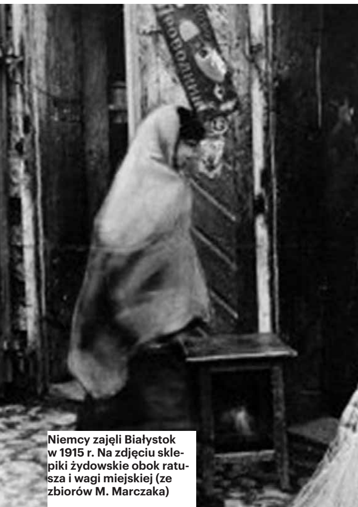
Niemcy zajęli Białystok w 1915 r. Na zdjęciu sklepiki żydowskie obok ratusza i wagi miejskiej

dowska« u progu i na początku istnienia drugiej Rzeczypospolitej».