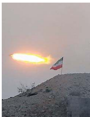
Ćwiczenia rakietowe sił wojskowych Iranu

Eventualna sprzedaż broni miałaby miejsce w kontekście