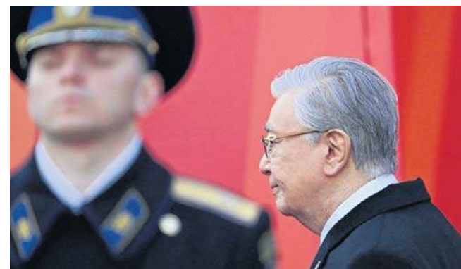
Prezydent Kazachstanu Kasym-Żomart Tokajew wraz ze swoim rządem promuje tożsamość etniczną Kazachów

Proponowana zmiana odzwierciedla zmiany demograficzne w Kazachstanie. Kazachowie stanowią obecnie ponad 70% ogółu ludności, a etniczni Rosjanie mniej niż 15%.