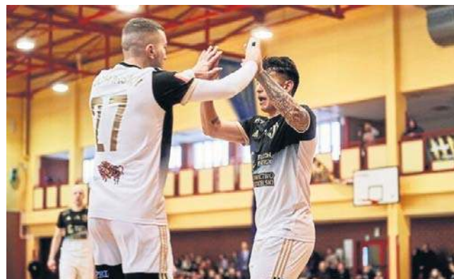
Jagiellończycy są w tym roku w uderzeniu. Każdemu z pierwszoligowych przeciwników strzeli po 8 goli.

Wynik mógł być bardziej okazały i na pewno byliśmy nieskuteczni. Szkoda dwóch bramek, bo za każde stracone