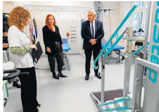
Zmodernizowaną poradnię rehabilitacyjną przy ul. Swobodnej wyposażono też w nowoczesny sprzęt

- Oddajemy do użytku nowoczesną poradnię rehabilitacyjną, która będzie służyła mieszkańcom miasta - mówił podczas uroczystego otwarcia prezydent Tadeusz Truskolaski. - Uzyskaliśmy ponad 80 proc. dofinansowania z programu Internext Polska-Ukraina, co pozwoliło na remont i zakup nowego sprzętu. To projekt nie tylko dla Białegostoku, ale także w ramach współpracy z Włodzimierzem na Ukrainie. Rehabilitacja jest dziś niezbędna zarówno w warunkach pokojowych, jak i w sytuacjach kryzysowych, kiedy pomoc medyczna dla osób poszkodowanych jest szczególnie ważna.