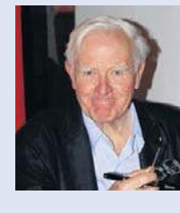
JOHN LE CARRÉ (1931-2020)

– powtórzyła, nadal wpatrując się w noc. – Zdecydowane „nie”. Pan Pine nie ma żadnych podejrzeń, jak ta informacja mogła dotrzeć do Londynu albo wpaść w ucho przyjaciół pana Ropera. Nie ma żadnych podejrzeń co do sejfu, papierów... – Nie. Nie ma. Przykro mi.