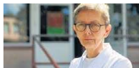
FOT. WOJCIECH WOJTKIEWICZ

Co 3. osoba w wieku 65 plus może zachorować na półpaśca. Rozmowa z prof. Joanną Zajkowską str. 2