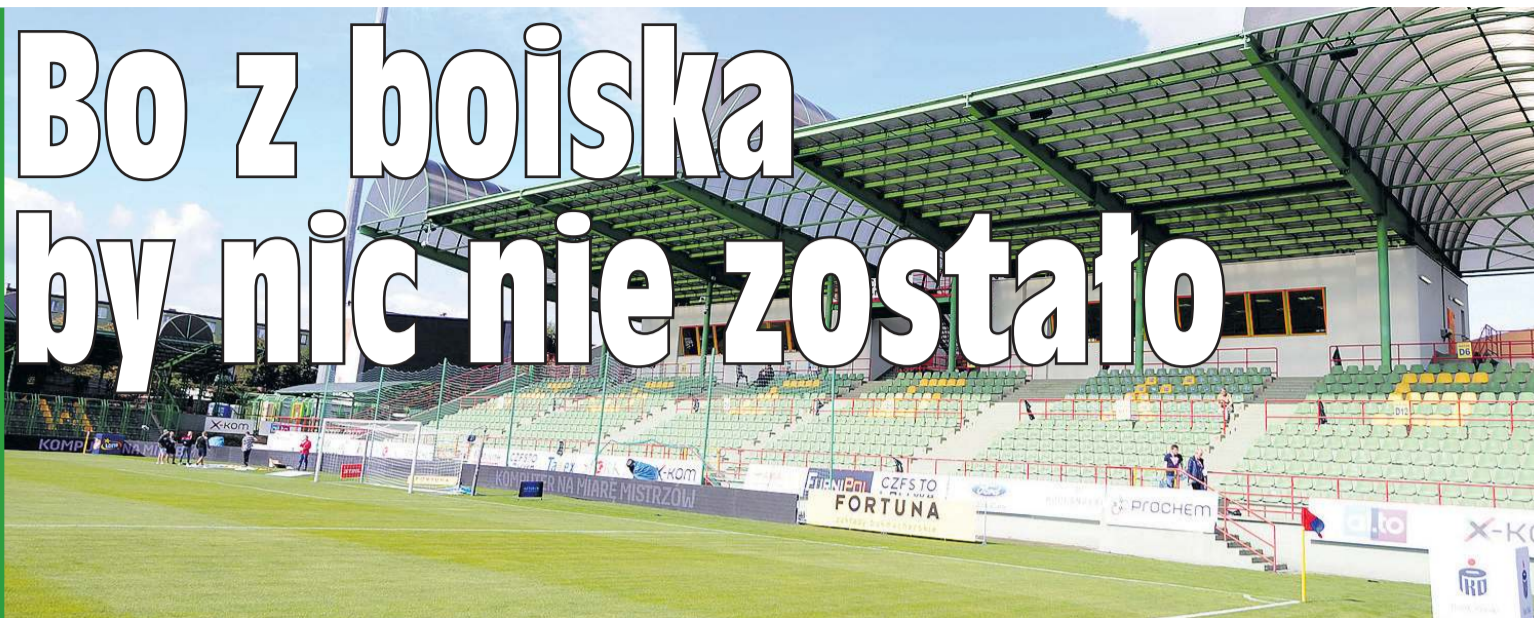
Na tym stadionie, ale przy zgaszonych jupiterach i bez wsparcia publiczności walczyć dziś będą zespoły z Łodzi i Bielska-Białej. Siła wyższa...