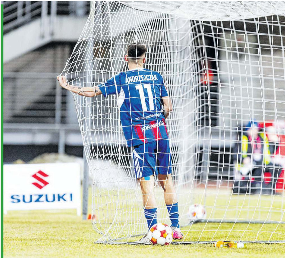
Piłkarze Polonii potrzebują się szybko wypłatać...

– Kibicuję wszystkim śląskim drużynom, ale w Polonii jako zawodnik, a potem też drugi trener,