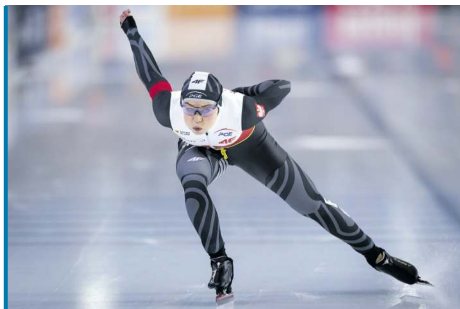
Polkę od podium dzieli zaledwie 0,13 sekundy.