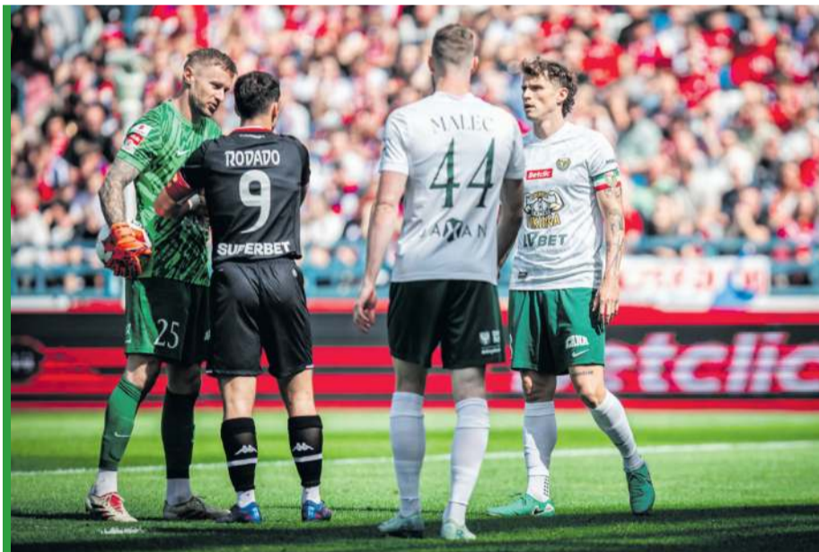
Pod koniec sierpnia zeszłego roku Wisła wygrała u siebie ze Śląskiem 5:0. Do rewanżu we Wrocławiu nie dojdzie...

Z kolei Wisła domagała się od władz PZPN, w przypadku podtrzymania decyzji o niewpuszczeniu kibiców, przyznania walkowera, rozegrania meczu na innym stadionie, bądź przeniesienia na inny termin. Te propozycje nie zostały