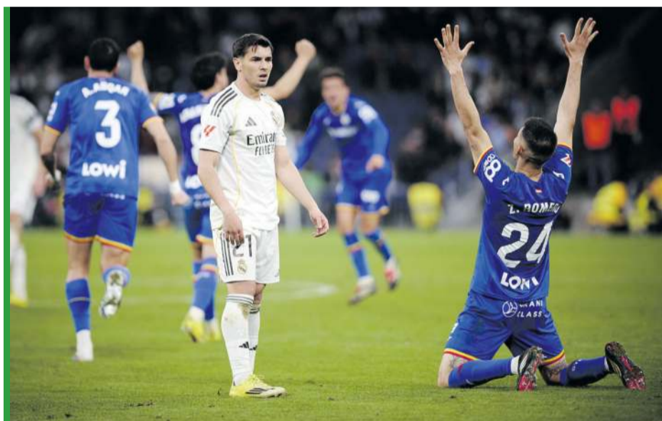
Wymowny obrazek cieszących się piłkarzy Getafe i zdezorientowanego Brahimy Diaza.