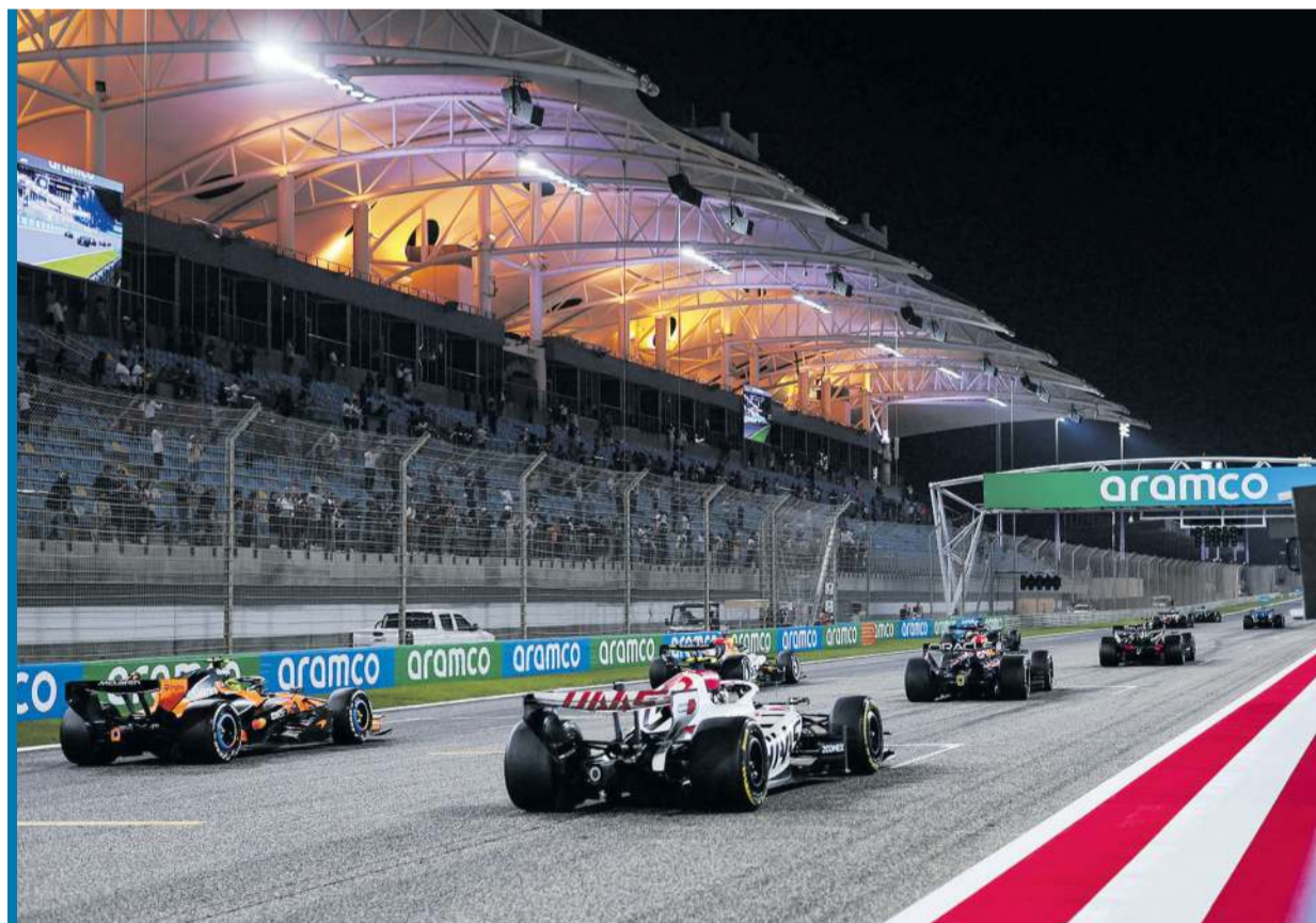
Jeszcze w lutym kierowcy przeprowadzili ostatnie testy w Bahrajnie, ale wyścigi na Bliskim Wschodzie stanęły pod znakiem zapytania.

WYGRANYCH wyścigów F1 - rekordowo - ma Brytyjczyk Lewis Hamilton. Drugi pod tym względem jest Niemiec Michael Schumacher - 91, a trzeci Holender Max Verstappen - 71. Jedyny Polak w historii cyklu, Robert Kubica, ma jedną wygraną - w 2008 r. w Kanadzie.