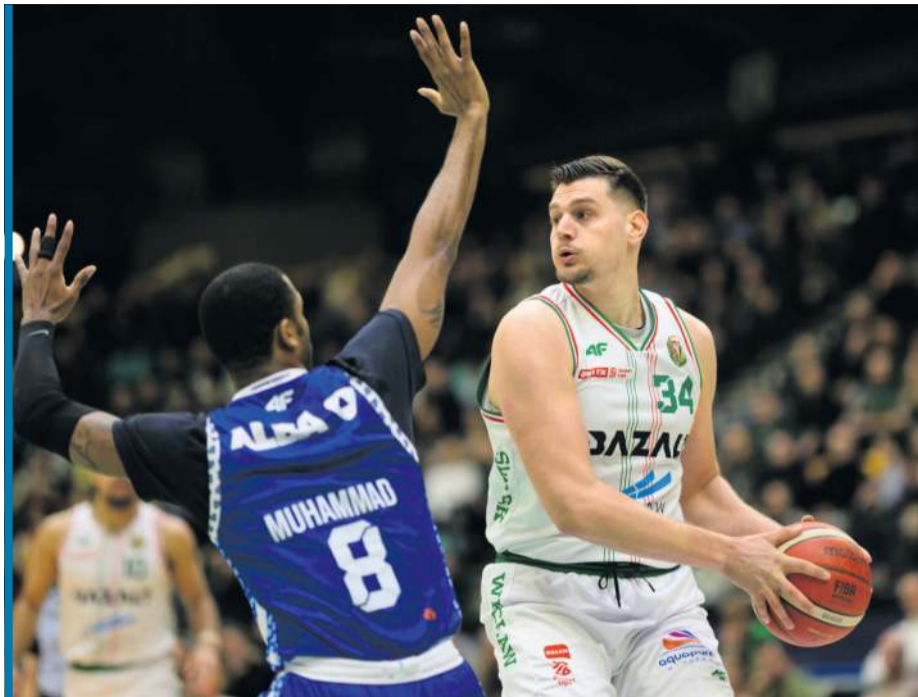
W czwartek w hali Orbita nie było silnych na wrocławskiego środkowego.