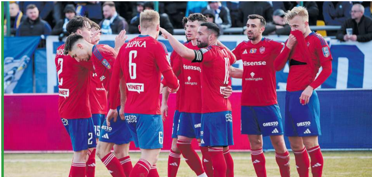
Raków awansował, ale o meczu w Świdniku będzie chciał jak najszybciej zapomnieć.