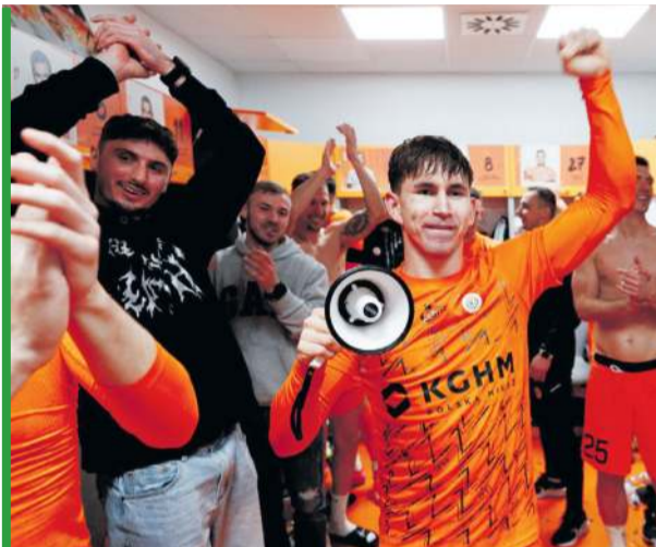
Zagłębie Lubin niespodziewanie wyrosło na jednego z kandydatów do mistrzostwa.

– Jasne! Powiem więcej – Legia zachowała się głupio, bo zrobiła kompletną rewolucję. Doszło do wielu zmian w kadrze, zmieniono też trenera, który osiągnął niezły wynik, awansując