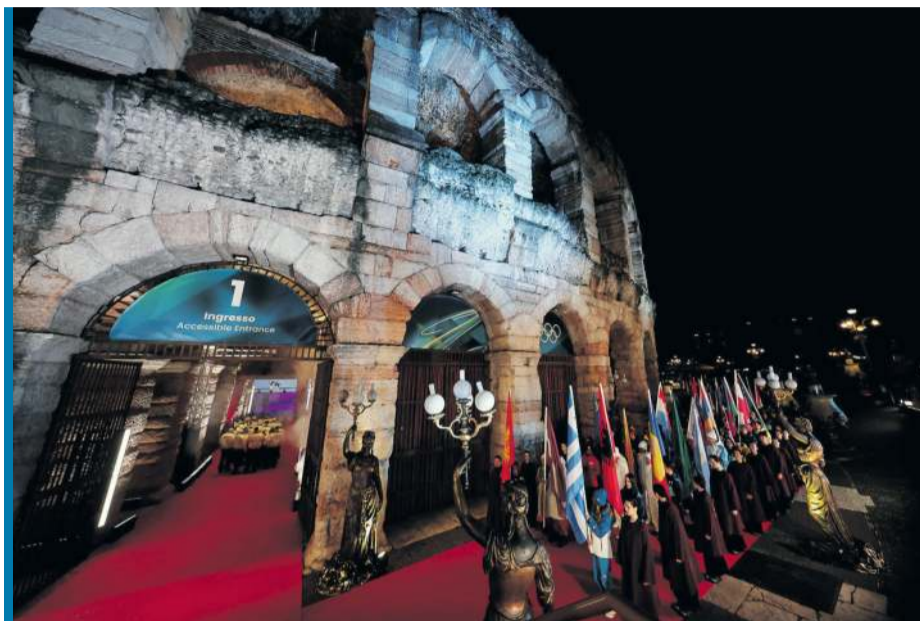
Arena di Verona czeka...

Ceremonia otwarcia paralimpiady rozpocznie się w piątek o 20.00 w antycznym amfiteatrze w Weronie, a więc w tym samym nadzwyczajnym miejscu, w którym 22 lutego zamknięto igrzyska olimpijskie podczas spektakularnej uroczystości. Podobnie jak wtedy obecna będzie