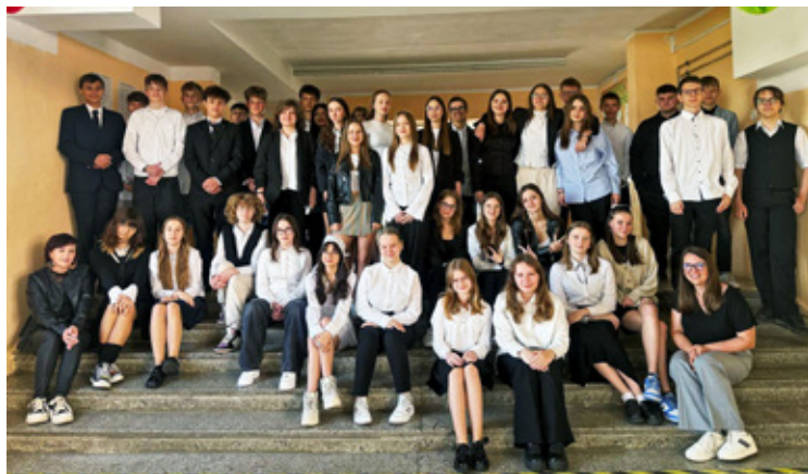
Wińsko. Szkoła Podstawowa Wińsko