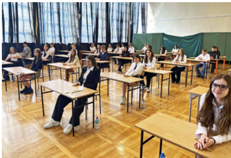
Wińsko. Szkoła Podstawowa Wińsko