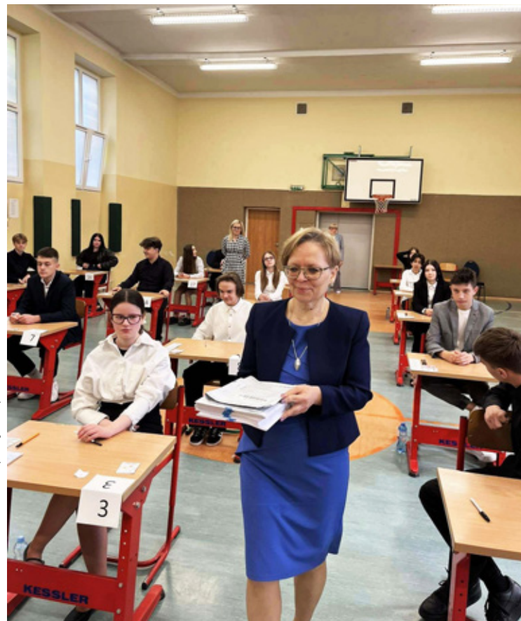
Brzeg Dolny. Zespół Szkolno-Przedszkolny nr 3 w Brzegu Dolnym