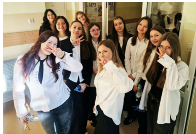
Brzeg Dolny. Zespół Szkolno-Przedszkolny nr 1 w Brzegu Dolnym