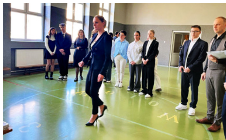
Wołów. Szkoła Podstawowa nr 2 im. Orłąt Lwowskich w Wołowie