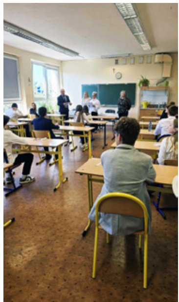
Lubiąż. Zespół Szkół Publicznych Lubiąż