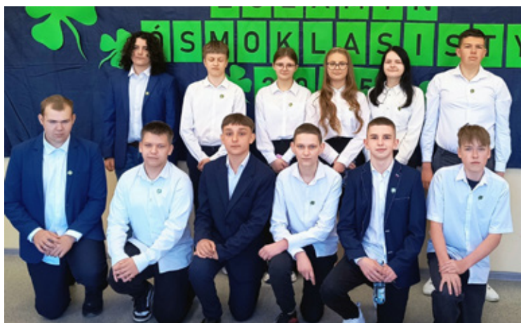
Warzęgowo. Szkoła Podstawowa im. Królowej Jadwigi