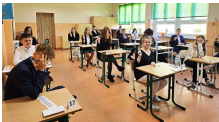
Stary Wołów. Szkoła Podstawowa im. Kornela Makuszyńskiego w Starym Wołowie