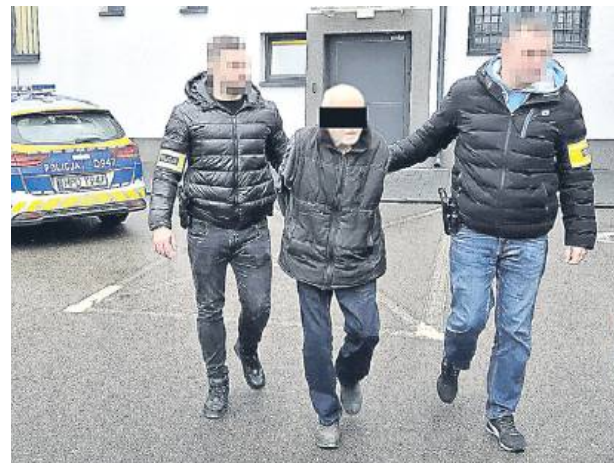
Zatrzymany 73-latek usłyszał zarzut usiłowania zabójstwa. 3 najbliższe miesiące mężczyzna spędzi w areszcie tymczasowym.

Do dramatycznych wydarzeń doszło w sobotę, 15 listopada. Policjanci sprawdzali interwencję dotyczącą przemocy domowej. Ze zgłoszenia wynikało, że 73-letnia kobieta została pobita przez męża. Z obrażeniami trafiła do szpitala. Mundurowi ustalili, że podczas awantury domowej mężczyzna pobił i skopał