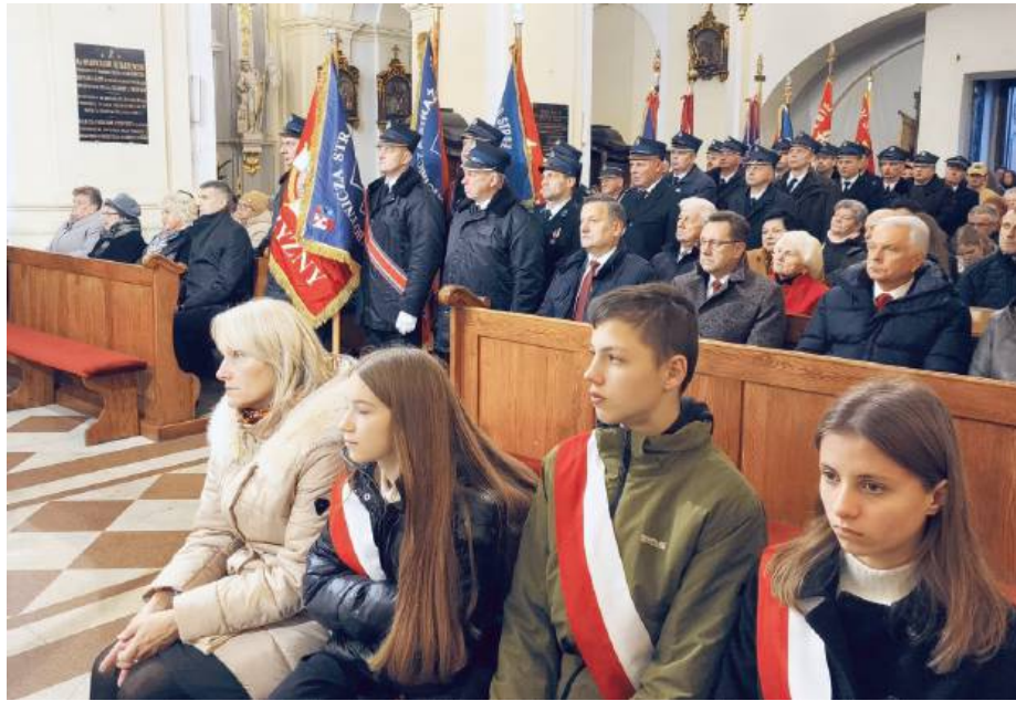
Gmina świętowała swoje 600-lecie.

Dalsze uroczystości odbyły się w Gminnym Ośrodku Kultury i Sportu, gdzie miała miejsce ju-