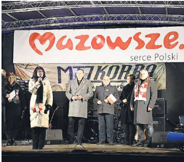
Na scenie pojawili się goście honorowi

Dopiero wtedy ruszyła parada – głośna, widowiskowa, pełna energii i pozytywnych emocji. Przejazd ulicami Siedlec