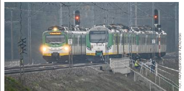
Ogledziny przeprowadzone przez policję wykazały poważne uszkodzenie fragmentu toru

Eksplzja niedaleko stacji Mika (powiat garwoliński) miała najprawdopodobniej na celu wysadzenie pociągu na trasie Warszawa-Dęblin. „Nie ma wątpliwości, że mamy do czynienia z aktem dywersji” - poinformował premier Donald Tusk.