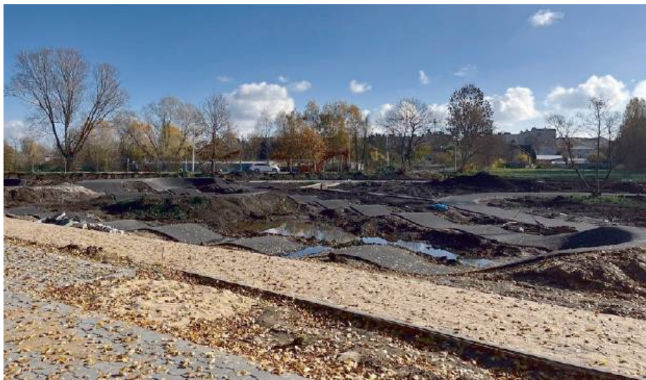
Wiele wskazuje na to, że mieszkańcy będą mogli korzystać z nowej przestrzeni już w przyszłe wakacje.

Bulwary nad Toczną w Łosicach nabierają coraz wyraźniejszych kształtów. Prace przy jednej z największych miejskich inwestycji postępują zgodnie z planem, a mieszkańcy mogą już dostrzec pierwsze efekty zmian. Jeśli tempo budowy zostanie utrzymane, nowa przestrzeń rekreacyjna powinna zostać udostępniona latem przyszłego roku.