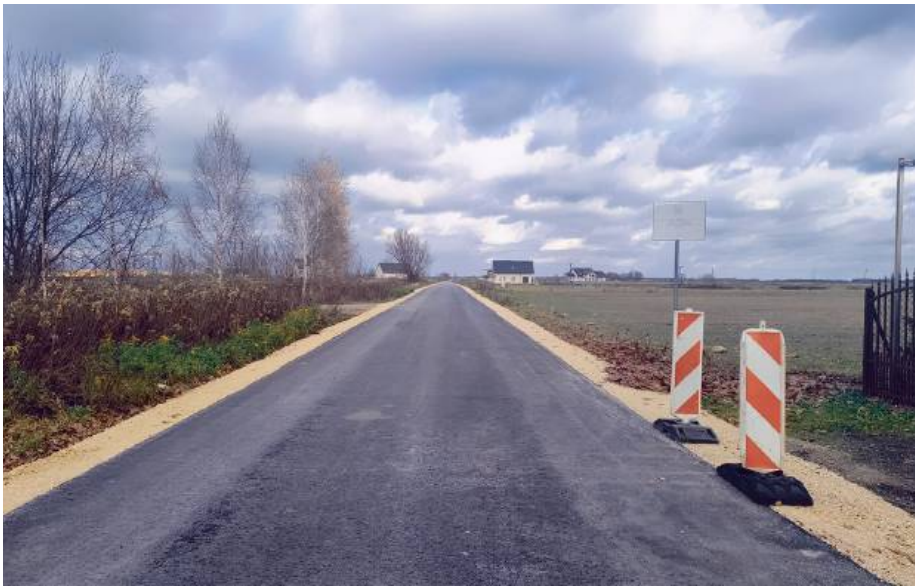
Urząd miasta nie zwalnia tempa przy modernizacji lokalnych dróg.

Największe z dofinansowanych pół roku temu przedsięwzięć to modernizacja drogi dojazdowej do gruntów rolnych w rejonie ul. Księżnej Anny Mazowieckiej. Inwestycja realizowana jest w ramach Rządowego Funduszu Rozwoju Dróg (dawniej Fundusz Ochrony Gruntów Rolnych). Dotacja wojewódzka wyniosła aż 300.000 zł.