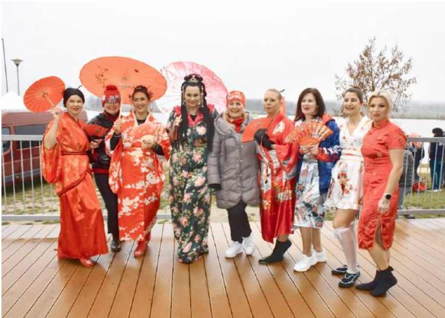
Impreza odbyła się pod hasłem „Azjatyckie party”.

Do Siedlec zjechali miłośnicy zimnych kąpielei m.in. z Łukowa, Węgrowa, Janowa Podlaskiego, Mińska Mazowieckiego, Ostrołki, Zambrowa, a nawet Suwałk. Zanim weszli do lodo-