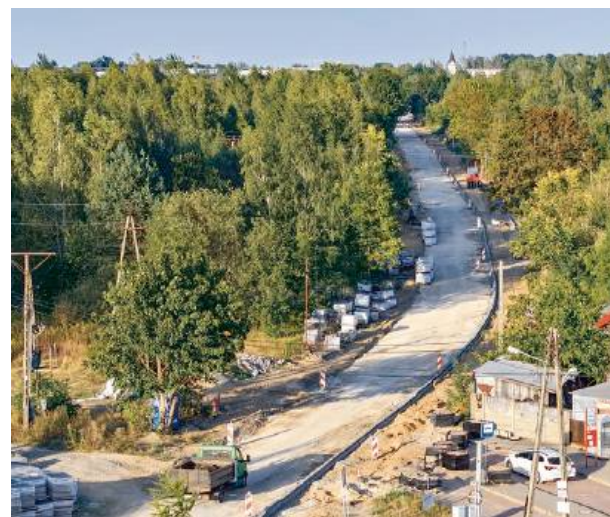
– To inwestycja, na którą kierowcy czekali od dekad.

Początki inwestycji i dokumentacja projektowa Środki na dokumentację projektową tej drogi zostały zabez-