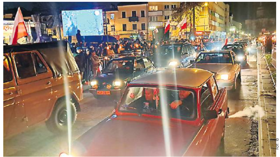
– Chcemy zaszczepić w młodym pokoleniu dumę, radość z bycia Polakiem i miłość do ojczyzny.

Liczba zgromadzonych siedleckich mieszkańców regionu i przyjezdnych gości przerosła