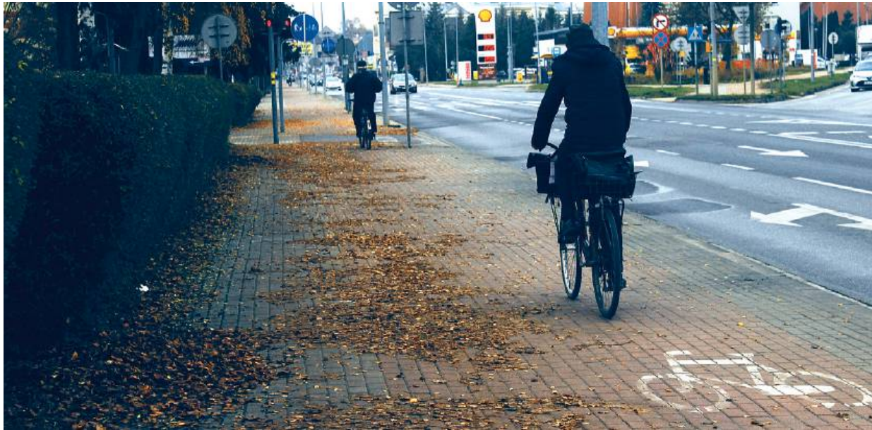
Miasto zabiera się za największą i najdroższą od lat inwestycję w drogi dla rowerów.