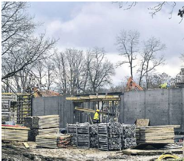
Zakończenie budowy ZOL planowane jest na koniec czerwca 2026 roku.

W Węgrowie trwa jedna z największych inwestycji w lokalnej służbie zdrowia ostatnich lat. Przy Szpitalu Powiatowym powstaje nowy Zakład Opiekuńczo-Lecznicy (ZOL), a równolegle realizowana jest rozbudowa i modernizacja izby przyjęć. Oba projekty mają znacząco poprawić jakość opieki nad pacjentami i dostosować infrastrukturę medyczną powiatu do rosnących potrzeb zdrowotnych mieszkańców.