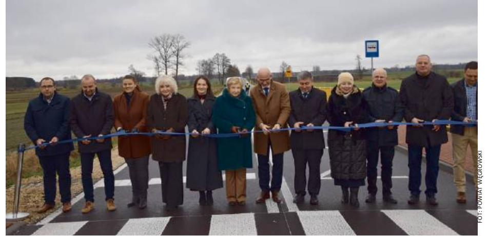
Łączna wartość projektu wyniosła 8,6 mln zł.

17 listopada uroczystość oddano do użytku przebudowany odcinek drogi powiatowej nr 4207W łączący Paplin, Stoczek i Sadowne. Inwestycja obejmowała ponad 3 km trasy w miejscowości Mrozowa Wola i była realizowana w ramach Priorytetu IV „Fundusze Europejskie dla lepiej połączonych