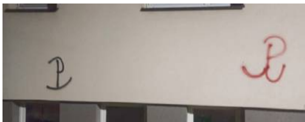
„Zamiast pięknych murali – bazgroły!” – skarżą się mieszkańcy.

Apel jest jasny: większa świadomość i szacunek dla wspólnej przestrzeni to podstawa. Niszczenie elewacji to nie tylko koszt finansowy, ale też strata estetyki i szacunku dla tych, którzy dbają o miasto. ID