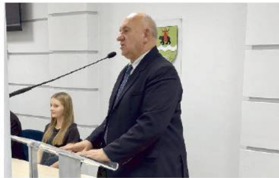
Młodzież wykazała się dojrzałością i konkretnymi pomysłami.

cznie MRG chce przeprowadzić konkurs skierowany do uczniów wszystkich placówek, zachęcając ich do współtworzenia wizualnej identyfikacji Rady, a na prośbę młodzieży wójt wyraził zgodę na ufundowanie nagród dla laureatów konkursu. Złożono wniosek o utworzenie oficjalnego kon-