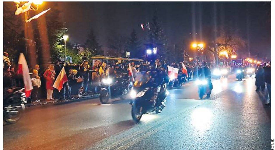
Na scenie wystąpił zespół New Blues Project, rozbrzmiewał rock patriotyczny, odbyły się konkursy historyczne.

najmilsze oczekiwania organizatorów. Nad bezpieczeństwem uczestników czuwali policjanci, strażacy oraz członkowie jednostek OSP, dzięki którym impreza przebiegła spokoj-