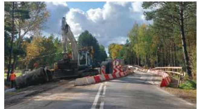
Końcowe prace przy poboczach DW nr 632

W najbliższy piątek (31.10) ma zostać przywrócony ruch dwukierunkowy na remontowanym odcinku Drogi Wojewódzkiej nr 632