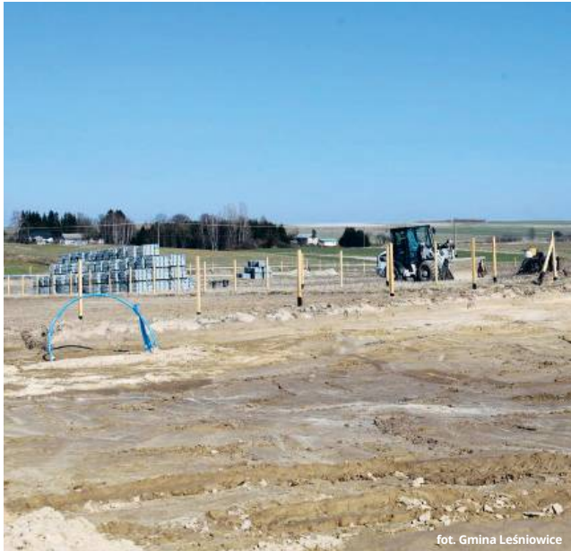
Budowa budynku, który będzie spełniał funkcje kulturalne, już została rozpoczęta.

● GM. LEŚNIOWICE Odpowiednie zmiany w miejscowym planie zagospodarowania przestrzennego radni przyjęli w czasie ostatniej sesji. Niektórzy chcieliby, aby Horodysko zyskało w przyszłości rangę powiatowego Saint Tropez, ale tymczasem położone nieopodal działki mieszkańcy zamierzają przeznaczyć na inne cele.