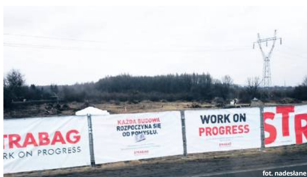
... fot. nadesłane

„W dniu 04 marca 2025 r. (wtorek) rolnicy od lat sprzedający tam swoje produkty nie mieli gdzie ustawić stoisk i handel odbywał się na trawnikach w pasie drogowym ul. Zawadówka, w bocznych uliczkach osiedlowych i do ogródków działkowych, co spowodowało ogromne zagrożenie zarówno dla handlujących, kupujących