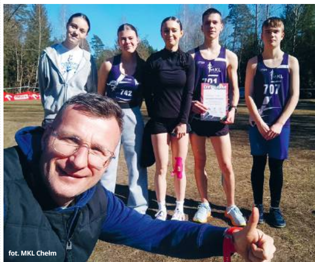
fol. MKL Chełm

● LEKKOATLETYKA Marcowe zmagania reprezentanci MKL-u Chełm oraz MKS-u Agros Chełm zakończyli udziałem w Międzywojewódzkich Mistrzostwach Młodzików w biegach przełajowych, których gospodarzem był Supraśl. Rywalizowali tam z rówieśnikami z Podlasia i części z nich niewiele zabrakło do sięgnięcia po medale.