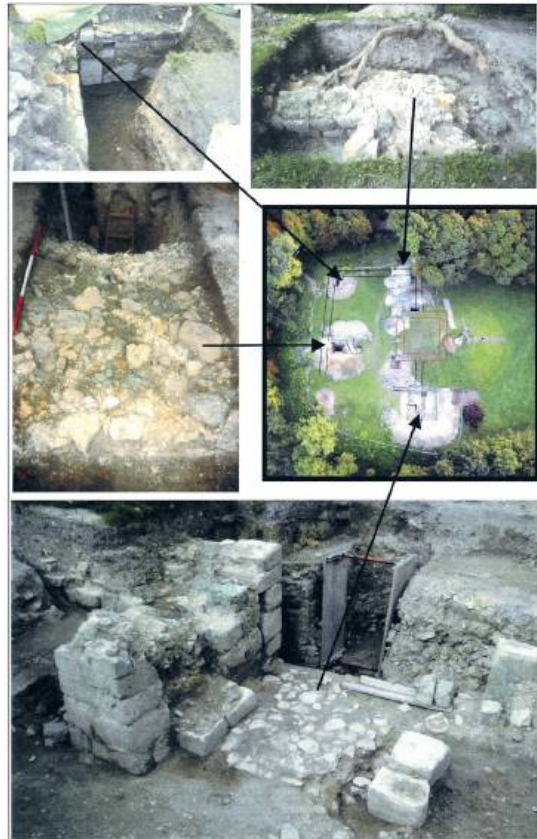
Ryc. 28. Węzłowe punkty muru obwodowego rezydencji odsłonięte w trakcie prac archeologicznych

Andrzej Buko Chełm przedlokacyjny. Na styku kultur i cywilizacji