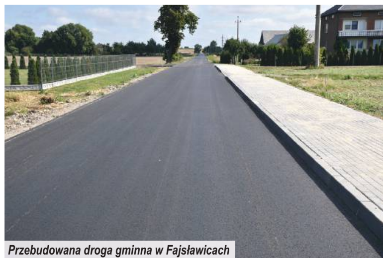
Przebudowana droga gminna w Fajstowicach