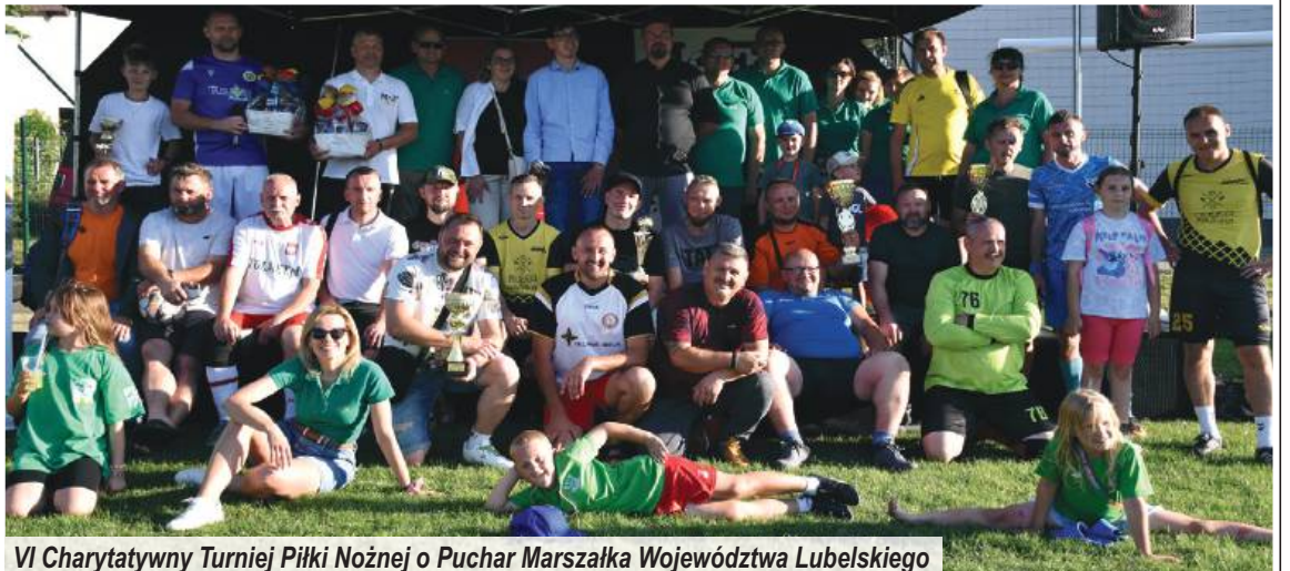
VI Charytatywny Turniej Piłki Nożnej o Puchar Marszałka Województwa Lubelskiego

Nie zabrakło również inwestycji drogowych, które w istotny sposób wpłynęły na poprawę bezpieczeństwa i komfortu poruszania się. Przebudowana droga