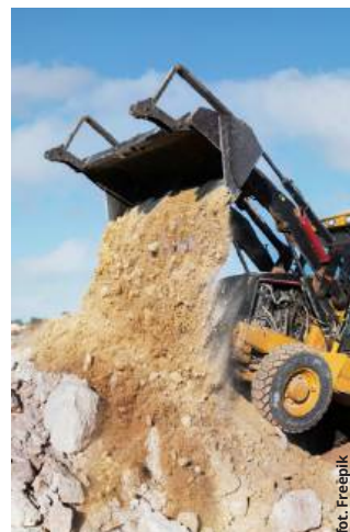
Zwiększenie wydobycia w Turce pod lupą Urzędu Gminy Dorohusk

dokumentów urzędnicy stwierdzili, że muszą one zostać uzupełnione o dodatkowe informacje. Z treści zawiadomienia wynika, że wątpliwości wzbudził fakt, że działka 375/1, a więc ta, na której prowadzone jest wydobycie, zlokalizowana jest w obszarze stanowiska archeologicznego, a także zagrożenia