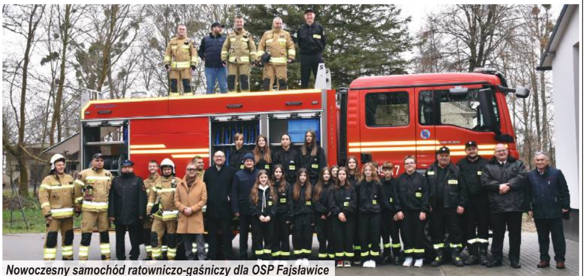
Nowoczesny samochód ratowniczo-gaśniczy dla OSP Fajstów

Rok 2025 to także konsekwentna realizacja działań proekologicznych. Usuwanie i utylizacja azbestu oraz przygotowanie do dalszych projektów w tym zakresie sprawiają, że gmina staje się coraz bezpiec-