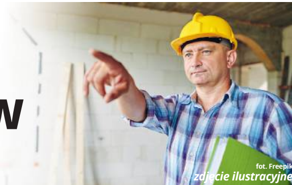
zajęcie ilustracyjne