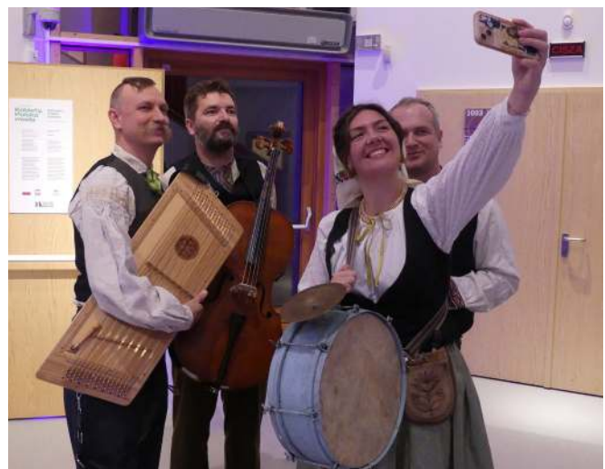
Капела «Постола» заграла і на концерті, і на танцювальній забаві