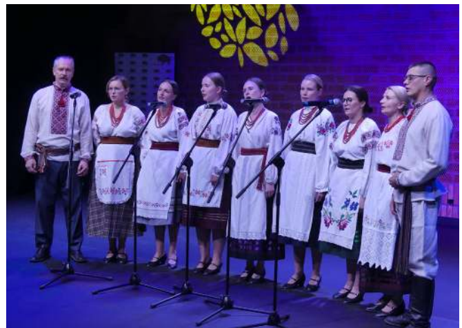
Господарі заходу – «Добрина» з Білостока

Фестиваль української культури почався від презентації театральної вистави для дітей «Коза Дереза» у вико-