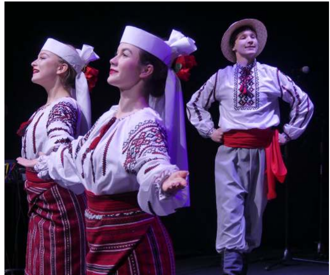
Своїми танцями захоплювала «Подільянка»

– Це насамперед збереження традиції. Перша група почала виступати в 1995 році, співаючи рогульки, тобто весняні пісні з Підляшшя. Ми виступали з місцевими піснями і обрядами – жнивними, колядками тощо – в Поль-