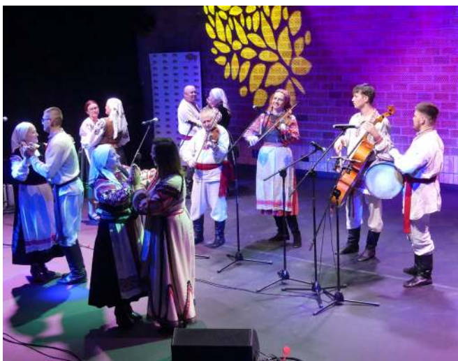
До танцю запрошували глядачів «Горина» та «Сільська музика»

На концерті було присутньо багато колишніх учасників «Ранку», яких зараз можна рахувати в сотнях. Деякі надалі співають в ансамблі.