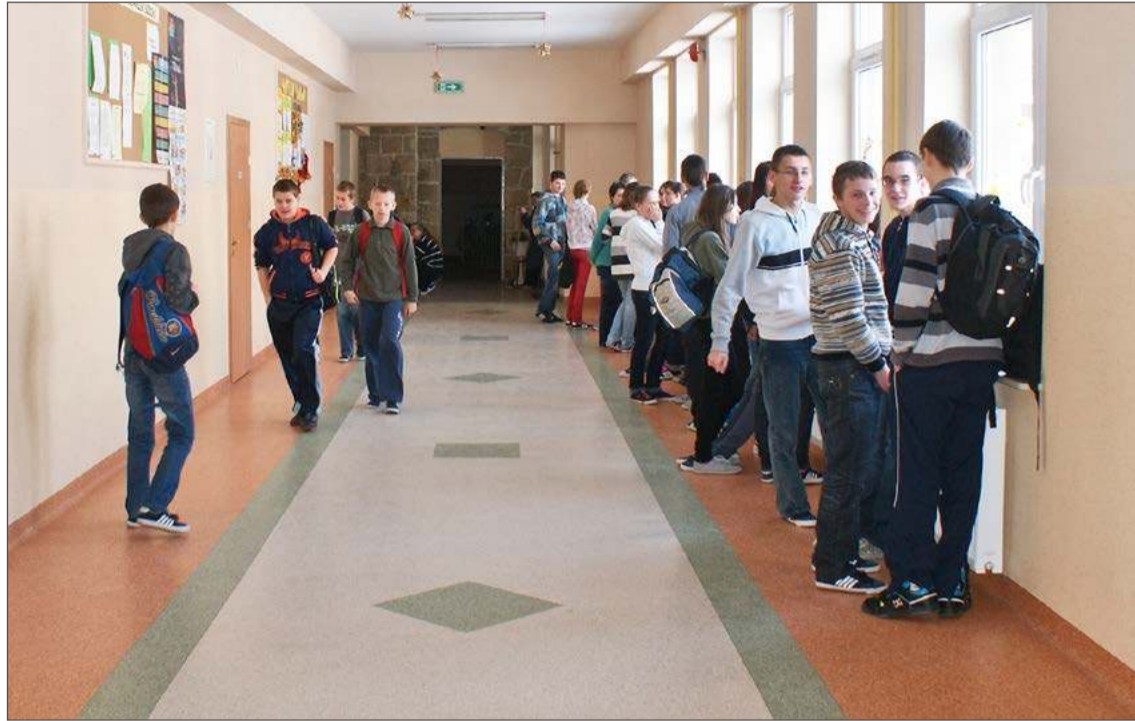
Uczniowie m.in. SP nr 1 w Jodłowej już korzystają z laptopów oraz tabletów.

Jak mówi Anna Nowak z Centrum Usług Wspólnych gminy Jodłowa na tym nie koniec dobrych wiadomości, bo w ramach tego po-