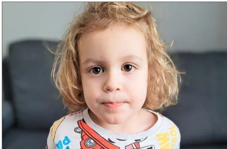
Cały czas nie wiadomo, co dolega trzylatkowi.