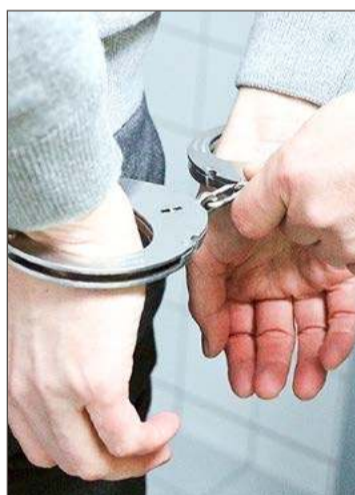
Za drugim razem wpadł w ręce policji.

Złodziejem okazał się 20-letni mieszkaniec Dębicy. Za pierwszą kradzież odpowie przed sądem, za drugą funkcjonariusze ukarali go mandatem w wysokości 500 zł.