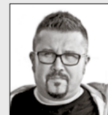
ratusznik@ol.com.pl tel. 14 670 27 80