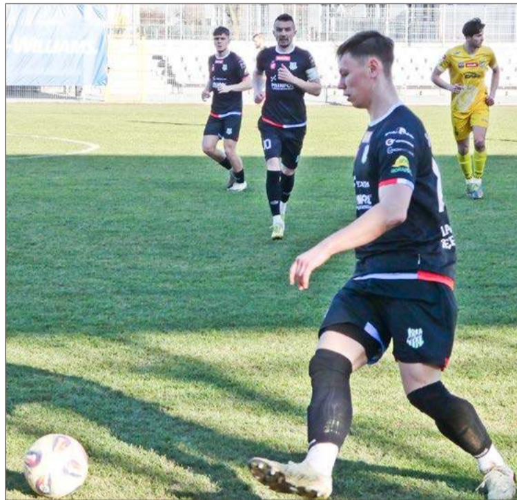
Na stadionie przy Parkowej dębiczanie ostatniego gola w lidze zdobyli 25 października w meczu z Koroną II Kielce.