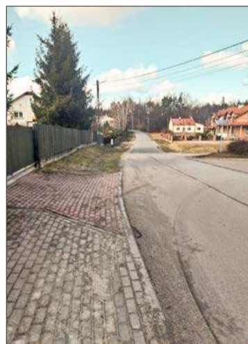
Przy ul. Mickiewicza w Czarnej zostanie zbudowany chodnik.

Do gminy Czarna na budowę 550-metrowego odcinka chodnika przy ul. Mickiewicza trafi 550 tys. zł. To jest jedyne nowe zadanie, które pojawiło się w tegorocznym rozdaniu. Ale pieniądze trafiają też do gminy Żyraków na budowę drogi w Straszcinie. Będzie to jed-