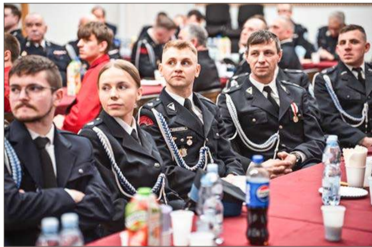
Spotkanie OSP Pilzno odbyło się w domu kultury.

Spotkanie było też okazją do słubowania nowych druhen i druhowów.