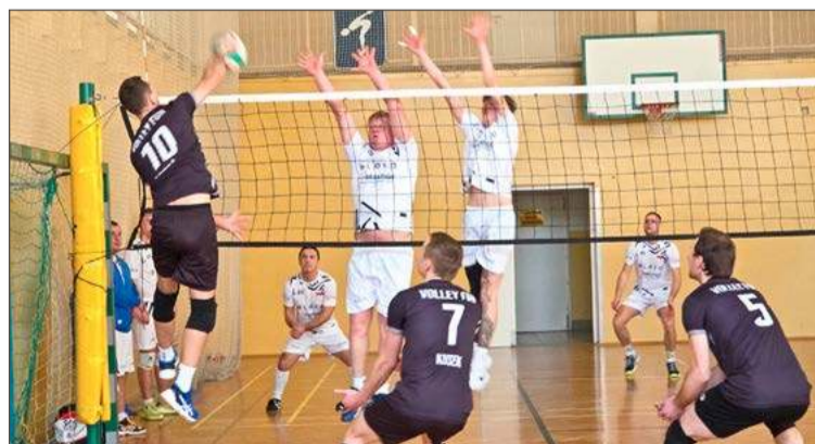
Ekipa Pretige Okna (na biało) pokonała rywali z Mielca po tie-breaku.