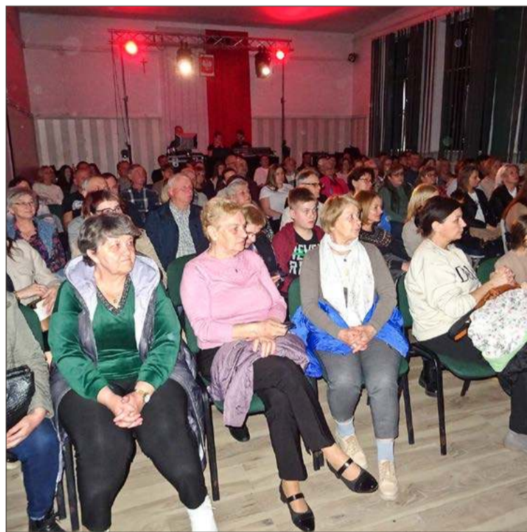
Wierni z parafii Żyraków mogą realizować wielkopostne wyzwania.

Wyzwania dla pozostałych grup są trudniejsze. Te dla kobiet i mężczyzn są niemalże identyczne, różnią się tylko w jednym punkcie.