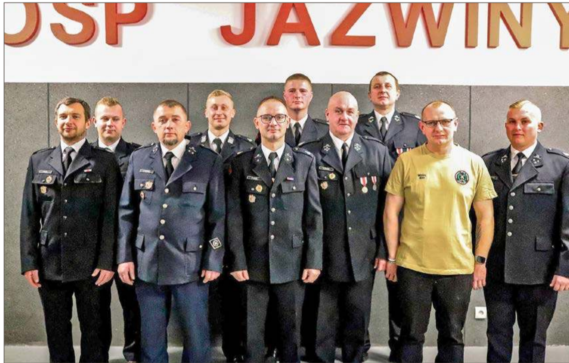
Jednostka OSP w Jaźwinach wybrała nowy zarząd jako ostatnia w gminie Czarna.

Drugim ważnym zadaniem jest ukończenie kursu kwalifikowanego