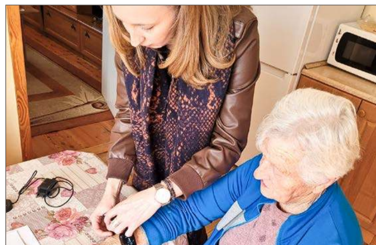
Opaska elektroniczna to forma zabezpieczenia dla seniorów.