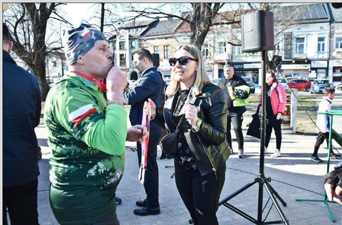
Około 170 uczestników wzięło udział w Biegu Pamięci Żołnierzy Wyklętych Tropem Wilczym w Dębicy. Trasa miała długość 1963 m, co było nawiązaniem do roku 1963, w który zamordowany został Józef Franczak, ps. Lalek. Na trasie biegacze minęli m.in. dawną siedzibę Powiatowego Urzędu Bezpieczeństwa Publicznego przy ul. Ogrodowej, czy Milicji Obywatelskiej przy ul. Kolejowej. Więcej zdjęć z wydarzenia możecie Państwo obejrzeć na naszym portalu debica24.pl .