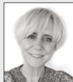
majba@ol.com.pl tel. 14 670 27 87

Nasi dziennikarze czekają na Twoje zgłoszenie