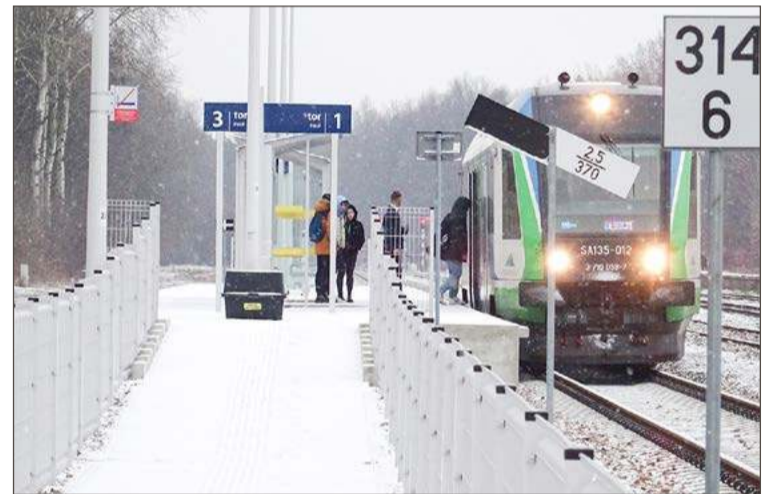
Z Kochanówki do Dębicy uczniowie dojadą szynobusem o 7:22.