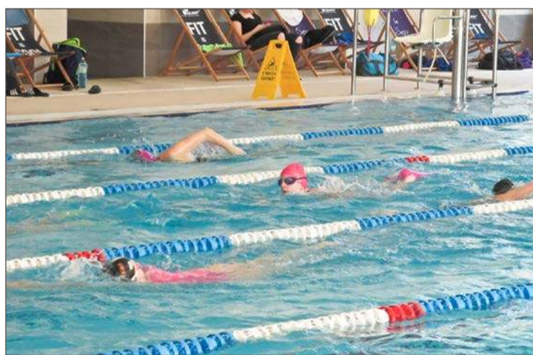
Mieszkańcy gminy Dębica mogą liczyć na zniżki w obiektach GOSiR.

Z ulg będą mogli korzystać mieszkańcy gminy, którzy – analogicznie jak w mieście – tu płacą podatki lub: są zarejestrowani w Powiatowym Urzędzie Pracy i mają status bezrobotnych, rozliczają podatek dochodowy w Urzędzie Skarbowym w Dębicy (w tym emeryci i renciści), utrzymują się wyłącznie ze świadczeń Centrum Usług Społecznych Gminy Dębica i nie składają PIT, są opiekunami osób z niepełnosprawnością, są osobami z niepełnosprawnością pobierającymi zasiłek z tytułu niezdolności do pracy, prowadzą gospodarstwo rolne na terenie gminy