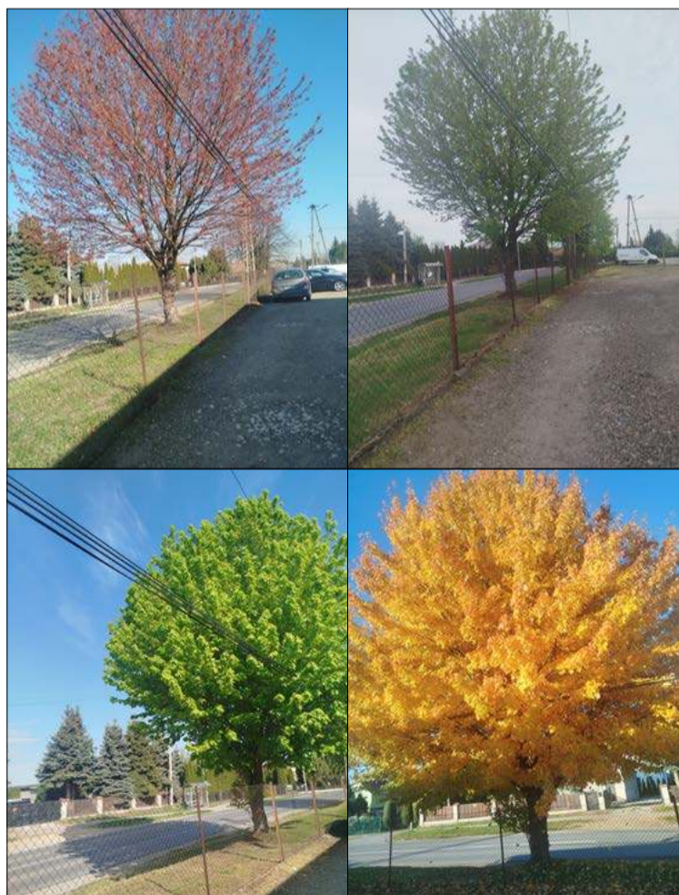
Cztery pory roku.