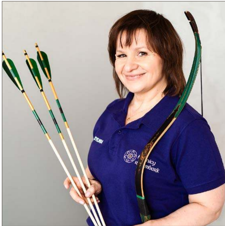
Pracując zawodowo i społecznie, znajduje czas na fascynujące hobby.

- Próbowalam już rok temu, ale dopiero teraz się udało - nie kryje radości.