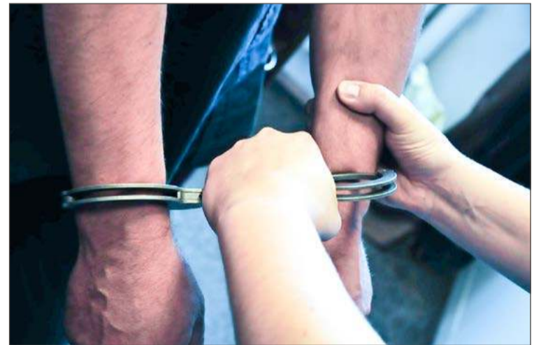
Mężczyzna został zatrzymany, grozi mu więzienie.