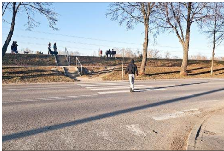
Powiat chce przebudować przejście przez al. Jana Pawła II.

W jego ocenie to powinno znacznie podnieść poziom bezpieczeństwa w tamtym miejscu.