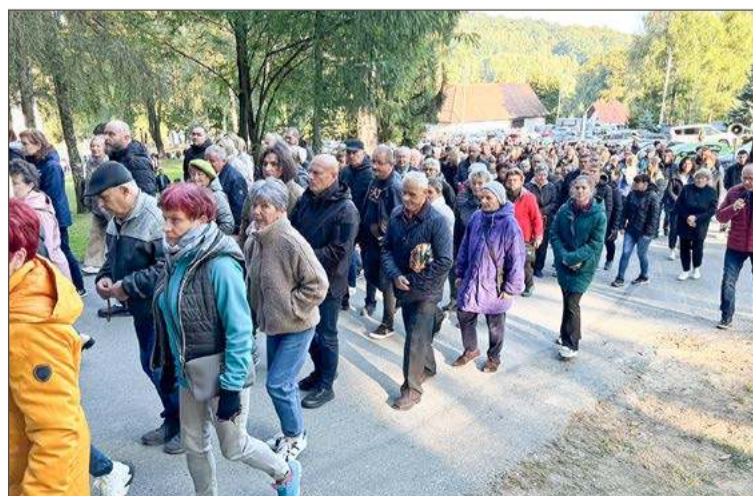
To nabożeństwo w Zawadzie gromadzi co miesiąc rzesze czcicieli Maryi.