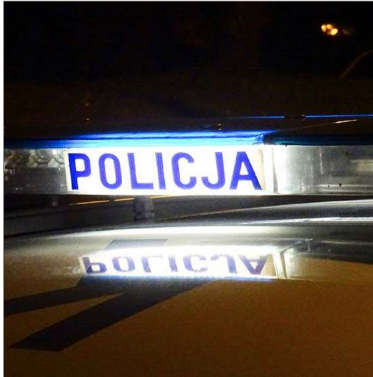
Policjanci nie potwierdzili, by doszło do złamania prawa.

Osobą zawiadamiającą okazał się 51-letni mieszkaniec Sulistrowej w powiecie krośnieńskim. Policjan-