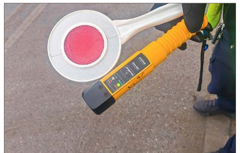
Funkcjonariusze zbadali 36-latka alkomatem.