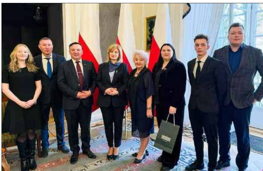
Przedstawiciele CKR zostali również zaproszeni do Kancelarii Prezydenta RP wraz z Wileńskim Teatrem „Studio”