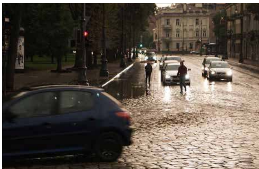
■ Kończy się sezon na opony zimowe na Litwie

Opr. J.B. na podst. inf. Departamentu Ochrony Środowiska