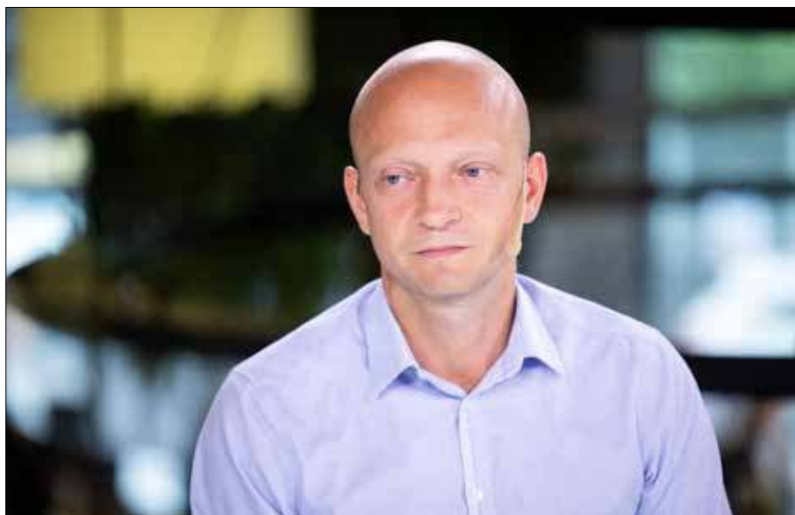
Cena może wzrosnąć do 150 dolarów za baryłkę — twierdzi ekonomista Nerijus Mačiulis