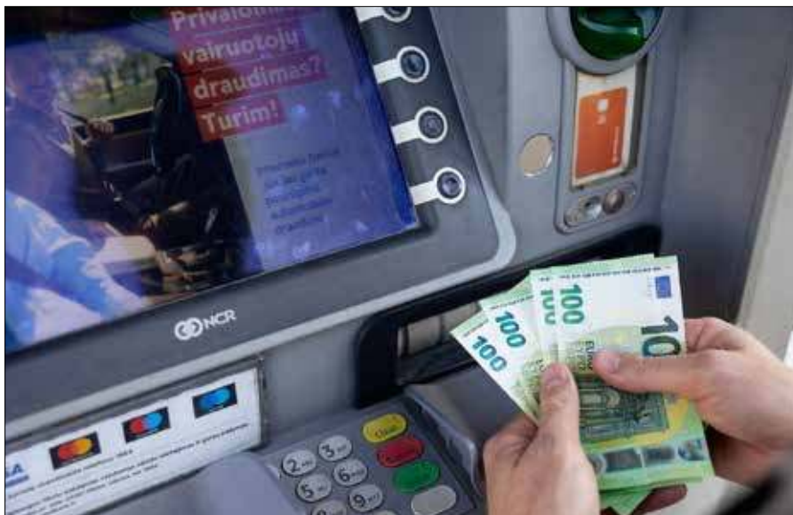
Ekspert zalecają ostrożność przy podejmowaniu decyzji o wypłacie środków

Okres podejmowania decyzji finansowych sprzyja również aktywności oszustów. Pojawiają się