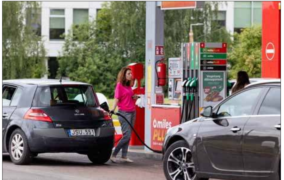
Na światowych rynkach rośnie cena ropy naftowej

Vaitiekūnas zaznaczył, że wstępnie przychylna ocena Komisji Europejskiej wynika z faktu, że obniżka akcyzy na olej napędowy miałyby charakter tymczasowy. „Do środków o ograniczonym wpływie, finansowanych wyłącznie z dodatkowych wpływów z podatku od wartości dodanej (VAT), KE podchodzi nieco bardziej przychylnie. Ponieważ nasza propozycja obniżki akcyzy została skonstruowana właśnie na tej zasadzie, liczymy na pozytywną decyzję KE, choć negocjacje nadal trwają i nie otrzymaliśmy jeszcze ostatecz-