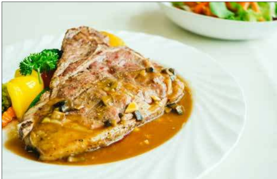
■ Fot. Freepik

Karkówka w plastrach w sosie własnym – miękka, soczysta i pełna smaku – to sprawdzony pomysł na obiad, który zawsze się udaje.