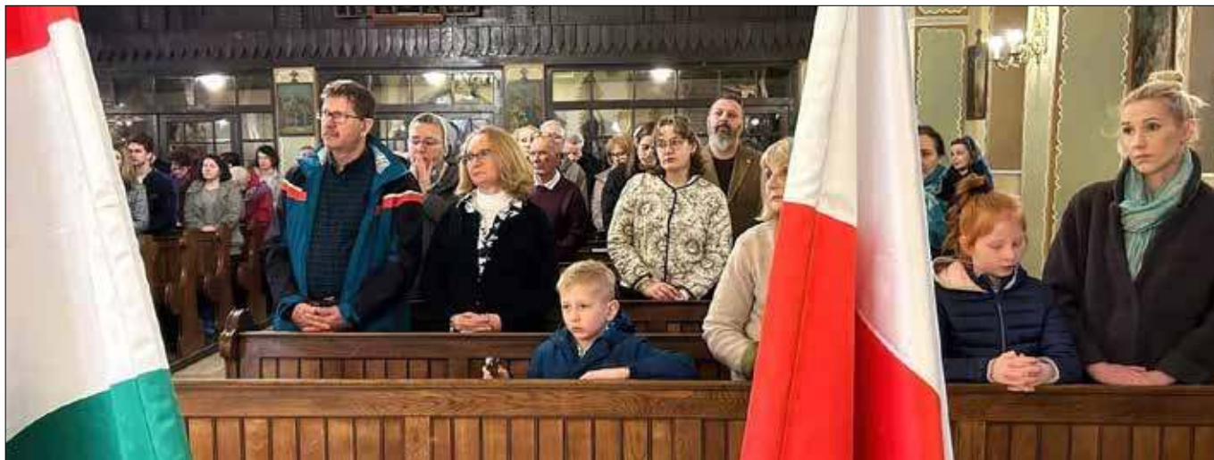
■ W czasie tegorocznych Dni Polsko-Węgierskich (22 marca 2026) w Polskim Kościele pw. NMP Wspomożycielki Wiernych w Budapeszcie