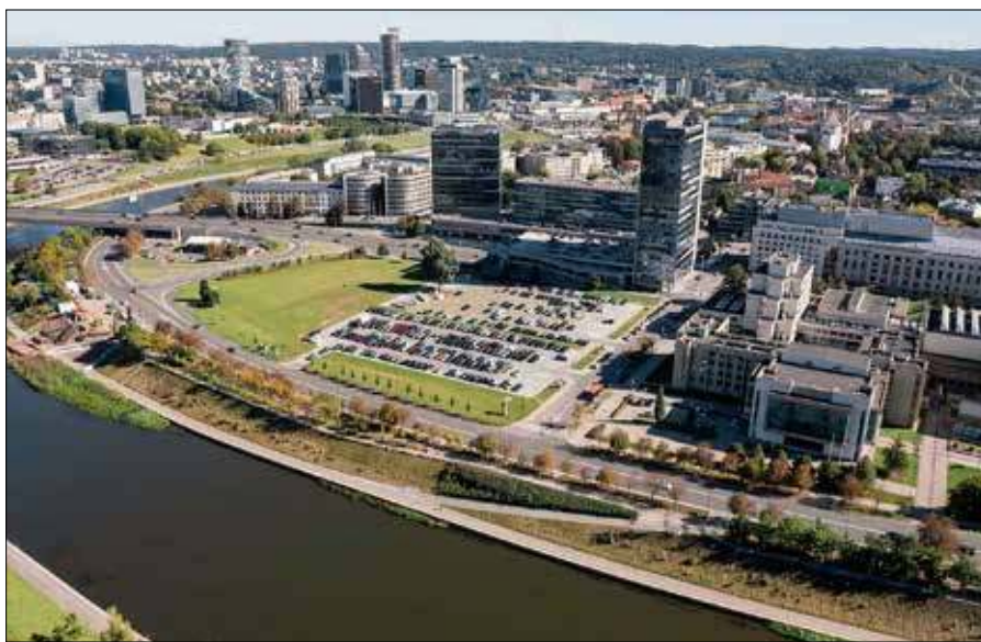
Nowe Centrum Kongresowe ma powstać na obszarze między gmachem Sejmu RL a ulicą Geležinio Vilko

— Wileńskie Centrum Kongresowe będzie dążyć do objęcia pozycji lidera na rynku konferencji i wydarzeń w Europie Środkowo-Wschodniej. Wszystkie zgłoszone koncepcje są obecnie oceniane, a propozycje spełniające wymagania zostaną opublikowane na oficjalnej stronie internetowej konkursu — mówi „Kurierowi Wileńskiemu” Laura Kairienė, główna architektka miasta Wilna.