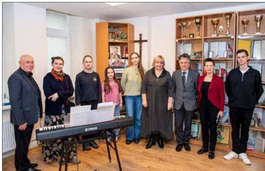
Uczestnicy seminarium w Szkole Muzycznej w Niemenczynie