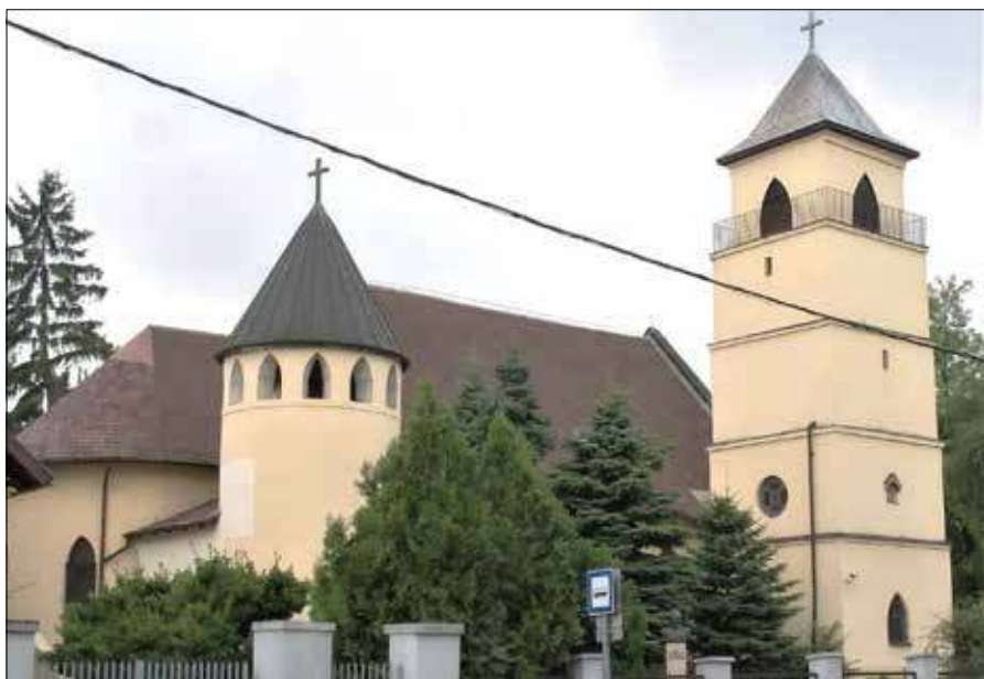
Polski kościół pw. NMP Wspomożycielki Wiernych w Budapeszcie