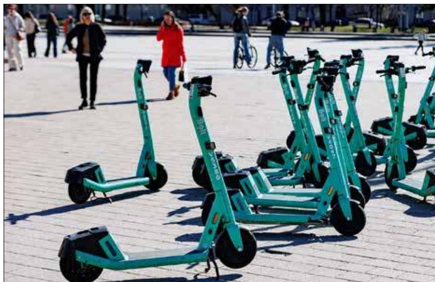
Jazda hulajnogą bez kasku może skutkować mandatem w wysokości od 20 do 40 euro

Kierowcom pojazdów elektrycznych zaleca się również stosowanie ochraniaczy na łokcie i kolana, obuwia antypoślizgowego oraz odzieży odblaskowej, co znacząco zwiększa bezpieczeństwo. ■