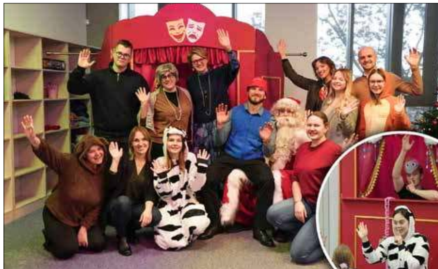
Te osoby stoją za „Spotkaniami z książką”

Dowiadujemy się też, że koło pedagogiki należy do najaktywniejszych w filii UwB. Do tego stopnia, że aż chcą do nich dołączyć studenci innych kierunków. Tutaj jednak studenci jeszcze szukają formuły, aby całość „miała ręce i nogi”. Obecnie koło liczy 36 studentów. ■