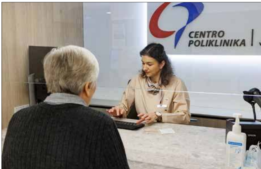
Pacjent będzie musiał pisemnie potwierdzić rezygnację z urządzenia refundowanego przez państwo oraz wyrazić chęć wyboru droższego rozwiązania