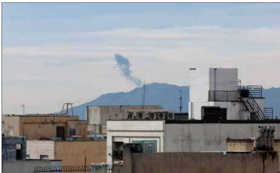
Izraelskie Siły Obronne (IDF) poinformowały, że wczesnym rankiem w poniedziałek 30 marca rozpoczęły ataki na cele w Teheranie

Doniesienia wskazują również na wybuchy w Iraku, w pobliżu bazy