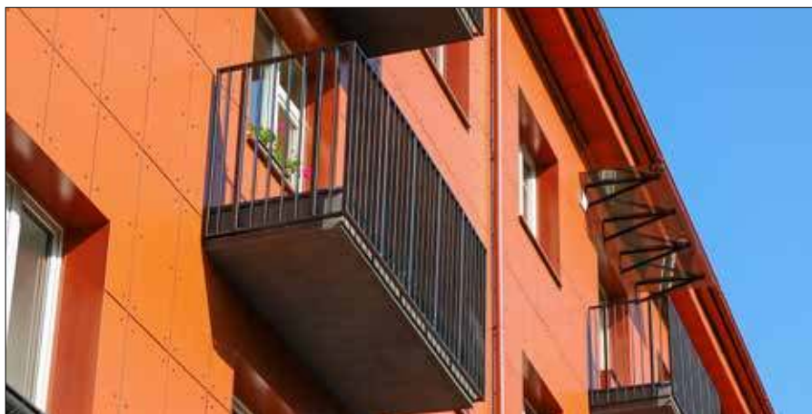
■ Odnowiony blok wielomieszkaniowy

Kolejny trend – zmienia się również podejście mieszkańców. Wielu z nich postrzega renowację nie tylko przez pryzmat finansowy, ale także z perspektywy długoterminowych korzyści: komfort, bezpieczeństwo, mniejsze ryzyko awarii,