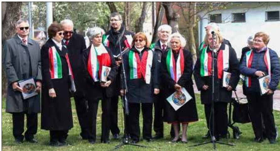
■ Ogólnokrajowy Samorząd Polski na Węgrzech

Obecność Polaków na ziemiach węgierskich sięga wczesnego średniowiecza i była związana z bliskimi relacjami dynastycznymi obu państw. Na Węgrzech osiedlali się polscy uczeni, artyści, rzemieślnicy oraz chłopci, tworząc trwałe skupiska etniczne. Szczególną rolę w historii