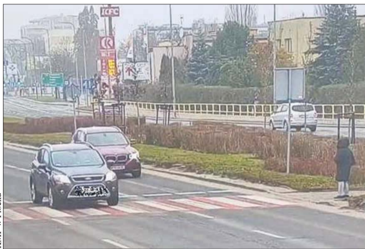
KMP w Płocku

Fundusz Grantowy dla Płocka rusza z nowymi edycjami konkursów