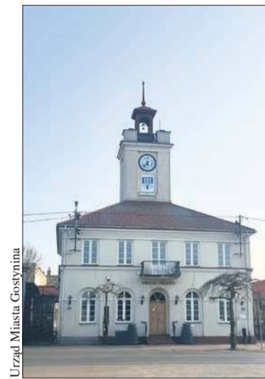
Ratusz Miejski w Gostyninie

Planujemy, że w bieżącym roku rozpoczną się prace remontowo-budowlane, które przywrócą Ratuszowi jego dawny blask i umożliwią mieszkańcom oraz turystom korzystanie z odnowionego obiektu przez wiele lat – informują urzędnicy.