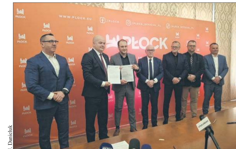
Podpisanie umowy na budowę nowego fragmentu ul. Przemysłowej

Na dwóch skrzyżowaniach – z ul. Szkolną oraz Sierpecką – powstaną ronda. Łącznie zbudowana zostanie od podstaw ulica o długości 2,5 km, która