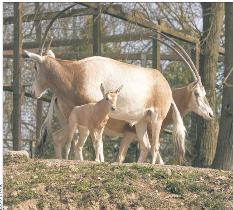
Młody oryks szablorigi pod okiem swoich rodziców

Przybędzie miejsc w żłobku na Podolszycach