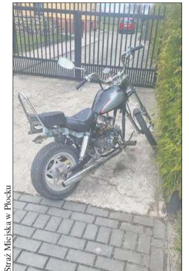
Straż Miejska w Płocku

Na szczęście, podczas upadku na swoim sprężcie 45-latek nie odniósł poważ-