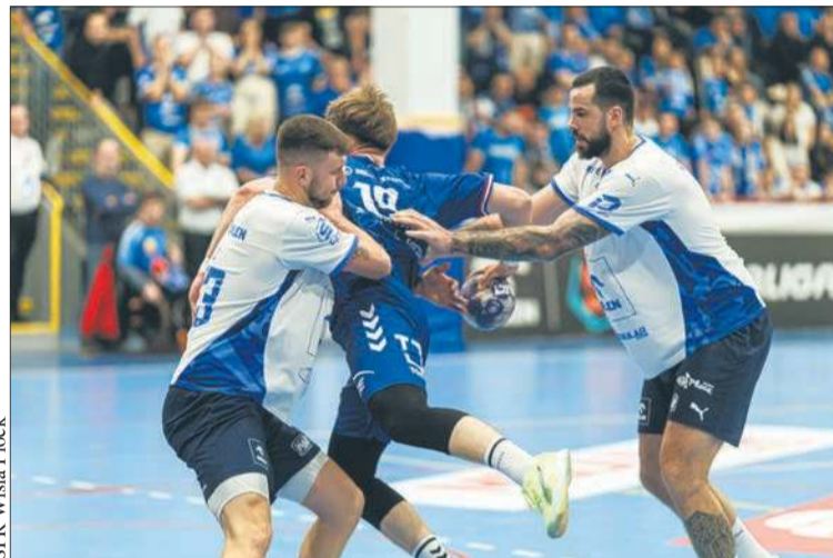
SPR Wisła Płock

W meczu zamykającym fazę zasadniczą ORLEN Superligi Nafciarze sięgnęli po kolejne zwycięstwo. Po ciekawym spotkaniu pokonali PGE Wybrzeże Gdańsk 31:24, wracając z Trójmiasta z kompletem punktów. Tym samym mistrzowie Polski przedłużyli swoją imponującą serię zwycięstw na krajowych parkietach i umocnili się na pozycji lidera.