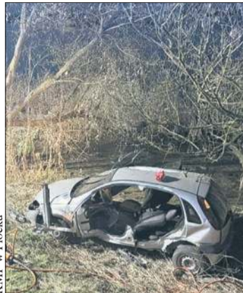
Zdjęcia z miejsca wypadku na drodze w Murzynowie

Przypomina jednak, że nawet jeśli kierowca jest trzeźwy i posiada doświadczenie, chwila nieuwagi, czy zbyt szybka jazda mogą doprowadzić do tragicznych konsekwencji. Z kolei warunki na drodze, takie jak ograniczona widoczność, śliska nawierzchnia, mgła czy zmienne warunki atmosferyczne, wymagają od kierujących szczególnej ostrożności. Prędkość powinna być zawsze dosto-