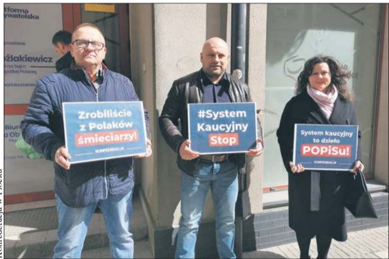
Konferencja pod biurem KO

Podczas zorganizowanej 9 kwietnia w Płocku konferencji prasowej działacze Konfederacji ocenili funkcjonowanie systemu kaucyjnego. Wskazali na rosnące koszty dla konsumentów, problemy z użytkowaniem oraz wpływ nowych rozwiązań na gospodarkę odpadami i codzienne życie mieszkańców.