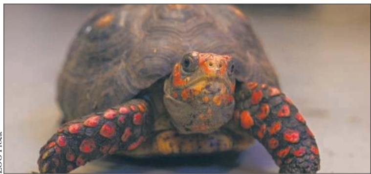
Plusik – najmłodszy w rodzinie żółwi żabuti czarnych

Z głębokim smutkiem i żalem zawiadamiamy, że dnia 11 kwietnia 2026 roku, przeżywszy 78 lat, odeszła od nas