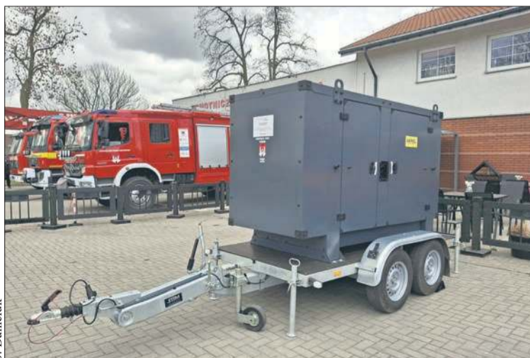
Do jednostki OSP w Trzepowie trafił nowy agregat prądotwórczy