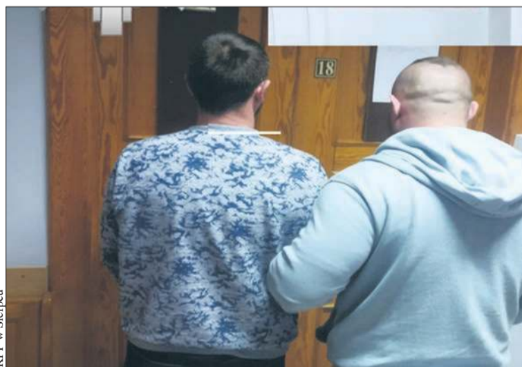
Kierowca w ciągu 48 godzin trafił do sądu

To jednak nie wszystko. Policjanci wszczęli bowiem również procedurę