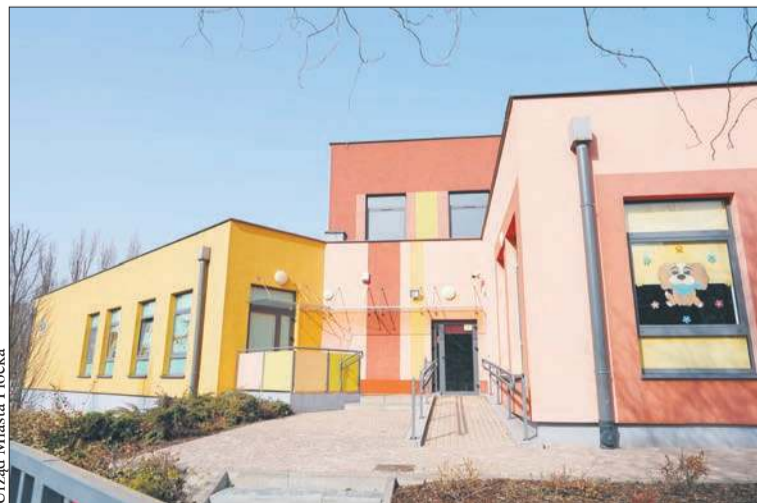
Żłobek nr 2 przy ul. Kleeberga