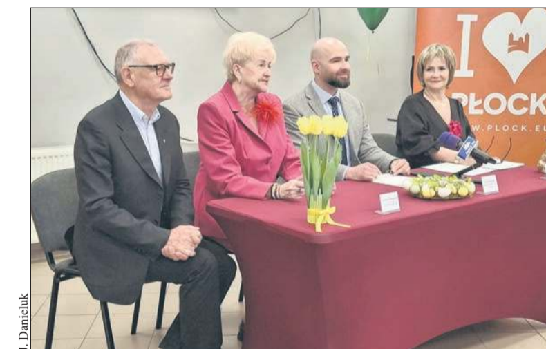
Otwarcie Klubu Seniora „Aktywni razem” przy ul. Czwartaków 4

– Klub Seniora „Aktywni razem” jest w całości finansowany ze środków Urzędu Miasta Płocka. Będzie otwarty do końca roku, ale mam nadzieję, że jeszcze parę lat dłużej. Będzie czynny od poniedziałku do piątku od godz. 10.00 do 14.00. Jednak zdarzy się,