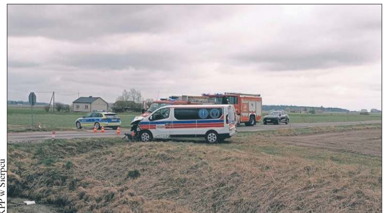
KPP w Sierpcu

Groźny wypadek na przejeździe kolejowo-drogowym w miejscowości Osiek-Włostybyry