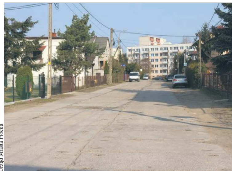
Urząd Miasta Płocka

Dziewięć ofert wpłynęło w przetargu na budowę ulic Żytniej, Pszennej i Zakątek