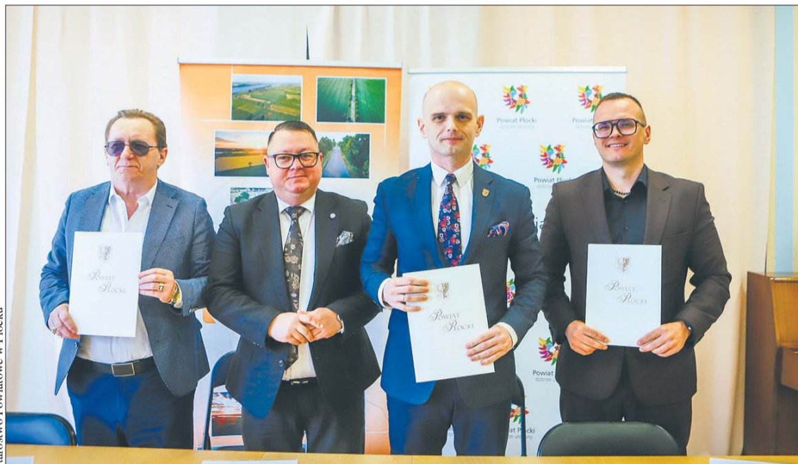
Starostwo Powiatowe w Płocku