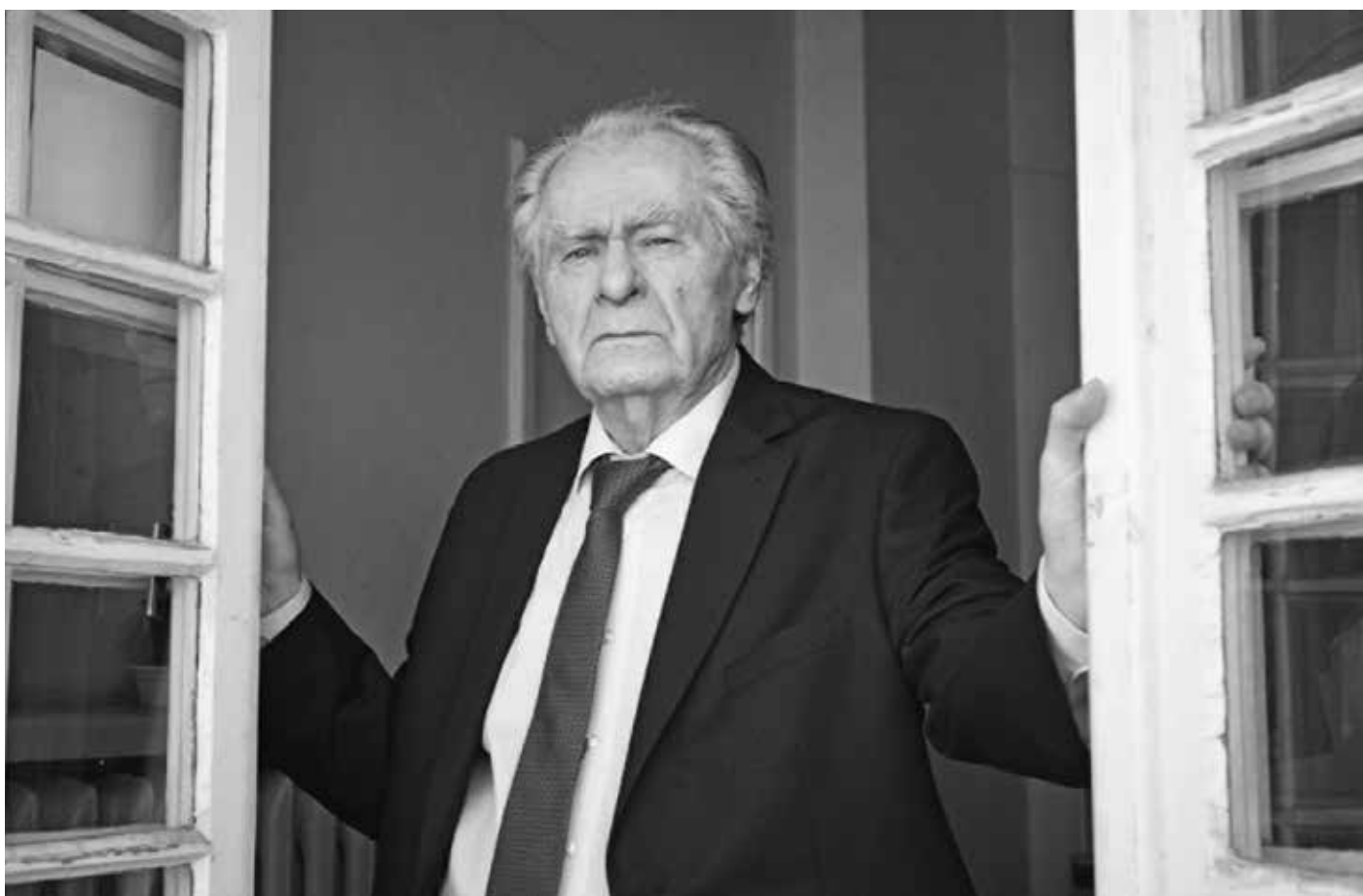
Wiesław Myśliwski (1932–2026)

Pod koniec marca Polskę obiegła wieść o śmierci jednego z najwybitniejszych pisarzy XX i XXI w. Zmarł Wiesław Myśliwski – artysta słowa i mistrz formy, dwukrotny laureat prestiżowej polskiej Nagrody Literackiej „Nike”. Kilka dni wcześniej skończył 94 lata.