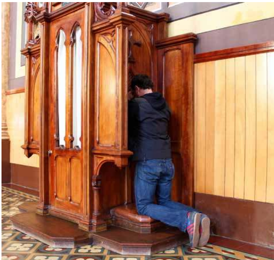
Tajemnica spowiedzi obowiązuje kapłanów pod karą ekskomuniki. Bóg czeka na każdego skruszonego grzesznika

Bóg czeka na każdego skruszonego grzesznika. I chociażby grzechy nasze nas przerażały, to Bóg chce nam je odpuścić. Musimy mu tylko dać szansę. Odwagi, nie bójcie się! Jezus nie przyszedł do zdrowych, ale do chorych. Pozwól mu uzdrowić swoje serce. I przyjmij jego bezgraniczne miłosierdzie. ■