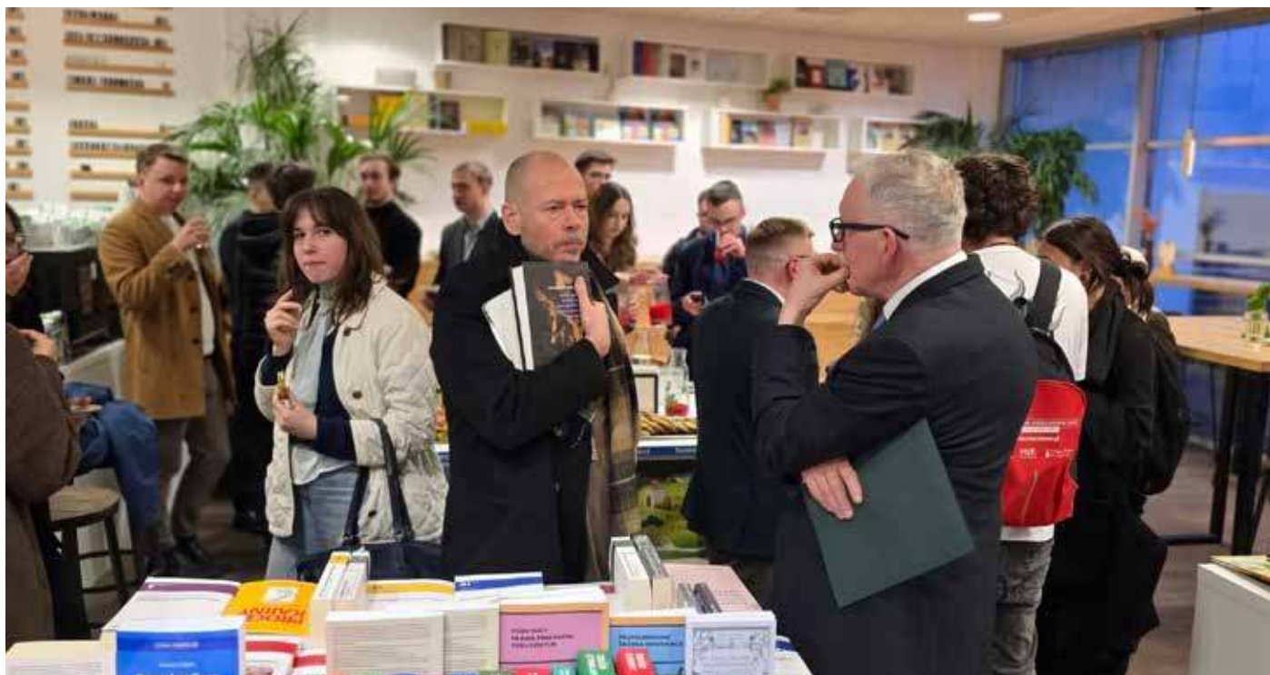
Wydarzenie 31 marca, zorganizowane przez Wydział Prawa i Administracji oraz Wydawnictwo Uniwersytetu Gdańskiego, zgromadziło osoby zainteresowane refleksją nad dogmatycznoprawnymi aspektami miłosierdzia i jego znaczenia we współczesnej nauce prawa karnego

staniu humanitarnych form karnia. Takie studia nad miłosierdziem w prawie są bardzo potrzebne, gdyż pokazują w szerszej perspektywie to, jak możemy urządzić system prawa karnego.