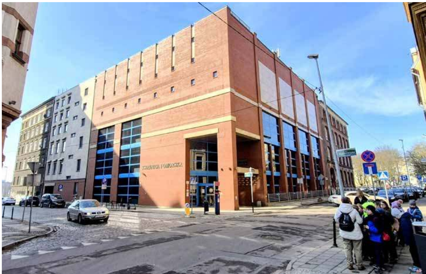
Budynek główny Książnicy Pomorskiej w Szczecinie

Pierwsze polskie książki trafiły do biblioteki m.in. dzięki darom osadników przesiedlonych z Kresów Wschodnich. W latach 1946–1951 część zbiorów naukowych, na mocy decyzji politycznych, przekazano w depozyt innym bibliotekom w kraju. W 1947 r. rozpoczęła działalność Wojewódzka Biblioteka Publiczna, a w 1955 r. doszło do połączenia bibliotek miejskiej i wojewódzkiej. Nowa instytucja objęła nadzorem całą sieć bibliotek publicznych w mieście i regio- ➤