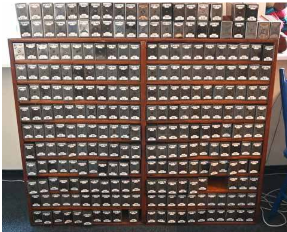
W zbiorach biblioteki zachował się bardzo specyficzny katalog odziedziczony po dawnej Stadtbibliothek Stettin

kumenty dotyczące życia wybitnych mieszkańców Szczecina i Pomorza oraz ich działalności politycznej, naukowej, społecznej lub kulturalnej.