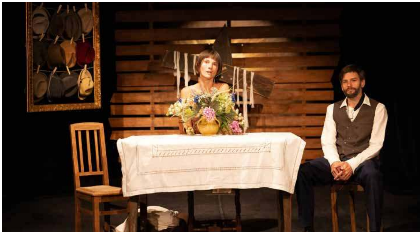
Furorę na polskich scenach robi „Traktat o łuskaniu fasoli” na podstawie prozy Myśliwskiego, premiera z 2023 r. Teatru Witkacego w Zakopanem

„Człowiek najchętniej rozmawia z samym sobą. Według mnie, nawet gdy z kimś rozmawia, w gruncie rzeczy rozmawia z samym sobą” („Widnokraj”).