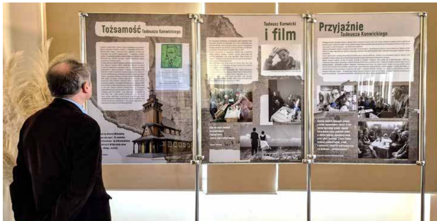
Wystawa poświęcona Tadeuszowi Konwickiemu w czasie Tygodnia Kresowego

Po dojściu do władzy narodowych socjalistów w 1933 r. działalność Ackerknechta ograniczyła się do zarządzania Biblioteką Miejską. Skupił się na rozbudowie Pomorskiego Archiwum Biograficznego i Miejskiego Archiwum Obrazów, które powstało w 1918 r., a także na organizacji licznych wystaw. W tym archiwum zebrano odręczne do- ➤