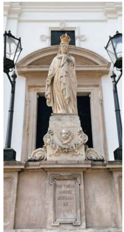
Spod figury Matki Bożej z czasów powstania styczniowego wyrusza Warszawska Pielgrzymka Piesza na Jasną Górę

Pielgrzymowanie cieszyło się wielką popularnością także w czasach zaborów, okupacji i powstania warszawskiego. Tradycji nie złamały czasy PRL, chociaż komuniści utrudniali wyjście i podążanie pątniczym szlakiem. 15 kwietnia 2024 r. Warszawska Pielgrzymka Piesza na Jasną Górę została wpisana na Krajową Listę Niematerialnego Dziedzictwa Kulturowego.