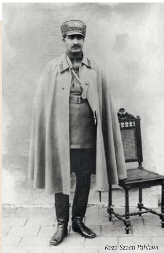
Reza Szach Pahlawi

W efekcie, chociaż przez całą swoją historię Irańczycy używali określenia „Persja” w dość wąskim znaczeniu regionalnym – regionu południowo-