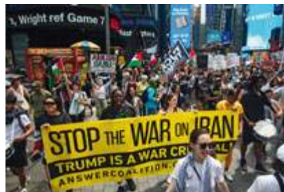
fol. PAP/EP/Julius Constantine Motil