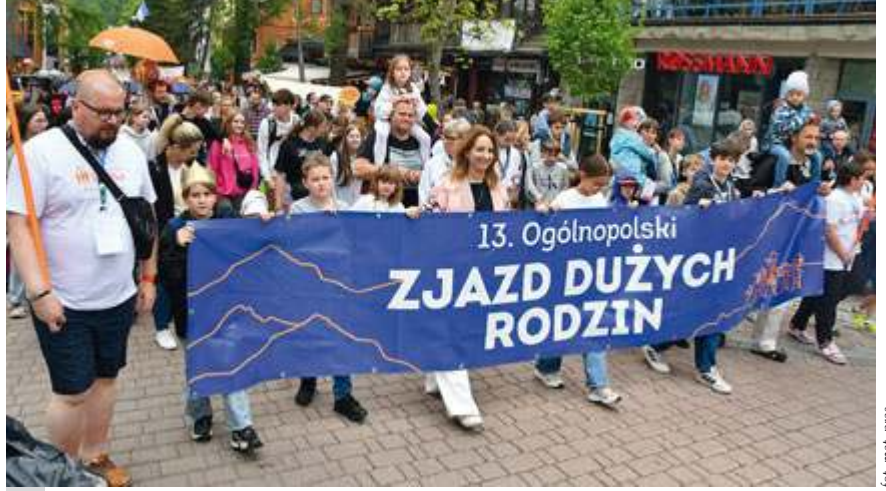
fol. mat. pras.

■ Strzeżone granice. Resort obrony przygotował projekt, mający usprawnić działania Marynarki Wojennej na Bałtyku, m.in. poprzez zapewnienie jej okrętom uprawnień takich, jakie ma Straż Graniczna, w tym dotyczące użycia broni w określonych sytuacjach. Zaproponowano też dodatkowe przesłanki do użycia wojska za granicą „na podstawie niezbywalnego prawa do samoobrony, o którym mowa w art. 51 Karty Narodów Zjednoczonych”.