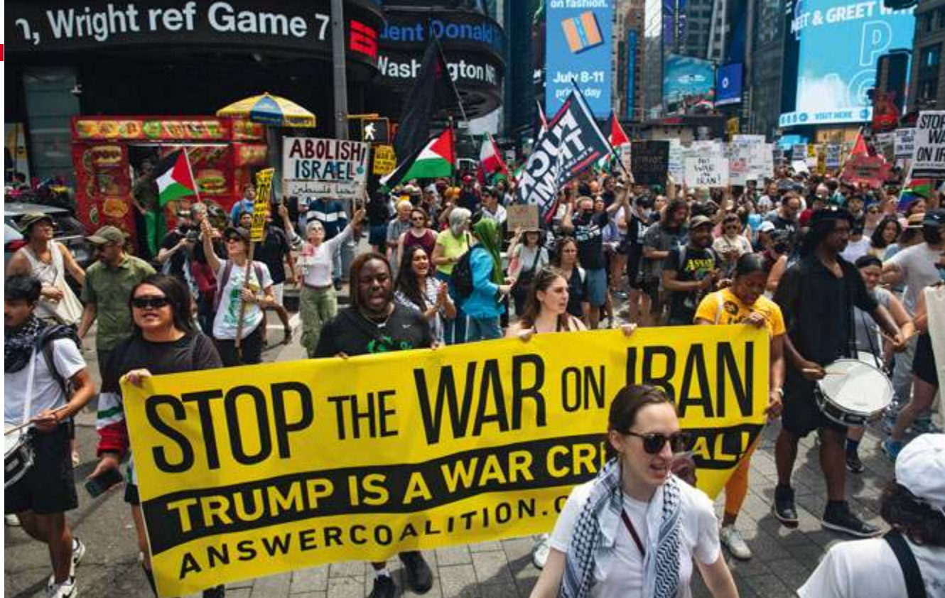
Manifestacja w Nowym Jorku po ataku USA na Iran