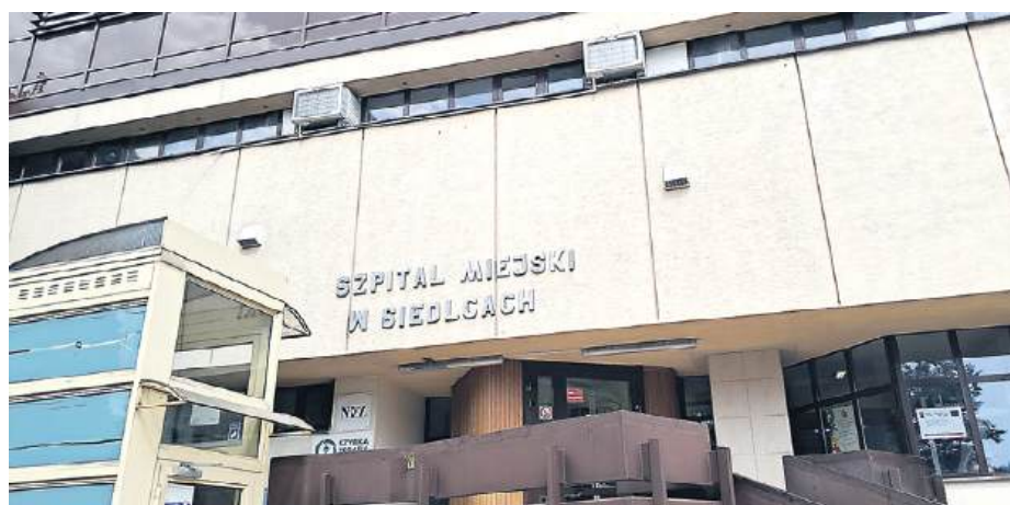
Jak mówi dyrektorka, lecznica rozwija się, mimo trudności.

Co na to sama zainteresowana? – Chciałabym uspokoić: na bieżąco regulujemy wszystkie bieżące zobowiązania finansowe i nie posiadamy wymagalnych zobowiązań finansowych. Owszem, rok 2024 zamknęliśmy stratą 2,7 mln zł, niemniej wszelkie bieżące świadczenia są zapewnione – zapewnia pani dyrektorka, przedstawiając nam potwierdzające to zestawienia.