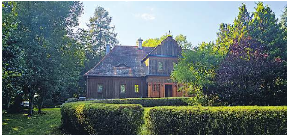
Posiadłość za niecałe 4 mln zł kupił Samorząd Województwa Mazowieckiego.