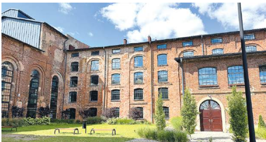
FOR: UM SOK. PODLASKI

Ponadto w przyszłym roku planujemy ponowne urucho-