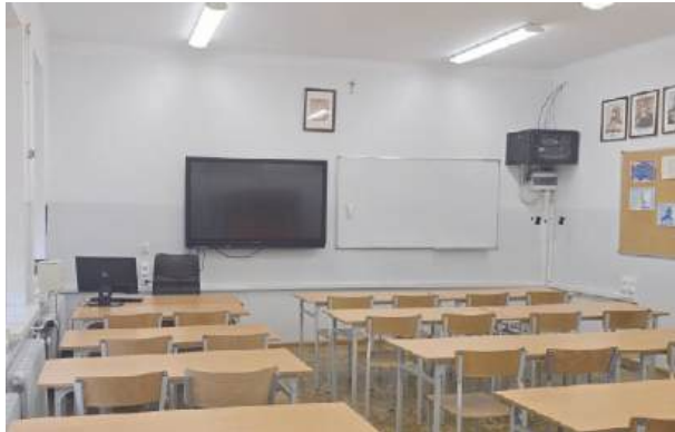
Kto powinien decydować?

- Nie czytałam szczegółowo programu, ale z tego, co wiem od rodziców, będą tam treści o zachowaniach seksualnych. To mnie bardzo niepokoi. Też