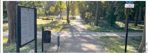
Zakaz jest reakcją na niedawny wypadek.