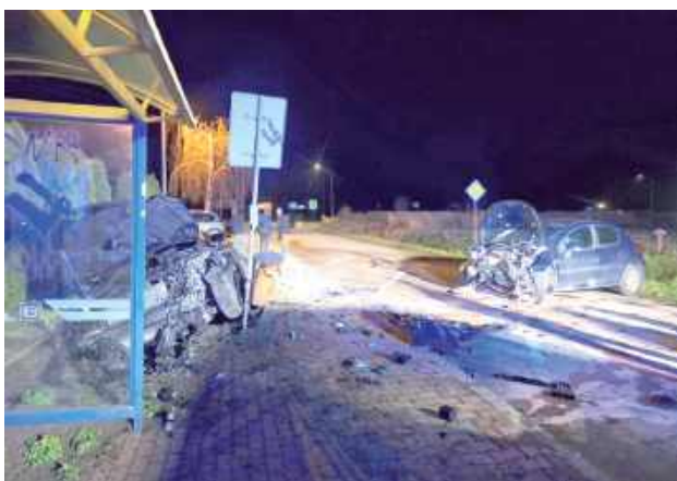
Choć wygląd aut po zdarzeniu może świadczyć o tym, że osoby nimi podróżujące odniosły poważne obrażenia, tym razem skończyło się tylko na ogólnych potłuczeniach

- 54-letnia mieszkanka gm. Żyrzyn kierująca Peugeotem, skręcając w lewo, nie ustąpiła pierwszeństwa przejazdu jadą-