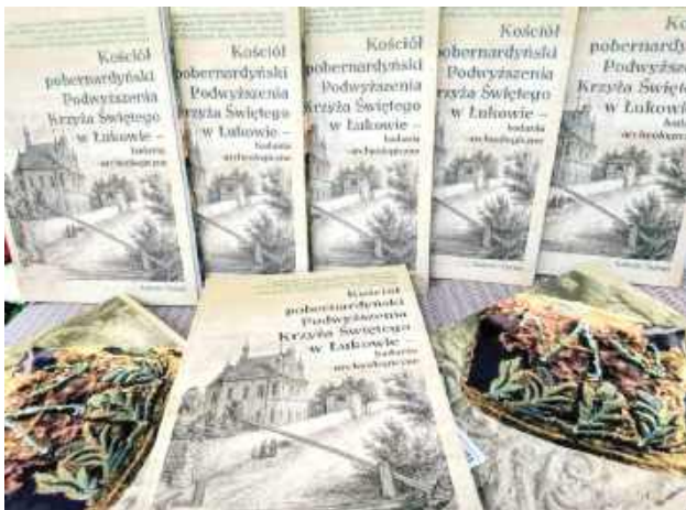
Publikacja zbiorowa podsumowuje wyniki prac naukowych, opisując szczegółowo miejsca pochówku zakonników i wiernych świeckich oraz przedmioty odnalezione w kryptach