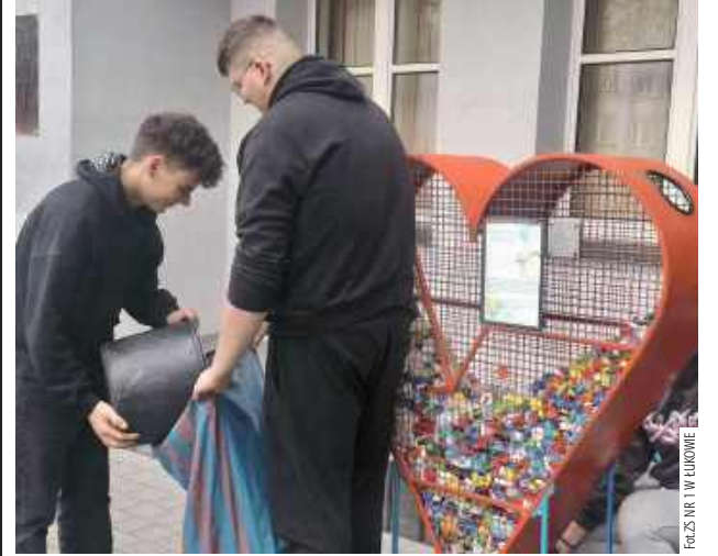
Szkolna społeczność regularnie zbiera plastikowe nakrętki