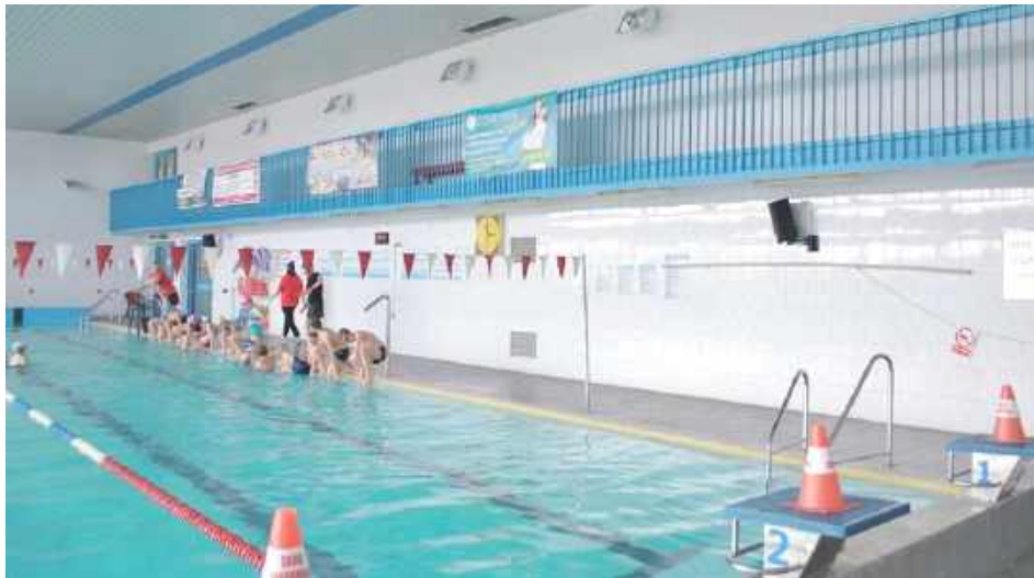
Budynek pływalni Delfinek zostanie rozebrany, tym samym przez około dwa lata nie będzie basenu krytego w Łukowie