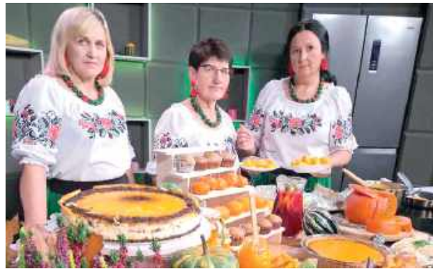
Panie zabrały do telewizji przepyszny serniczek dyniowy