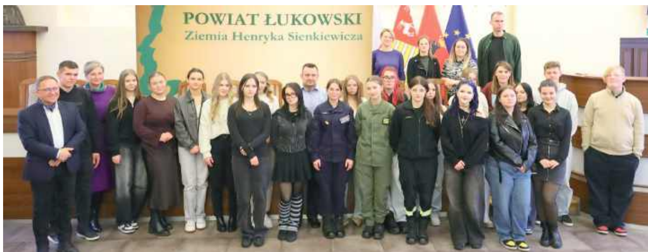
Laureatki Etapu Powiatowego będą reprezentować Powiat Łukowski w Etapie Regionalnym, który odbędzie się w dniu 19 grudnia w Lubartowie

W rywalizacji wzięło udział 24 uczniów z ośmiu szkół średnich: Zespołów Szkół nr 1, 2 i 3 w Łukowie, Zespołu Szkół w Radoryżu Smolanym i w Adamowie, Zespołu Szkół w Stoczku Łukowskim, IV Liceum Ogólnokształcącego im. Jana Pawła II oraz I Liceum Ogólnokształcącego im. T. Kościuszki w Łukowie.