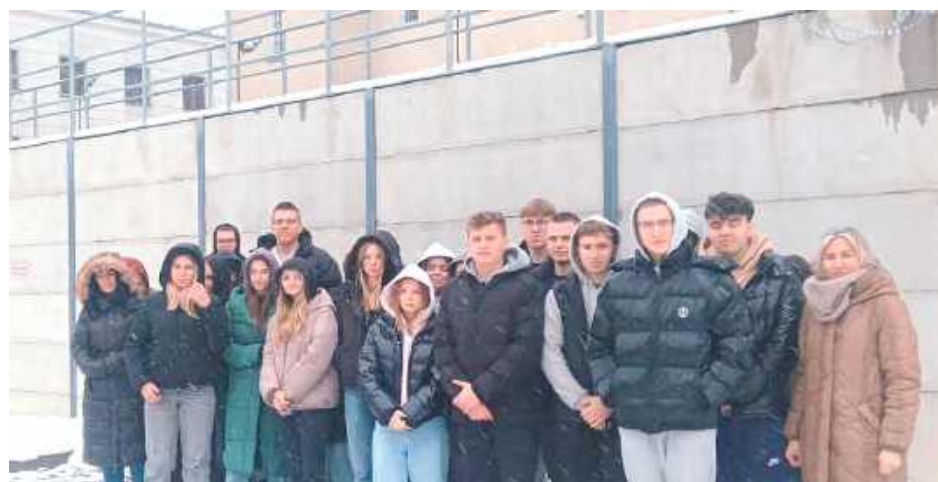
Młodzież z Warszawskiej przed murami siedleckiego więzienia. Później zwiedzili wybrane części zakładu karnego i poznali pracę funkcjonariuszy służby więziennej

Podczas zajęć uczniowie zwiedzili wybrane części zakładu karnego i rozmawiali o konsekwencjach podejmowanych wyborów, zwłaszcza tych, które mogą prowadzić do konfliktu z prawem.