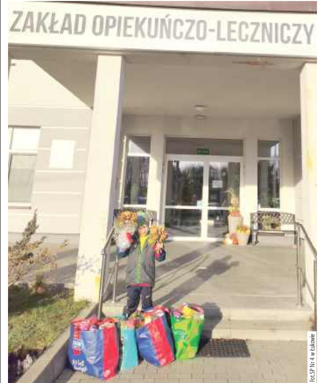
Akcja „Herbatka dla Seniora” wspiera seniorów, a jednocześnie uczy młodych ludzi empatii, wrażliwości i gotowości do pomagania

Szkoła Podstawowa nr 4 w Łukowie z okazji Międzynarodowego Dnia Seniora, który obchodzony jest 14 listopada, włączyła się w akcję „Herbatka dla Seniora”.