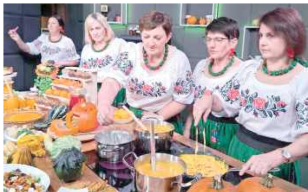
Panie z KGW Sosenki gotują na patelni makaron w sosie dyniowym