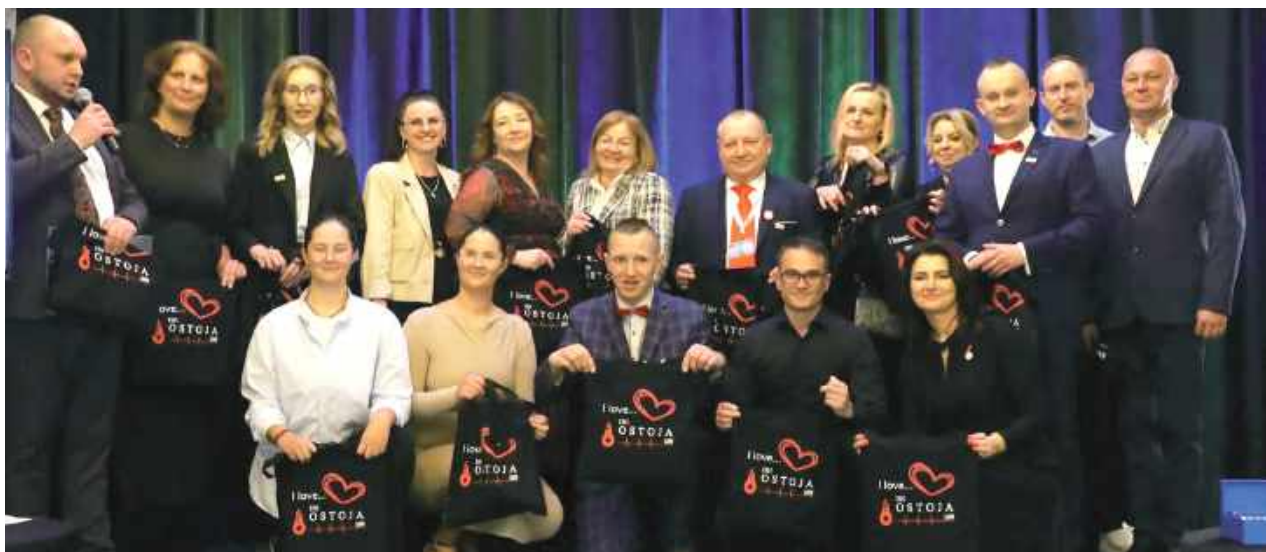
I Gala Krwiodawstwa i Wolontariatu Powiatu łukowskiego została zorganizowana przez Klub HDK „Ostoja”