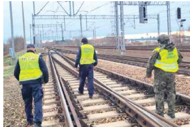
Policja apeluje: w przypadku zaobserwowania niepokojących oraz nietypowych zdarzeń należy powiadomić o tym służby pod nr alarmowym 112 lub bezpośrednio do dyżurnego jednostki policji

- Policjanci z Komendy Powiatowej Policji w Łukowie w związku z aktami dywersji, do których doszło w ostatnim czasie na terenie infrastruktury kolejowej, prowadzą od kilku dni intensywne działania, które