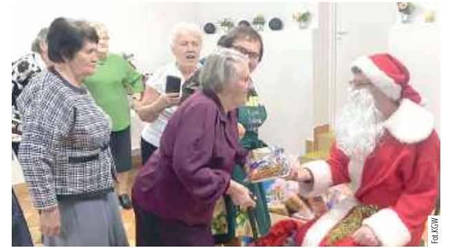
Święty Mikołaj z dużym workiem prezentów zaprosił każdego seniora na kolana i wręczał mu upominek

Organizatorzy swoje podziękowania kierują do Fundacji Biedronki za możliwość organizowania tak wyjątkowych spotkań dla seniorów, dzięki którym wszyscy mogli wspólnie spędzić czas w miłej i serdecznej atmosferze. Celem programu „Danie wspólnych chwil” jest przeciwdziałanie samotności osób starszych poprzez zaproszenie ich do wspólnego stołu.