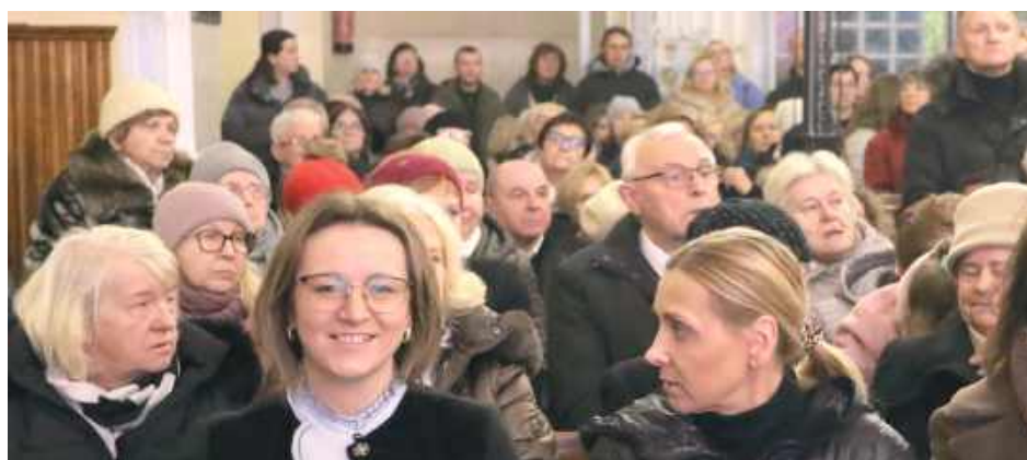
Na koncert licznie przybyli miłośnicy muzyki sakralnej