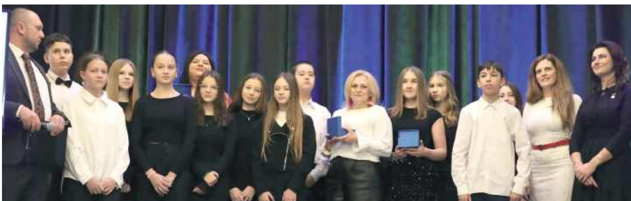
Wręczono „Kryształowe Serca” - specjalne wyróżnienia Klubu HDK „Ostoja” w Łukowie. Osoby zaangażowane w niesienie pomocy innym zostały uhonorowane za swoją bezinteresowną działalność