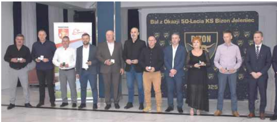
Oni otrzymali Srebrne Honorowe Odznaki LZPN

W eleganckich wnętrzach Centrum Konferencyjno-Bankietowego Chabrowy odbyła się uroczysta gala z okazji 50-lecia Klubu Sportowego Bizon Jeleniec.