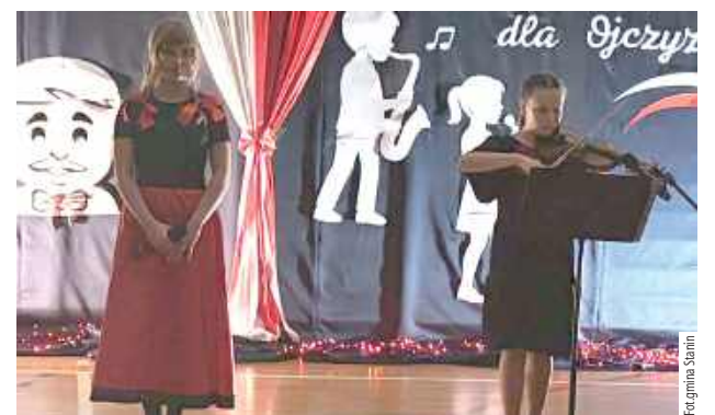
Specjalnie dla zacnych gości jedna z uczennic zagrała na skrzypcach