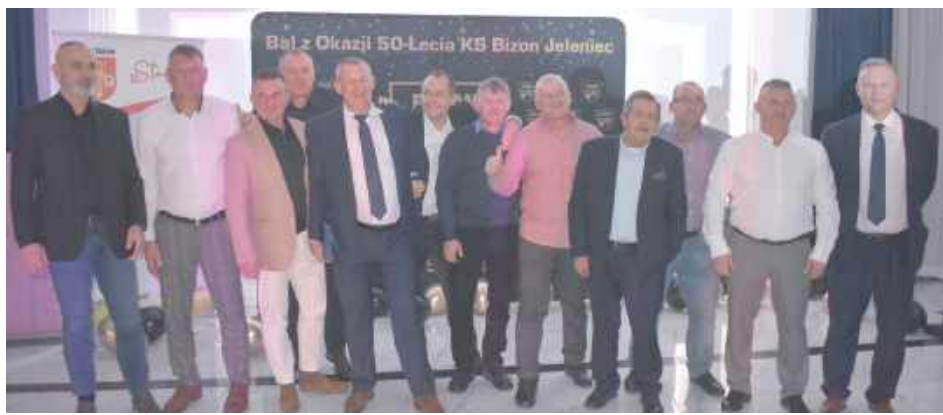
Historia klubu na wspólnym zdjęciu