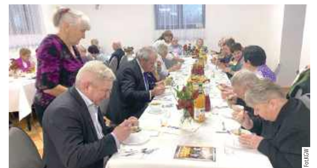
Na seniorów czekał pyszny obiad i słodkości

Organizatorzy chcą także podziękować seniorom, bez których nie byłoby tych spotkań. To właśnie dla nich przygotowywa-