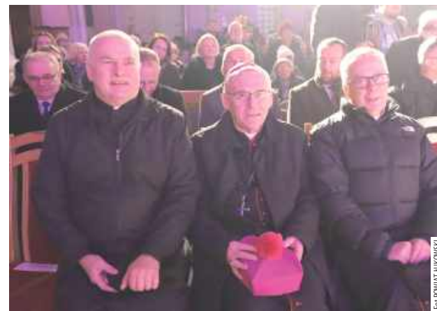
Koncert został poprzedzony Mszą Świętą, której przewodniczył jej ks. bp Kazimierz Gurda