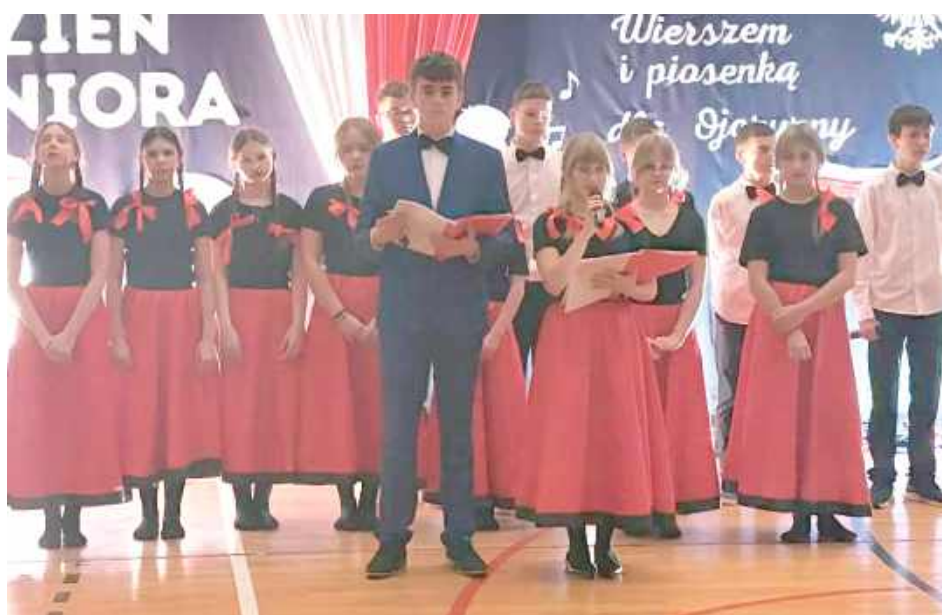
Wspaniały występ uczniów z Jeleńca zachwycił gości

W gminie Stanin odbył się XXVIII Dzień Seniora, obchodzony w formie patriotycznej wieczornicy pod hasłem „Wierszem i piosenką dla Ojczyzny”. Artystyczną część uroczystości przygotowały dzieci z Publicznej Szkoły Podstawowej w Jeleńcu, które wraz z nauczycielami zaprezentowały program pełen wierszy i pieśni patriotycznych.