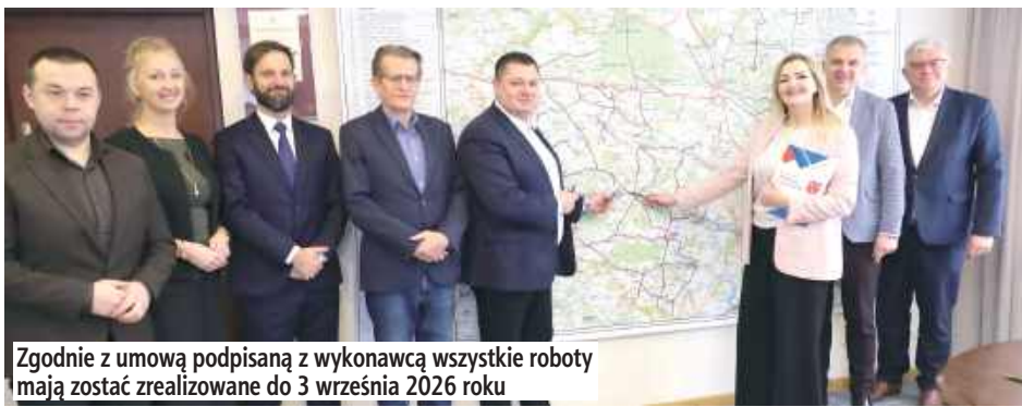
Zgodnie z umową podpisaną z wykonawcą wszystkie roboty mają zostać zrealizowane do 3 września 2026 roku

Łączna wartość prac to 7 379 890,62 zł, z czego ponad 4,4 mln zł to rządowe wsparcie. Pozostałe 2,9 mln zł zostanie pokryte po połowie przez powiat łukowski i gminę Krzywda.