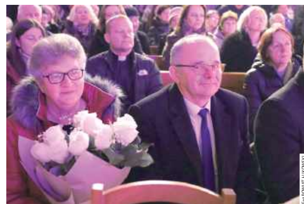
Były także kwiaty dla wykonawców