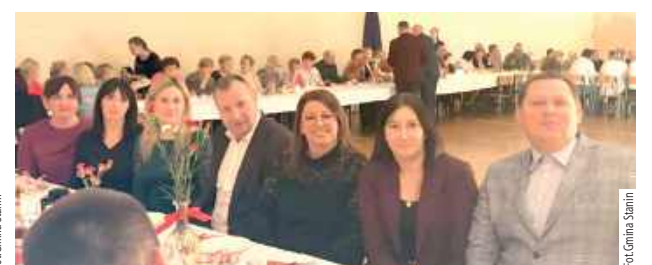
Wszystkich zaproszono na słodki poczęstunek