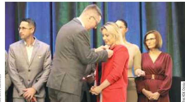
29 krwiodawców otrzymało odznaki Zasłużony Honorowy Dawca Krwi III, II i I stopnia przyznane przez Polski Czerwony Krzyż

I Gala Krwiodawstwa i Wolontariatu Powiatu Łukowskiego została zorganizowana przez Klub HDK „Ostoja”. Podczas uroczystości uhonorowano krwiodawców odznakami Zasłużony Honorowy Dawca Krwi oraz nagrodzono osoby i organizacje za działalność społeczną i charytatywną.