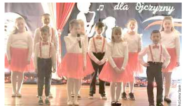
Najmłodsi zauroczyli swoimi występami zebrana publiczność