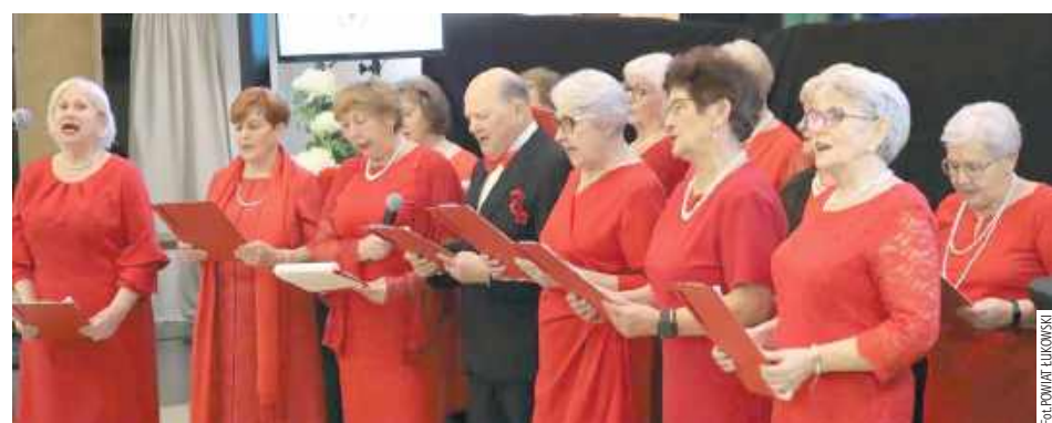
Spotkanie uświetnił występ Klubu Seniora PCK

Gala Krwiodawców i Wolontariuszy była też okazją promowania idei dawstwa szpiku. Prelekcję na ten temat wygłosił Piotr Zie-