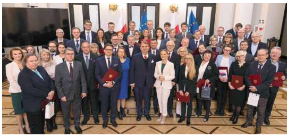
Laureaci Nagród Ministra Zdrowia

- Pracownicy Uniwersytetu Medycznego w Lublinie znaleźli się w gronie tegorocznych laureatów Nagród Ministra Zdrowia przyznawanych za wybitne osiągnięcia naukowe, dydaktyczne oraz za całokształt dorobku.