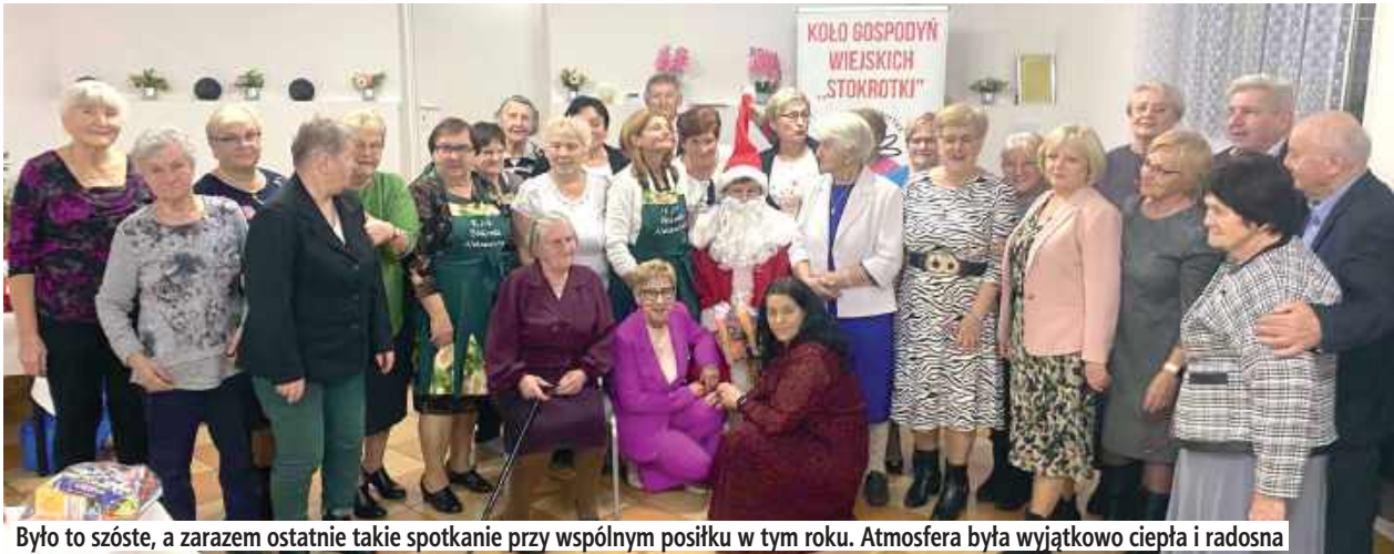
Było to szóste, a zarazem ostatnie takie spotkanie przy wspólnym posiłku w tym roku. Atmosfera była wyjątkowo ciepła i radosna

GMINA ŁUKÓW: Panie i panowie z Koła Gospodyń Wiejskich „Stokrotki” z Aleksandrowa 22 listopada zorganizowali szóste i zarazem ostatnie w tym roku spotkanie dla seniorów w ramach programu „Danie Wspólnych Chwil” Fundacji Biedronki.