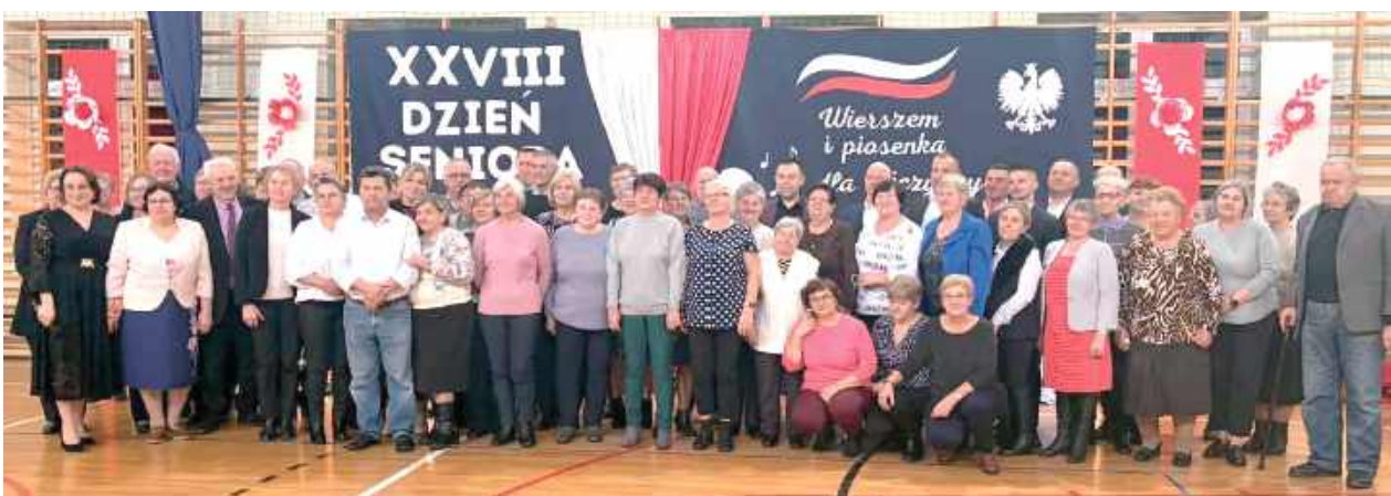
Seniorzy spotkali się na patriotycznej wieczornicy

W gminie Stanin odbył się XXVIII Dzień Seniora, obchodzony w formie patriotycznej wieczornicy pod hasłem „Wierszem i piosenką dla Ojczyzny”. Artystyczną część uroczystości przygotowały dzieci z Publicznej Szkoły Podstawowej w Jeleńcu, które wraz z nauczycielami zaprezentowały program pełen wierszy i pieśni patriotycznych.