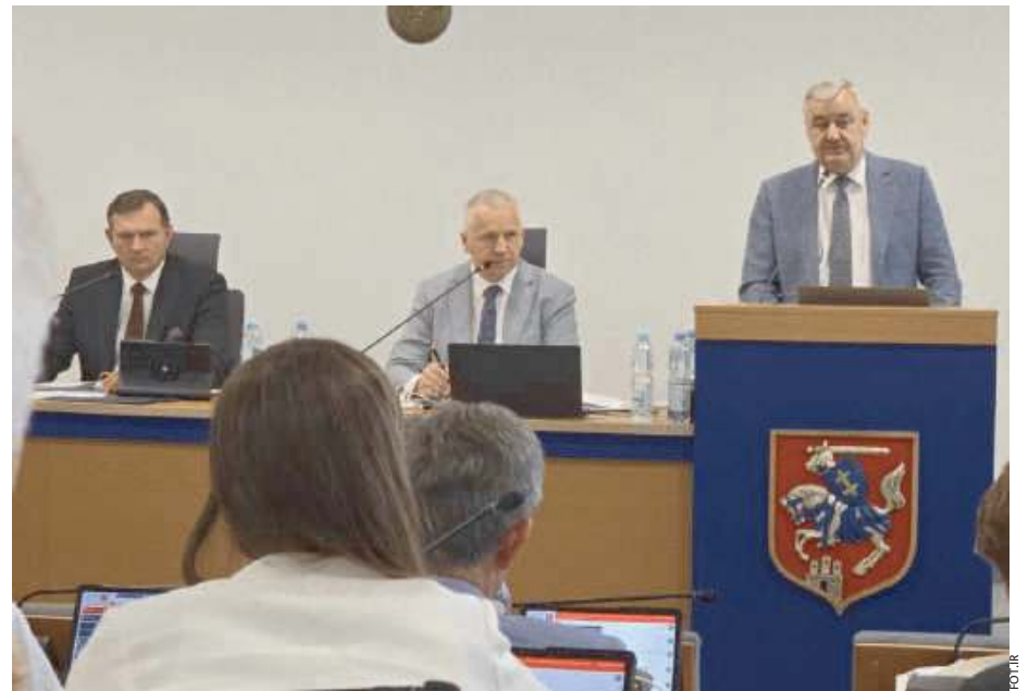
„Mamy szansę odbudować komunikację na linii prezydent - rada” - mówił prezydent miasta Siedlce.