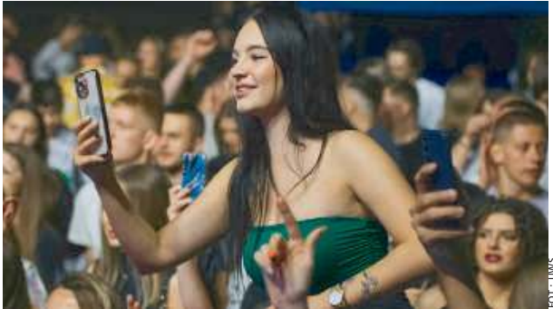
Tęgo wieczoru to studenci przejęli władzę nad miastem i uczelnią.

Za nami Jackonalia, czyli najbardziej wyczekiwane święto studentów Uniwersytetu w Siedlcach.