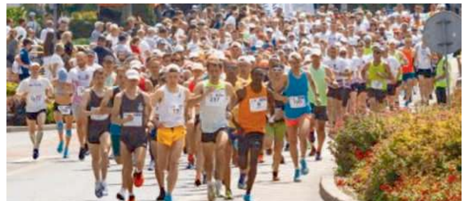
Pomóż walczyć z przemocą

Na tak duże zainteresowanie biegiem wpływa nie tylko sprzyjający aktywnościom sportowym czerwcowy termin, lecz także uniwersalny charakter wydarzenia, które przyciąga zarówno amatorów, na których czekają trasy o długości 2 i 5 kilometrów, jak i tych bardziej wprawionych. W biegu liczy się przede wszystkim pomoc innym. Stań na starcie i pomóż ofiarom przemocy! MAT.PRAS.