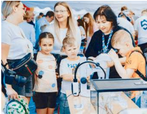
Na najmłodszych uczestników czekało mnóstwo niespodzianek.

Powstało także obozowisko z okresu Powstania Styczniowe-