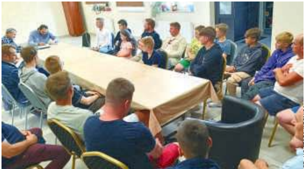
Spotkanie zgromadziło lokalnych sympatyków sportu.

W niedzielę 2 czerwca w Starej Kornicy odbyło się spotkanie początkujące istnienia organizacji sportowej GKS Korona Kornica.