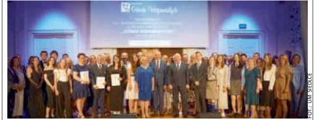
Gratulujemy wszystkim „wspaniałym”!

27 maja w Sali Białej Miejskiego Ośrodka Kultury w Siedlcach odbyło się uroczyste podsumowanie XXX edycji Samorządowego Konkursu Nastolatków „Ośmiu Wspaniałych” Miasta Siedlce.