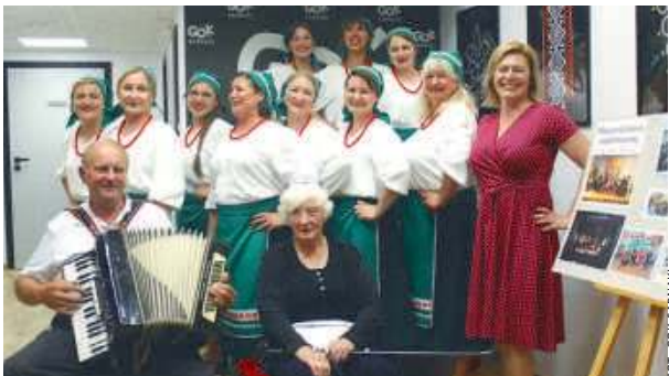
Tradycyjne nadbużańskie stroje ludowe niebawem zostaną uszyte.

GOK w Sarnakach, przy współpracy ze społecznością gminy Sarnaki, podjął projekt uszycia tradycyjnych strojów nadbużańskich dla lokalnych zespołów ludowych.