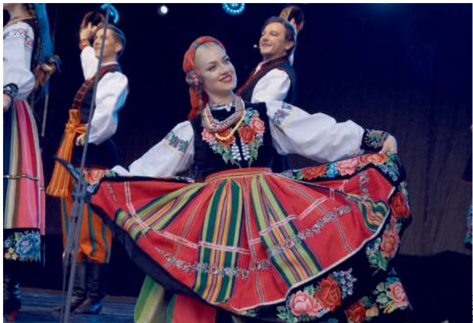
Za sprawą Mazowsza ten wieczór był wyjątkowy...