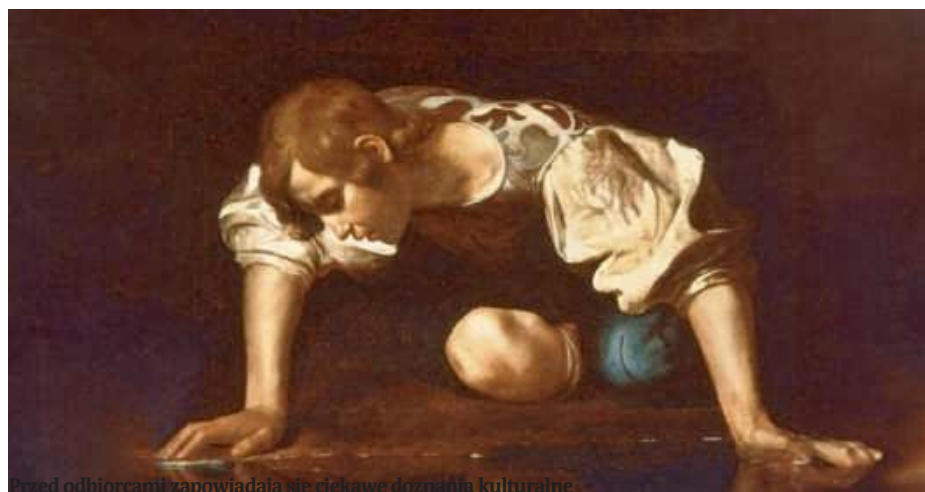
Przed odbiorcami zapowiadają się ciekawe dzwoniła kulturalne.

To był wieczór pełen śmiechu, radości i wspólnej zabawy i na pewno na długo zostanie w pamięci uczestników. MAT. OPRAC.