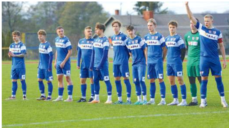
Rezerwy i trzeci zespół Pogoni Siedlce po sezonie zamejdają się w wyższych klasach rozgrywkowych.