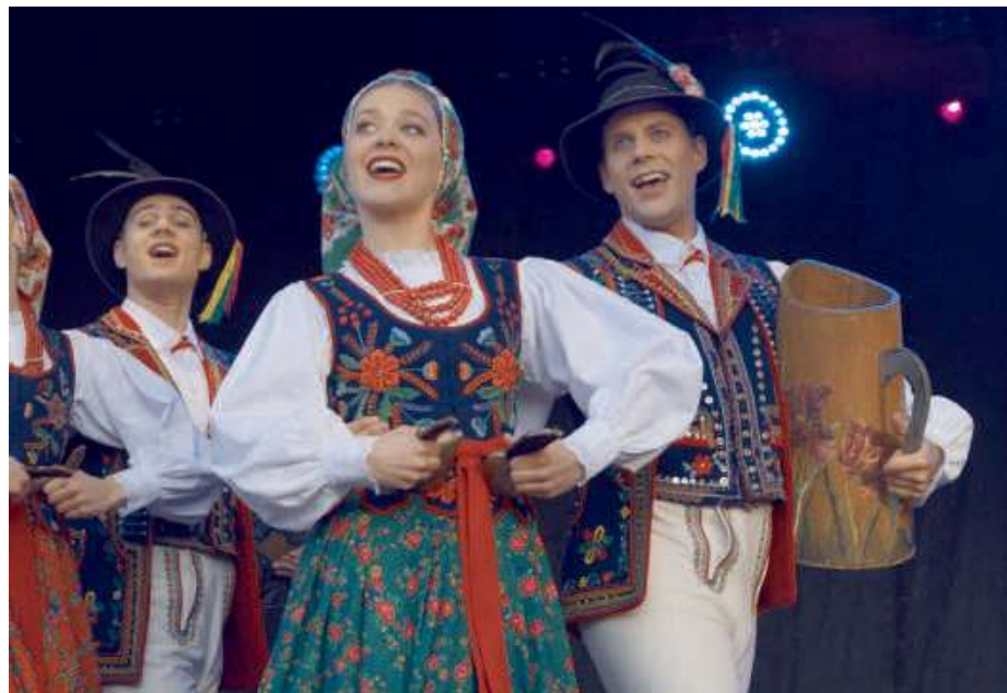
Zespół udowodnił, że tradycja może być żywa i inspirująca.