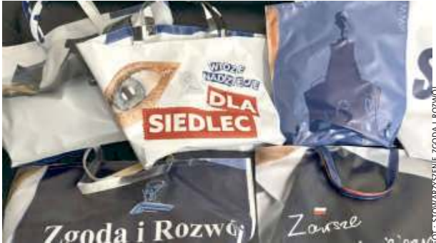
Banerowe torby cieszą się ogromnym zainteresowaniem.

Tegoroczne banery wyborcze Stowarzyszenia Zgoda i Rozwój przemieniły się w eleganckie i nietuzinkowe torby, których dochód ze sprzedaży wesprze dzieci z Siedleckiego Hospicjum Domowego.