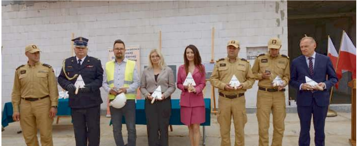
Dokonano uroczystego wmurowania aktu erekcyjnego pod dalszą budowę.

– Bardzo serdecznie dziękuję za Państwa codzienną pracę i wysiłek, ale również Waszym rodzinom, które wspierają Was w tym żebyście mogli wykony-