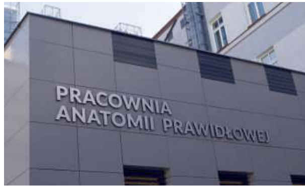
UwS dysponuje kompleksowo wyposażonymi pracownikami.

Uniwersytet w Siedlcach oczekuje na wizytę zespołu opiniującego Polskiej Komisji Akredytacyjnej w sprawie kierunku lekarskiego, którą zaplanowano na 6 - 7 czerwca br. (tuż po wydaniu ŻS do druku). Jednocześnie władze uczelni informują, że 21 marca tego roku przekazały PKA raport samooceny, w którym uwzględniono wszystkie uwagi sformułowane w poprzedniej opinii i wdrożono do działania naprawcze.