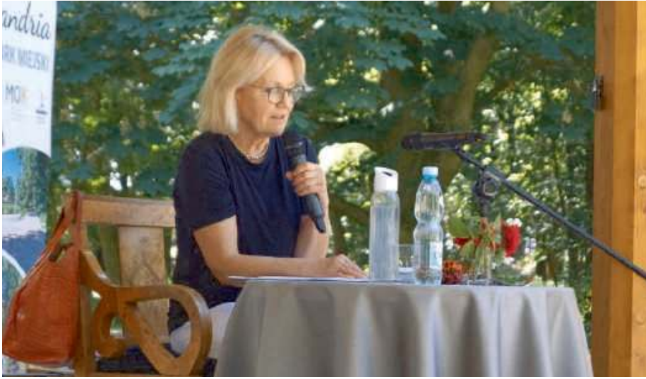
Maria Pakulnis zaprezentowała swoje ulubione wiersze zaczerpnięte z klasyki polskiej poezji.

W trakcie spotkania pt. "Cisza jest... głosów zbieraniem" artystka zaprezentowała swoje ulubione wiersze zaczerpnięte z klasyki polskiej poezji, a także porozmawiała z przybyłą młodzieżą o sztuce interpretacji tekstów literackich. Maria Pakulnis, znana z głębokiej wrażliwości i umiejętności interpretacyjnych, wprowadziła słuchaczy w świat literatury, ukazując różnorodne emocje i znaczenia ukryte w słowach. Dla wielu obecnych tam młodych ludzi to doświadczenie mogło być doskonałym pretekstem do po-