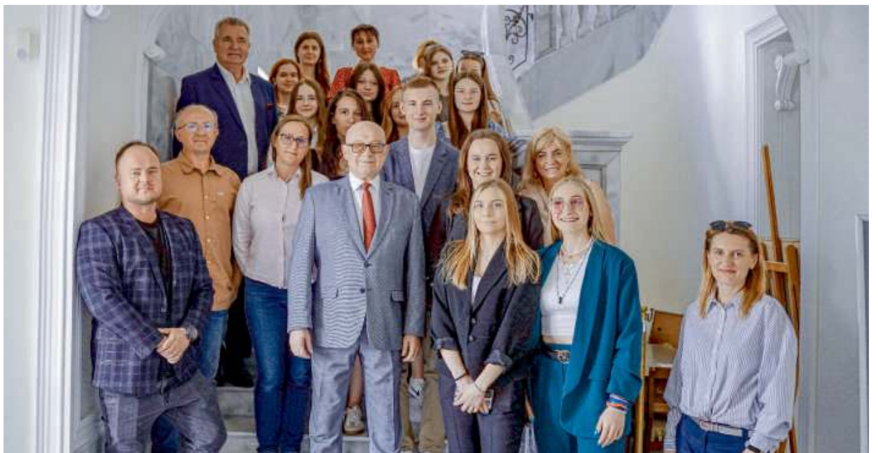
Maraton okazał się bardzo udanym przedsięwzięciem. Wszystkie wykłady cieszyły się dużym powodzeniem.

Nagrodę grupową Konkursu - projektor multimedialny dla najwytrwalszej i najbardziej zaangażowanej pod względem frekwencji szkoły uzyskały uczennice klasy 7c Szkoły Podstawowej nr 4 im. Adama Mickiewicza w Siedlcach: Maja