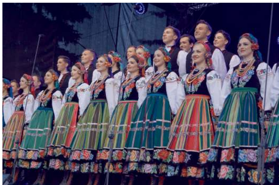
Do Siedlec przybyła ponad stuosobowa grupa artystów.

Zespół „Mazowsze” swoim występem w Siedlcach udowodnił, że tradycja może być żywa, dynamiczna i inspirująca. Ich sztuka nie tylko bawiła, ale także inspirowała do odkrywania piękna polskiej kultury i historii. W ten wyjątkowy wieczór „Mazowsze” przypomniało nam o naszych korzeniach, jednocząc nas w duchu wspólnoty i dumy z polskością. PA