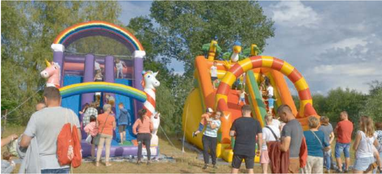
Pełna lista atrakcji przyciągnęła wielu mieszkańców gminy

- Dziecięca Festa w Brzozowie przyciągnęła wielu uczestników oraz została przez nich przyjęta z wielkim entuzjazmem. Pomimo chwilowych opadów deszczu imprezę zdecydowanie możemy zaliczyć do udanych. Na dzieci czekało wiele atrakcji. Do stoiska z wata cukrową oraz popcornem kolejkę właściwie się nie kończyła. Najmłodszy chętnie korzystali z możliwości zaplecenia we wło-