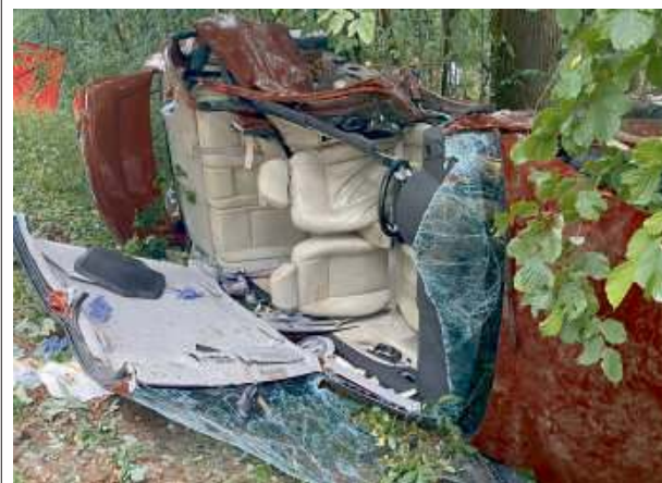
Kierowca forda stracił panowanie nad pojazdem.

W niedzielę, 2 czerwca, przed godz. 15 na trasie Siedlce - Hołubla doszło do poważnego wypadku. Ford zderzył się z audi. Kierowcy aut zostali przetransportowani do szpitala. – 52-latek kierujący fordem modeno, jadąc od strony Golic w kierunku Hołubli, na łuku drogi utracił panowanie nad pojazdem i uderzył w jadące z naprzeciwka audi. Kierowała nim 43-letnia kobieta, w samochodzie był też 38-letni pasażer – poinformowała sierż. sztab. Barbara Jastrzębska z KMP w Siedlcach. W wyniku wypadku ranni zostali oboje kierujący. Kierowcę forda do szpitala przetransportował śmigłowiec. Pasażer audi nie doznał obrażeń. MIA