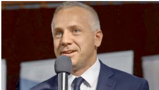
Prezydent miasta Siedlce - Tomasz Hapunowicz.

10770 zł to wynagrodzenia zasadnicze, 3 tys. 450 zł dodatku funkcyjnego, 4 tys. 266 zł dodatku specjalnego oraz 2 tys. 046,30 zł dodatku za wieloletnią pracę w wysokości 19% miesięcznego wynagrodzenia zasadniczego (dodatek ten wzrośnie do 20% od 1 lutego 2025 r.) – wszystkie kwoty brutto. Ponadto prezydentowi zgodnie z przepisami przysługują nagrody jubileuszowe i dodatkowe wynagrodzenie roczne. ID