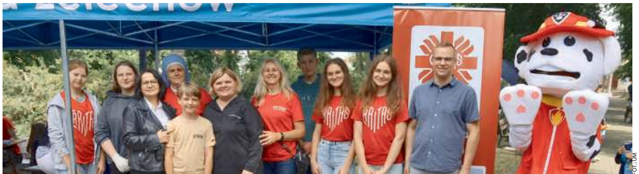
Współpraca okazała się kluczem do sukcesu

Wolontariusze Caritas Żelechów oprócz zabaw i konkursów zapraszali na smaczne gofry oraz malowanie twarzy. Uczniowie i nauczyciele z Zespołu Szkół Ponadpodstawowych w Żelechowie zapewnili dzieciom animacje, gry i zabawy, m.in. trafianie do celu czy przeciąganie liny. Dodatkowo oferowa-