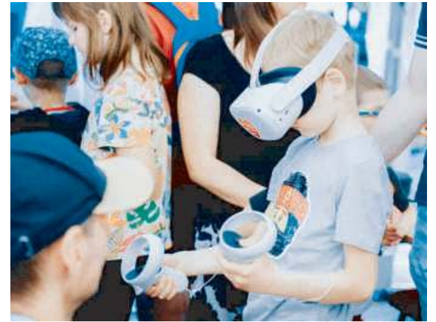
Można było wejść do wirtualnej rzeczywistości...

go, gdzie można było obejrzeć wystawę replik uzbrojenia i umundurowania od powstania, przez I wojnę światową, wojnę polsko-bolszewicką do czasów II wojny światowej. Piknik zakończyło "wybuchowe wydarzenie" - rekonstrukcja epizodu walk, w którym użyto czarnoprochowej oryginalnej broni z XIX w.