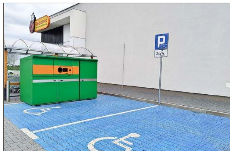
Automat blokuje jedno z dwóch miejsc dla osób niepełnosprawnych.

Dlatego właśnie skontaktowałem się z Biurem Obsługi Klienta spółki Jeronimo Martins Polska, do którego należy sieć sklepów Biedronka, prosząc o interwencję w tej sprawie. Jej przedstawiciele poinformowali mnie, że zostanie ona zgłoszona do osób odpowiedzialnych za poprawne funkcjonowanie tego sklepu. Jednocześnie firma przeprosiła za wszystkie dotychczasowe niedogodności z tym związane. tra