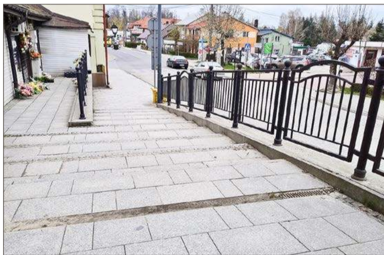
Te schody przy ul. Legionów wymagają przebudowy.

Paweł Gawlik, który porusza się na wózku, przypomina, że przed przebudową Rynku takiego problemu nie było. Był tam chodnik z płyt i zjazd, z którego normalnie korzystał.