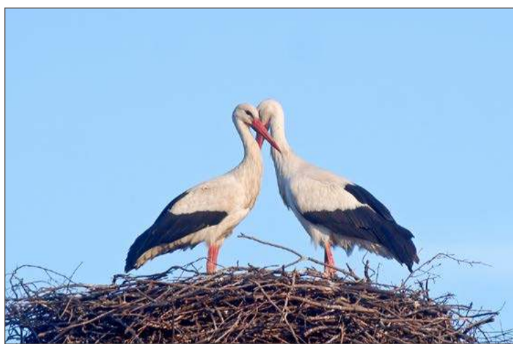
Na gnieździe w Chotowej już kwitnie miłość.

– Wygląda na to, że w końcu doczekaliśmy się stałego mieszkańca gniazda. Nic dziwnego, że dopiero teraz. Jak widać, dotarł do nas pieszo – głosił podpis do fotografii spacerującego po drodze bociana.