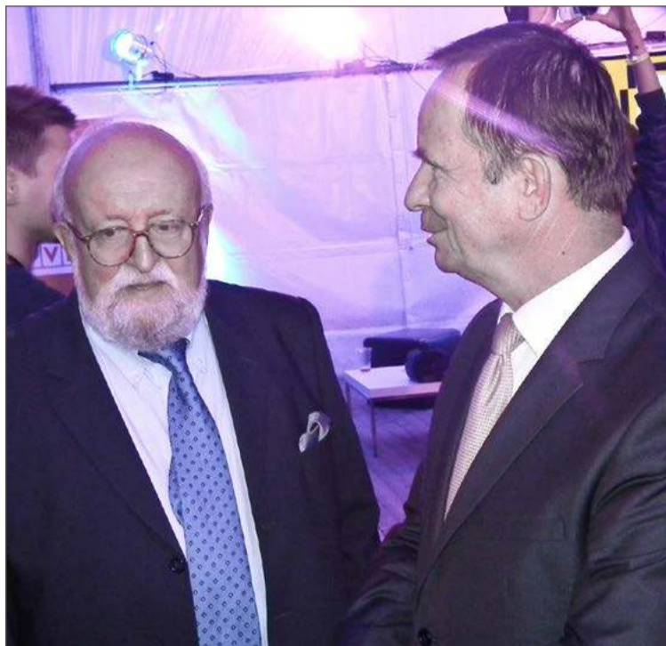
Krzysztof Penderecki w rozmowie z Władysławem Ortyłem, podczas festiwalu Goodfest 2013 w Dębicy.

Co więcej ma to ambitne plany związane z budynkiem przy ul. Krakowskiej, kupionym od Gminy Wyznaniowej Żydowskiej w Krakowie. Nie tylko chce, by powstało tam centrum kulturalne, którego Krzysztof Penderecki byłby patronem, ale też by została tam przeniesiona wystawa dotycząca kompozytora, którą oglądać