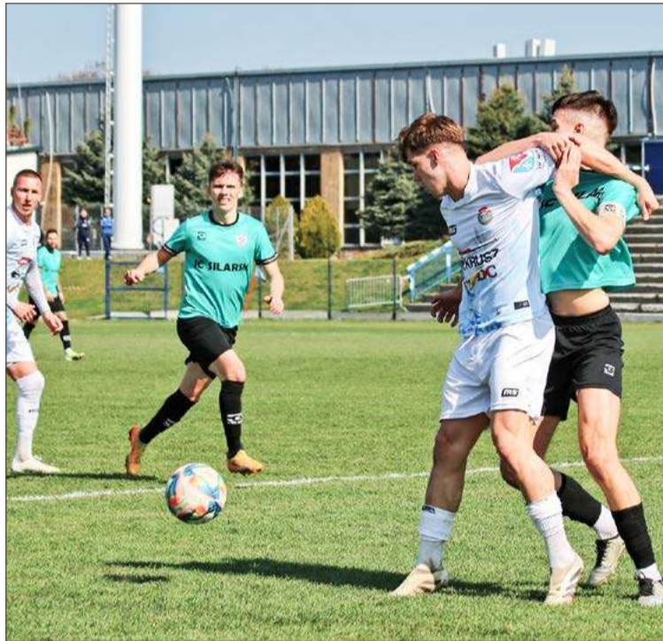
W meczu z Cosmosem Igloopol (białe stroje) zwycięstwo zapewnił sobie już w pierwszej połowie. (fot. Bogusław Mitan)

kowski (70. Pieniążek), Kozłowski, Peda, Buczek, Bajorek (90. Ciskał), Majka (84. Leśniak), Kurek, Cyganowski (75. Mucha), Smoła (36. Tarała).