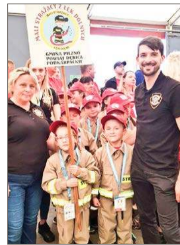
Młodzi strażacy z Łęk Dolnych w Wieruszowie startują co roku.

Młodzi strażacy są co prawda oceniani przez jurorów, ale ci nie