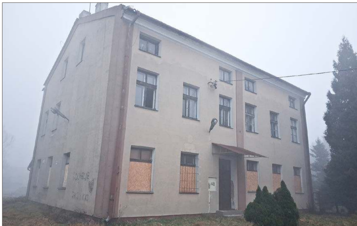
Obiekt przez ostatnie lata jest nieużytkowany i popada w coraz większą ruinę.

I dodał, że są pilniejsze rzeczy do zrobienia, niż ratowanie stajni. I tu wymienił właśnie zagospodarowanie dawnej synagogi. Choć wóldarz woli określenie internat, gdyż wła-