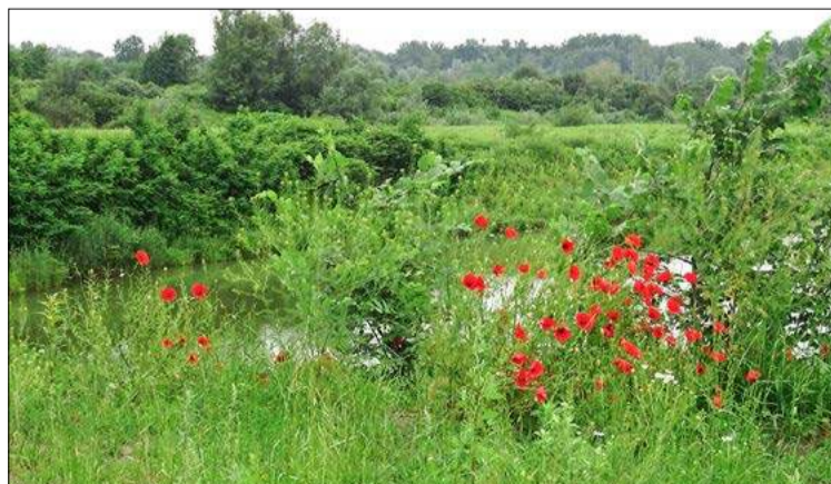
Czerwone maki nad Wisłoką.