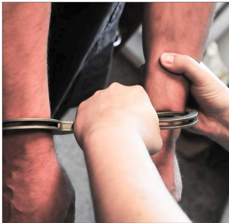
Młody mężczyzna został zatrzymany.

- Musiałam wyjechać kawałek, żeby cokolwiek zobaczyć. On jechał z taką prędkością, że nie miałam szans zareagować. Wiele osób to widziało, jest tam też kamera, więc zobaczymy, jak sprawa się potoczy - powiedziała, dodając, że nie przy-