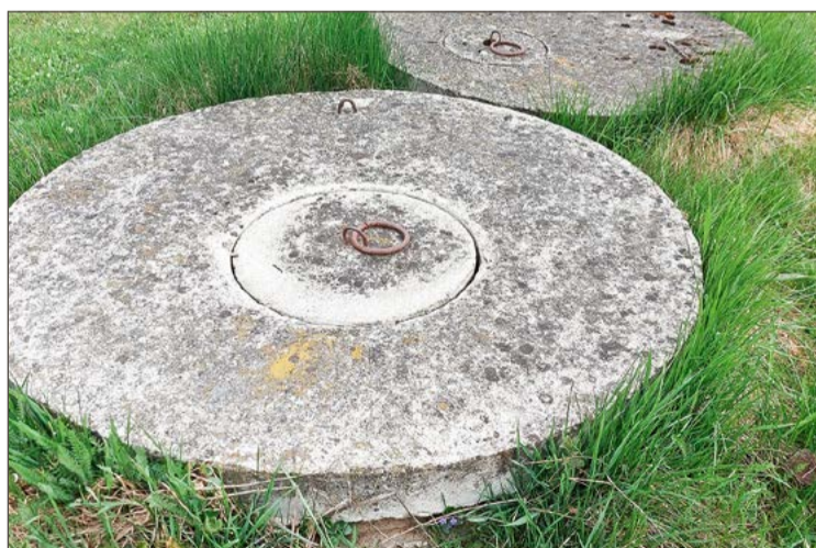
Z przydomowych szamb nadal korzysta wiele gospodarstw w powiecie.

W ten sposób weryfikują, czy za ich pośrednictwem nie dochodzi do nielegalnego odprowadzania ścieków. Zastępca dyrektora RZGW w Rzeszowie przypomina bowiem, że zarówno korzystanie z wód, jak i wykonanie urządzenia wodnego