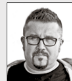
ratuszniak@ol.com.pl tel. 14 670 27 80