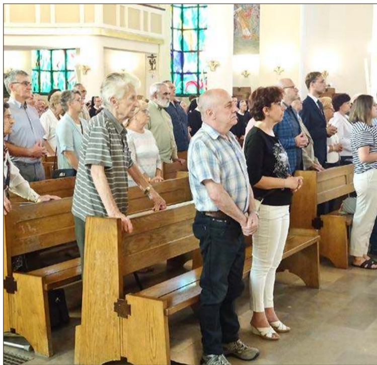
W ubiegłym roku wierni z parafii MBA z udziałem biskupa świętowali jej 50-lecie, w tym czeka ich wizytacja kanoniczna.

W drugim dniu wizytacji, czyli w niedzielę na każdej mszy św. przedpołudniowej wizytator wy-