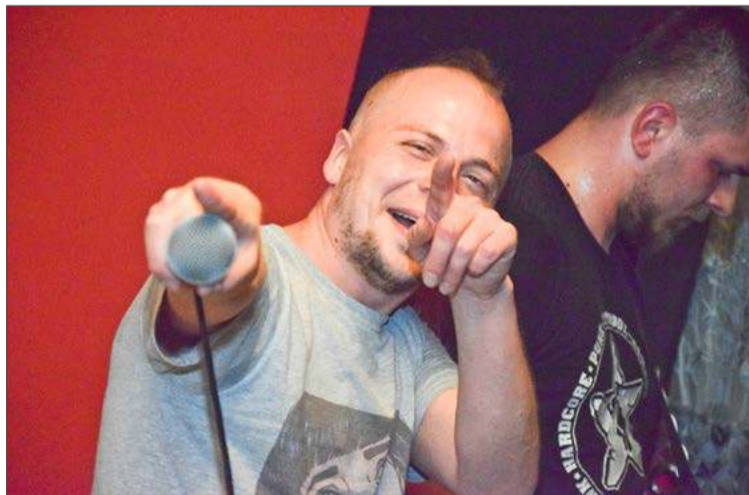
Na CPS Piknik 7 wystąpi m.in. grupa Burek! Dobry pies.

Najpopularniejszym będzie niewątpliwie dobrze znane lokalnej publiczności Eye For An Eye z Bielska-Białej. Hardcore punkowa formacja gościła już u nas z koncertami. Poza tym wystąpią: Wielki Las, czyli hardcore punkowcy ze stolicy Podkarpacia, podobnie zresztą jak Burek! Dobry pies, który