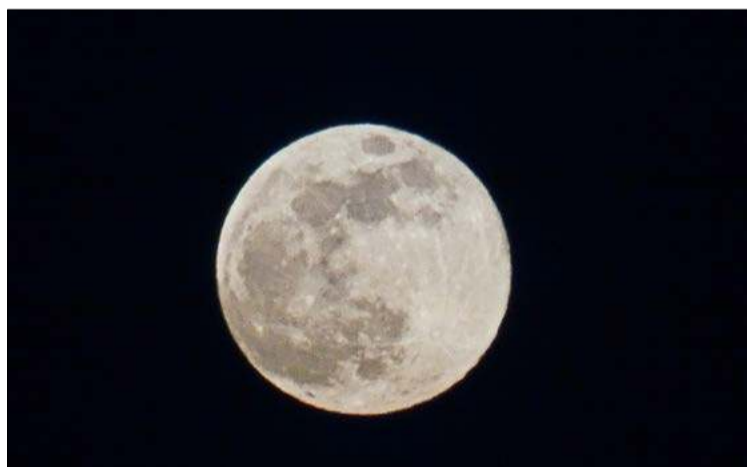
Drugą stronę widziało tylko czworo ludzi.