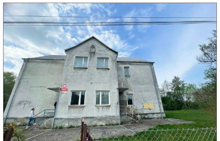
Kiedyś było tu przedszkole, będzie dom seniora.