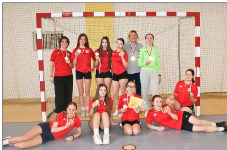
Radość SP 6 ze zwycięstwa bezcenna..