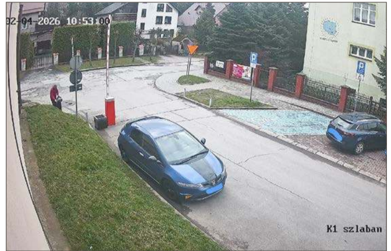
Kadr z filmu nagrany przez kamerę monitoringu.

– I przez to możemy mieć problem z rejestracją obrazu. Poza tym taki monitoring wolałbym wykorzystać np. na parkingach, bo tam,