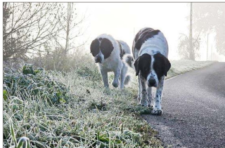
Psy poza posesją zawsze powinny przebywać pod nadzorem opiekuna.

Brak nadzoru nad psem może skutkować mandatem w wysokości nawet 1000 zł, a w razie po-