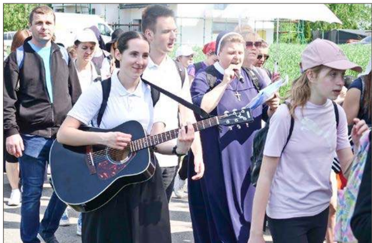
W drodze pielgrzymi uczestniczą w modlitwie i śpiewają pieśni.