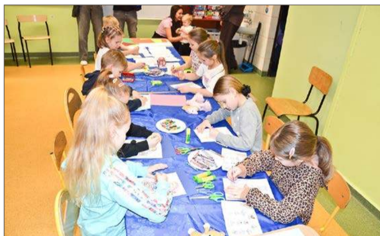
Najmłodzi poznawali przyszłe szkoły podczas dni otwartych. Na zdjęciu ci, którzy przyszli na taki do Szkoły Podstawowej nr 9 Dębicy.

- Mamy tam zapisane troje dzieci, w tym jedno spoza obwodu. Decy-