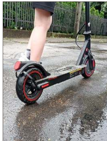
Nastolatek upadł na wysokości Starego Cmentarza w Dębicy.