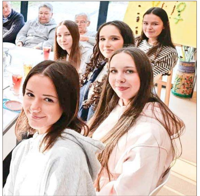
Dziewczyny przywoziły ze sobą uśmiech i optymizm.