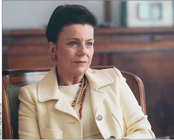
Aktorka Agata Kulesza jako profesor Berger