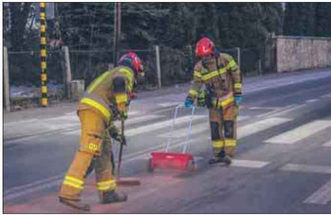
Wyciek śliskiej substancji.

Na miejsce natychmiast zadysponowano zastępy z Jednostki Ratowniczo-Gaśniczej w Jaworznie oraz Ochotniczej Straży Pożarnej