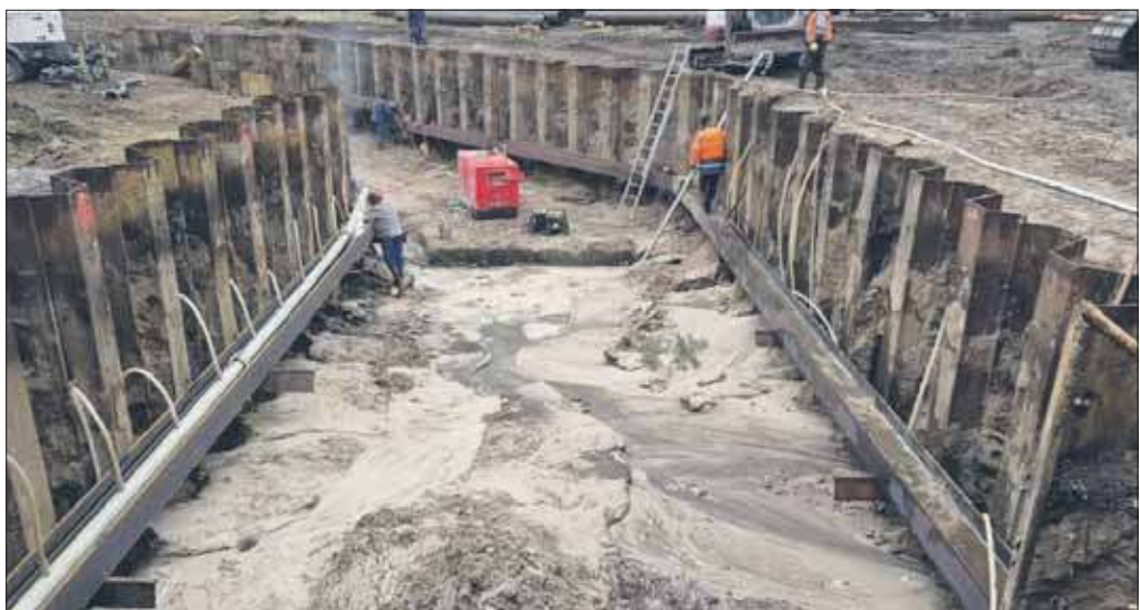
Prace przy usuwaniu awarii kanalizacji w Jeleniu.

Awaria sieci kanalizacyjnej biegnącej między Oczyszczalnią Ścieków w Jeleniu oraz Przepompownią Biały Brzeg jest zażegnana. Prowadzone są jednak nadal prace związane z wymianą uszkodzonego odcinka kolektora ściekowego. Jak więc wygląda postęp prac w tym miejscu?