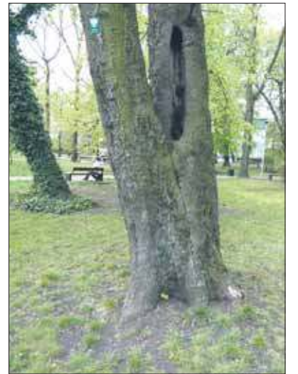
Jawor Janusz – 2020.04.28

P rzypomnę, że Park Zielona, czasami nazywany skwerem przy ulicy Pocztowej, jest miejscem, gdzie nader często prowadzę dokumentację fotograficzną. Czasami okazuje się ona niewystarczająca, tak jak było w przypadku znikniętego Pawła, na krótko przed śmiercią pozbawionego statusu pomnika przyrody ożywionej. W parku zostały jeszcze dwa pomniki przyrody ożywionej. To jawor Janusz oraz lipa Grażyna. Po drugiej stronie ulicy Pocztowej mamy jeszcze brzozę Agnieszkę. W tym gronie Grażyna zdaje się okazać zdrowia. Pozostałe drzewa mają sporo dolegliwości. Przykładowo Agnieszkę, o czym donosiłem w ubiegłym roku, opanowała huba z gatunku hubiak pospolity. Ona jest zdecydowanie osłabiona.