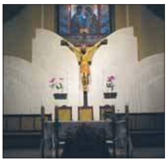
Ołtarz kościoła na Długoszynie

Zmiana nastąpiła po rezygnacji z posługi dusz-