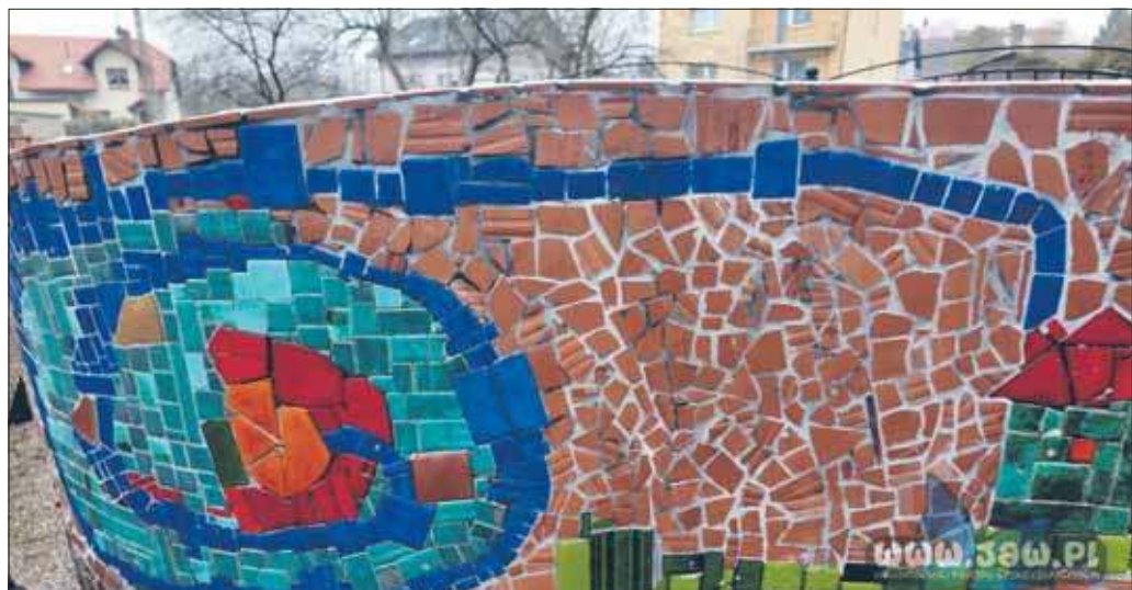
Mozaika na skwerze św. Teresy od Dzieciątka Jezus

Tuż naprzeciwko głównego domu Wspólnoty Betlejem powstaje skwer św. Teresy od Dzieciątka Jezus. To skwer nie byle jaki – jak wszystko, co we Wspólnocie Betlejem powstaje. To miejsce niesie ze sobą szczególne przesłanie.