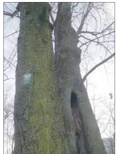
Jawor Janusz – 2025.02.19

Na jawora noszącego obecnie imię Janusz po raz pierwszy zwróciłem uwagę w dniu 28 kwietnia 2020 roku. Wtedy dokumentowałem okoliczne drzewa tego gatunku. Wówczas drzewa w pobliżu biblioteki miały obficie ulistnione korony, a drzewo z rynku wyraźnie opóźniało się z początkiem wegetacji. Jeszcze bardziej opóźniony był jawor z parku. Tego dnia zauważyłem, że drzewo jest na wysokości paru metrów rozwidlone. Poza tym na części wspólnej pnia jest spore pęknięcie. Najważniejsza potężna głęboka dziupla znajduje się w jednym grubszym z pni. Jej brzegi są wyraźnie zagojone, a tym samym wzmocnione. Prawdopodobnie dziupla sięga szczytu korony, tworząc z pnia rurę, ale tego nie udało mi się sprawdzić. Większość gałęzi sprawiała wrażenie suchych. Nieliczne rozwijały liście. Tak osłabione gałęzie sprawiają poważne, a nawet śmiertelne zagrożenie dla odwiedzających park, którzy korzystaliby z pobliskiego chodnika. Zatem przypuszczałem, że drzewo jest na najlepszej drodze do przejścia ze stanu pomnika przyrody ożywionej w pomnik przyrody nieożywionej. Jednakże już 18 maja drzewo wyraźnie ożyło i swoją zielenią zrównało się z okolicznymi drzewami. Teraz, a było to 20 lutego, ten opis poza kondycją korony jest prawie taki sam. Tak czy owak idąc tokiem myślenia tych, którzy wydali wyrok na Pawła właśnie, Janusz może stanowić większe zagrożenie dla bezpieczeństwa publicznego niż on, ale jego drewno jest bez wartości, pomijając spełnienie się w roli opału najgorszego sortu.