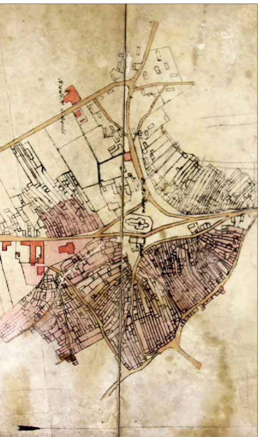
Skutki pożaru z 1874 roku. Na różowo zaznaczono zasięg zniszczeń (MMJ)

Montparnasse to integralna część Paryża. Uchodzi za dzielnicę bohemy artystycznej tego miasta, która przeniosła się tutaj z dzielnicy Montmartre w latach trzydziestych XX wieku. Co jednak ta pierwsza ma wspólnego z Jaworznem? Otóż byli w przeszłości tacy, którzy tak właśnie nazywali pewną część naszego miasta.