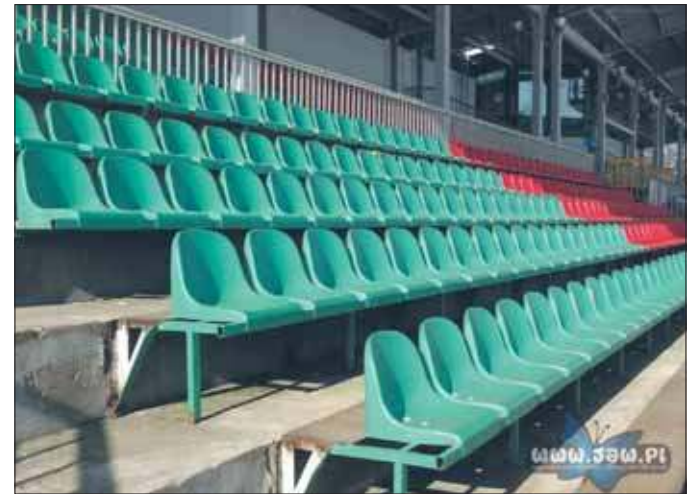
Zmienione krzesełka na Victorii

Nowe siedziska zostały starannie wybrane, by sprostać wymaganiom miłośników piłki nożnej – zarówno tych najwierniejszych, którzy kibicują głośno i z pasją, jak i tych, którzy wolą w spokoju śledzić przebieg gry. Komfort to jednak nie