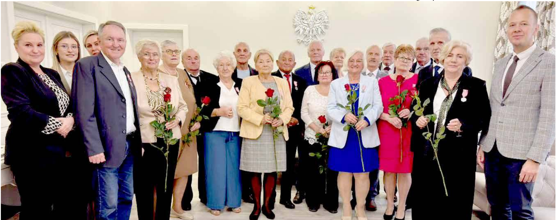
Dziewięć par zostało odznaczonych

Uroczystość ta była trzecią turą wręczenia medali dla jubilatów z gminy Goleniów, którzy ślubowali w 1974 roku. Już niebawem odbędą się kolejne takie uroczystości. DD