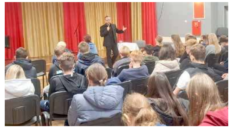
W spotkaniu uczestniczyło ok. 50 osób - głównie młodzież wraz z nauczycielkami z SP im. Adama Mickiewicza

i nauczyciela akademickiego. W trakcie spotkania młodzi ludzie, którzy z zainteresowaniem wysłuchali prelekcji autora, zadali sporo pytań. Odnosząc się do pytań, autor „Do zobaczenia, Kasztanku!” mówił m.in. o wysokiej skali trudności, jaką stanowi prowadzenie wywiadów ze świadkami historii a następnie ich redagowanie, tak by stanowiły przystępną narrację. – Muszę przyznać, że prawdziwym wyzwaniem jest napisanie odpowiednio osadzonej w szerszym