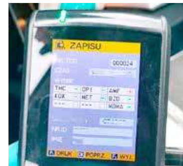
Badanie wykazało obecność amfetaminy w organizmie

Dzięki skutecznym działaniom mundurowych w bieżącym miesiącu ujawniono już 23 kierowców, którzy zdecydowali