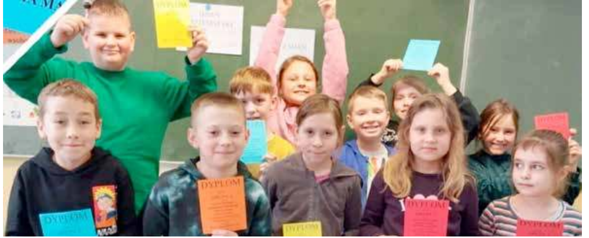
Dzień Matematyki w klasie 2a był pełen radości, śmiechu i nauki