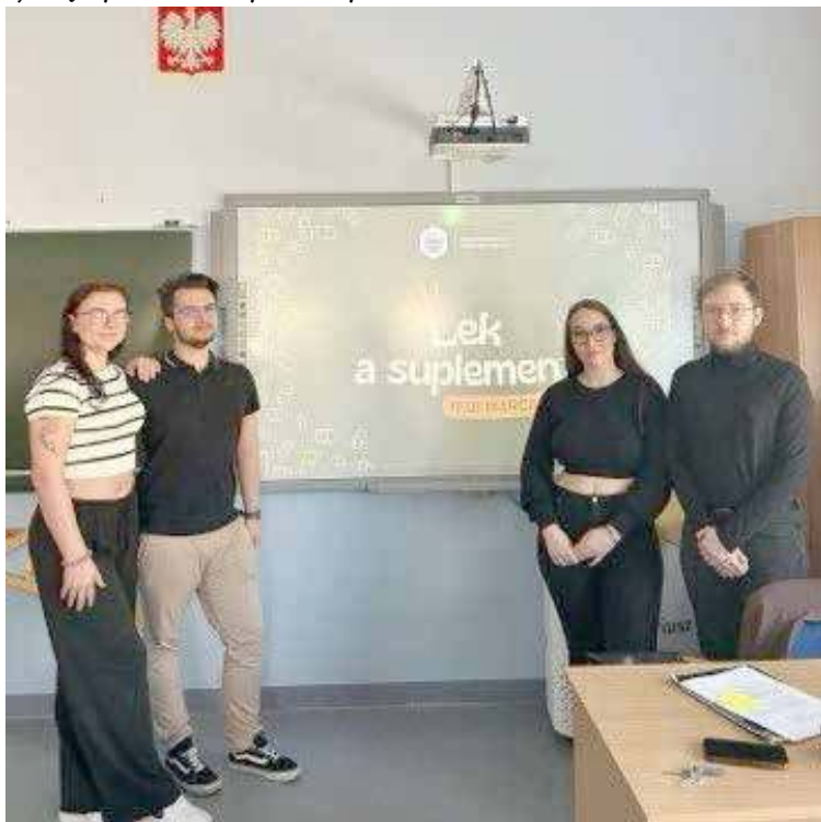
Prelekcja w wykonaniu studentów farmacji łączyła elementy teoretyczne z praktycznymi