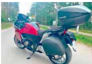
Kierujący prowadził nieoznakowany motocykl i to zwróciło uwagę policjantów

Pomimo surowych konsekwencji grozących za prowadzenie pojazdów w stanie nietrzeźwości wciąż znajdują się kierowcy, którzy lekceważą obowiązujące przepisy narażając siebie i innych uczestników ruchu drogowego na niebezpieczeństwo. Wśród tych nieodpowiedzialnych kierowców znalazł się kierujący motocyklem, który prowadząc bez tablic rejestra-