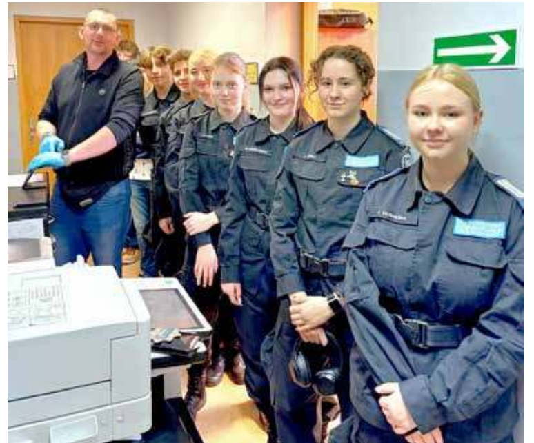
Uczestnicy wydarzenia mieli okazję obserwować, jak policjanci ujawniają i zabezpieczają ślady kryminalistyczne, w tym odciski palców