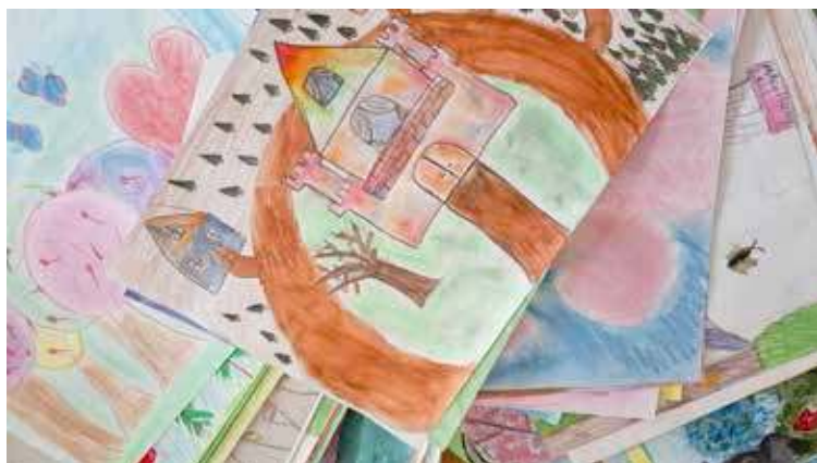
Rozstrzygnięcie konkursu nastąpiło 21 marca, czyli w pierwszym dniu wiosny

Tegoroczna edycja cieszyła się wielkim powodzeniem wśród przedszkolaków i uczniów szkół podstawowych w wieku od 5 lat do 10 lat. Na konkurs wpłynęło