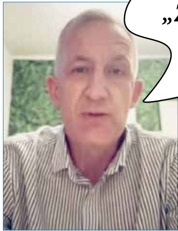
Moment w którym burmistrz wypowiada inwektywę wobec obywateli o treści jak w dymku

ktos, gdzie napisał, że kandydatka na skarbnik dotychczas pracowała jako „zwykła“ księgową (czyli, że nie była główną księgową zatem nie piastowała stanowiska kierowniczego), zwykłą księgową w UM w Dobrej, gdzie zresztą burmistrz też przez lata był „zwykłym“ urzędnikiem - to też pewnie hejt bo przecież był urzędnikiem niezwykłym..