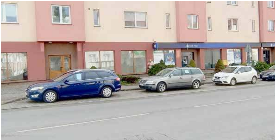
Połowa z miejsc na parkingu została zajęta przez właścicieli aut przeznaczonych sprzedaż