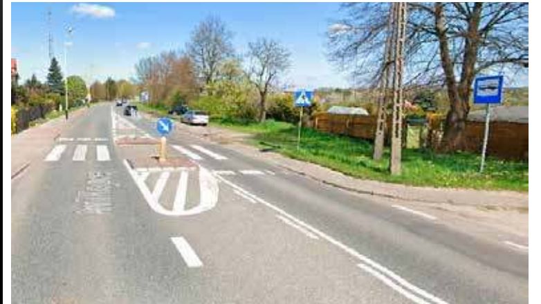
Nowa zatoka autobusowa projektowana jest niedaleko skrzyżowania z ul. T. Roosevelta

W planie budowy projektowanej ścieżki pieszo-rowerowej do Wojcieszyna jest nie tylko pas ruchu. To także szansa na budowę nowej zatoki autobusowej i tym samym oznakowanie dodatkowych pełnoprawnych miejsc postojowych dla samochodów na wysokości wejścia na teren ogrodów działkowych na ul. Armii Krajowej.