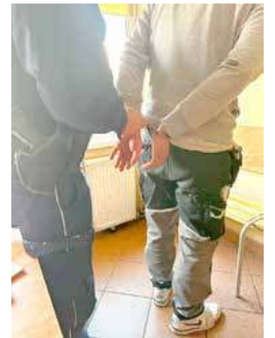
Mężczyzna został zatrzymany, a za popełnione przestępstwa odpowie przed Sądem

się prowadzić pojazd pod wpływem narkotyków. Tak rażąca liczba wskazuje, że jest to poważny problem, a funkcjonariusze konsekwentnie działają w celu zapewnienia bezpieczeństwa na drogach powiatu.